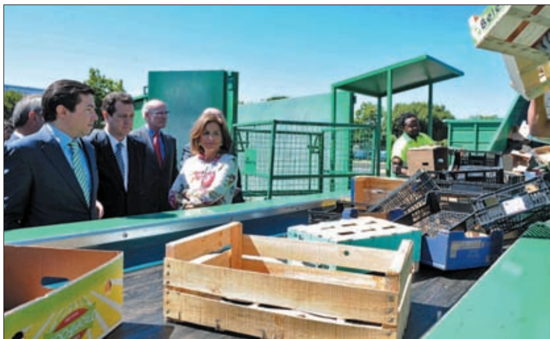
La alcaldesa de Madrid, en el complejo alimentario situado en el distrito de Puente de Vallecas

Según denuncia la PAH en un comunicado, "este anuncio pone de manifiesto, una vez más, que la connivencia de las entidades bancarias y el sistema judicial y la inacción de unas administraciones públicas centradas en aplicar recortes para cumplir con los 'mandamientos' de los mercados financieros está poniendo en entredicho el ejercicio de derechos humanos fundamentales en nuestro país. La vecina de la calle de la Imagen que iba a ser desahuciada mañana, sale de cuentas precisamente mañana", señalan. Del mismo modo, la PAH explica que "lamentablemente, historias como ésta se esconden detrás de todos y cada uno de los desahucios a los que hacen referencia las frías cifras que periódicamente da a conocer el Consejero General del Poder Judicial y que, hasta ahora, no han merecido la mínima atención de los poderes públicos" concluye.