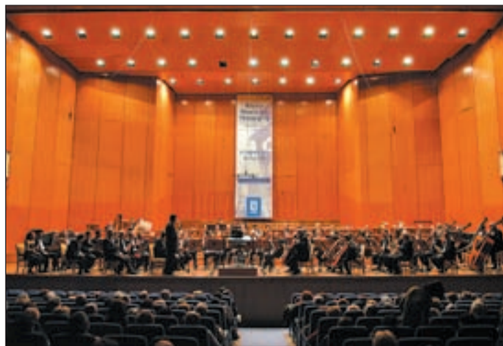
Banda Sinfónica Municipal de Madrid

El programa es muy castizo, ya que recrea la música más tradicional y representativa de la cultura madrileña, como chotis, pasodobles, boleros o zarzuelas. Pero además, su amplio repertorio se completa con obras escritas específicamente para ella, así como por otras piezas transcritas por los excelentes músicos que han formado parte del conjunto. Esta gran variedad es posible gracias a que esta banda in-