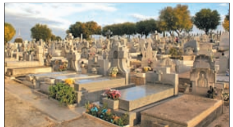
Uno de los espacios del cementerio de La Almudena

Por otro lado, critican el hecho de que la Junta Municipal de Ciudad Lineal rechazara hace varios meses una proposición que instaba a realizar las gestiones pertinentes para procurar la retirada de dichos símbolos.