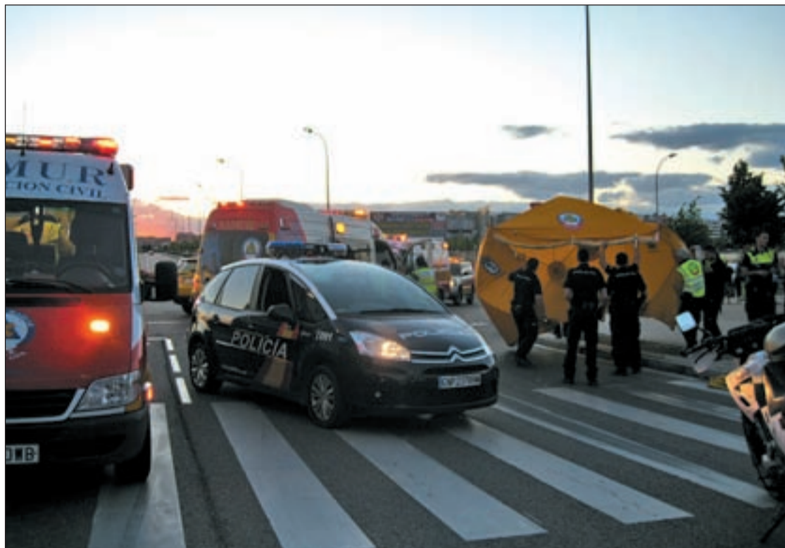
Una imagen del atropello acaecido entre la avenida del Mayorazgo y la calle de Villamanta.

La circunstancia denunciada por los residentes, llevó a los grupos municipales de UPyD y socialista del distrito a elevar esta preocupación al Pleno de la Junta de Villa de Vallecas de julio, en forma de proposición y pregunta, respectivamente. La formación magenta solicitó la realización de un estudio de cara a la puesta en marcha en el menor plazo posible de las pertinentes soluciones. En la misma línea, se manifestó el PSOE. Su