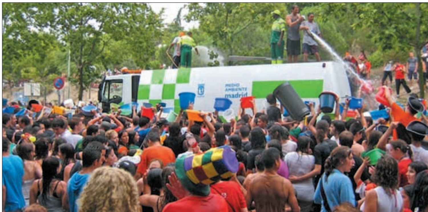
Gente mojada durante la celebración de la Batalla Naval