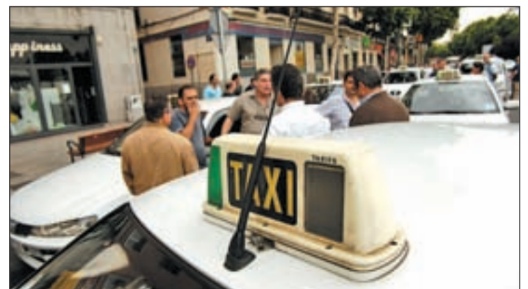
Taxis en la ciudad de Madrid GENTE

una duración de 24 horas. En Madrid, se convocan manifestaciones para el 27 de julio porque en agosto trabaja un menor número de taxistas en la capital. El Ejecutivo pretende liberalizar el sector de los Vehículos de Arrendamiento con Conductor (VTC), gremio que sólo cuenta con un vehículo por cada 30 taxis.