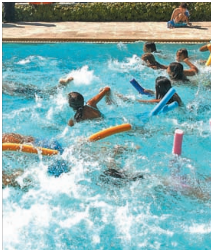
Los juegos acuáticos son uno de los platos fuertes del programa

La colaboración entre ambas partes, según fuentes municipales, se ha articulado para el presente ejercicio a través de la concesión de una subvención nominativa a esta entidad sin ánimo de lucro, por importe de 29.616 euros, que la Junta de Gobierno del Ayuntamiento de Madrid aprobó el pasado 4 de julio, para realizar de este campamento urbano de verano como proyecto de ocio donde todos participan en condiciones de igualdad.