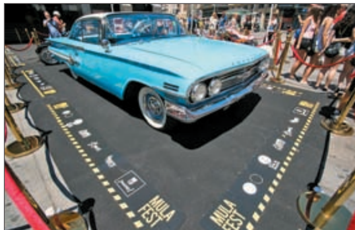
Exhibición de un vehículo antiguo en la Plaza de Callao