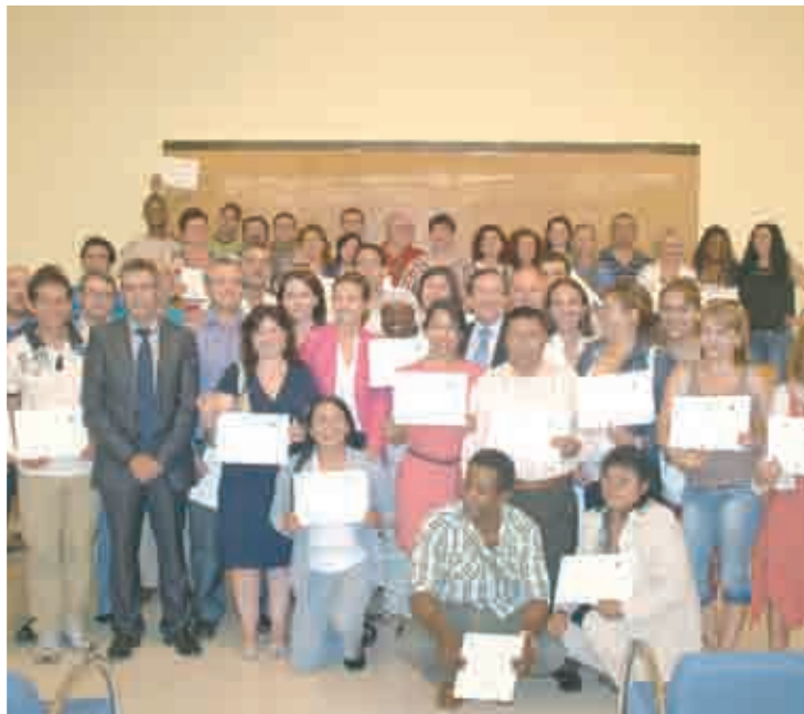
Entrega de diplomas en el Salón de actos del Ayuntamiento.

Se han impartido seis cursos, clasificados en tres programas, además de ofrecerse un Servicio de Orientación que ha atendido a 817 personas. Gamarra destacó "la importancia de la formación y la orientación a la hora de la búsqueda activa y obtención de un empleo" y la labor de las administraciones en el apoyo a la capacitación de los desempleados en momentos tan críticos.