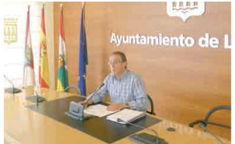
Ángel Sáinz Yangüela, concejal de Movilidad y Transportes.