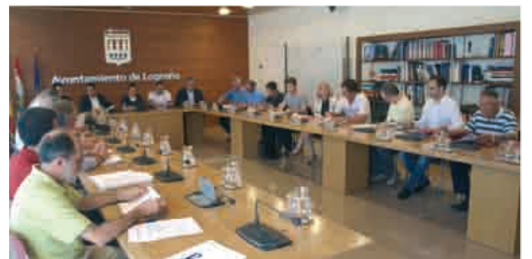
Integrantes de la comisión técnica.

rotonda del Noveno Centenario. La etapa contará con siete pasos por la línea de meta antes de la final y ocho vueltas al circuito de 21 kilómetros. Un recorrido que garantiza el espectáculo deportivo en las calles de la ciudad.