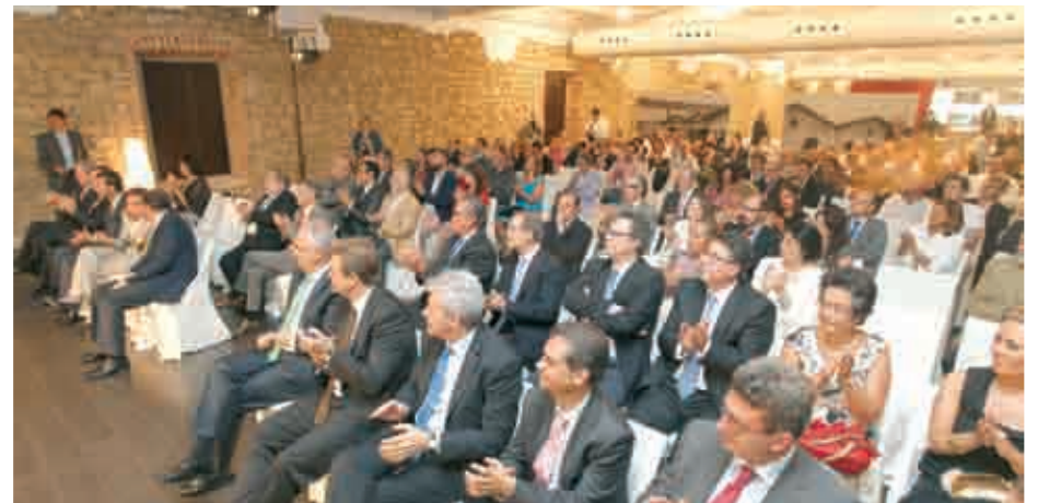
Asistentes al acto en Bodegas Franco-Españolas.