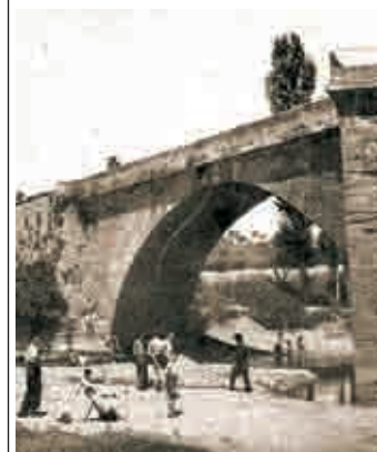
Bañistas en “Puentemadre”. 1940

Leía el otro día en ‘La Ilustración de Logroño’, revista editada en nuestra ciudad en el siglo XIX, que con fecha de 31 de julio de 1886 y en su crónica local rezaba algo verdaderamente curioso: “Durante los primeros días de la quincena actual, la temperatura que alcanzamos en Logroño fue verdaderamente extraordinaria. Hubo días en que la asfixia era inminente. Subió el termómetro como si fuese un globo aerostático. Después, por fortuna, un viento norte refrescó la atmósfera hasta el extremo de que la noche del 23 hubo necesidad de recurrir a los gabanes de invierno”. Como ven, esto de las altas temperaturas durante unos breves días en nuestra ciudad no es nuevo, casi todos los años hacia el mes de julio o primera quincena de agosto, hace un calor asfixiante, que no suele durar muchos días. Y luego se hace bueno el refrán de que: “en agosto frío en el rostro”. En Logroño siempre han existido esos pocos días de calor asfixiante que dejan paso a unas temperaturas más primaverales u otoñales según como se mire. Había otro viejo refrán en esta ciudad que decía: “en Logroño hay dos estaciones: el invierno y la estación del Norte”, en referencia a la estación que existió en la Gran Vía y que, por cierto, nunca he llegado a comprender por qué se llamaba ‘del norte’ si estaba al sur de la ciudad. En fin, que para cuando nos queramos dar cuenta ya estamos en las fiestas de San Mateo y de ahí a la Navidad ‘no hay ná’ y luego otra vez vuelta a empezar.