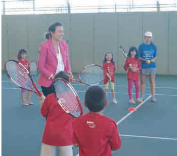
La alcaldesa de Logroño visitó el pasado jueves a los participantes.

Con el objetivo de educarles en el tiempo libre a través de la práctica deportiva, las actividades se están desarrollando tanto en el polideportivo municipal de Lobete como en el Complejo de Las Norias. Estas instalaciones muni-