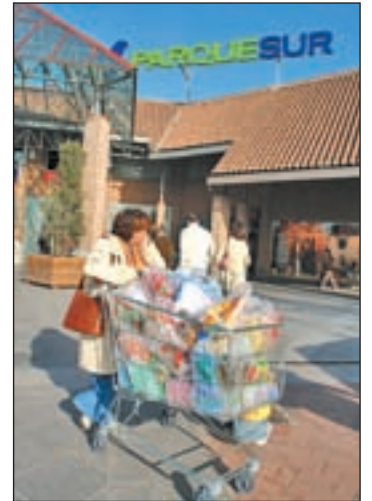
Entrada de Parquesur