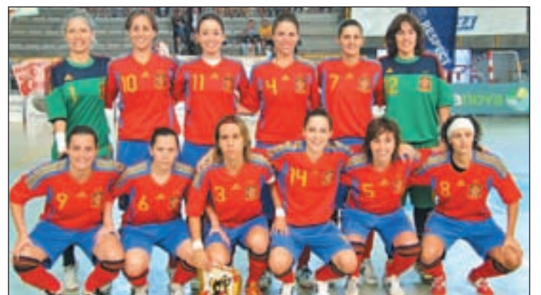
El equipo alcorconero contará con una internacional en sus filas