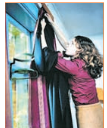
Contarlo todo sin saber nada