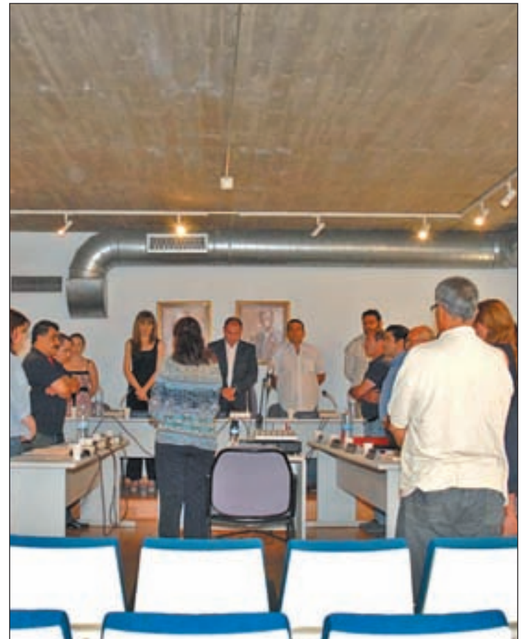
El pleno de Valdemoro guardó un minuto de silencio