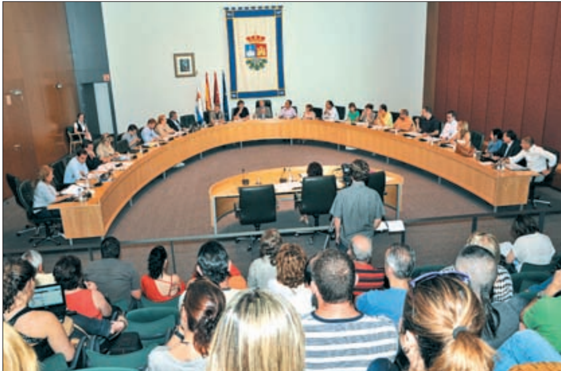
Imagen de un pleno celebrado en Fuenlabrada