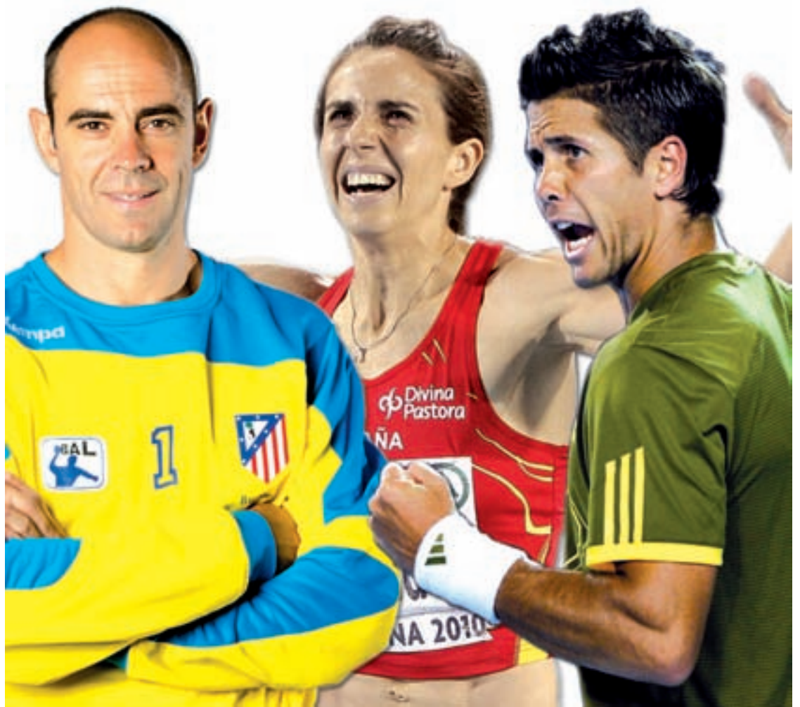
Balonmano, tenis y atletismo, tres de las esperanzas de los aficionados españoles

Otro de los deportistas madrileños de mayor popularidad que participará en Londres es Fernando Verdasco. El tenista demostró este año en el Masters 1000 de Madrid que puede ganar a cualquier rival en una tarde de inspiración y además cuenta con la experiencia que supone el haber jugado numerosas eliminatorias de la Copa Davis. Sin Rafa Nadal, el equipo español parte con menos opciones de volverse de Londres con una medalla, pero la superficie de hierba es algo que no le va mal al juego de Verdasco, ni tampoco al de otro jugador muy emparentado con la