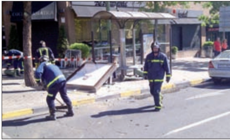
Accidente en Gran Vía de Hortaleza AYUNTAMIENTO DE MADRID