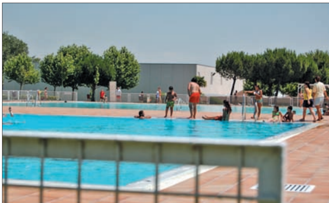
Una de las piscinas de un polideportivo municipal de la capital

Finalmente, los policías procedieron a la entrada y registro de ambos domicilios y arrestaron a los 'camellos', que han pasado a disposición judicial.