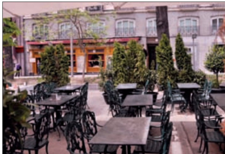
La terraza del Café Gijón, en el Paseo de Recoletos

El decreto de la Junta Municipal de Centro ha dispuesto conceder a este concesionario el uso privativo del suelo, conservación, mejora y explotación del quiosco permanente de bebidas con terraza en terrenos del Paseo de Recoletos, frente al número 21. El canon fijo anual que pagará Endre Santa Engracia asciende a 144.00 euros. Los actuales responsables de la terraza habían ofrecido unos 70.000 euros. El plazo es de 15 años, prorrogables, pero nunca más de 75 años.