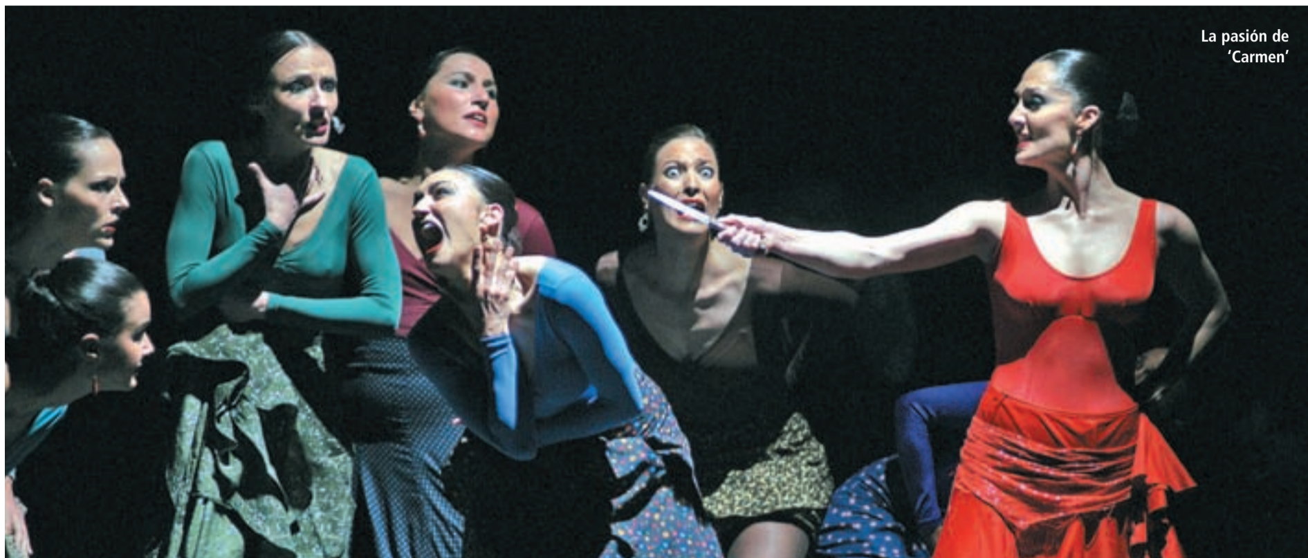
La pasión de 'Carmen'