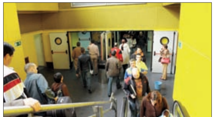
Intercambiador de Avenida de América GENTE

En cuanto a la duración de estas medidas, está previsto que los cortes se mantengan hasta el próximo día 31 de julio.