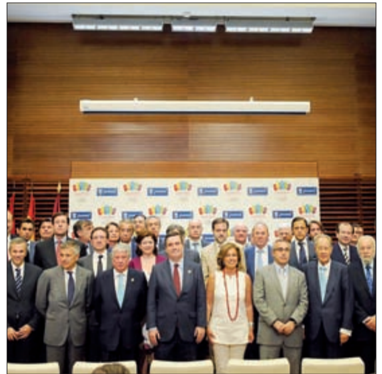
Foto de familia de los empresarios que apoyan Madrid 2020

Otro de los objetivos de esta colaboración es construir un marco de cooperación duradera en el tiempo entre las empresas patrocinadoras, Madrid 2020 y la propia ciudad. "Los Juegos