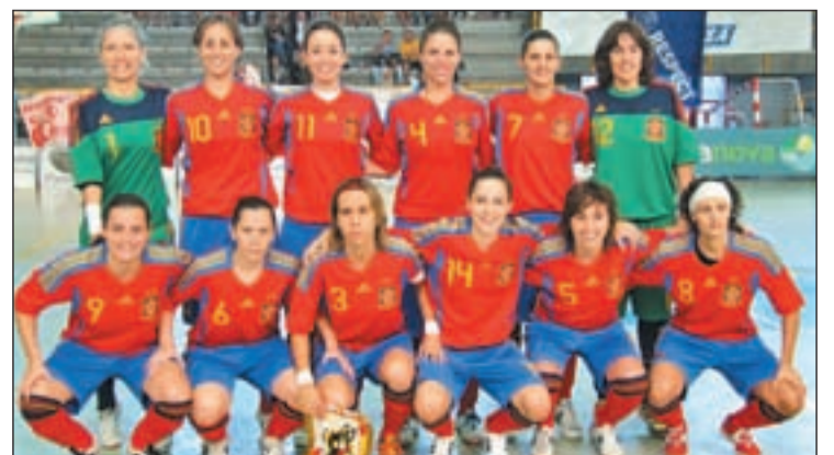
El equipo alcorconero contará con una internacional en sus filas