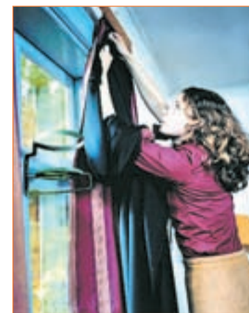
Contarlo todo sin saber nada