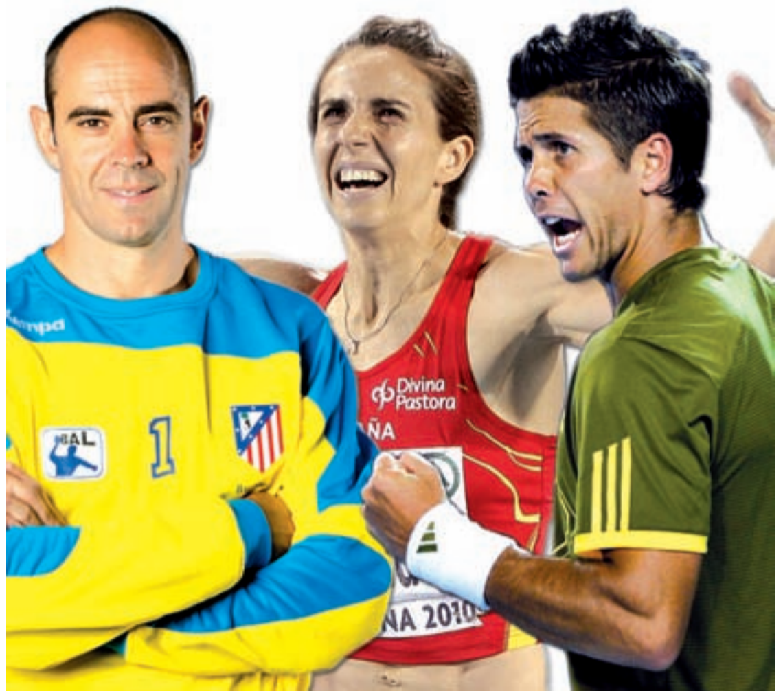
Balonmano, tenis y atletismo, tres de las esperanzas de los aficionados españoles

Otro de los deportistas madrileños de mayor popularidad que participará en Londres es Fernando Verdasco. El tenista demostró este año en el Masters 1000 de Madrid que puede ganar a cualquier rival en una tarde de inspiración y además cuenta con la experiencia que supone el haber jugado numerosas eliminatorias de la Copa Davis. Sin Rafa Nadal, el equipo español parte con menos opciones de volverse de Londres con una medalla, pero la superficie de hierba es algo que no le va mal al juego de Verdasco, ni tampoco al de otro jugador muy emparentado con la