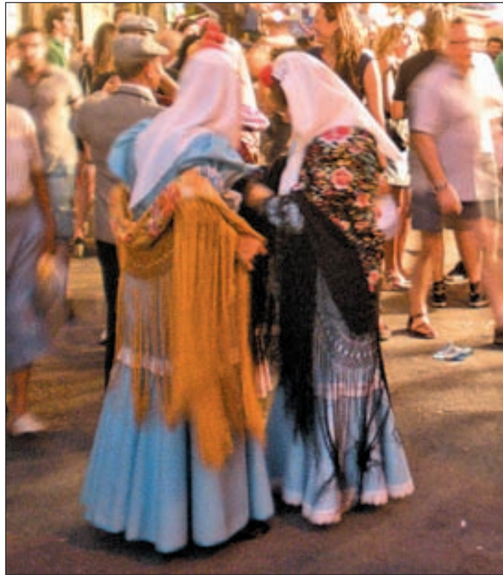
Dos chulapas en la verbena

De este modo, el lunes, los niños serán protagonistas del espectáculo infantil con juegos, cuentos, pintura de caras y regalos. También habrá un concurso de dibujo, con dos modalidades: la primera hasta 8 años y la segunda de 9 a 12. Como no podía ser de otro modo, el mantón es