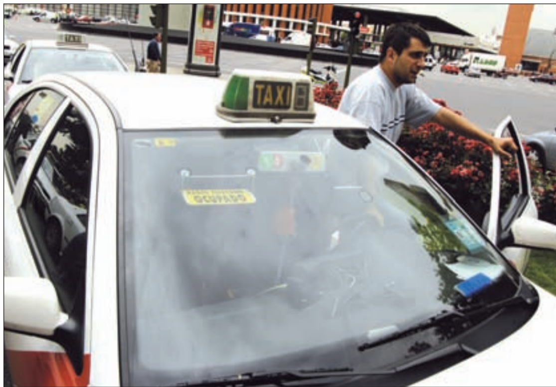
Los taxistas madrileños tendrán un nuevo marco normativo que sustituye al existente en vigor desde 1980

Para fomentar el vehículo 'limpio', el texto establece unos límites de emisiones máximos, tanto de CO 2 (160 gramos/km.) como