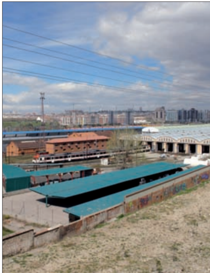
La estación de contenedores de Abroñigal

En material de movilidad, están en estudio alternativas para fomentar estos tipos de aparcamiento. El Ayuntamiento baraja la posibilidad de utilizar espacios del Servicio de Estacionamiento Regulado (SER) con una utilización de baja intensidad para establecer "áreas diferenciadas" que podrían utilizarse por un periodo aproximado de entre seis horas y ocho horas y con un ajuste de precio.