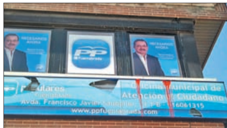
Imagen de los daños ocasionados en la sede del PP en Fuenlabrada

Hechos similares se repitieron el lunes por la mañana en la sede popular en Parla, donde el cartel luminoso fue atacado por el lanzamiento de piedras. Es la quinta vez en los últimos meses en la que el local del PP sufre ataques de este tipo, algo que el partido califica como "cobarde y antidemócrata".