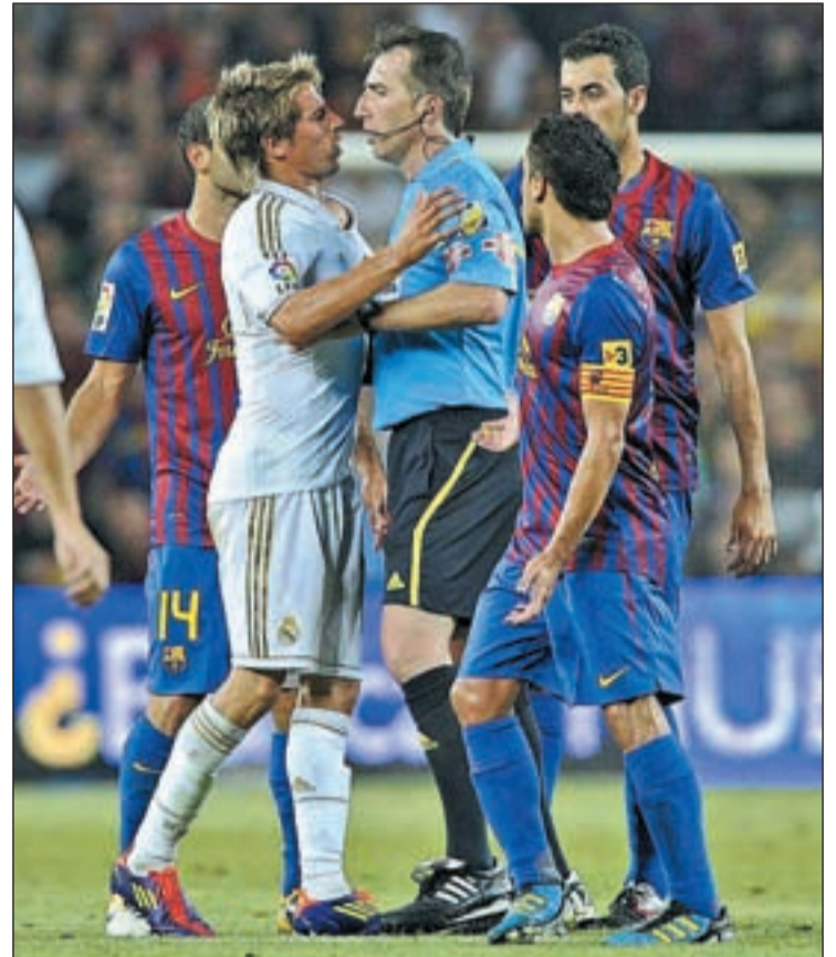
La Supercopa de España dará pie a otros dos 'Clásicos'

Pese a todo, las citas para los aficionados al balompié son más que generosas en agosto. Para abrir boca, el próximo 15 de agosto está previsto que la selección española vuelva a escena para jugar un partido amistoso en Puerto Rico. Ese encuentro ha trastocado los planes de varios clubes durante la pretemporada e incluso ha obligado a cambiar de fechas de la Supercopa de España. Tres días después de este viaje de la 'Roja' echará a andar una nueva edición del campeonato de Liga, con una primera jornada en la que el Real Madrid recibirá al Valencia, el Rayo Vallecano hará lo propio con el Granada, mientras que Atlético de Madrid y Getafe arrancarán el torneo rin-