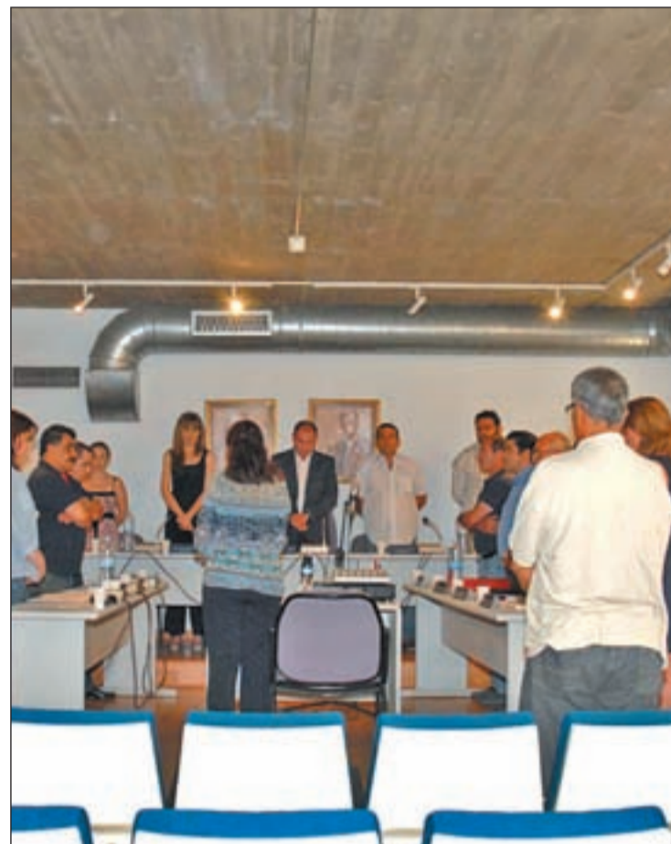
El pleno de Valdemoro guardó un minuto de silencio