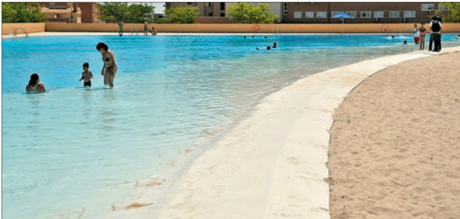
La playa de Parla es una de las playas de Madrid en la que cientos de ciudadanos pasan el verano