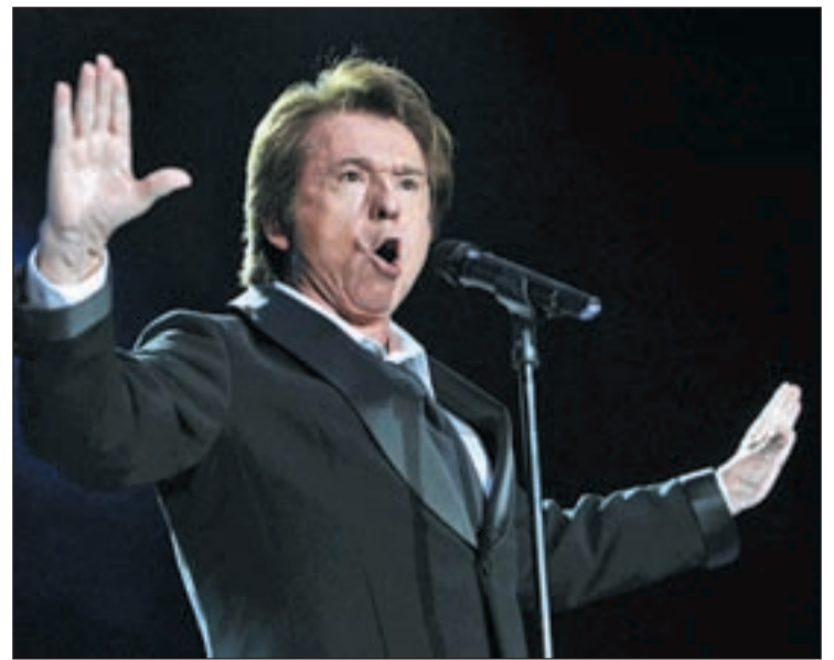
Todos los conciertos serán gratuitos, a excepción de Raphael

El programa, que llegará a los vecinos en agosto, recoge citas infantiles como el concierto de Parchís (día 5), el Festival de Teatro de Calle (del 4 al 7), y eventos deportivos como una fiesta ‘Master Class’ Fitness, un Duatlón nocturno y la Milla urbana, que se recupera. La clausura contará con un novedoso espectáculo audiopiromusical.