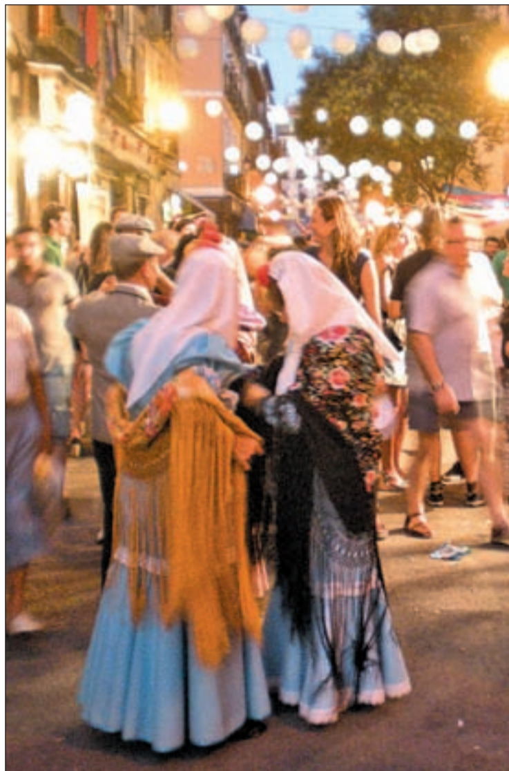
Dos chulapas en la verbena

Chotis, pasodobles, mantones y chulapos son la esencia de las fiestas de la Paloma en Madrid