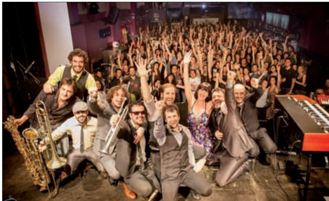
El grupo musical Freedonia actuará este viernes 27 en Getafe