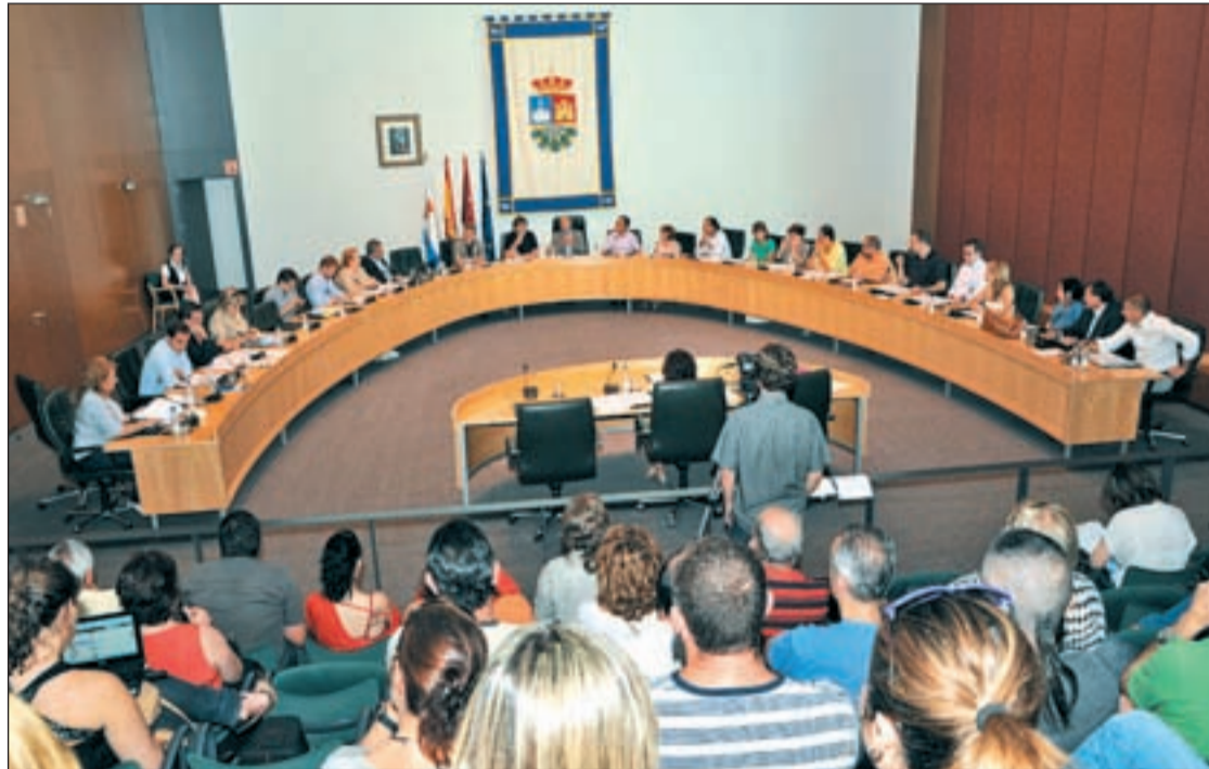
Imagen de un pleno celebrado en Fuenlabrada