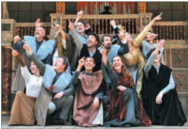
ENRIQUE VIII Una obra basada en uno de los personajes más ilustres de toda la Historia en un contexto trepidante, lleno de cambios, conspiraciones, investigaciones y juegos políticos aderezados con una gran carga dramática.

Para comenzar, la Red de Teatros de la Comunidad llevará a los municipios un total de 15 re-