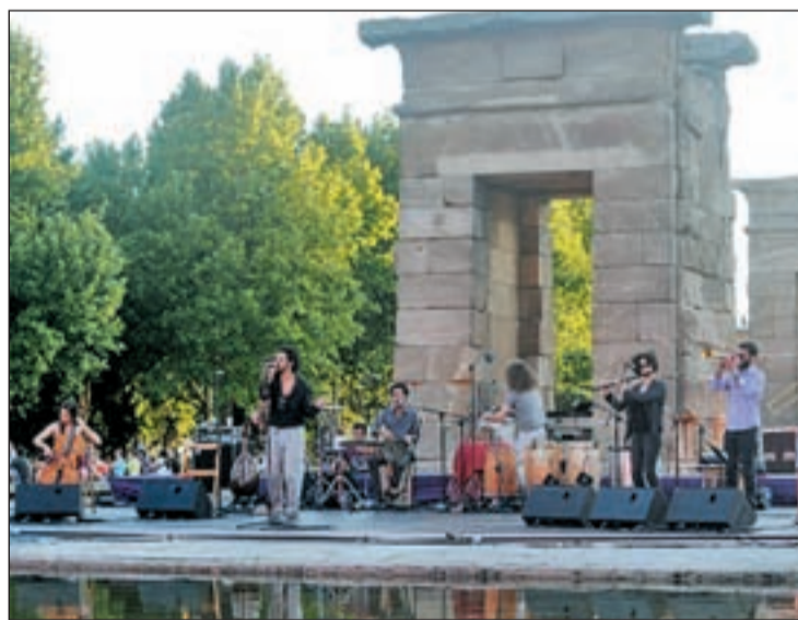
LUGARES EMBLEMÁTICOS COMO ESCENARIO El Templo de Debod y la Plaza de Oriente son algunos de los lugares más representativos de la ciudad donde tuvieron lugar varios espectáculos de la edición de 2011.

Fringe acoge principalmente artes escénicas, pero también deja tiempo para los debates, ac-