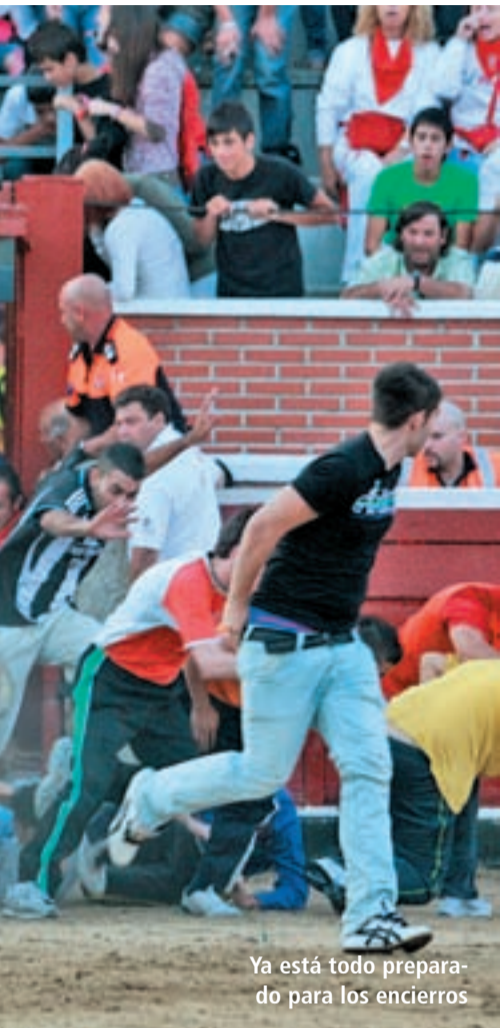
Ya está todo preparado para los encierros