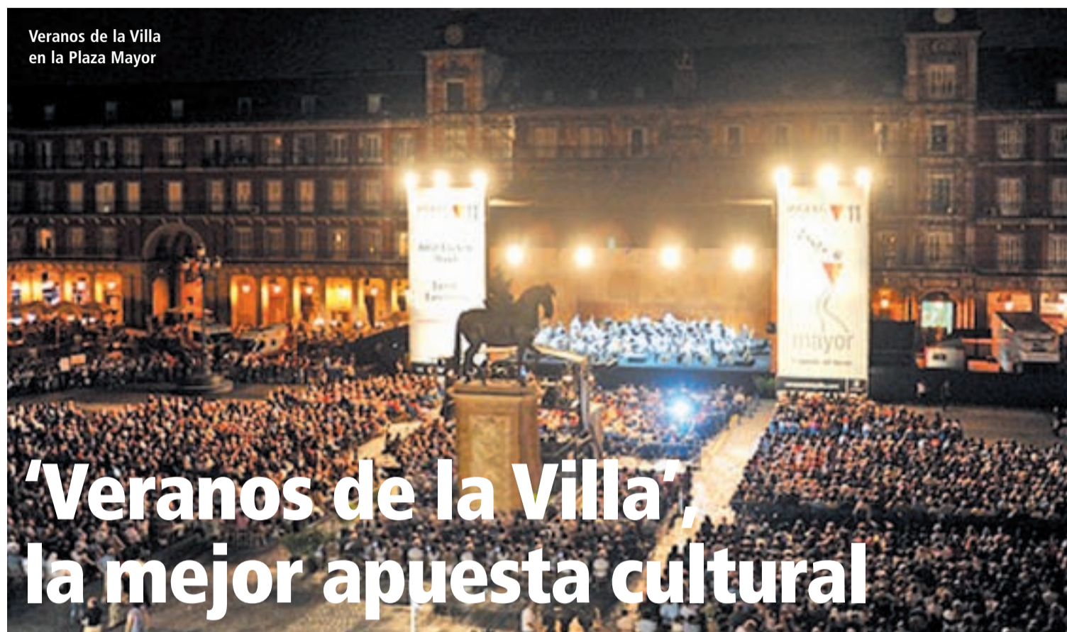
Veranos de la Villa en la Plaza Mayor