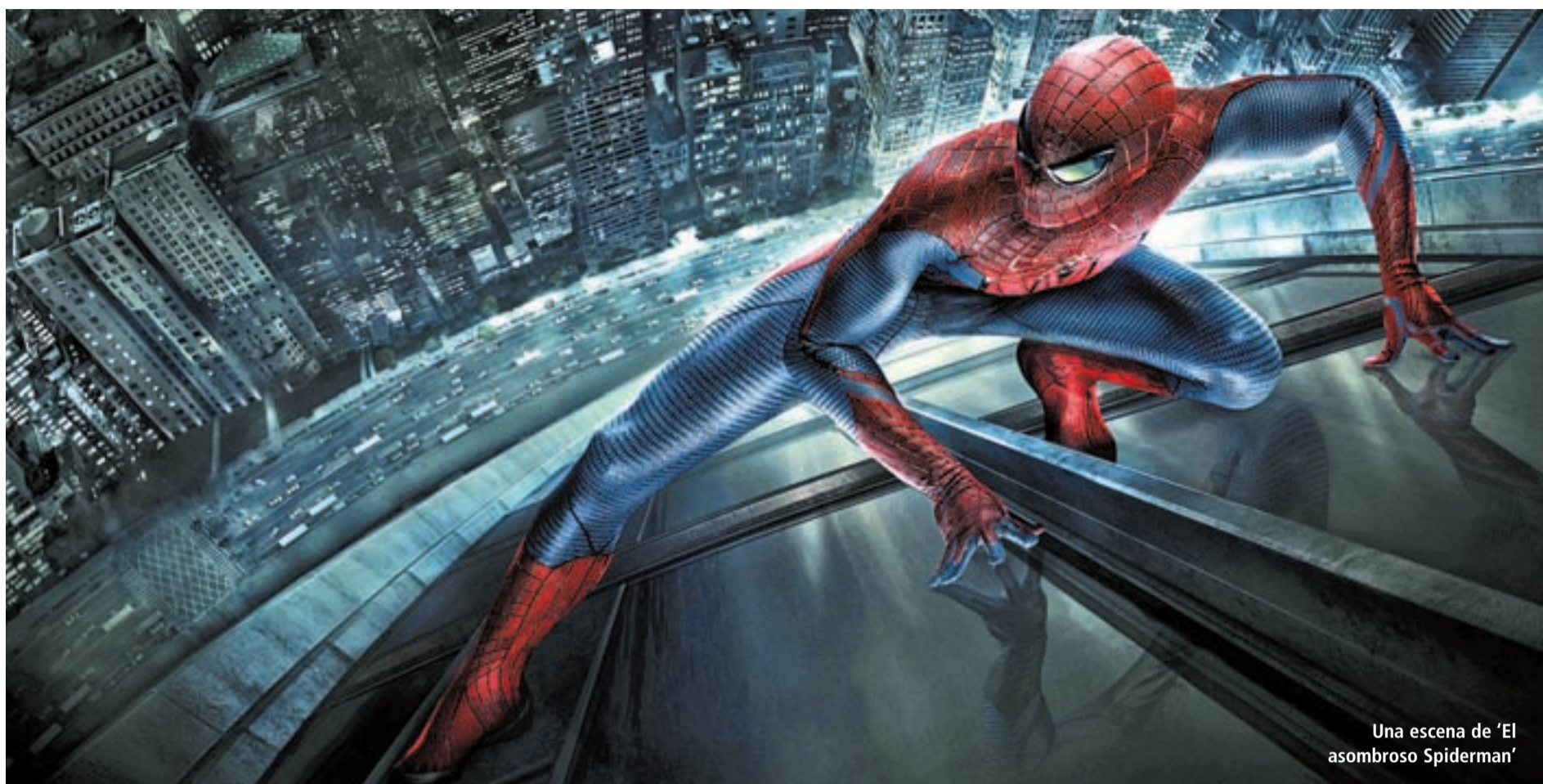
Una escena de 'El asombroso Spiderman'