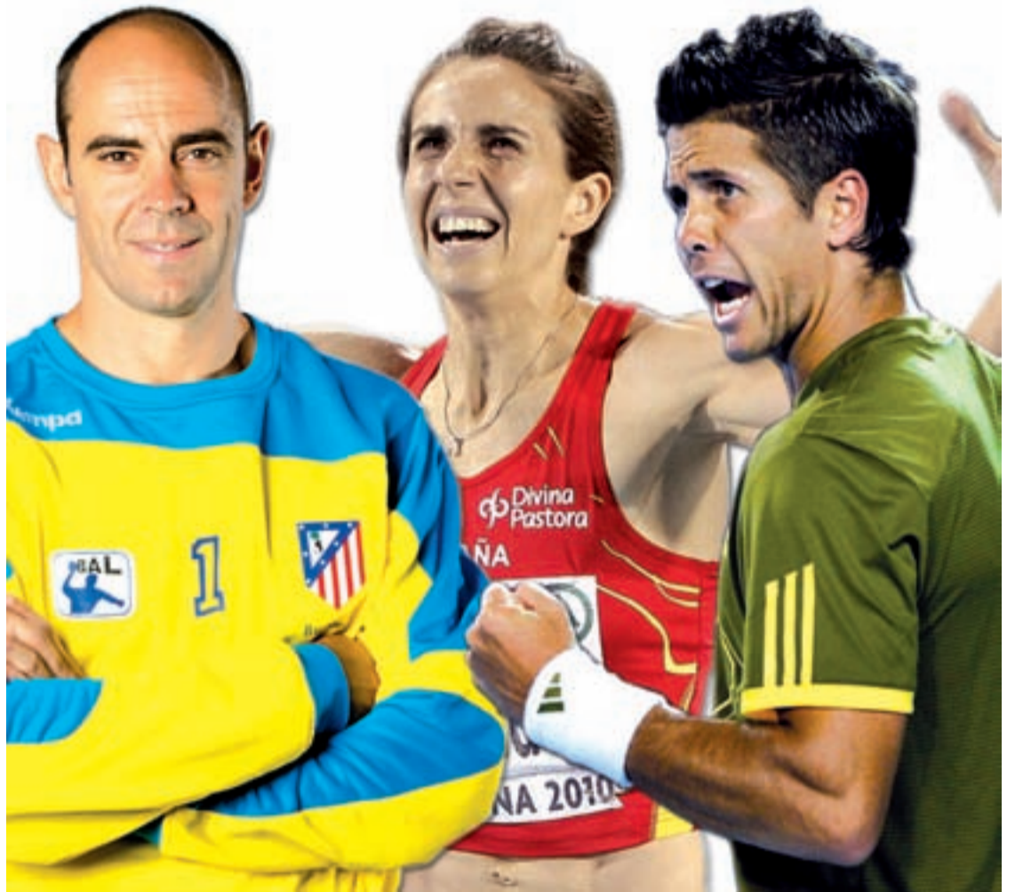
Balonmano, tenis y atletismo, tres de las esperanzas de los aficionados españoles

Otro de los deportistas madrileños de mayor popularidad que participará en Londres es Fernando Verdasco. El tenista demostró este año en el Masters 1000 de Madrid que puede ganar a cualquier rival en una tarde de inspiración y además cuenta con la experiencia que supone el haber jugado numerosas eliminatorias de la Copa Davis. Sin Rafa Nadal, el equipo español parte con menos opciones de volverse de Londres con una medalla, pero la superficie de hierba es algo que no le va mal al juego de Verdasco, ni tampoco al de otro jugador muy emparentado con la