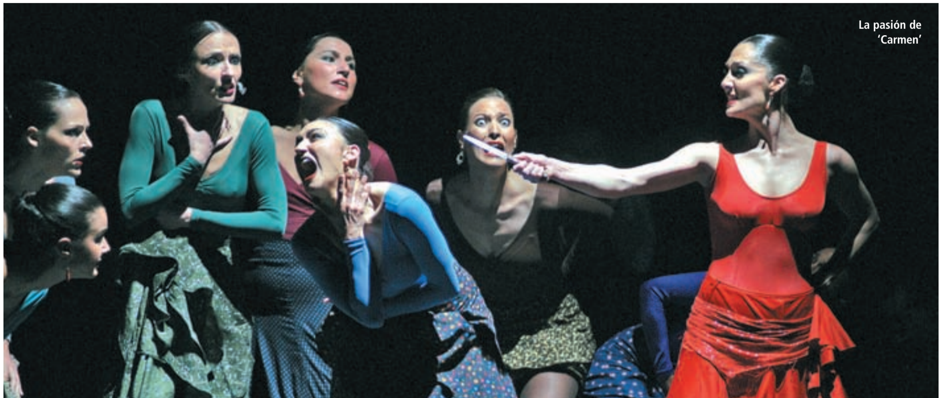
La pasión de 'Carmen'