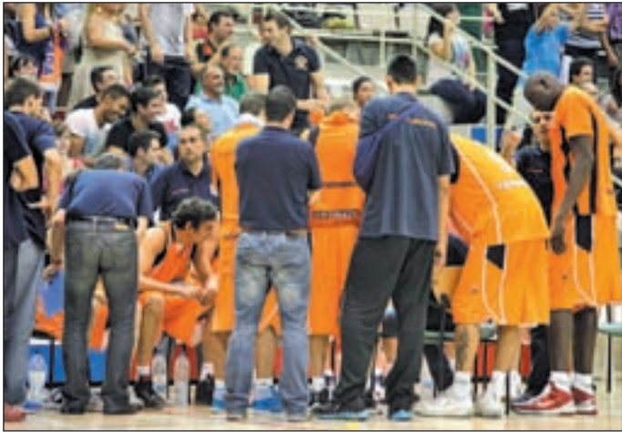
Disconformidad en el seno del club naranja

PROTESTA NO PARTICIPARÁ EN EL TROFEO REGIONAL