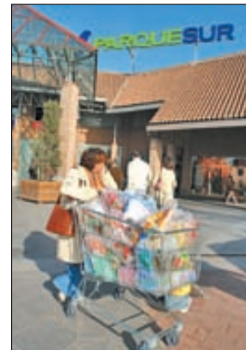
Entrada de Parquesur

Los clientes de Parquesur podrán disfrutar de los más de 200 establecimientos que ofrece el centro, así como de las zonas de ocio y restauración durante los 365 días del año (excepto el 25 de diciembre, 1 y 6 de enero y 1