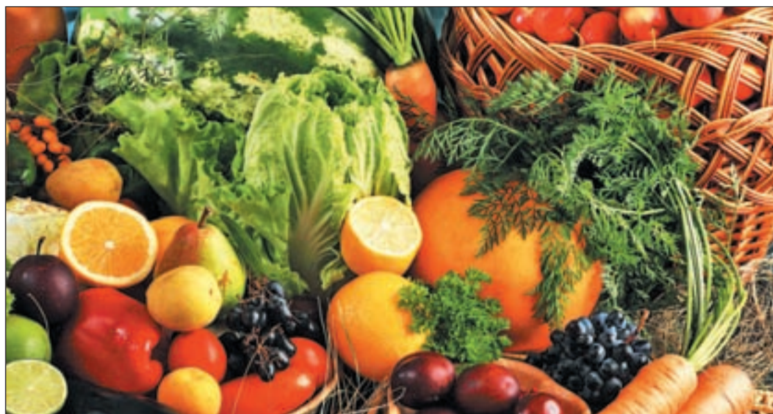
Las frutas y verduras siempre son alimentos recomendados para bajar de peso