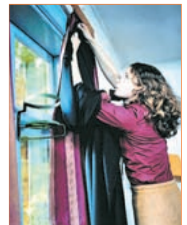
Contarlo todo sin saber nada