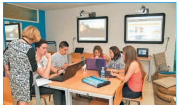
Alumnos navegando por el nuevo portal de la UCJC

Gracias a este portal la UCJC tendrá acceso a una completa base de datos sobre los candidatos que se postulan para las diferentes vacantes.