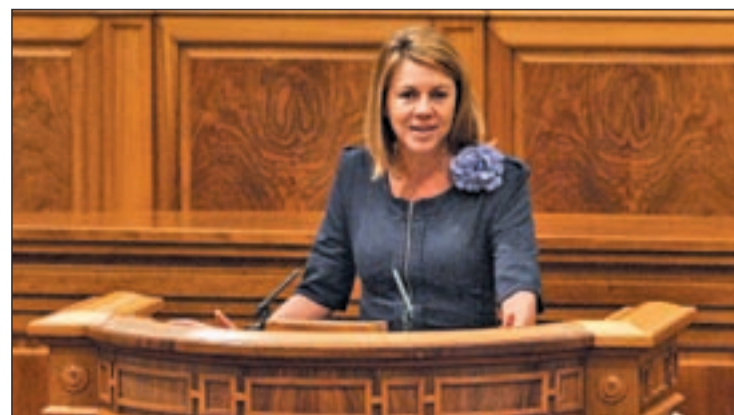
La presidenta de Castilla y La Mancha, María Dolores de Cospedal

de Hacienda que dirige Cristóbal Montoro. El líder de los extremeños ha reconocido que el IVA es un impuesto de "competencia estatal", frente al que se buscarán "líneas de ayudas" en su territorio para poder reducirlo al 13 por ciento. Así, ha aclarado que buscará fórmulas para que nadie se moleste.