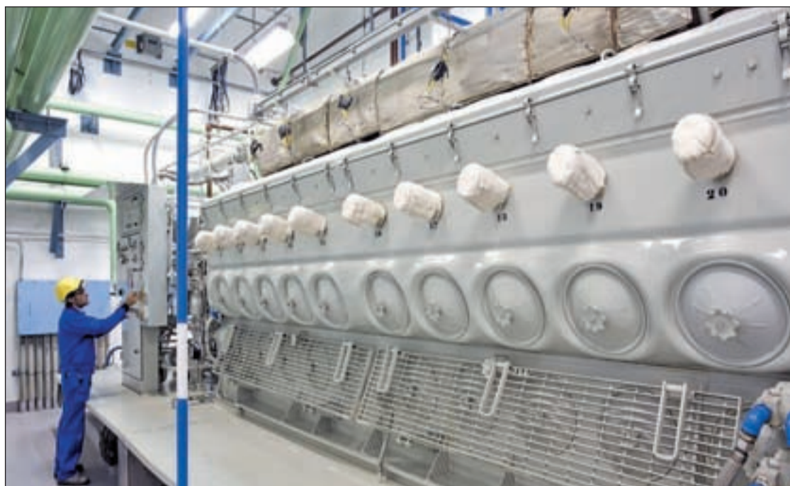
La central nuclear de Santa María de Garoña (Burgos)

La Casa Real ha estrenado nueva página web en la que quieren transmitir a la sociedad española una sensación de continuidad de la Corona. La imagen sitúa a la Infanta Leonor como el futuro de la monarquía española y ofrece una visión de la institución más moderna y transparente.