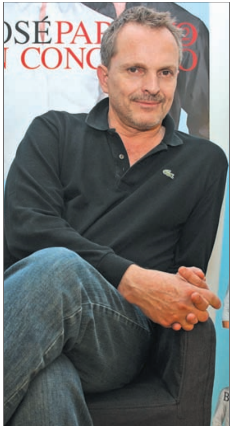
Miguel Bosé durante la entrevista que concedió a GENTE

Haber tenido exactamente, y visto y sentido exactamente lo mis-