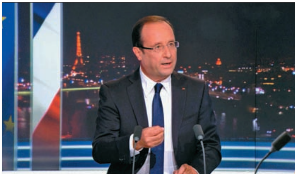
El presidente de Francia, François Hollande

El ajuste se dividirá a partes iguales entre Estado, empresas y hogares. El primero tendrá que aportar 10.000 millones de los presupuestos del año próximo y los segundos deberán hacer números para satisfacer el paquete fiscal que tiene previsto el Ejecutivo. Un conjunto de gravámenes cuya filosofía sea que los más ricos son los que más paguen. “Los más ricos deben demostrar su patriotismo”, recla-