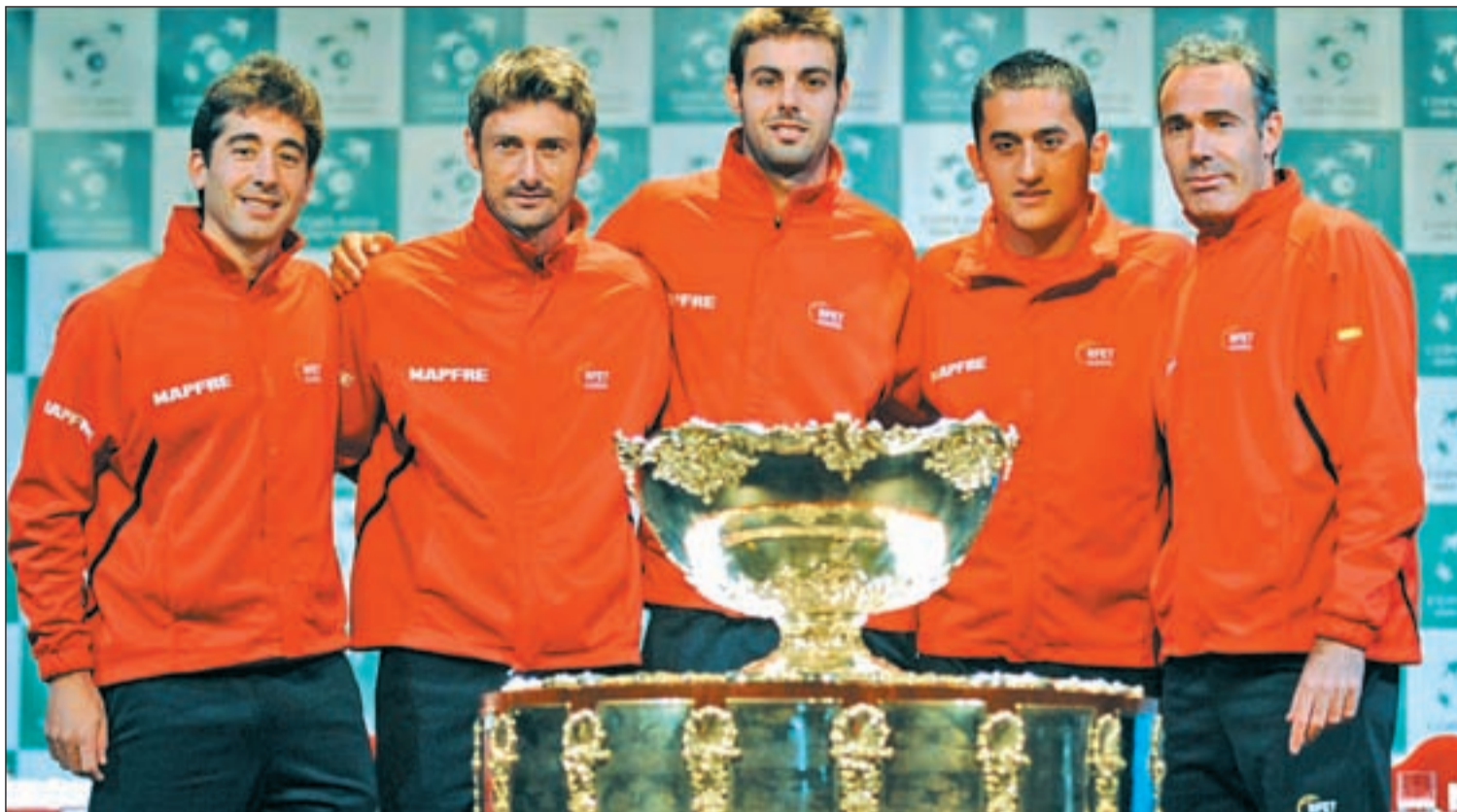
El equipo que capitanea Alex Corretja recibe al combinado de Estados Unidos en Gijón

TENIS ESPAÑA BUSCA EL PASE A SU NOVENA FINAL DE LA COPA DAVIS