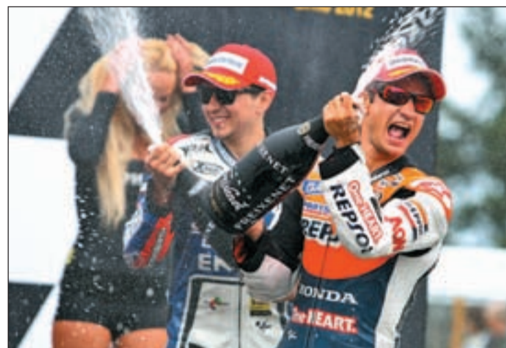
El piloto de Honda se ha impuesto en las dos últimas carreras

Si en semanas anteriores Lorenzo llegaba a las diferentes pruebas con un margen tranquilizador, ahora el piloto de Honda ve cómo Pedrosa tiene la oportunidad de colocarse como líder del campeonato si es capaz de sumar catorce puntos más que él,