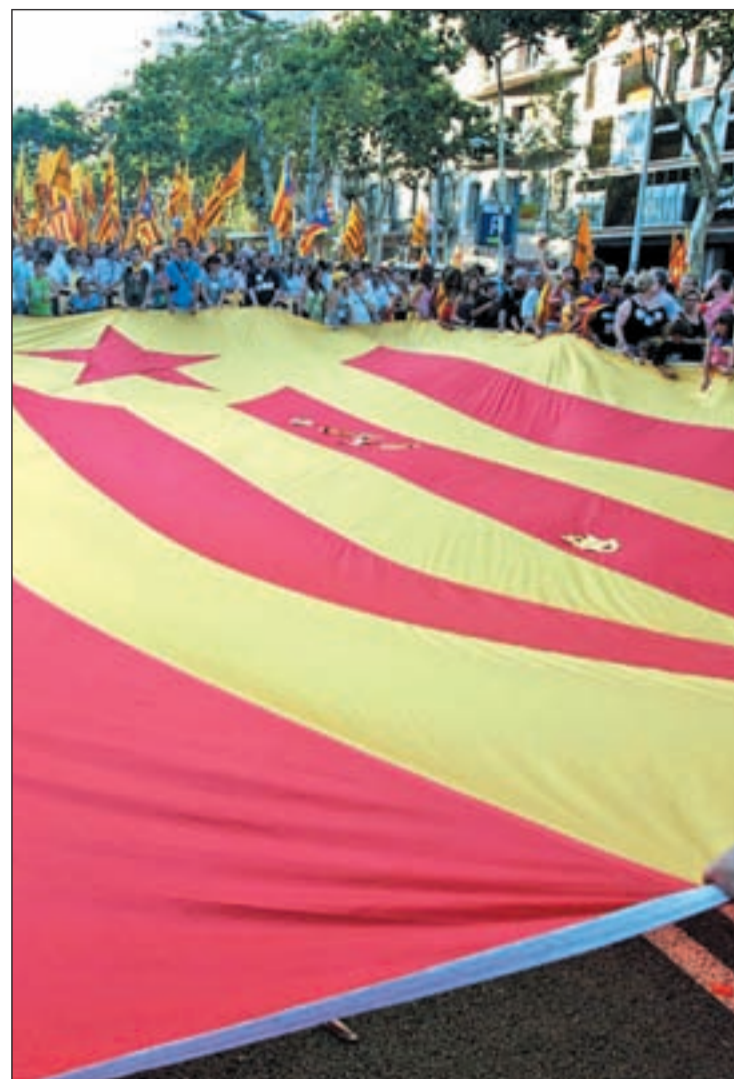
La manifestación recorrió las calles de Barcelona

Después de la resaca dejada por la multitudinaria manifestación, el día después vino marca-