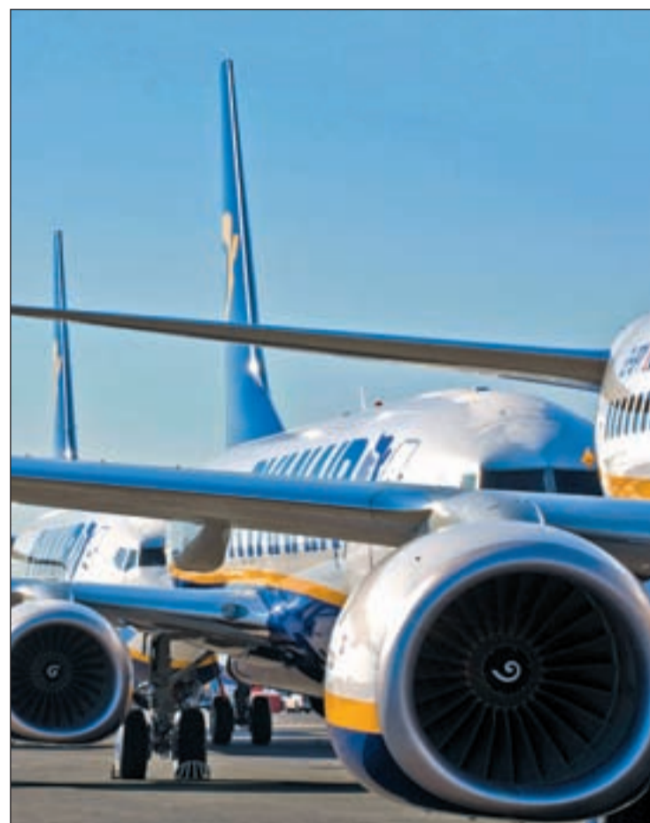
Ryanair sufre varias incidencias en sus vuelos las últimas semanas

Pero Fomento no lo va a tener fácil porque la Unión Europea ya se ha pronunciado al respecto y ha transmitido al Gobierno que las dudas sobre seguridad debe remitirlas al país en el que esté