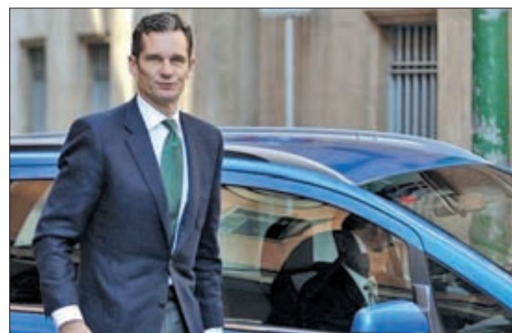
El caso Nóos sigue su curso en la Audiencia Provincial de Palma

Cabe recordar que, en el auto recurrido, el magistrado subrayaba que la aparición de nuevos hechos que pudieran revestir reproche penal "no habrán de causar indefensión" al yerno del Rey Don Juan Carlos, puesto que --aseguraba--, podrá dar su ver-