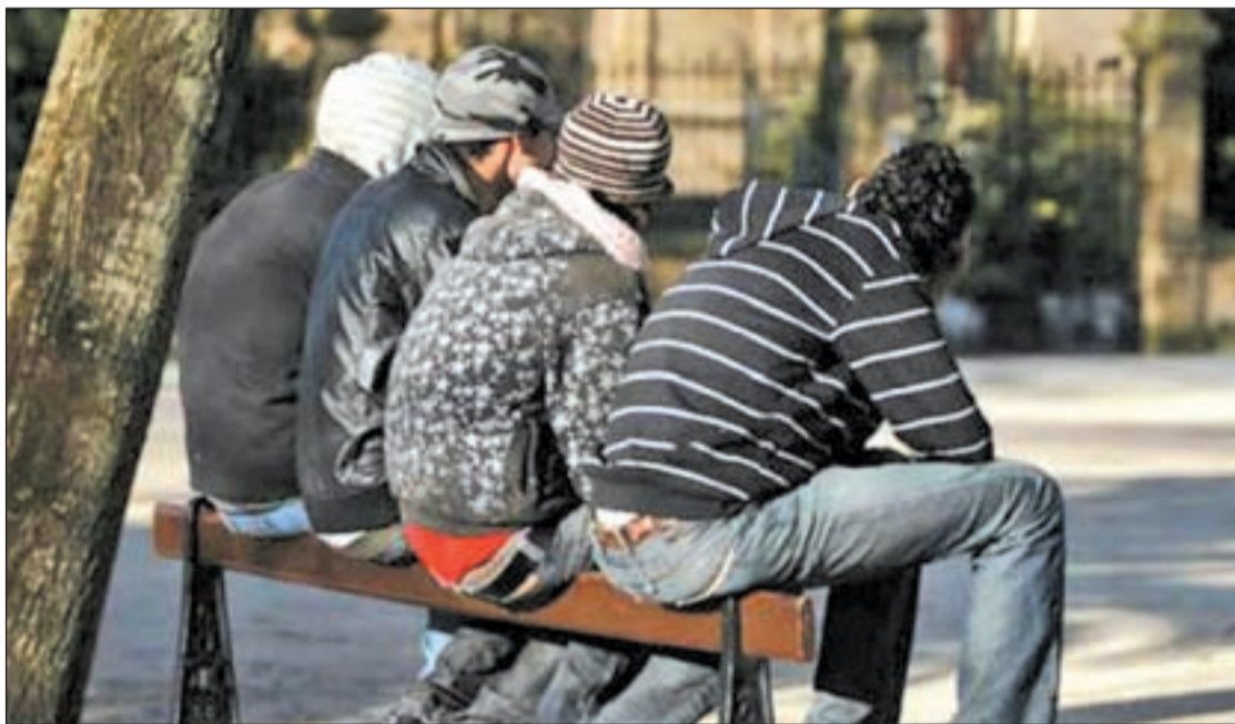
Casi la cuarta parte de los jóvenes ni estudia ni trabaja

Cada uno de estos jóvenes tiene un perfil muy similar. La mayoría de ellos fueron atraídos por las mieles de la construcción y las épocas de bonanza de este sector, abandonado, así, sus es-