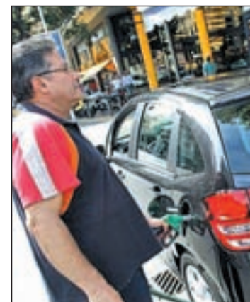
Subida del IPC por el combustible

La OCDE alerta en su informe del riesgo de los recortes que se han producido en la Educación. El aumento de las tasas universitarias o la reducción de las becas hace más difícil el acceso de muchos jóvenes a estudios superiores. "Los países tienen que encontrar el equilibrio entre una ayuda pública adaptada para la educación y la obligación para alumnos y familias de asumir algunos de los costes", reza el documento.