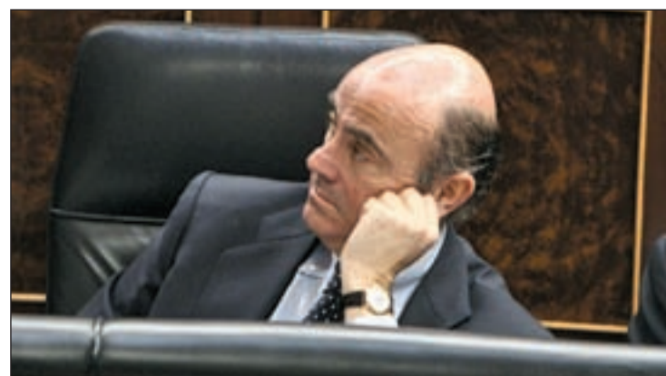
El ministro de Economía en el Congreso

nes sociales”. El titular de Economía considera que “la mayor garantía del Estado del Bienestar es el crecimiento económico y el empleo. Si eso no se consigue lo estaremos poniendo en riesgo”, insistiendo en que “si no vuelve el crecimiento y el empleo, habrá muchos más problemas”.