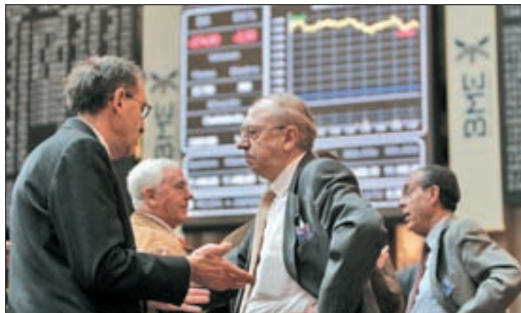
El Gobierno quiere poner cerco a los especuladores

PRESUPUESTOS HABRÁ UNA SUBIDA DE IMPUESTOS