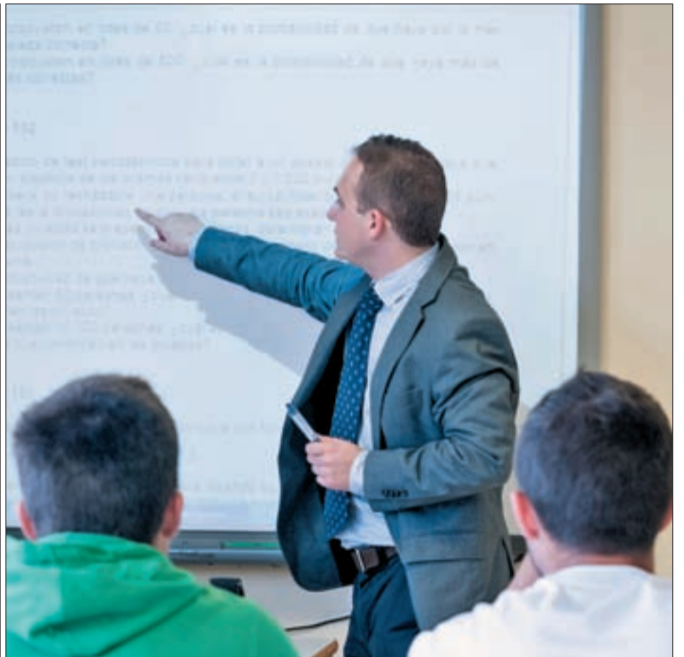
Alumnos y profesorado de la Universidad Camilo José Cela