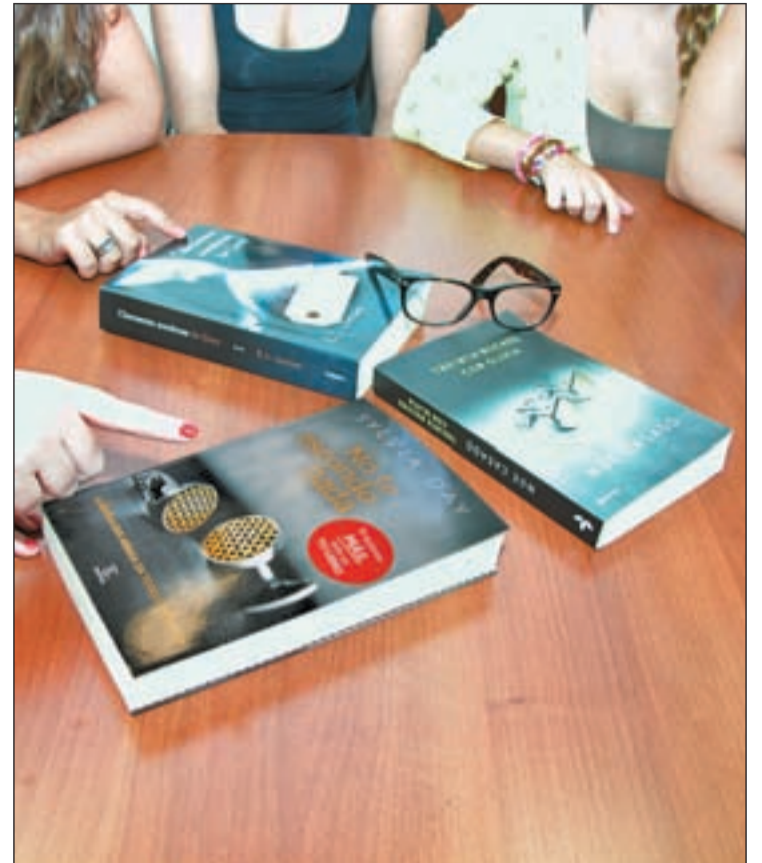
Las mujeres se han volcado en la lectura de estas novelas