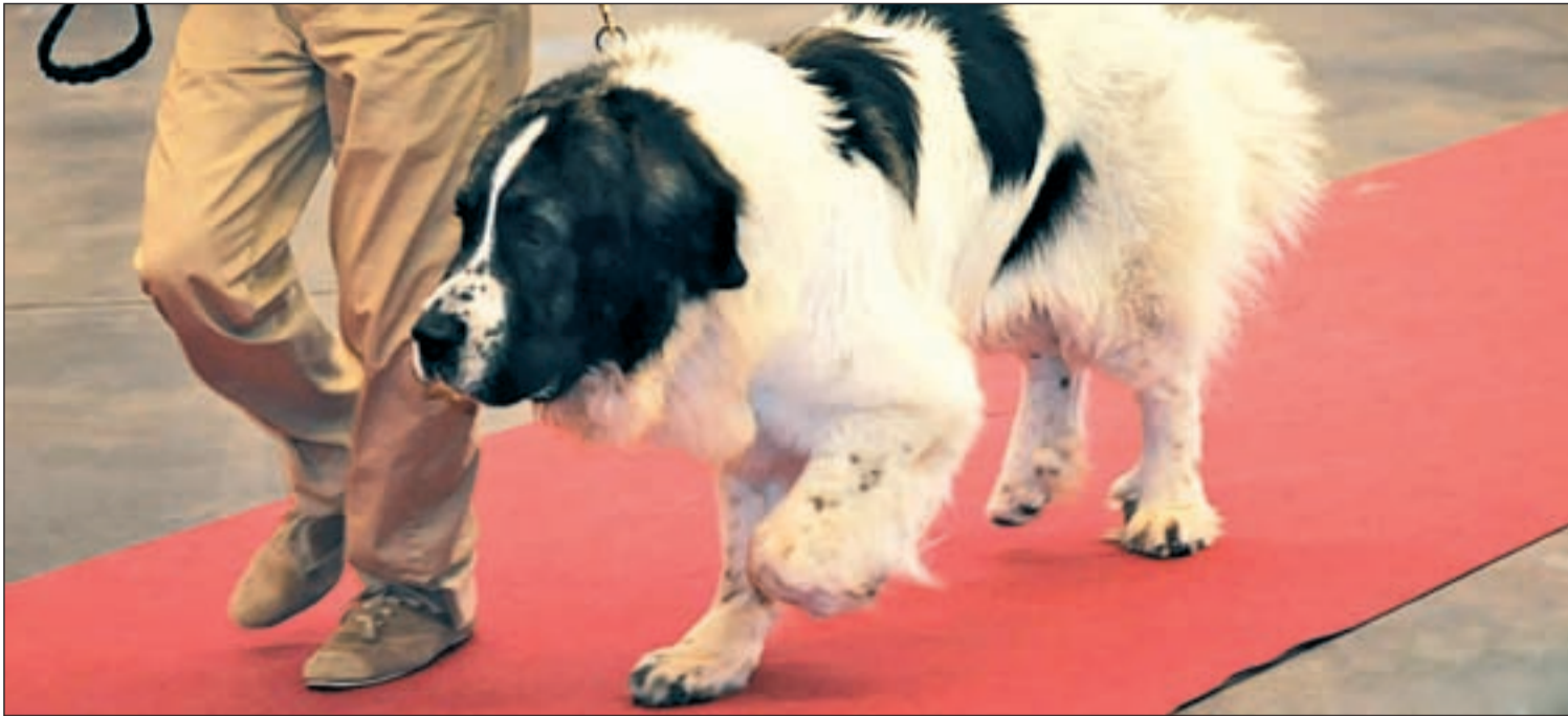
La belleza y obediencia de los canes estarán a examen en esta feria