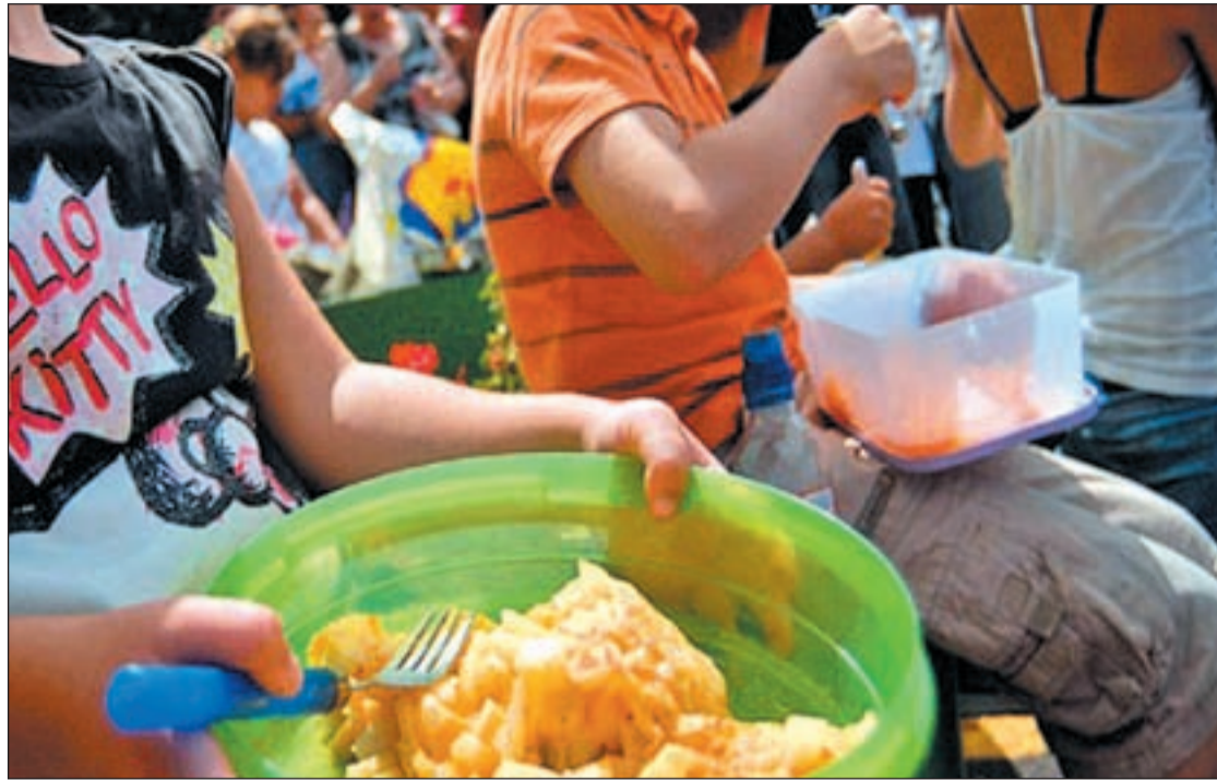
Esta imagen comenzará a ser habitual en los centros escolares

El objetivo de este programa de ayudas es poner al alcance de los demandantes de empleo la cualificación necesaria para ocupar un puesto de trabajo, a la vez que se facilita a las empresas contar con personal cualificado.