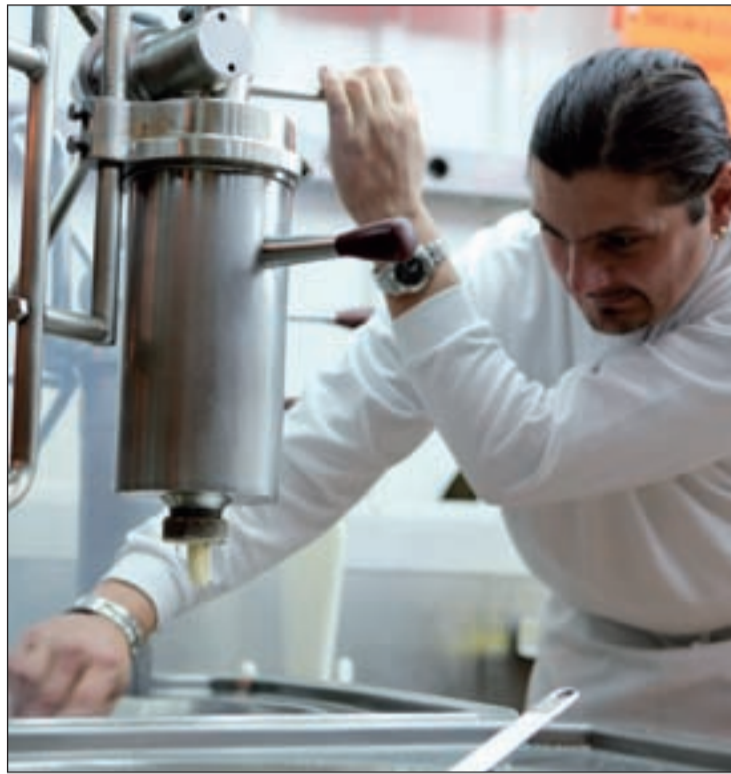
Los churros y el chocolate esperan a los mayores GENTE

A lo largo de estos días, desde el martes, cuando comenzaron estas jornadas, han podido visitar un Centro de Educación Medioambiental en El Escorial y han conocido a fondo la Basílica Asunción de Nuestra Señora de Colmenar. También este mismo viernes 28 los mayores podrán disfrutar de un maratón de gimnasia que se realizará en colabo-