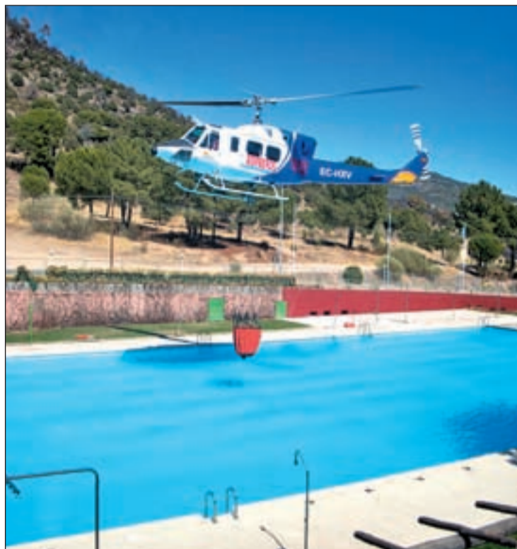
Camping de Valdemaqueda

Además, una de las primeras medidas del nuevo presidente