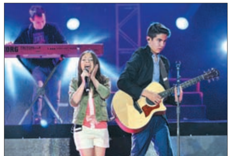
Vázquez Sounds en concierto

YouFest talent es un concurso donde se admiten participantes multidisciplinares (músicos, deportistas, bailarines y cualquiera capaz de crear cualquier tipo de espectáculo) y cuyo ganador se-