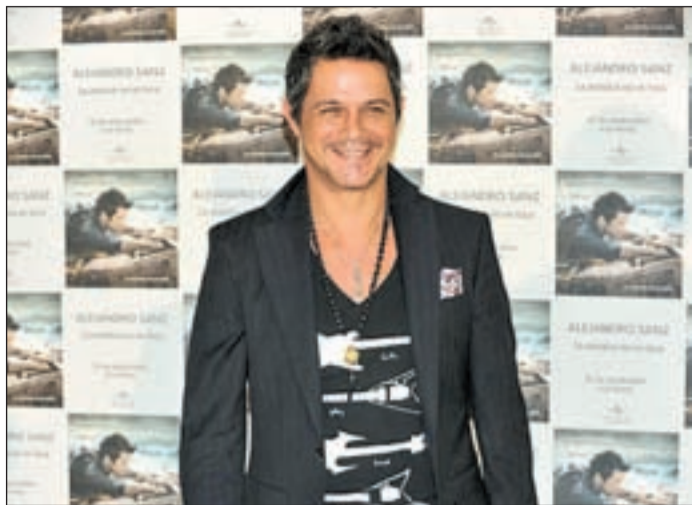
Alejandro Sanz en la presentación de su disco en Madrid