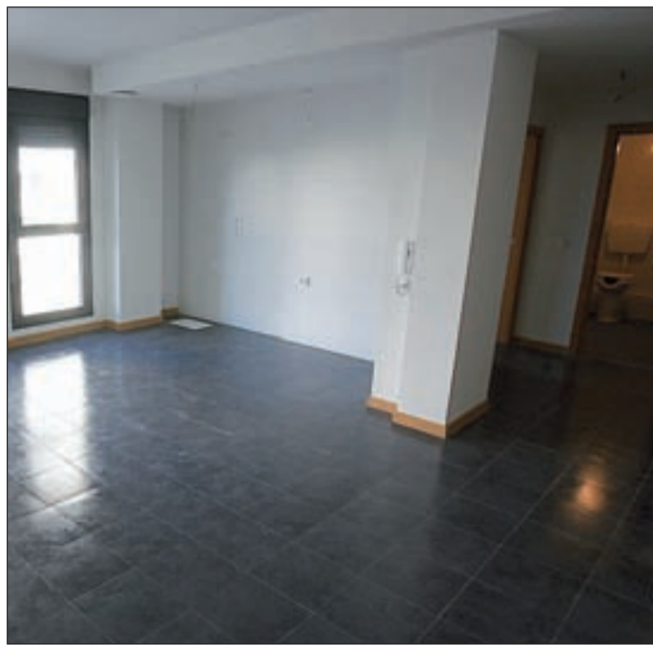
Una de las Mil Viviendas por dentro