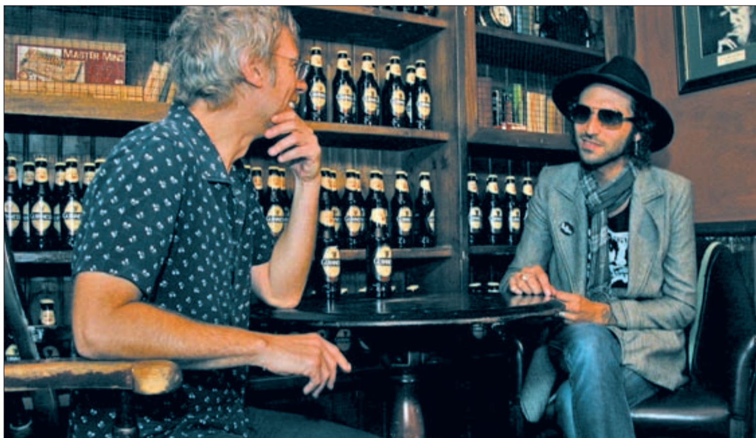
Ariel Rot y Leiva durante la entrevista