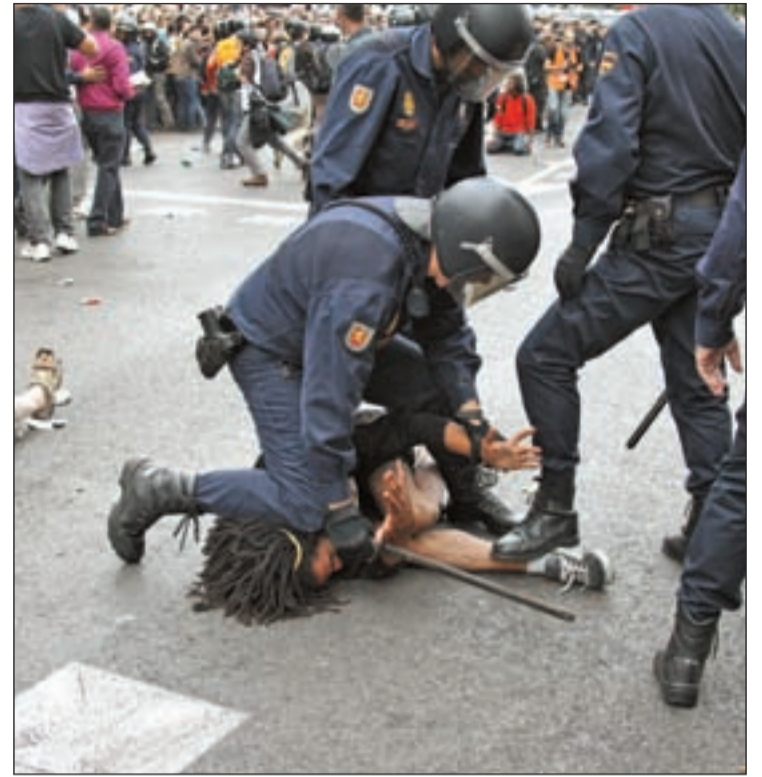
'RODEA EL CONGRESO' Miles de personas participan en la manifestación del 25-S que acaba con una gran carga policial. La noche se salda con 28 detenidos y 64 heridos, 16 de ellos trasladados a centros hospitalarios.

que ya evoluciona favorablemente. Veinticuatro horas después las cargas son tema central entre defensores y detractores. La primera en salir ha sido la delegada del Gobierno, Cristina Cifuentes, quién ha defendido la actuación policial. "Este grupo de manifestantes radicales querían propiciar un cambio de sistema", ha asegurado. Son muchas las voces críticas que piden la dimisión de Cifuentes. Una de ellas es Gaspar Llamazares que la acusa de aplicar estrategias de anti surgencia propias de dictaduras americanas.