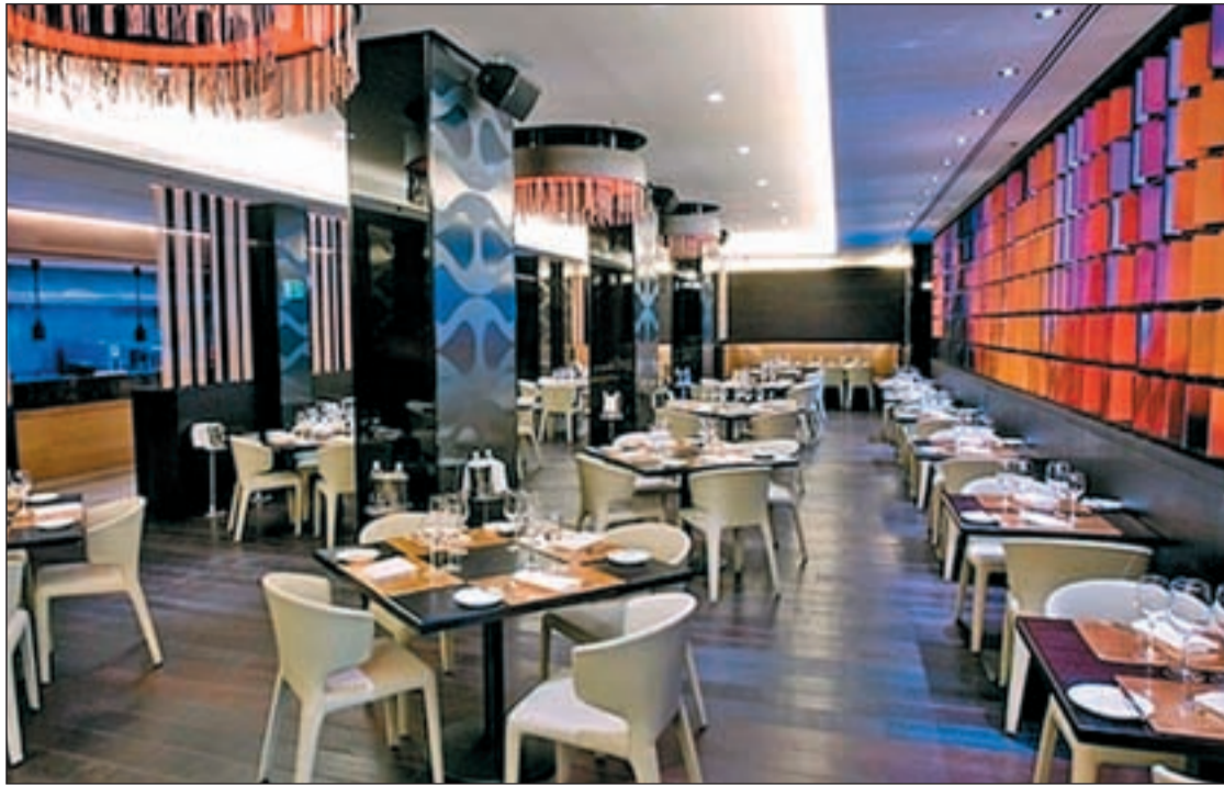
Imagen del restaurante ME Madrid Reina Victoria