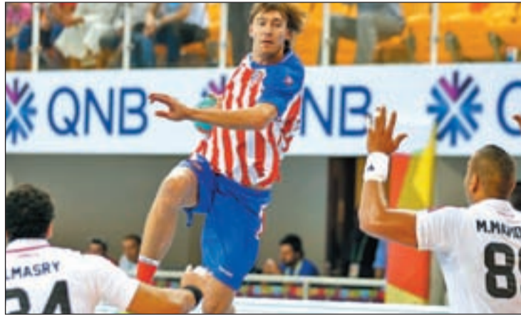
Los rojiblancos se miden al último campeón

Sin embargo, el equipo de Tantal Dujshabaev afronta este encuentro con cierto margen de error. Por delante aún restarán otros nueve partidos de esta fase de grupos, aunque como ya sucediera en el curso anterior, los rojiblancos han quedado encuadrados con rivales que no permitirán muchas relajaciones. Junto a los dos finalistas del año