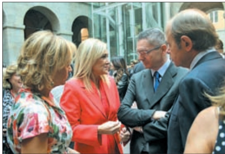
TRADICIONALES CORRILLOS Como es habitual en cualquier acto que se precie, se formaron diversos corrillos. Antes de comenzar el acto, Cifuentes, Gallardón, Pío García Escudero y Ana Isabel Mariño charlaron en Sol.

El presidente subrayó, durante un breve discurso, que va a responder “a la confianza de los ciudadanos con la entrega más absoluta”. Asimismo, aseguró que “el objetivo último es trabajar por Madrid para lograr el pro-