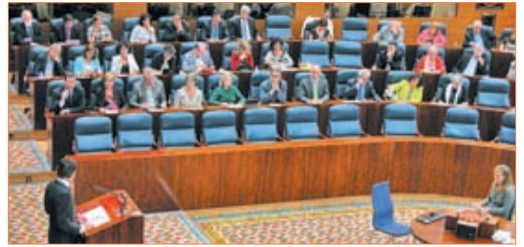
En el Debate de Inversión los grupos expresaron sus opiniones C.M.

Por otro lado, el presidente ofreció un "diálogo fluido y responsable" a los rectores de las universidades madrileñas con el fin de trabajar juntos en la "mejora de la calidad universitaria".