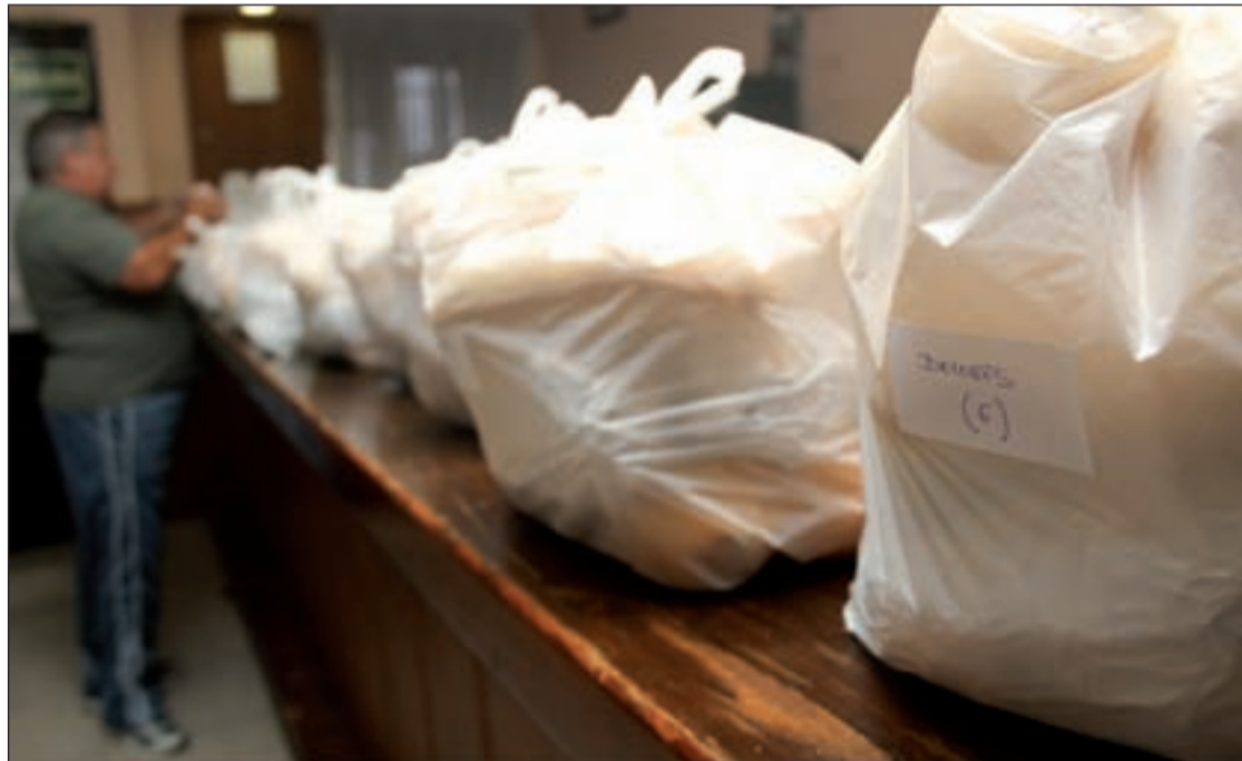
Bolsas de comida preparadas en el comedor social de San José