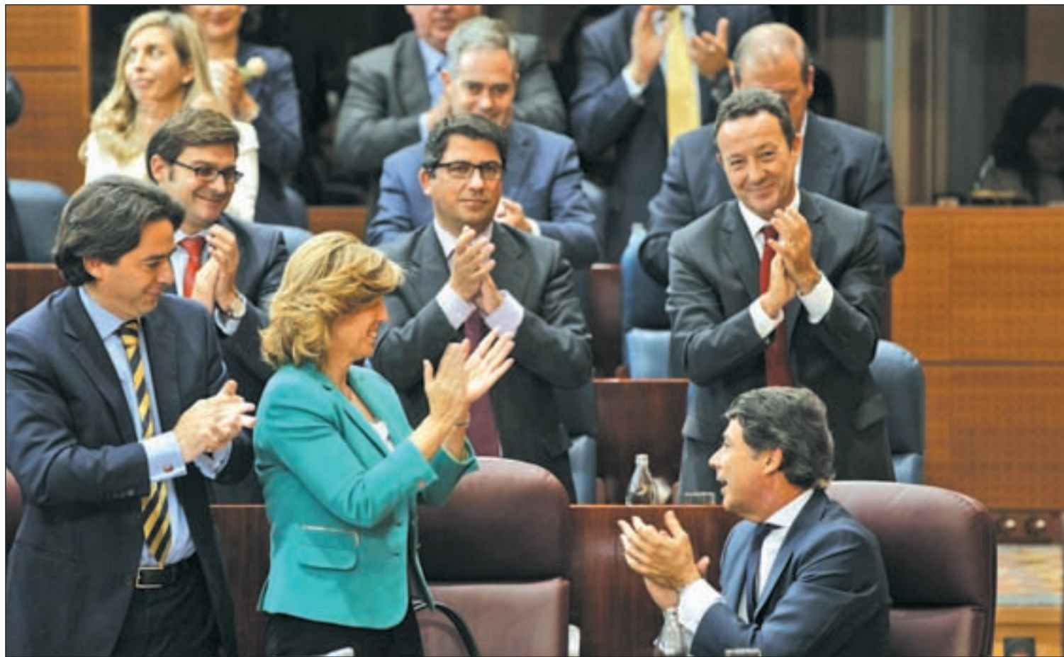
Ignacio González en la Asamblea de Madrid tras su discurso de investidura