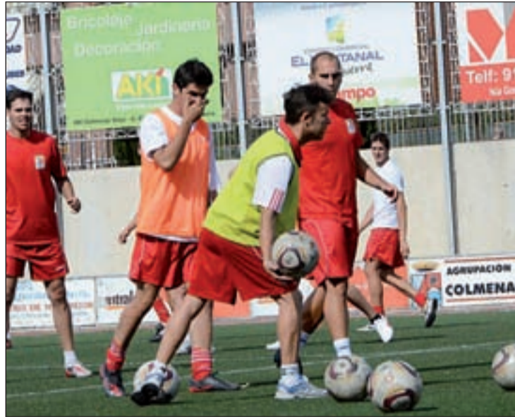
La AD Colmenar Viejo en un entrenamiento

Y eso es exactamente lo que harán los clubes con este dinero.