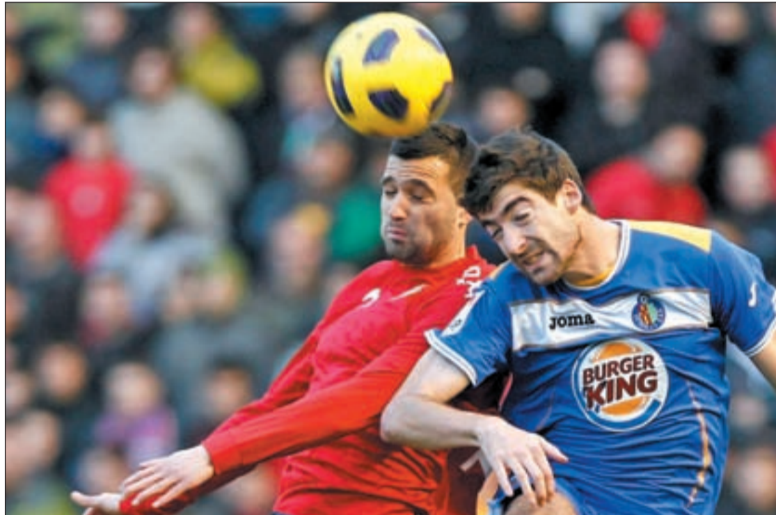
Arizmendi vuelve a la que fuera su casa hace dos temporadas

La desconcertante posición del Getafe contrasta con la espectacular temporada que está firmando el Mallorca. El cuadro de Joaquín Caparrós es uno de los