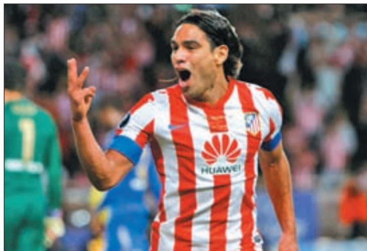
Falcao se consolida como Pichichi de Primera

Tras este compromiso, el Atlético empezará a pensar en su partido de la Europa League ante el Viktoria Plzen checo. Una situación parecida afronta el Real