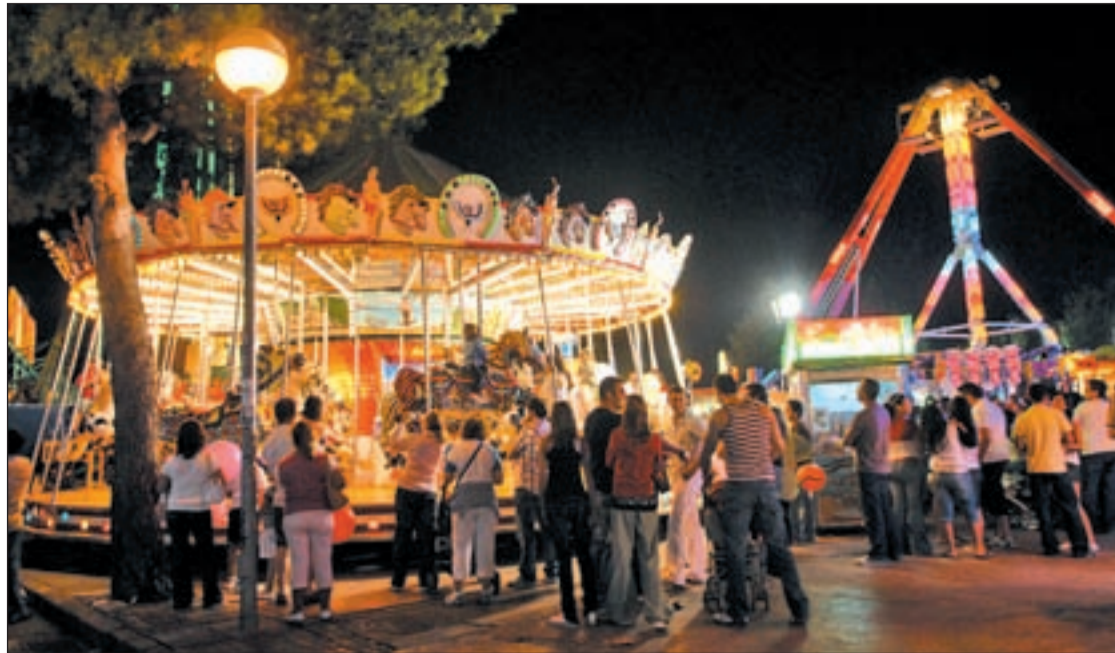
Imagen de las atracciones del Recinto Ferial CRISTINA PÉREZGENTE

El próximo día 29 comenzarán los actos de esta tradicional romería organizada, cada siete años, por la Casa Regional de Andalucía. A las 20 horas se bajará a Nuestra Señora del Rocío al patio de la Sede, para al día siguiente, el domingo 30, iniciar el traslado de la imagen a Pinto, portada por los anderos. Pasada una semana, la imagen regresará a Getafe, donde habrá una misa rociera, que pondrá punto y final a unos días llenos de fervor religioso.