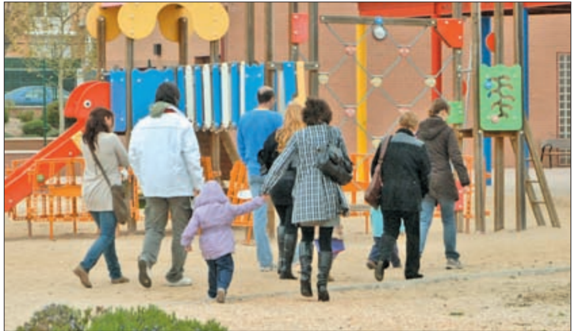
Imagen de unos padres con sus hijos