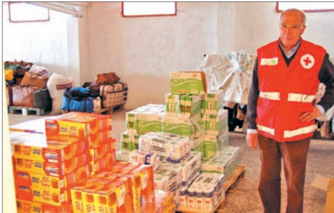
Imagen de uno de los bancos de alimentos de Cruz Roja

El perfil suele ser el mismo: personas que han perdido su empleo y que no pueden hacer frente a pagos y facturas como la luz, el agua, calefacción, etc... Este es el caso de una joven vecina del municipio, de 27 años, madre soltera de una niña de