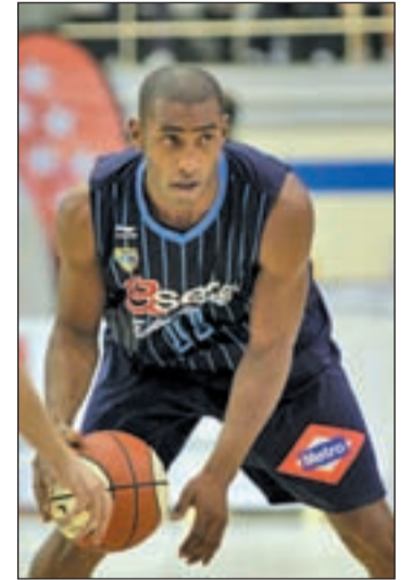
Granger sigue en el Estu M. V/GENTE

Con la llegada de Txus Vidoz a la banca, el club espera dar un giro de tuerca a un equipo que en la pasada campaña se acostumbró a estar muy lejos de los puestos nobles. Ese mismo objetivo lo tiene su primer rival en el torneo de la regularidad. Como el Estudiantes, el CB Canarias ha vivido un verano un tanto agitado en los despachos, ya que a pesar de haberse ganado en la pista el derecho a jugar en la ACB, los problemas económicos estuvieron muy cerca de dejarle fuera de la categoría. El equipo que entrena Ale-