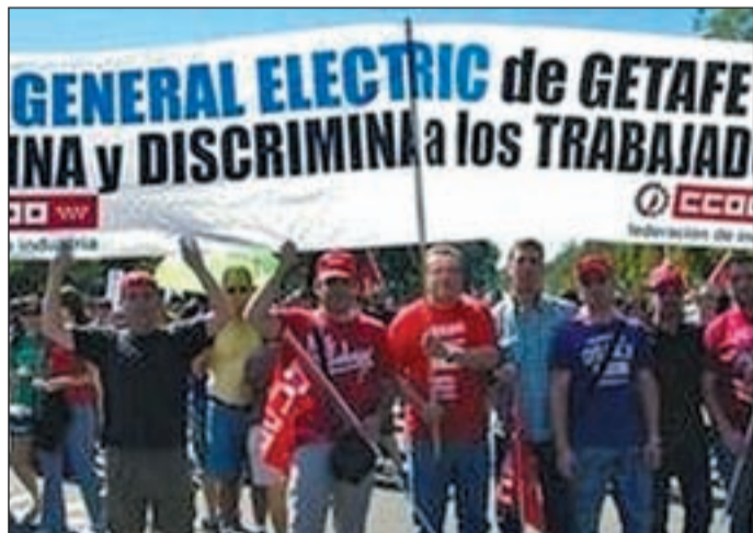
Imagen de la última huelga en General Electric Lighting

Sin embargo, al cierre de la edición de este periódico, patronal y trabajadores siguen intentando llegar a un acuerdo y la Federación de la Industria de Madrid CC.OO. ha afirmado que continúan trabajando "para que las negociaciones concluyan de forma satisfactoria".