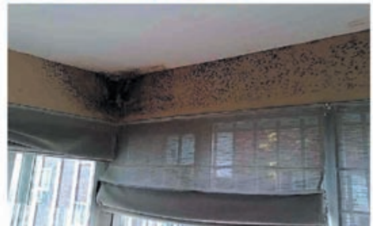
Problemas de humedades por condensación

micología en el instituto de la Salud Pública Louis Pasteur, explica este aumento por nuestro modo de vida: "Vivimos más en el interior, en casa o en el despacho. Desde los años 60, tendemos a un exceso de aislamiento para no dejar escapar el calor y además no se airea suficientemente".