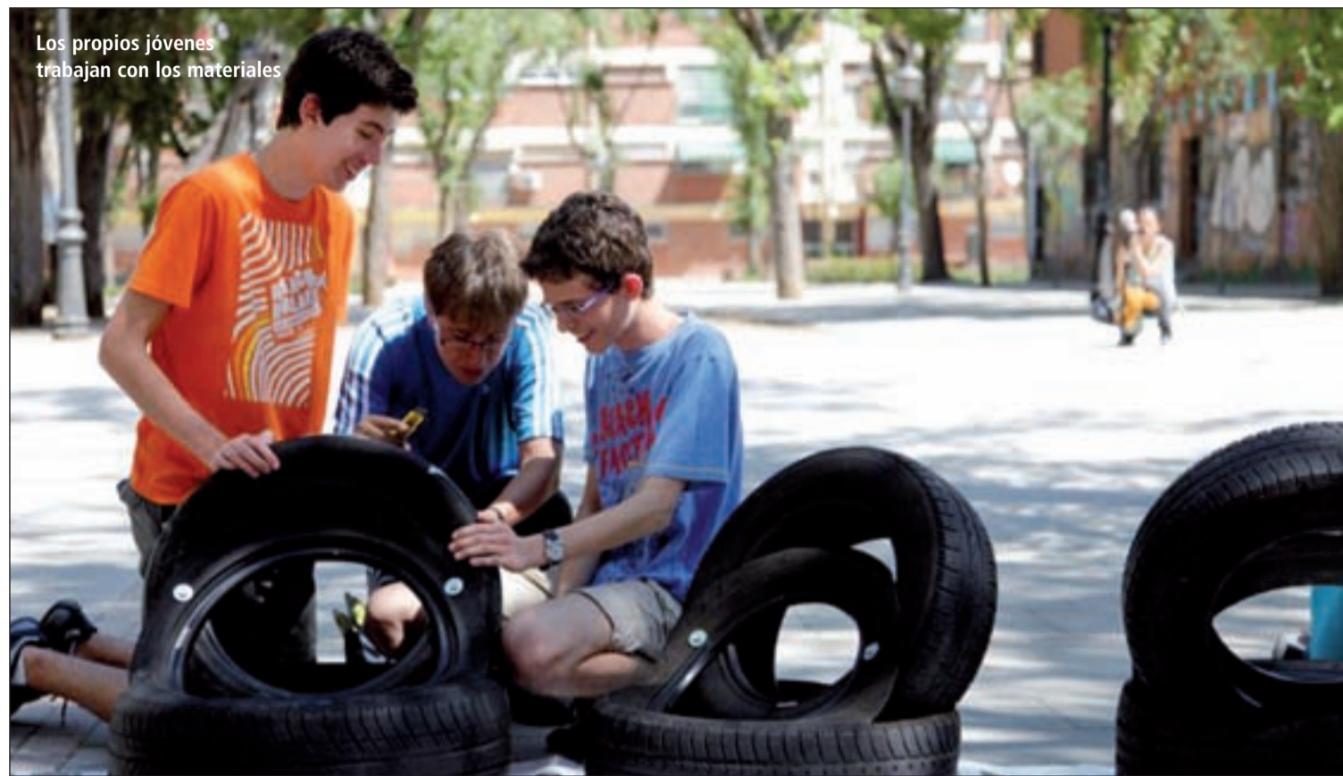
Los propios jóvenes trabajan con los materiales