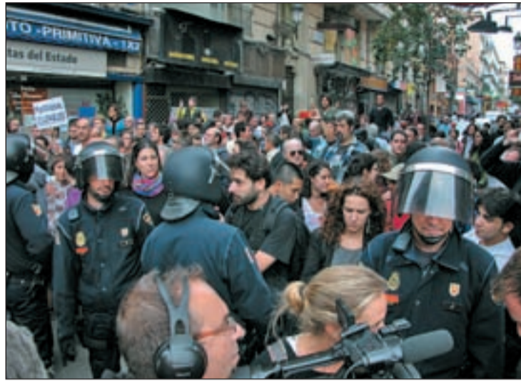
Manifestación del 25-5

Por todo lo anteriormente señalado, el presidente de la Asociación de Comerciantes propone abrir un debate con todas las partes (Ayuntamiento, asociaciones y convocantes) sobre los posibles puntos de concentración. "En Madrid existen otros lugares tanto o más emblemáti-