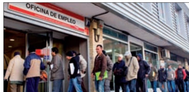
Oficina de Empleo de la Comunidad de Madrid

prendidas por la región desde hace años. Finalmente, como contrapunto a los datos de aumento de paro, ha destacado que en septiembre aumentó el número de afiliados a la Seguridad Social.