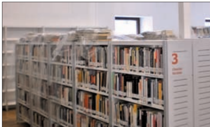
Los trabajadores tuvieron que mover miles de ejemplares

El portavoz municipal socialista, Jaime Lissavetzky, alabó igualmente la actuación de los trabajadores en su visita al centro,