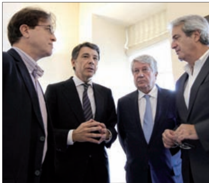
LOS AGENTES SOCIALES, LOS PRIMEROS. Antes que a los municipios, el presidente de la región recibió a los sindicatos y a la patronal, en un encuentro que las dos partes valoraron positivamente.

Demostró claramente su propósito de "lealtad institucional con independencia del signo político que gobierne en cada ayuntamiento", cuando compareció ante los medios de comunicación