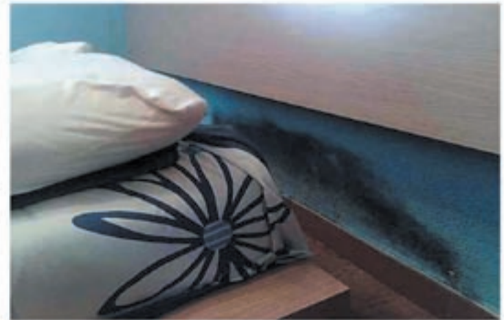
Problemas de humedades por capilaridad

Se han realizado estudios científicos sobre adolescentes que sufren afecciones respiratorias, dando como resultado un 83% de asma, bronquitis asmáticas y bronquitis crónicas y un 87% de rinitis crónicas, que alcanzan a jóvenes que viven en habitaciones demasiado húmedas. De un 20 a un 30% de nosotros sufrimos alergias respiratorias, ¡dos veces más que hace 20 años!. Edouard Drouhet, jefe de