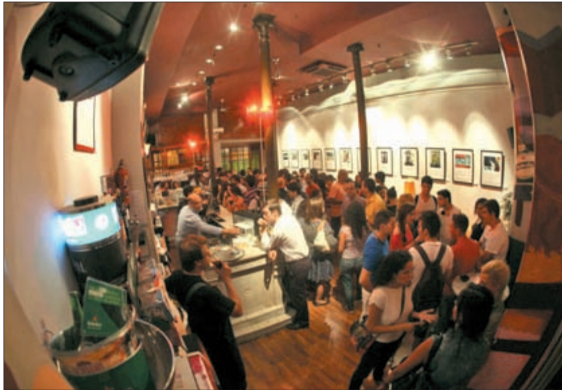
Madrid Babel, que cuenta con unos 25.000 miembros, prepara dos encuentros semanales en este céntrico bar