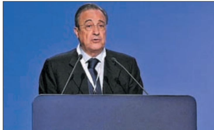
Florentino Pérez, presidente del club blanco

El presidente del Real Madrid, Florentino Pérez, desveló esta semana los "cuatro proyectos" que la entidad madrileña tiene sobre la mesa para el estadio Santiago Bernabéu, en la Asamblea General de socios celebrada el 30 de septiembre, y aseguró que el gran objetivo de esta obra es que el templo blanco "se convierta en un referente arquitectónico". "Para la remodelación del Santiago Bernabéu nos han llegado cuatro proyectos, de Amela-Populous, Moneo-Herzog&De Meuron, Norman Foster-Rafael de LaHoz y GMT Architekten-L35-Ribas (...) Nuestro objetivo es mejorar el estadio y la ciudad deportiva. Queremos que ambos sean un icono arquitectónico", explicó ante los so-