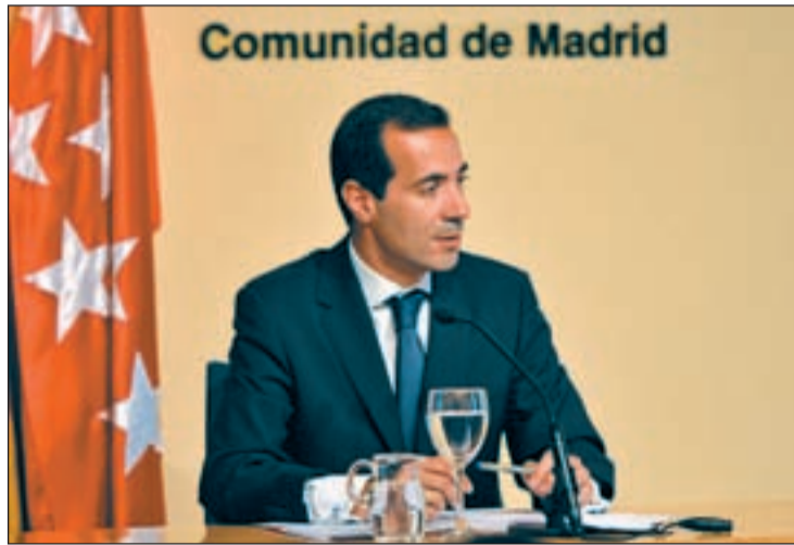
El portavoz del Gobierno regional en su primer Consejo

En otro orden de cosas, el consejero de Presidencia y Justicia y portavoz del Gobierno regional anunció que la Comunidad de Madrid impulsará la implanta-