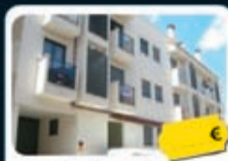
Usera (Madrid) La Cal, 22

Viviendas de 54 m 2 a 87 m 2 . Distribuidas en diversas dependencias y disponen de buenos acabados.