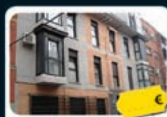
Carabanchel (Madrid) Elvira Barrios, 5-7

Precio actual desde 138.200 € Ref. 73105632