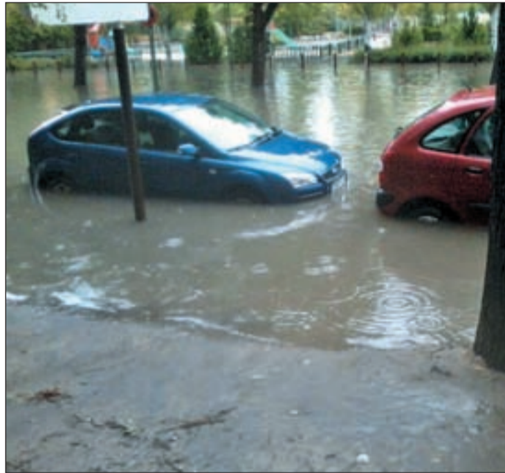
Dos coches anegados por el agua en el barrio de Butarque AVIB

En la actualidad, Avib está en contacto con los vecinos afectados por la inundación de sus garajes y trasteros para denunciar conjuntamente los hechos e “in-