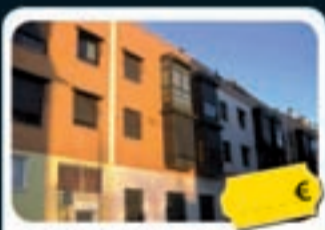
Latina (Madrid) Daniel Segovia, 33

Pisos de 62 m 2 a 94 m 2 . Disponen de acabados de calidad. Ubicados junto al parque municipal de la Casa de Campo de Madrid.