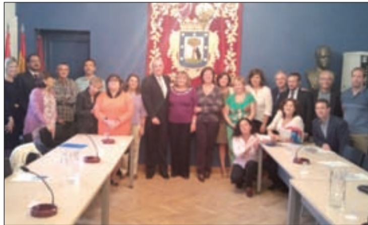
La reunión se celebró en el salón de plenos municipal