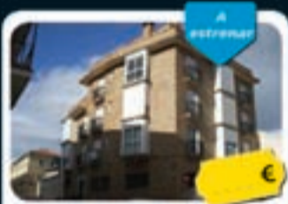
Carabanchel (Madrid) Paulina Odiaga, 46

Viviendas de 43 m 2 a 49 m 2 . Con parque, cocina americana amueblada y preinstalación de aire acondicionado. Los áticos tienen amplias terrazas.