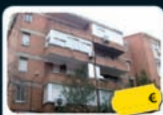
Carabanchel (Madrid) Thader, 10

Decídate antes de final de año y benefíciate de la deducción fiscal .