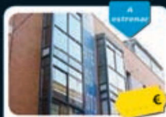
Carabanchel (Madrid) Recesvinto, 80

Pisos de 68 m 2 a 70 m 2 con buenos acabados. Parking en el mismo edificio. Disponen de ascensor. Bien situados, junto al parque de San Isidro.