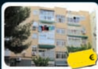
Latina (Madrid) Duquesa de Parcent, 106

Piso de 63 m 2 con 3 hab. y 1 baño. Ubicado junto al parque de Cerro Almodóvar.