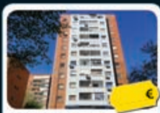
Usera (Madrid) Carabelos, 53

Precio actual desde 149.500 € Ref. 73104195