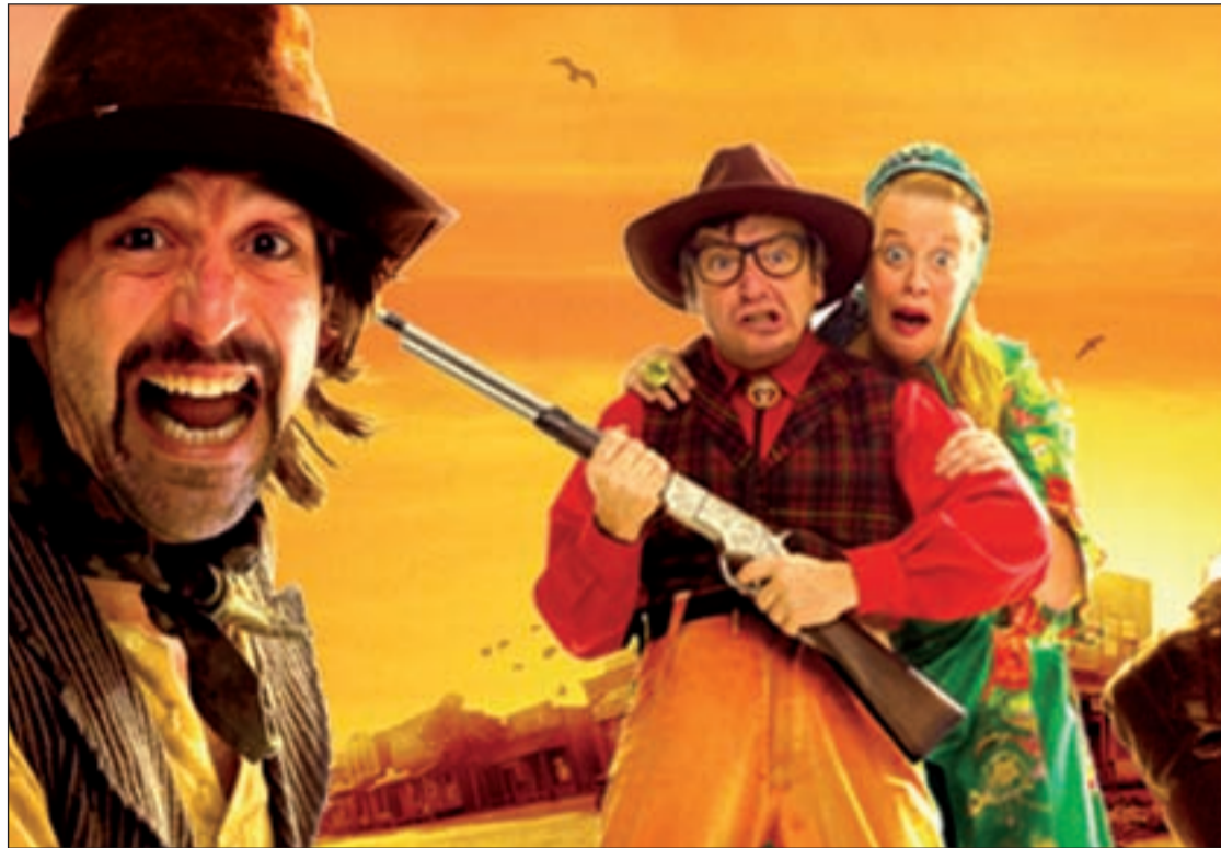
Los protagonistas de 'Far west', de Yllana

Por el escenario de la Sala Latinarte pasarán algunas de las compañías teatrales más reconocidas de la escena madrileña, como Morboria Teatro, Producciones Yllana, la Compañía Micomicón, Factoría Estival de Arte y La Machina Teatro, ganadora del Premio Max de las Artes Escénicas al Espectáculo Revelación 2012.