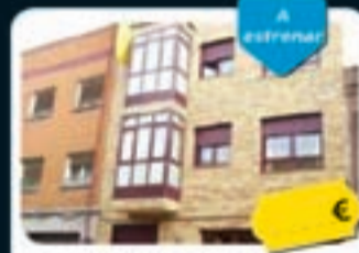
Usera (Madrid) Pilarica, 41

Precio actual desde 96.710 € Ref. 106758