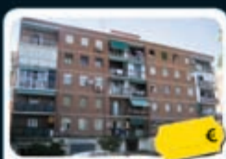
Carabanchel (Madrid) Av. Lusitana, 70

Precio actual desde 107.040 € Ref. 73100029