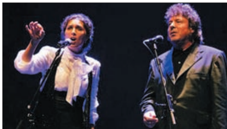
Estrella y Enrique Morente juntos en concierto

tras de cariño que han recibido desde que muriera su progenitor, pero hay dos razones que la llevan a rechazar la idea del monumento. La primera de ellas es de carácter económico y declara al respecto "Entendemos que la gente quiere homenajearle, pero mi padre era una persona muy