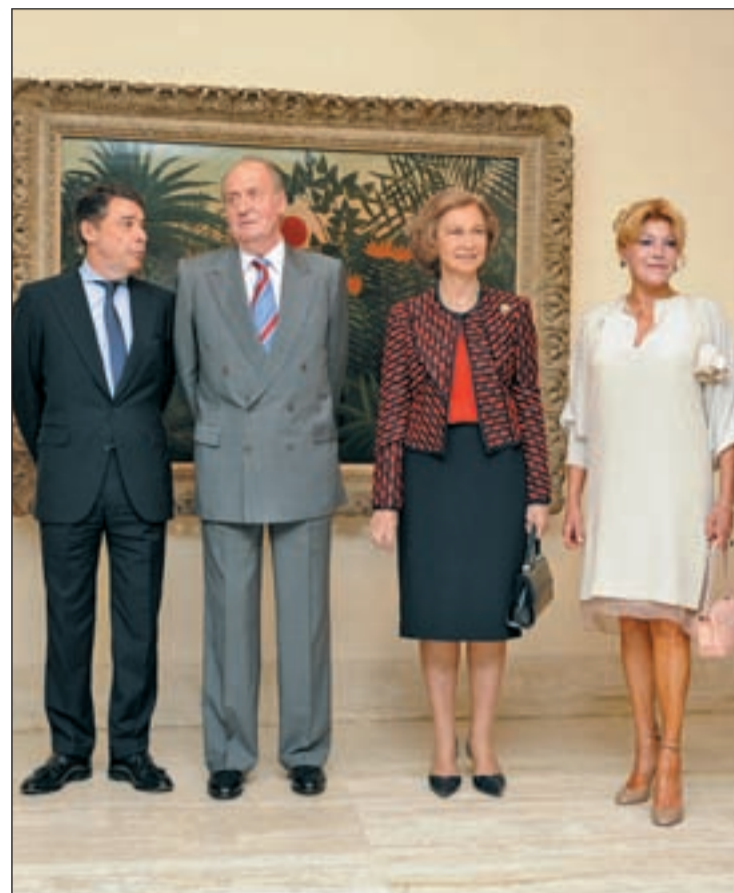
Los Reyes de España en la inauguración de la exposición

Los cuadros pueden agruparse en cuatro etapas: la primera arranca con la obra de Eugende Delacroix, precursor de una nueva manera de concebir el arte. En la segunda se aprecia el giro que sufrió la carrera de Gauguin, tras su paso por Martinica en 1887. La tercera refleja la estancia del pintor en Oceanía. Finalmente, en la parte de la