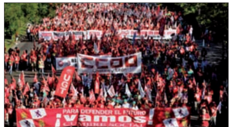
Miles de personas protestan por las políticas del Gobierno

La marcha multitudinaria ha sido un ensayo de una posible huelga general que los principales sindicatos, CCOO y UGT, quieren convocar para este otoño. La fecha parece que ya está marcada: 14 de noviembre.