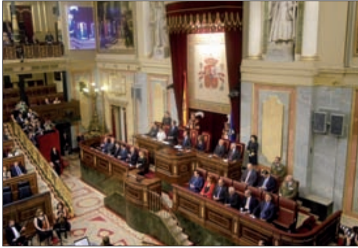
El 26,9% de los ciudadanos considera a los políticos un problema

En julio de este año, los políticos eran considerados como tres de los principales problemas para el 25,4 por ciento de los españoles. El mes de junio ese por-