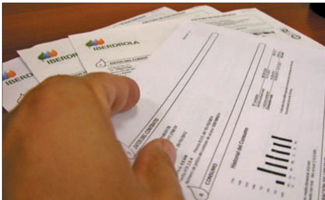
La reforma de la factura de la luz afectaría a más de veinte millones de usuarios

Cruz Roja ha hecho el primer llamamiento de su historia de ayuda en España para poder atender a 300.000 personas más, en situación de extrema vulnerabilidad, afectadas por la crisis económica. Aprovechó el 'Día de la Banderita', uno de los eventos más emblemáticos de la institución y que se desarrolló de forma simultánea en más de 30 provincias españolas y cuyos fondos se destinarán para ayudar a estas personas. La institución subraya que el 82 por ciento de las personas atendidas por Cruz Roja vive por debajo del umbral de la pobreza (con una renta por debajo de 627 euros).