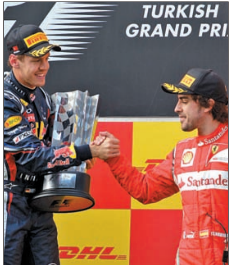
El alemán y el español, grandes protagonistas del Mundial

A la igualdad reinante en la clasificación general se suma otro dato que imprime aún una dosis mayor de emoción a la carrera de este domingo. Hasta la fecha, el circuito coreano ha acogido dos carreras del Mundial de Fó-