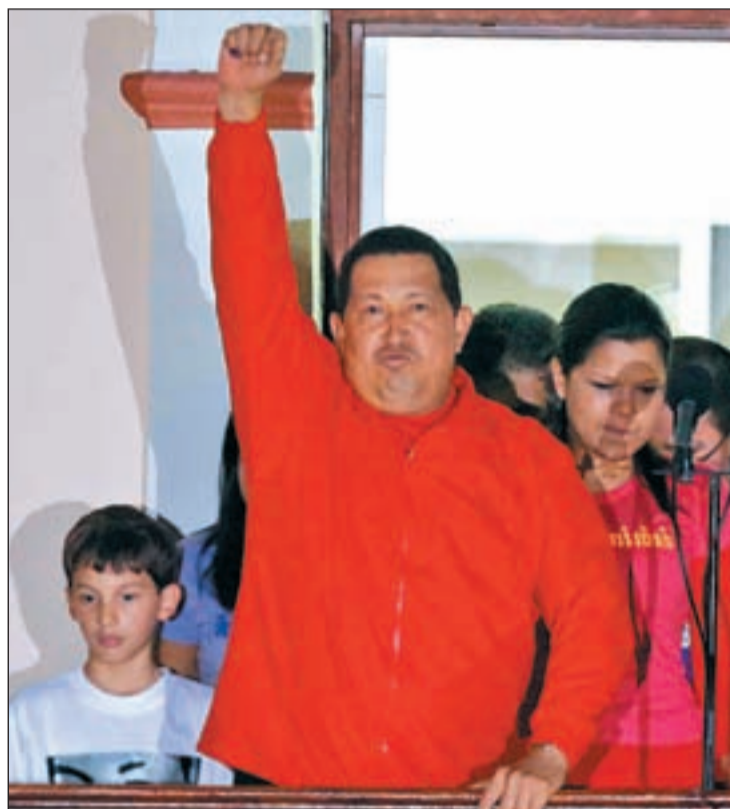
Hugo Chávez saludando desde el Balcón del Pueblo

Tampoco tardó en salir al Balcón del Pueblo del Palacio de Miraflores Hugo Chávez. Exultante y triunfador, felicitó a la oposición "porque han reconocido la victoria del pueblo, la vic-