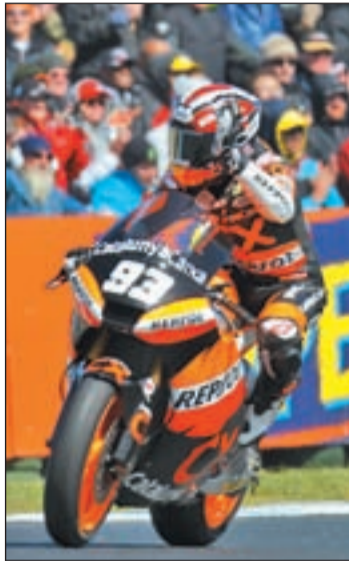
Márquez, líder en Moto2

Una situación similar se vive en Moto2, aunque en este caso son Marc Márquez y Pol Espargaró los que se postulan para suceder en el palmarés de la categoría al alemán Stefan Bradl. Los dos pilotos han copado los triunfos en las cuatro últimas pruebas, aun-