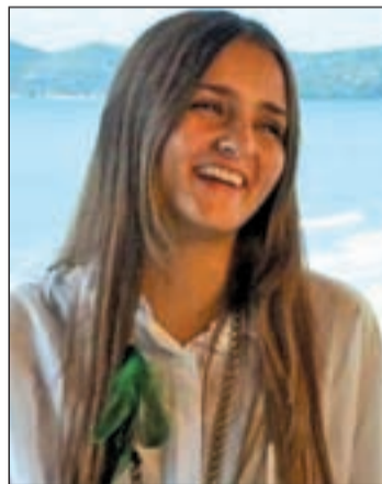
La protagonista de la subasta