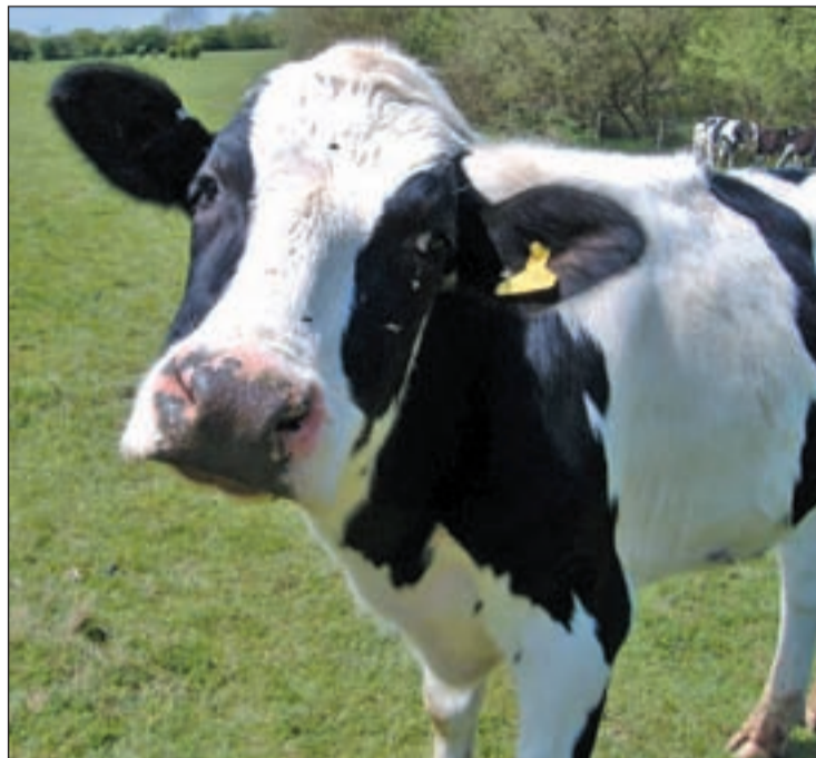
Una vaca modificada genéticamente da leche antialérgica

El proceso llevado a cabo se denomina 'interferencia de ARN' y reduce la actividad de cientos de genes sin eliminarlos completamente. En este sentido, los expertos han indicado que se puede utilizar para controlar otras características en el ganado. Los investigadores han