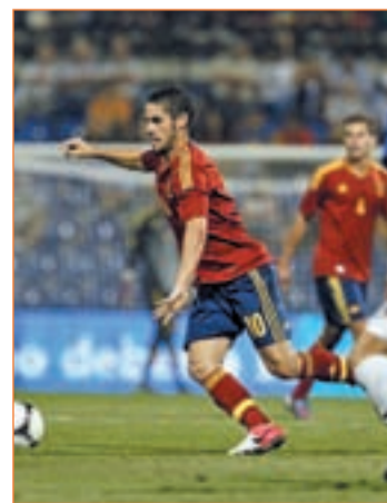
Isco, una de las estrellas

Para esta doble cita, Lopetegui ha convocado a veinte jugadores, entre los que destacan el malaguista Isco, el barcelonista Gerard Deulofeu y el jugador del Athletic Iker Muniain.