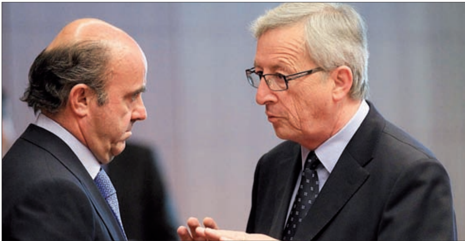
El ministro de Economía, Luis de Guindos, y el primer ministro de Luxemburgo, Jean-Claude Juncker