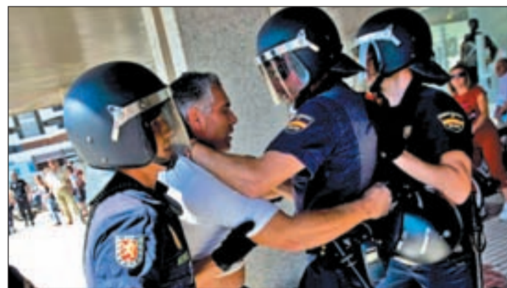
Los antidisturbios podrían llevar cámaras en sus cascos

En caso de llevarse a cabo la medida, supondría un paso más de las cámaras de mano que ya en la actualidad utiliza la UIP para captar imágenes.