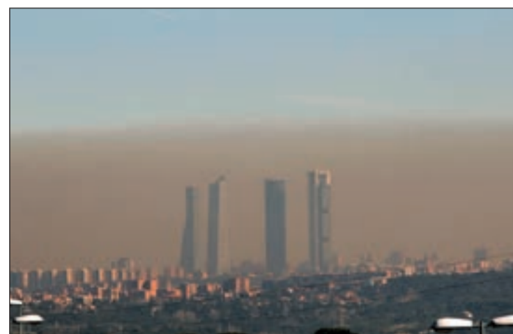
España supera los límites de contaminación establecidos por la OMS

El principal agente contaminador del aire es el tráfico en zonas metropolitanas, donde vive la mayor parte de la población. Además, Ecologistas en Acción denuncian que las Administraciones no están adoptando las medidas necesarias solucionar este problema tan serio para la