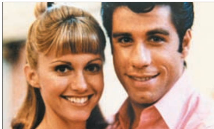
John Travolta y Olivia Newton-John en una escena de Grease

ÁLBUM NAVIDEÑO SALDRÁ A LA VENTA EL 13 DE NOVIEMBRE