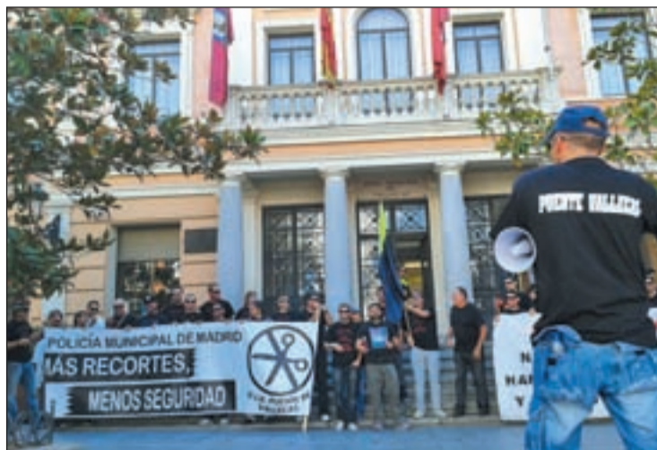
Un momento de la concentración frente a la sede municipal

“Usando las redes sociales nos hemos tenido que organizar nosotros mismos, ya que ni Jefatura ni los sindicatos nos apoyan. Nos jugamos la vida por poco más de 1.700 euros al mes, trabajando festivos, de noche y luchando con individuos armados”. De esta manera define uno de los agentes de la Policía Municipal de Puente de Vallecas, la situación de los agentes que velan por la seguridad en el distrito. Asegura que han aparecido ratas en los locales de la Unidad Integral, y alude al hecho de que cada agente tenga que llevar su propio rollo de papel higiénico. “Es muy triste ver morir a un compañero y que cada vez tengamos menos sueldo, menos tiempo libre, y menos medios