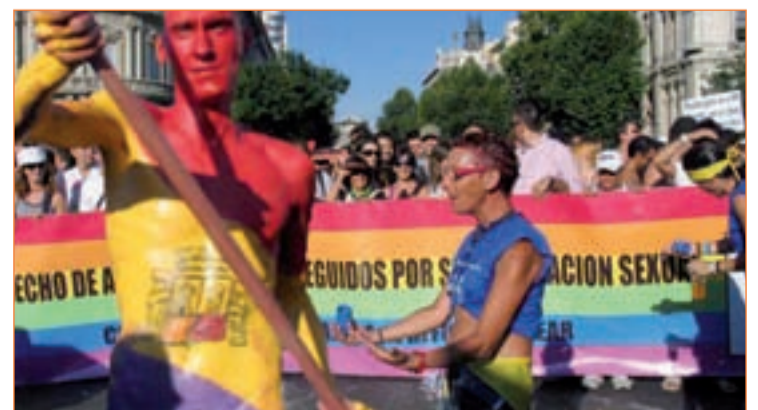
Madrid recibió a más de dos millones de personas en Europride 2007

De cara a World Pride, Madrid cuenta con la experiencia de Europride, evento que organizó en 2007. En 2017 se cumplirán doce años de la Ley de Matrimonio Igualitario y el décimo de la Ley de Identidad de Género.