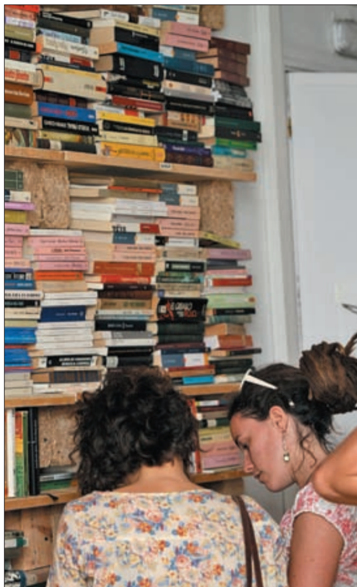
Estanterías de Libros Libres