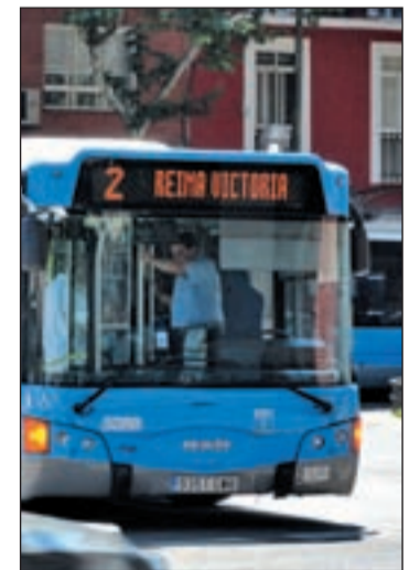
Autobús de la EMT

Igualmente, a partir del día 15, la línea 103 de la EMT (Entrevías-Ecobulevar) experimentará una prolongación para llegar, desde su actual cabecera de Entrevías, en la calle de Los Barros, hasta la estación de Cercanías de El Pozo. La prolongación se realiza a través de Los Barros, la Ronda Sur y la avenida de Entrevías.