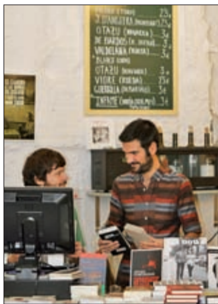
Tipos Infames cuenta además en su planta baja con una sala de exposiciones, donde frecuentemente se realizan presentaciones de libros, catas de vino y diferentes talleres

El proyecto, inspirado en la experiencia estadounidense Booth.org, que funciona desde 1999, busca promover el acceso a la cultura de forma gratuita y fomentar la lectura. De tal forma que uno puede acercarse al establecimiento, ubicado en la calle Covarrubias, 7 (de 12:00 a 20:00 de lunes a domingo), y llevarse todos los ejemplares que quiera sin asumir ningún tipo de coste ni suscribirse a nada. Eso sí, los libros, que proceden de dona-