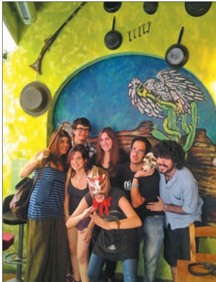
Restaurante 'La venganza de Malinche'