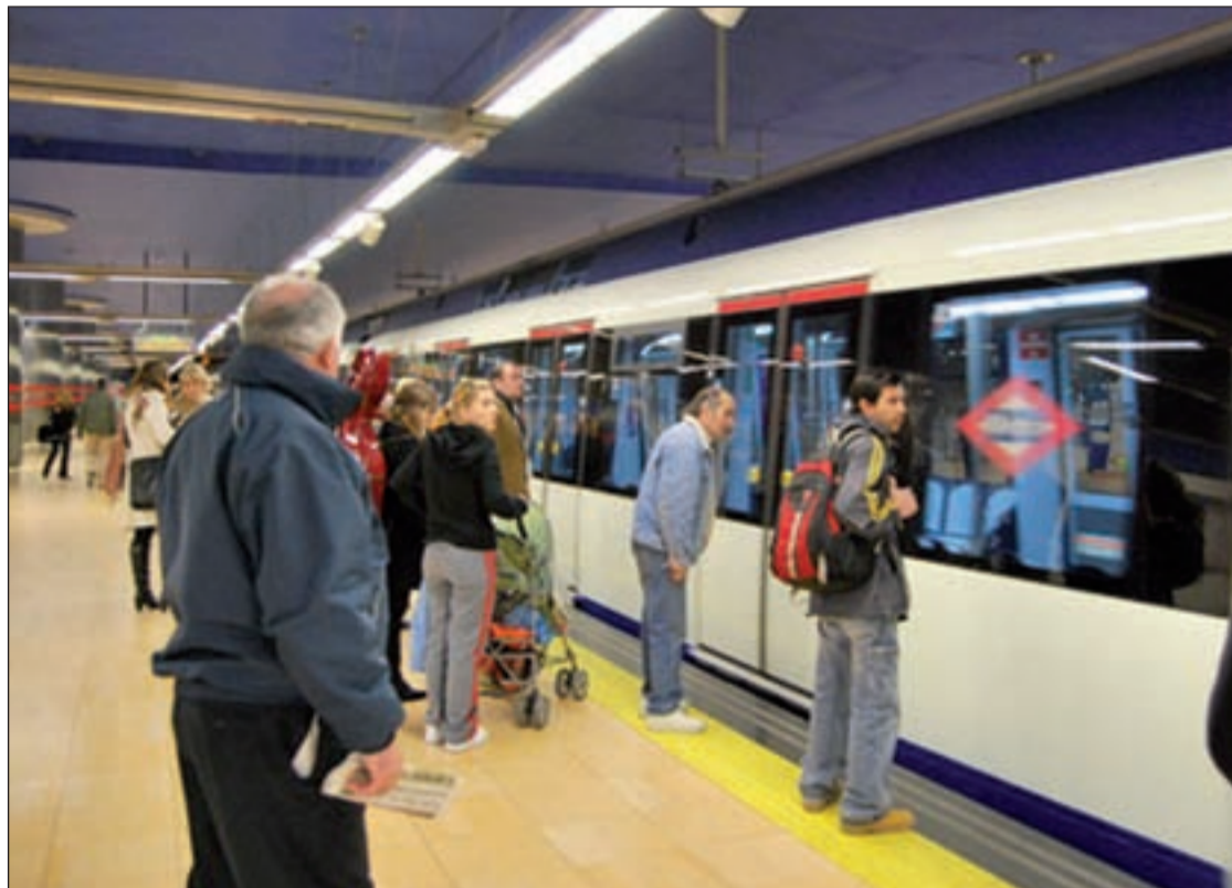
Metro de Madrid ha reducido el número de trenes

"Es cierto. Yo que soy usuario habitual de la línea 1 lo he notado, sobre todo, en horas punta como puede ser las 8 de la mañana cuando voy a trabajar", dice