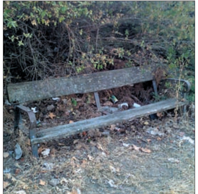
Imagen que presenta el Parque Alhóndiga