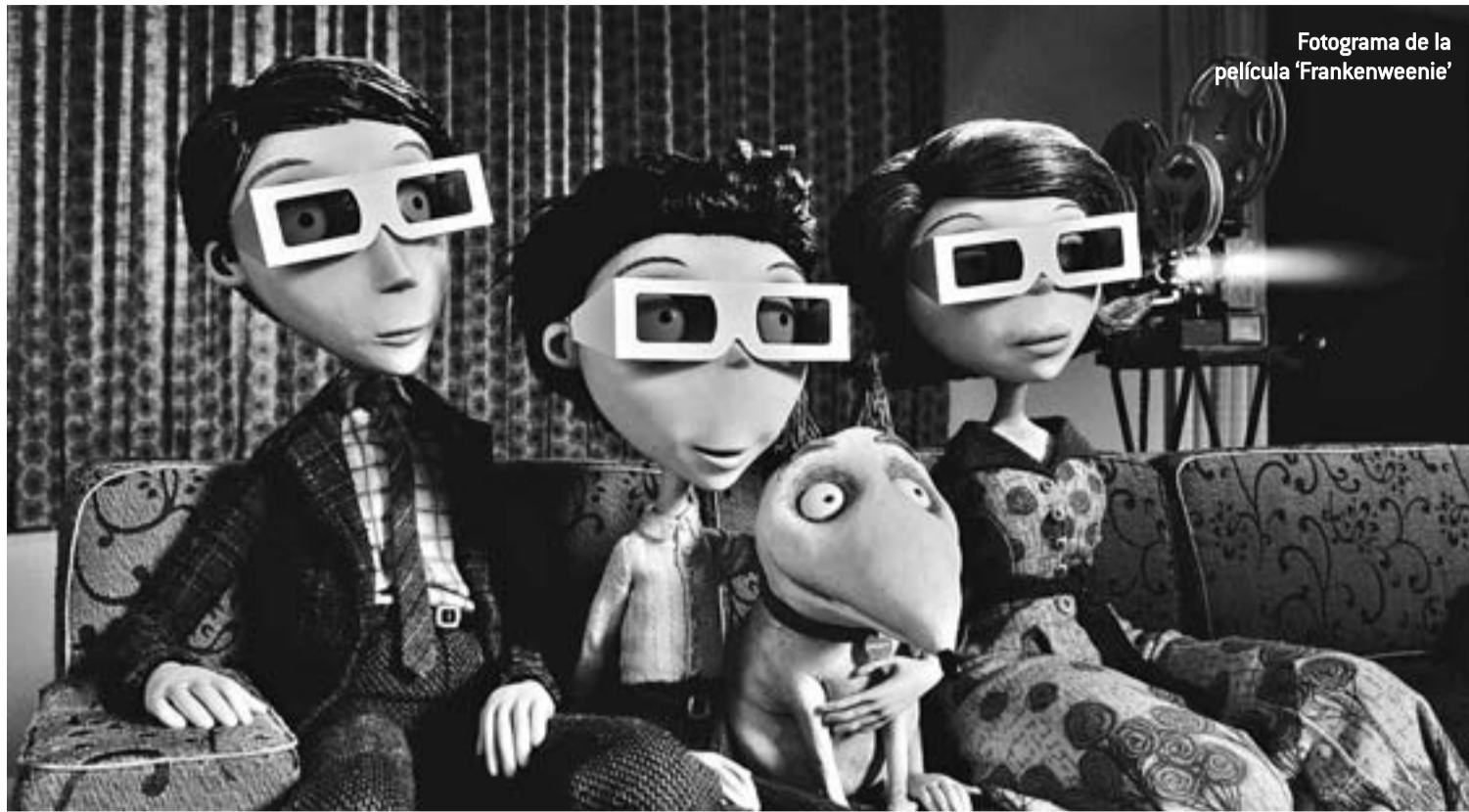
Fotograma de la película 'Frankenweenie'