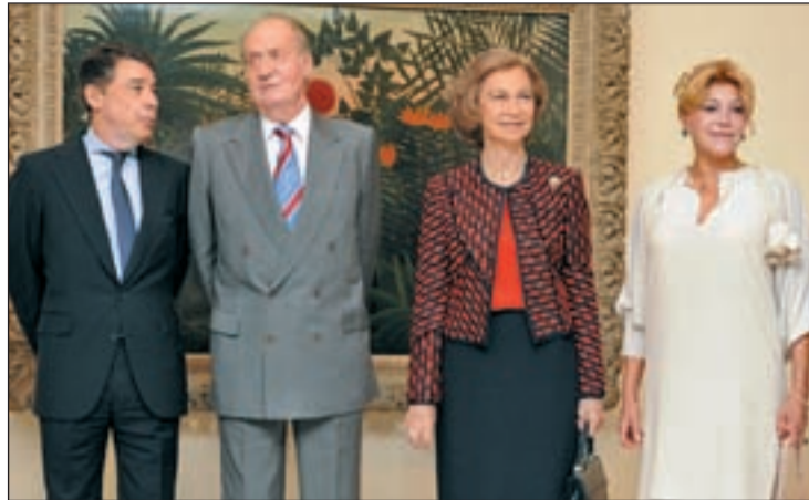
Los Reyes de España en la inauguración de la exposición

Gauguin, además de ser padre de la modernidad, es el pin-