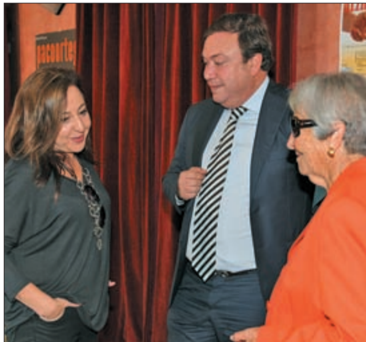
Durante la presentación de la programación cultural

Pero las representaciones teatrales no serán las únicas protagonistas en el cartel de esta programación cultural de octubre, si no que vendrán acompañadas de obras musicales y conciertos para completar el mes. Es el caso de Cultura Inquieta con el concierto de jazz a cargo de Will Bernatt Jazz, la banda más potente de jazz-funk de Estados Unidos y 'Pagagnini' el día 14, que repasará algunos momentos cumbre de la música clásica con mucho humor y diversión.