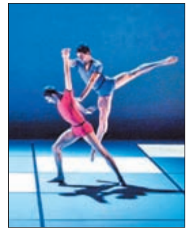
Imagen de la obra

El mensaje final es que a pesar de haber fallecido, el cantante sigue vivo en sus canciones y sus mensajes seguirán transmitiéndose, entre otros medios gracias a este espectáculo que no ha parado de incorporar nuevos números y nuevos artistas. Estos cambios hacen que esté en constante evolución y que siga sorprendiendo incluso a la gente que ya lo haya visto.