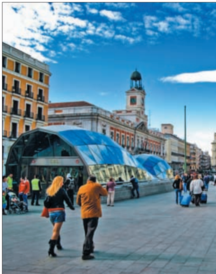
Imagen reciente de la Puerta del Sol

En el caso del quiosco de hostelería, apuntó que su superficie se fija en cien metros cuadrados con la posibilidad de crear una terraza-velador de no más de 300 metros; y, por otro lado, respecto a la instalación de terrazas, avanzó que se realizarán acorde con la ordenanza municipal. Por último, el concejal subrayó que esta revitalización de Sol tendrá sinergias con otros