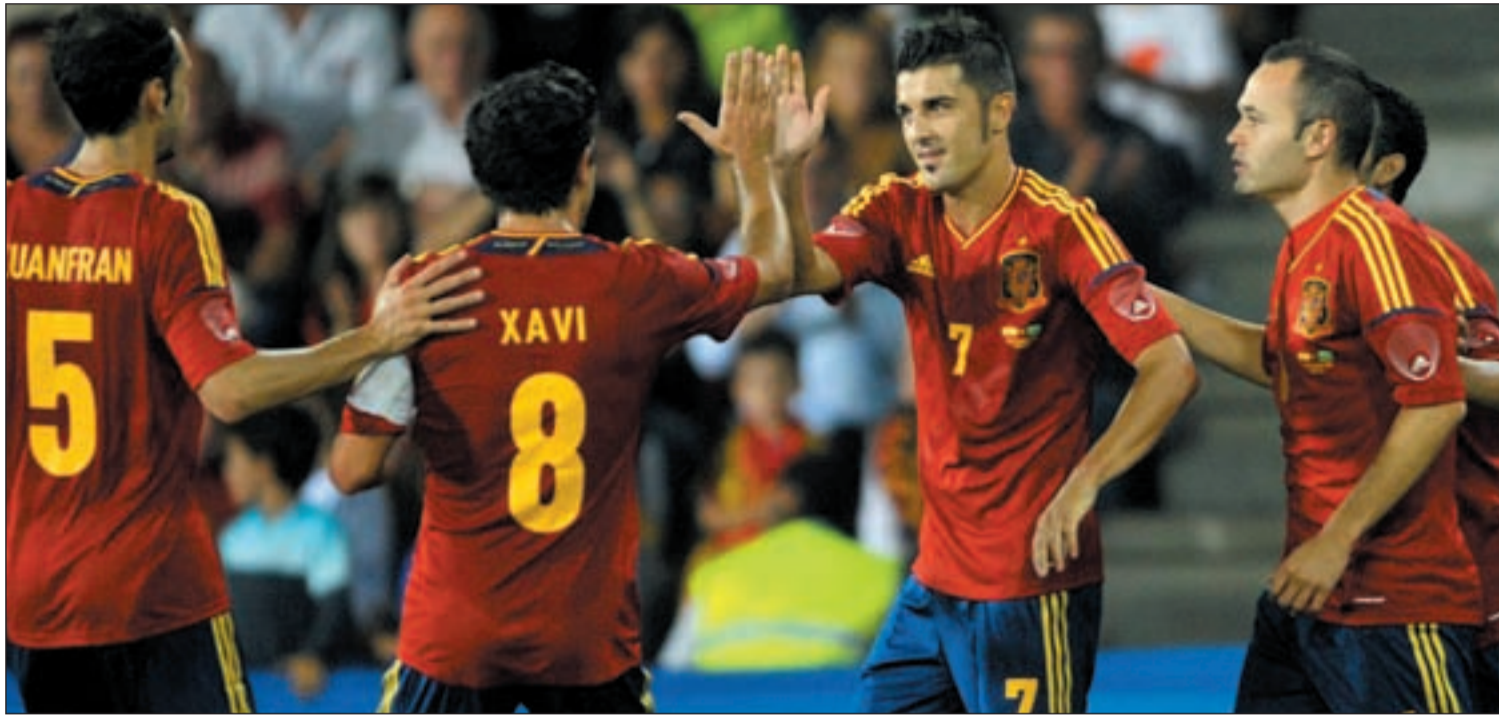
El equipo de Vicente Del Bosque vuelve a escena para jugar dos partidos trascendentales

LA SELECCIÓN AFRONTA DOS CITAS CLAVE EN LA CLASIFICACIÓN ANTE BIELORRUSIA Y FRANCIA