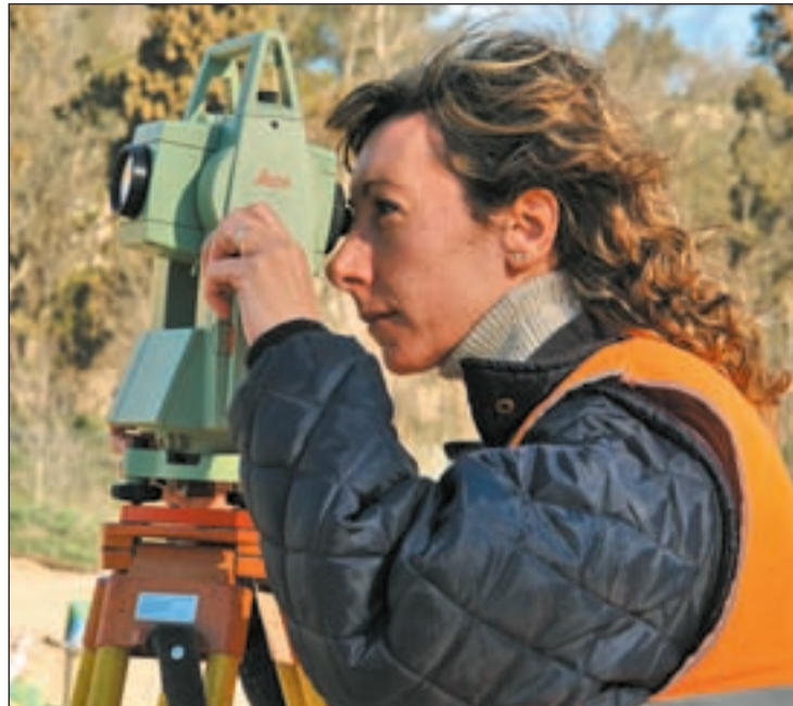
Aparejadora realizando una medición del terreno