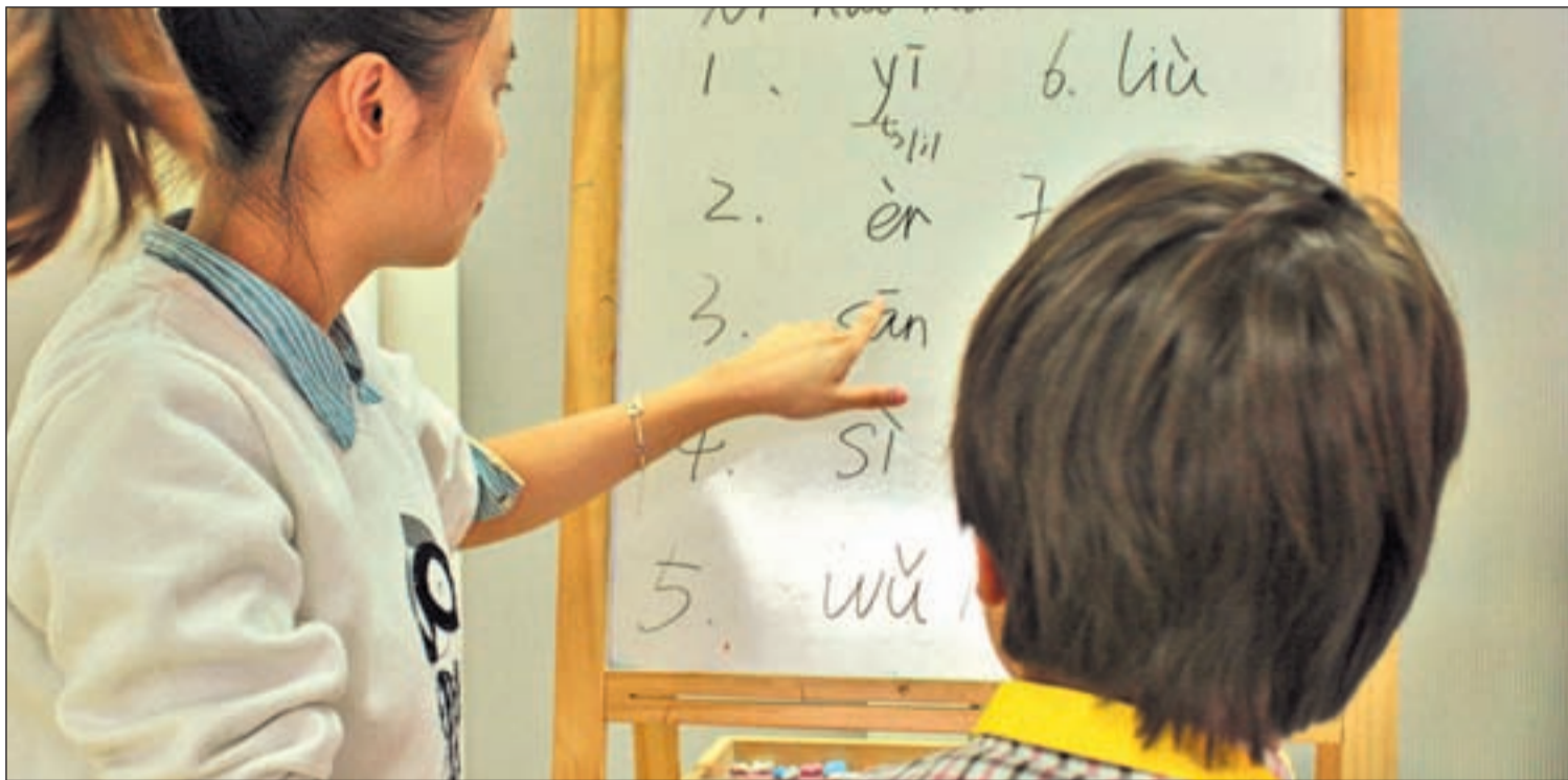
Clase de chino para niños en una de las academias Diverbo