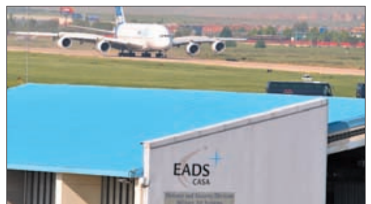
Imagen de la empresa EADS en Getafe

yecto de tanqueros de Airbus necesita crecer, y éste es el terreno que la empresa solicitaba. Un espacio que de aprobarse esta ampliación, pronto podrá escriturar EADS a su nombre. No lo habría podido hacer hasta ahora por los conflictos entre Comunidad y Ayuntamiento por el parque tecnológico.