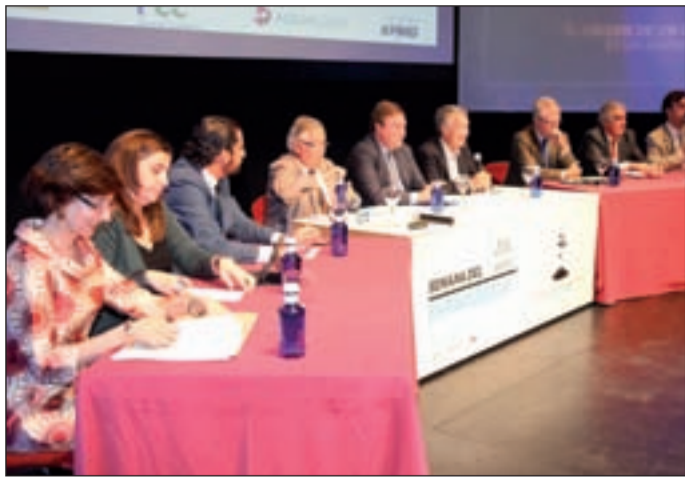
Mesa de debate de 'Emprendedores 2020'