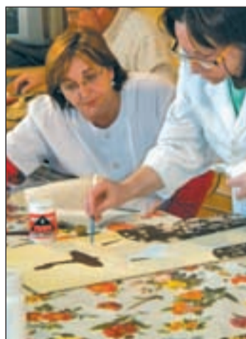
Mujeres haciendo manualidades

con talleres, desfiles, exposiciones y animaciones para transmitir el lema 'Do it Yourself' (hazlo tú mismo). Se intenta motivar a la gente para que fabriquen, con sus propias manos y tirando de su imaginación, complementos, adornos, etc. Así se fomenta el esfuerzo y la satisfacción personal. Además, vender lo que se fabrica también puede ser una forma de autoempleo.