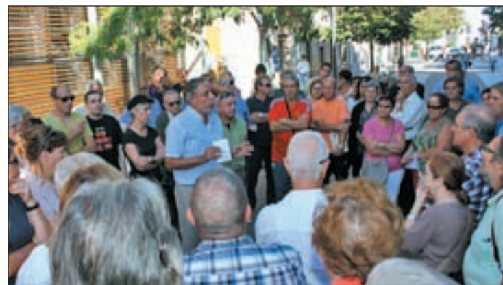
El alcalde rodeado por los vecinos afectados

Por el epicentro de la protesta han pasado caras conocidas en el panorama político, todos, con sello de IU, entre ellos, el Coordinador General, Cayo Lara, o el diputado Gaspar Llamazares. También estuvo el portavoz en el Ayuntamiento de Madrid, Ángel Pérez, y su homólogo en Coslada, Pedro San Frutos. "Hay que tener mucha valentía para ponerse en huelga de hambre sin fecha de finalización", dijo.