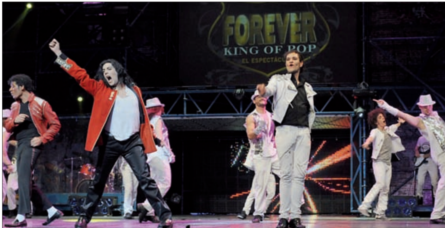
El doble de Michael Jackson junto con los bailarines en el escenario representando ‘Forever King of Pop’

Habrán descuentos para menores de 16 años y mayores de 65 y el día del espectador.