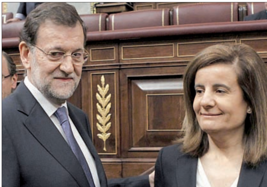
La ministra de Empleo asegura que "España está saliendo de la crisis"

El Gobierno no prevé tener que pedirlo al menos en lo que queda de 2012. Las subastas del