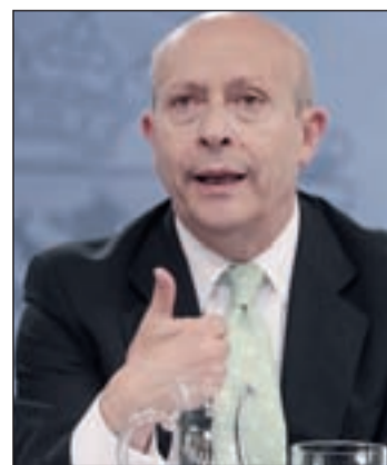
Wert no acudió al Congreso

ñolizar a los niños catalanes. Pero, según explicó en la tribuna la número dos del PSOE, Elena Valenciano, es consecuencia de toda su gestión. El PP, que ahora resta valor a la reprobación, presentó cinco la pasada legislatura y solo sacó adelante una en el Senado a Magdalena Álvarez. Y el PSOE, que ahora valora este