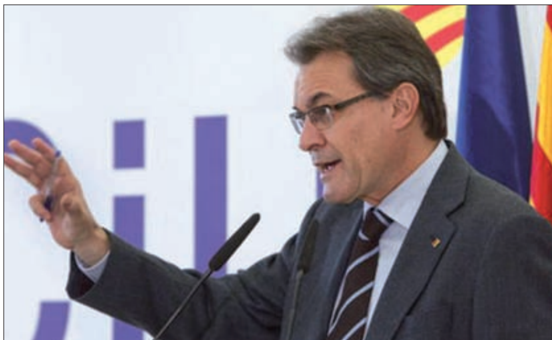
CIU presenta un programa centrado en la autodeterminación y el PSC hace un giro a la izquierda

Estas primeras reuniones tenían carácter exploratorio y pocas conclusiones han sacado los partidos de los encuentros. Serán en posteriores contactos más concretos donde empezarán a despejarse las incógnitas que ahora mismo están en el aire. Lo que sí ha quedado claro es que ni la formación de Patxi López ni Bildu obstaculizarán la elección de Urkullu como nuevo lehendakari. Por su parte, los populares ven posibles vías de acuerdos en la nueva legislatura vasca siempre que la prioridad del Gobierno que forme Íñigo Urkullu sea la economía y la creación de empleo. "Es momento de sumar para salir de la crisis", dijo el presidente del PP, Antonio Basagoiti.