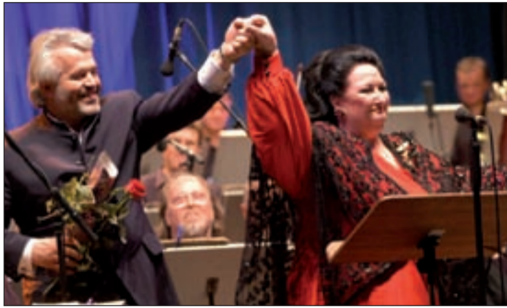
La soprano volverá a subirse a los escenarios