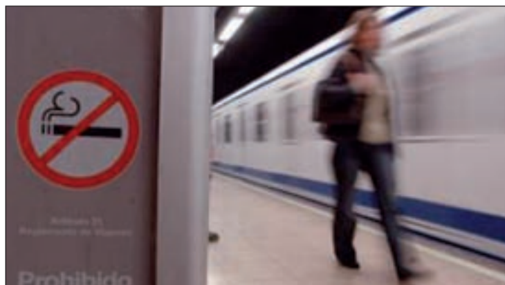
La incidencia de infarto se reduce en un 33 por ciento

Los investigadores evaluaron la incidencia de la enfermedad durante 18 meses, antes y después de la nueva ley. Al compa-