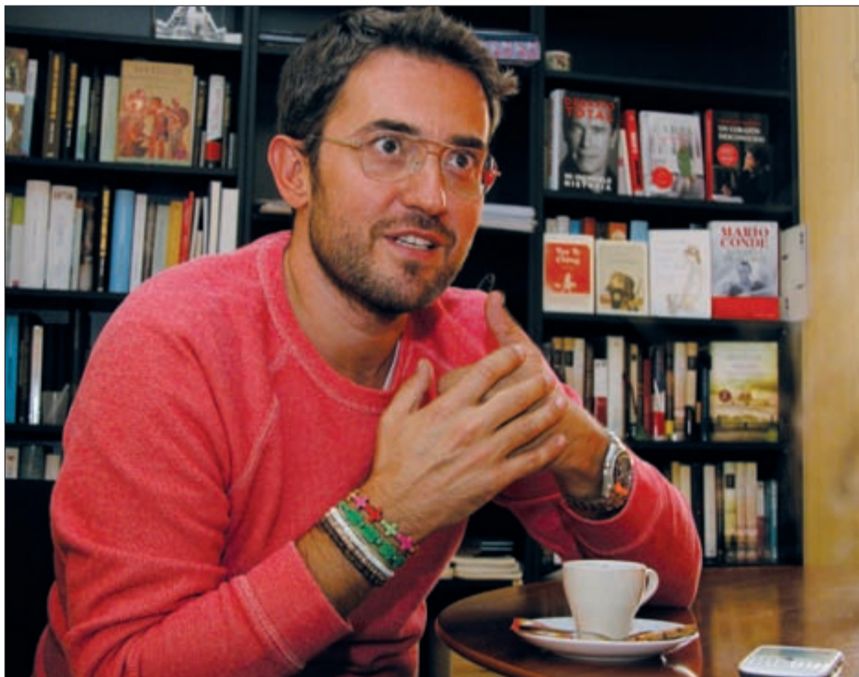
Màxim Huerta durante la entrevista