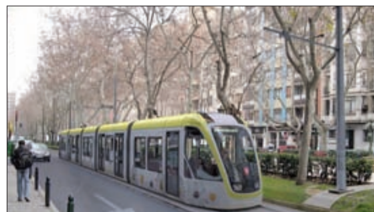
Zaragoza dispone de un nuevo tramo de tranvía