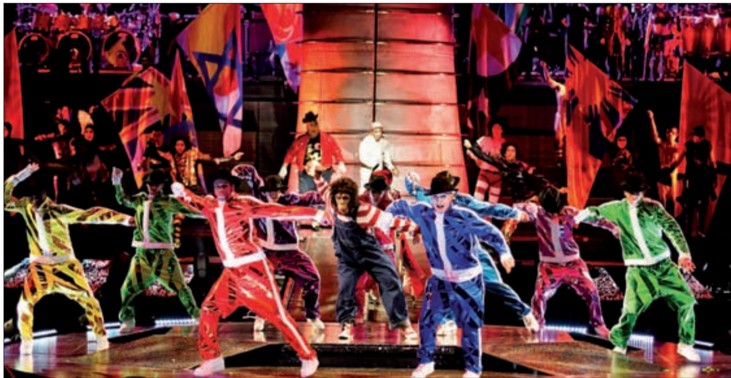
En el espectáculo tendrá como banda sonora 60 canciones del Rey del pop