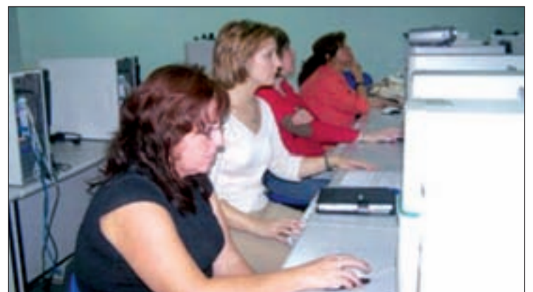
El ordenador es lo más usado para comprar por internet

mos son los artículos que tienen menos descuento en la red. Los usuarios que compran por internet lo hacen sobretodo a través del ordenador, un 81 por ciento, aunque las nuevas tecnologías cada vez van ganando más terreno. Los móviles lo utilizan un 16 por ciento y las tabletas un 3 por ciento.