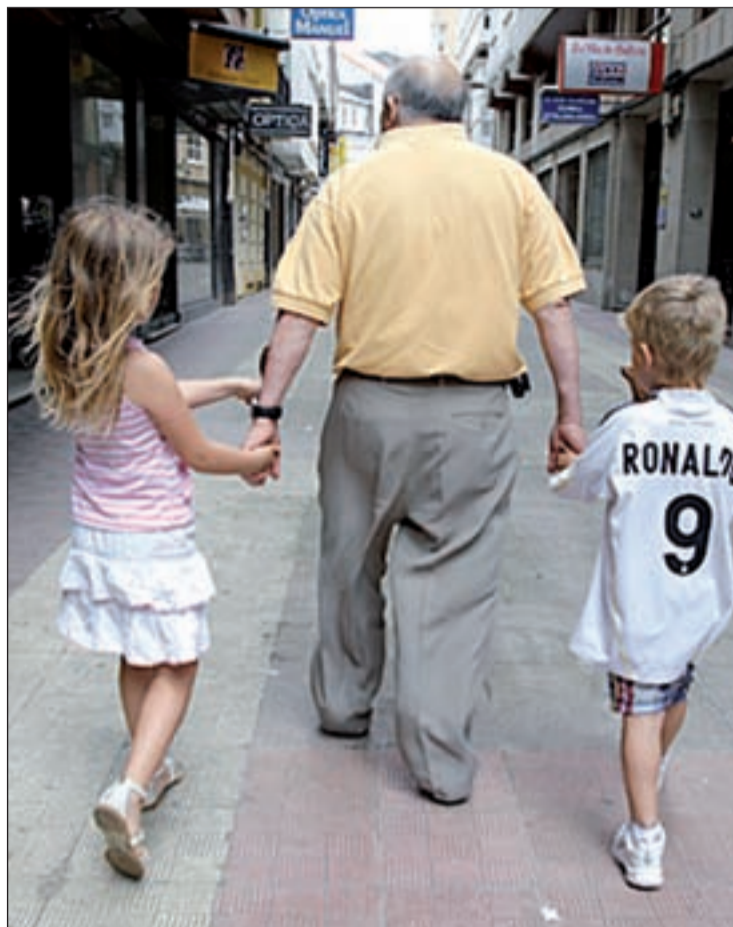
Los artículos de vestir, mobiliario y viajes, donde más ahorran

El sondeo muestra que lo más prescindible para las familias fueron los artículos de vestir y calzado, con una bajada del 4,6 por ciento, y ocio, espectáculos y cultura (caída del 4,6) mientras que el desembolso destinado a la vivienda aumentó, siendo un 4,3 por ciento mayor que en 2010.