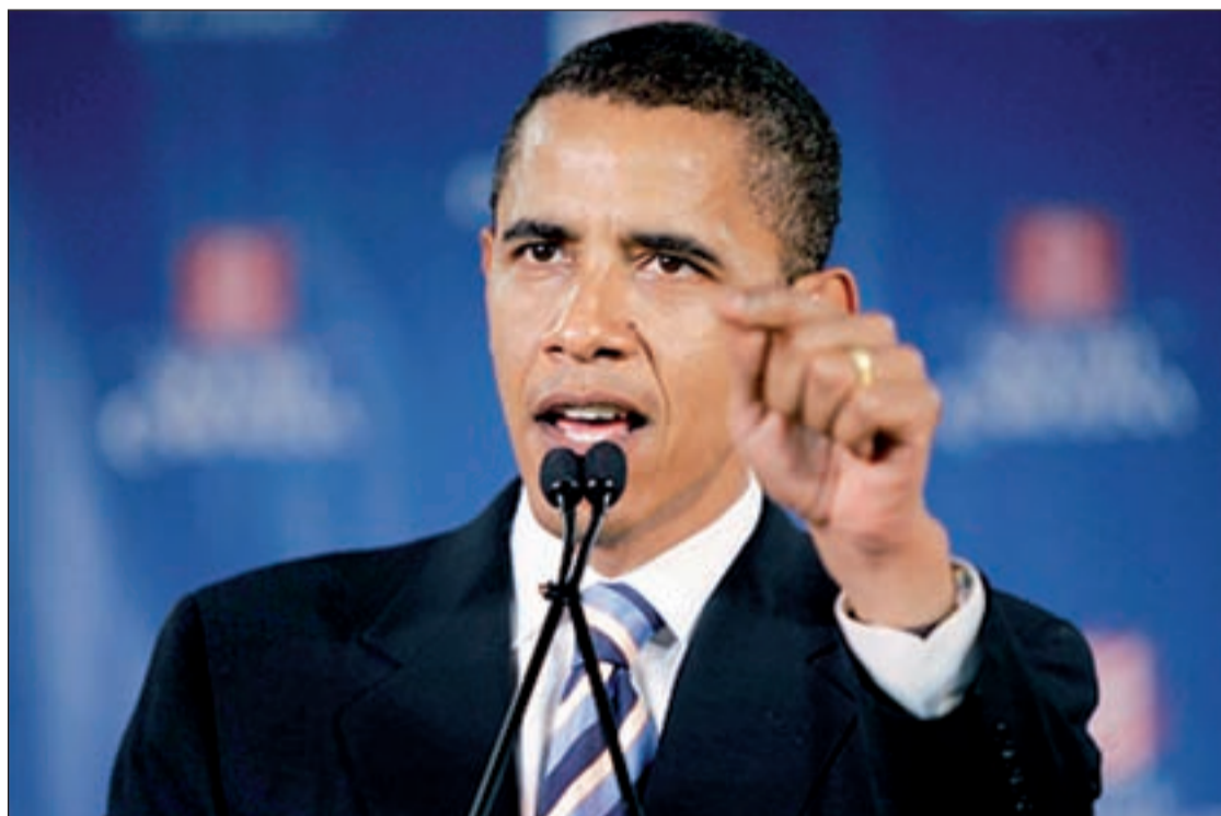
Los Estados de Virginia y Florida también juegan un papel importante

Pero a pesar del parón por el huracán 'Sandy' el día 6 todavía sigue ahí y el resultado y las especulaciones sobre el posible ganador siguen en el aire. La reelección de Obama pende de un hilo y ese hilo podría ser Ohio. No es la primera vez que el destino de la nación está en manos de un puñado de votos de ese Estado. Nunca antes un candidato republicano ha sido elegido presidente sin ganar en Ohio. Tampoco ningún demócrata lo ha con-