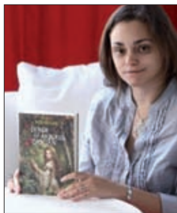
La autora, con el libro

tubre al 7 de noviembre. Las empresas que asisten, y que lo hacen bajo el paraguas 'Cinema from Spain', son Deaplaneta, Imagina International Sales, Latio Films, y acreditadas Castro PC, Gondola Films y Vertice Sales, así como Filmotech y Gran Canaria Film Commission.