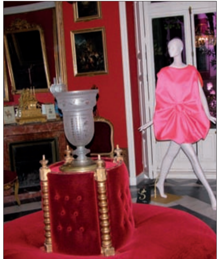
Vestido de cóctel en falla de seda de Ruiz de la Prada