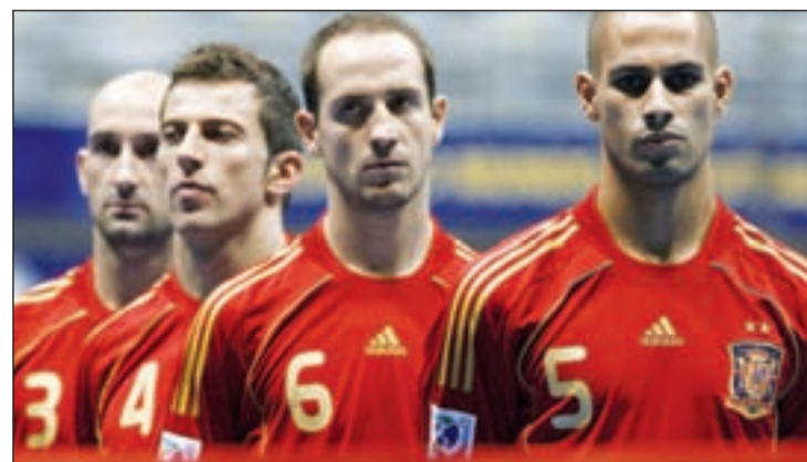
España busca su tercera estrella de campeón

parada es Irán. Este partido se jugará este viernes a partir de las tres de la tarde (hora española). Tres días después, el lunes día 5, España volverá a saltar a la pista para medirse a Panamá, para cerrar su andadura en la fase de grupos el miércoles día 8 ante Marruecos. Los octavos de final arrancan el domingo día 11.