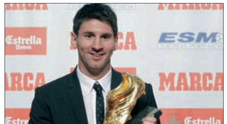
El argentino posa con su trofeo en la Antigua Fábrica de Damm

goles", explicó Leo Messi durante el acto celebrado en la Antigua Fábrica de Damm de la Ciudad Condal. Cincuenta son los goles que han llevado al jugador a conseguir su segunda 'Bota de Oro' con tan solo 25 años, aunque aseguró no quedarse con ninguno en concreto. "No elijo uno, siempre miro los más importantes, como los de la Supercopa, Mundialito, Copa, son los que más recuerdo por la importancia", indicó la 'Pulga', quien lleva cinco trofeos individuales.