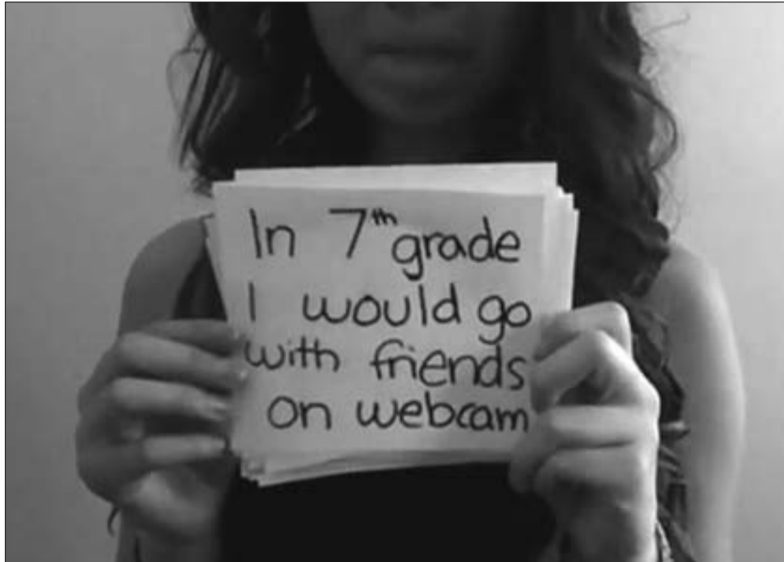
El 11,6% de los adolescentes ha sufrido maltrato psicológico a través de la red

El acoso no acabó. Cada día veía nuevas fotos colgadas en la red social y mensajes diciendo