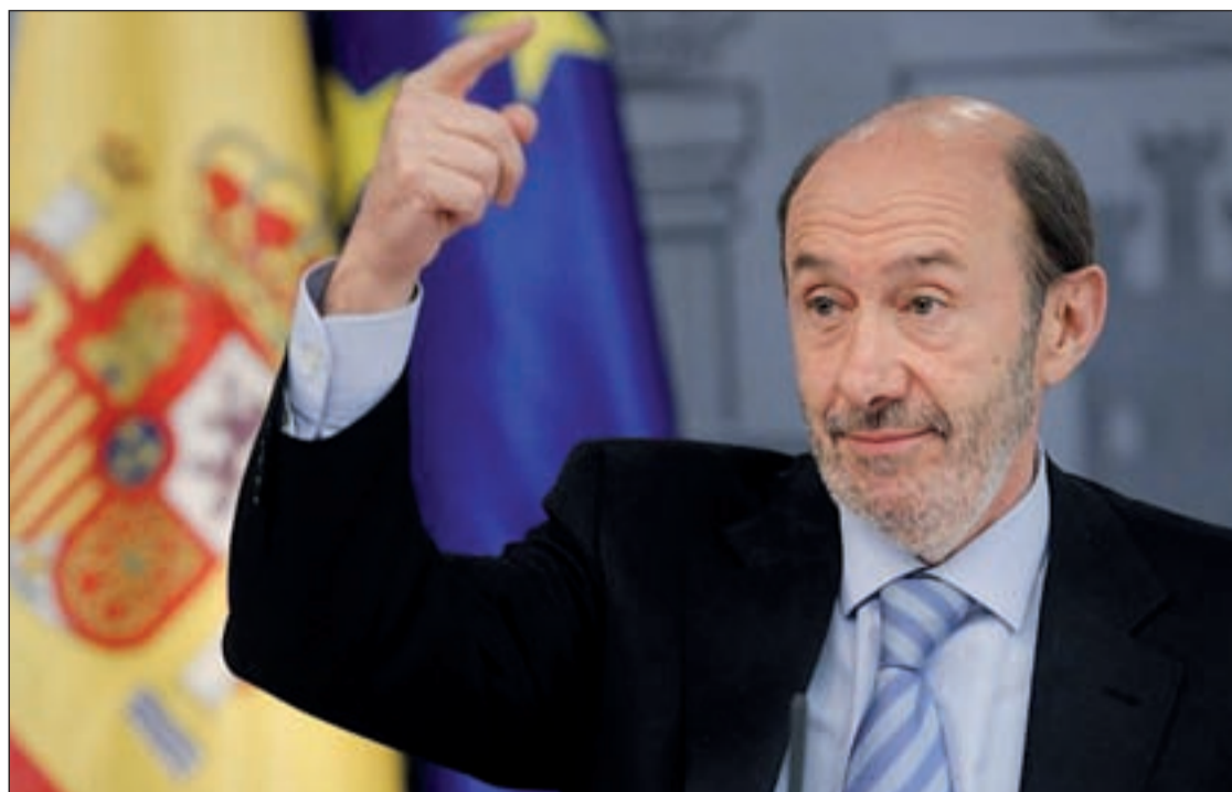
Rubalcaba asegura que siente el apoyo del partido