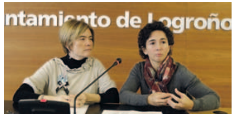
Presentación de la actividad en rueda de prensa.