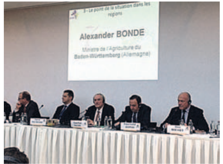
Reunión convocada por la AREV.

CON EL APOYO DEL PSOE El secretario general del PSOE