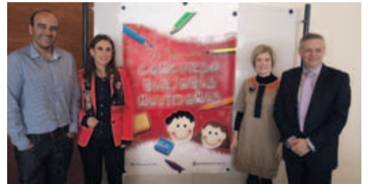
Presentación del '26 Concurso de Tarjetas Navideñas'.

centros realizarán una selección de dibujos que remitirán al Ayuntamiento de Logroño. Una vez finalizada esta primera fase, se convocará al jurado para el análisis y fallo de todas las tarjetas remitidas por los centros escolares de Logroño. Los miembros del jurado seleccionarán la tarjeta ganadora, que se convertirá en la felicitación oficial del Ayuntamiento de Logroño para esta Navidad. La fecha límite para presentar los trabajos será el 20 de noviembre.