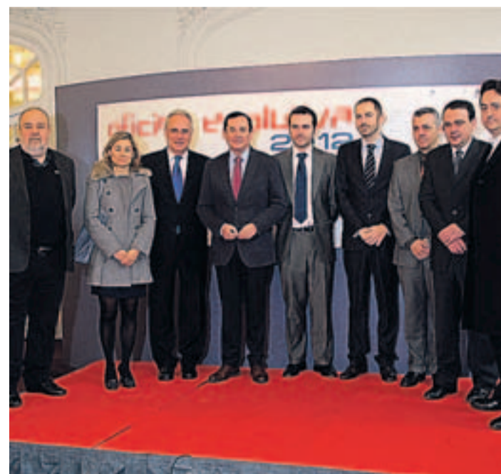
Inauguración del Salón en el Círculo Logroñés.

La V Edición del Salón de Informática, Comunicaciones y Equipamiento 'Oficina Evolutiva 2012' que organiza el grupo Pancorbo, con la colaboración de la Consejería de Industria, Innovación y Empleo, entre otras instituciones, se celebró del 6 al 8 de noviembre con el objetivo dar a conocer las últimas tendencias en sistemas informáticos, soluciones software, comunicaciones y espacios de trabajo. Su programa contempló 16 conferencias que abordan temas como diseño de espacios de trabajo, protección de la información, tecnologías 3D, comercio electrónico, herramientas de gestión y ocho talleres sobre uso e implantación de tecnologías de la información sobre temas como herramientas para emprendedores o tablets.