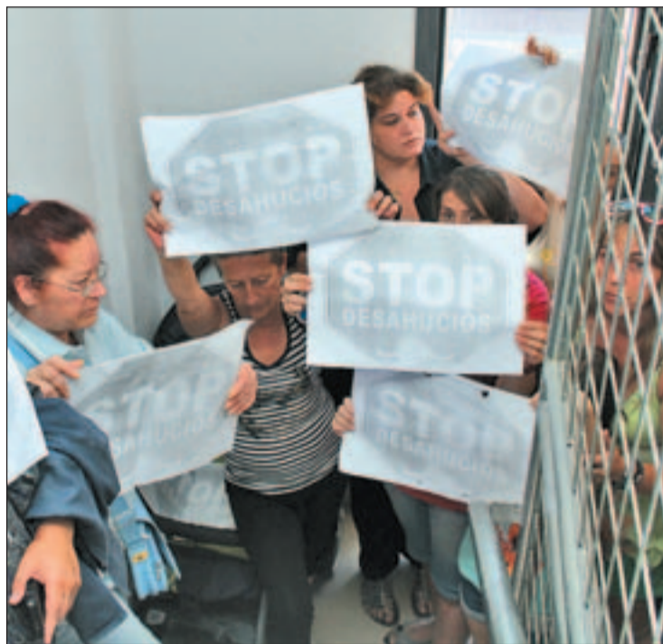
Se han ejecutado 400.000 desahucios desde que empezó la crisis

Los desahucios son una de las caras más tristes de esta crisis económica. Es un drama que ha dejado en la calle a miles de familias españolas. Un total de 400.000 desahucios desde que empezó el declive de la economía. Son muchas las personas anónimas que han creado plataformas para impedir el desalojamiento de gente que tiene nombre y apellidos pero a quienes pocos habían dirigido su mirada y su atención. Hasta ahora. Hace unos días saltaba a los medios la noticia de que un hombre se había suicidado horas antes de que fuera a ser desahuciado de su vivienda por una orden judicial de desahucio. Y este drama volvía a centrar los debates y también, quizá por primera vez, la agenda política. Los dos grandes partidos políti-