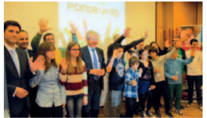
Presentación de la Olimpiada Solidaria.

Las cifras han ido mejorando año tras año y en la última edición se consiguió implicar a más de 54.000 estudiantes y superar la barrera de los 500.000 euros