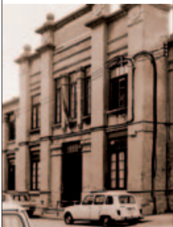
Biblioteca Rafael Azcona. 1970.