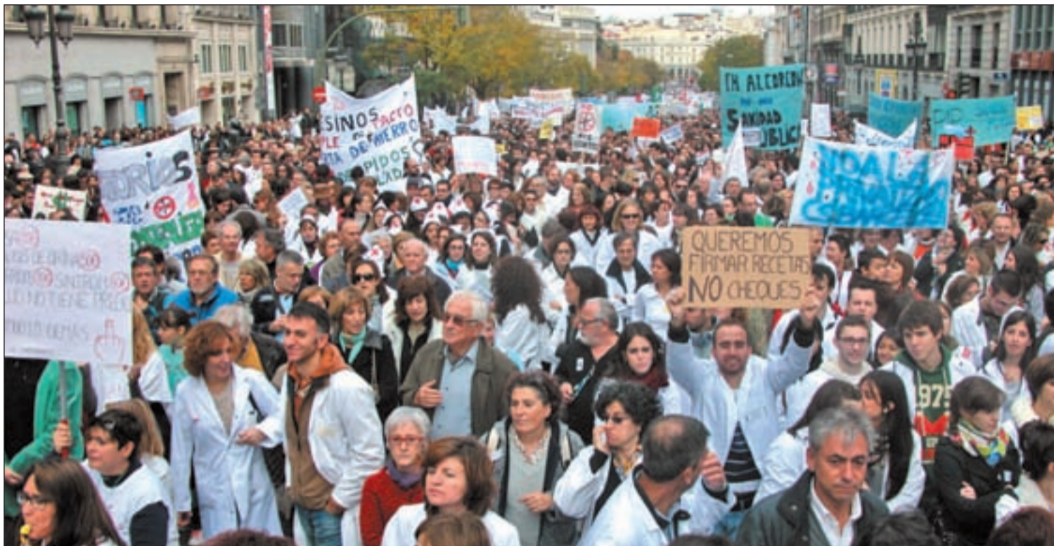
Miles de personas se manifestaron por las calles de Madrid en contra de las medidas de la Comunidad de Madrid sobre sanidad