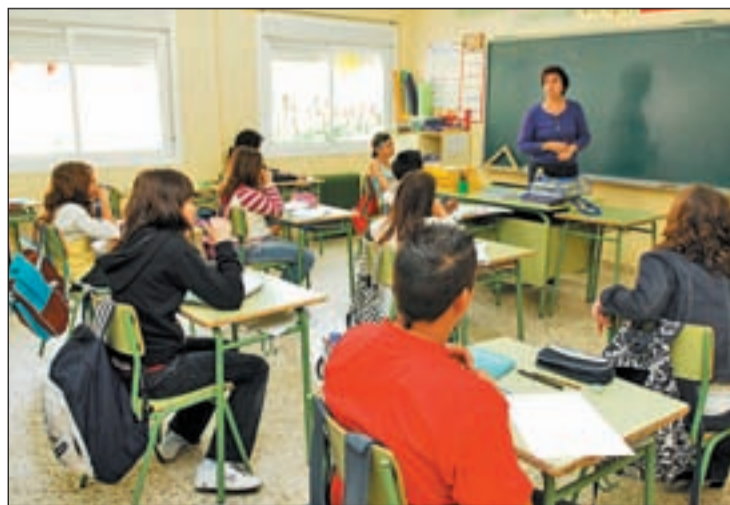
La educación en igualdad desde la infancia es fundamental GENTE

Por otro lado, el teatro es una buena forma de educar contra los malos tratos. En esta tónica,