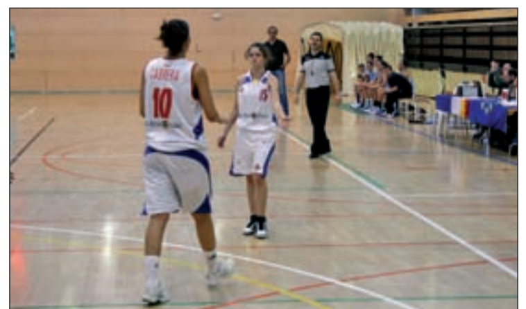
Las roceñas vuelven a jugar ante su público

Las insulares se dieron la primera alegría de la temporada quince días atrás, con motivo de su visita a la cancha del colista Grupo EM Leganés. Sin embargo, ese triunfo no se vio secundado la semana pasada. El Universidad del País Vasco se llevó la victoria del Pabellón Municipal de Santa Cruz, convirtiéndose en el tercer equipo en la presente temporada que asalta la cancha insular. Con ese tropiezo, las tinerfeñas están empatadas