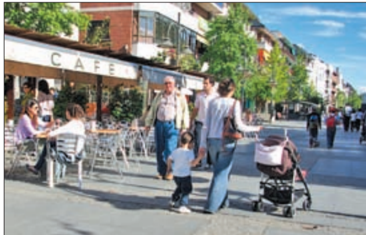
Majadahonda es una de las ciudades con más descuentos GENTE

En contrapunto al bajo crecimiento del gasto medio por hogar, el de la vivienda se dispara casi un 20% con respecto a 2006