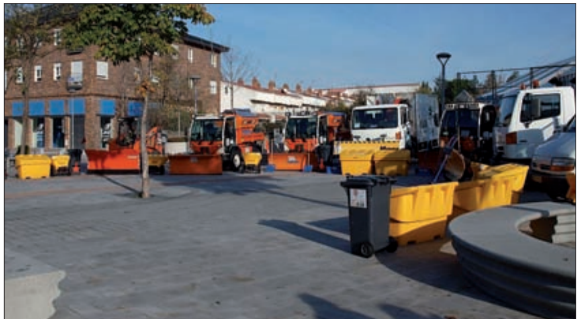
Parte del operativo que ha preparado el Ayuntamiento de Collado Villalba en el 'Plan de Inclemencias'

Los usuarios decidieron crear esta plataforma como apoyo al encierro de los trabajadores del centro sanitario, que ya llevan más de 15 días con su protesta.