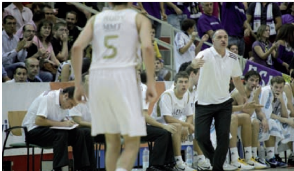
Los blancos continúan sin conocer la derrota en el torneo nacional GENTE

LIGA ACB JUEGAN EN LA PISTA DEL ASSIGNIA MANRESA Y DEL CAJASOL