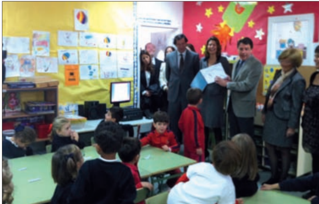
El presidente regional y la consejera de Educación durante la visita al colegio 'El Cantizal' de Las Rozas