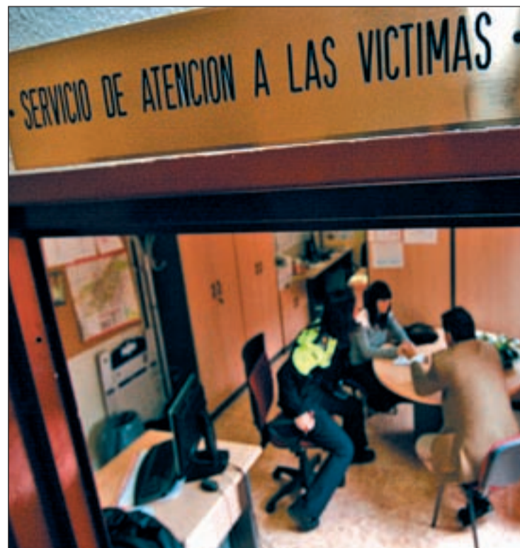
Servicio de atención a las víctimas de la Comunidad GENTE

Por otra parte, la Comunidad no considera sólo víctimas de la violencia de género a las mujeres agredidas, sino también a sus hijos y a las personas que dependen de ellas. Por eso, ha puesto en marcha varios programas de atención psicológica y social que también han ayudado a muchos menores. El primero de ellos es el programa 'MIRA', un centro de atención psicosocial; otro de ellos es el programa 'ATIENDE', que colabora con la Consejería de Sanidad y al que se derivan numerosos pacientes; por último, también existe un servicio de psicólogos infantiles itinerantes. Además, existen dos centros no residenciales: uno de ellos, el