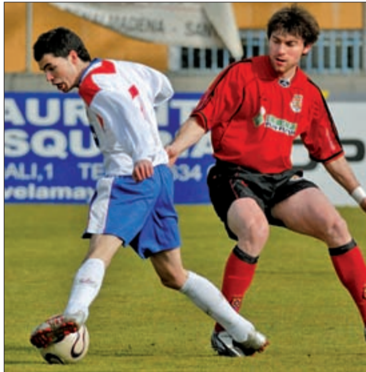
No corren buenos tiempos para los majariegos