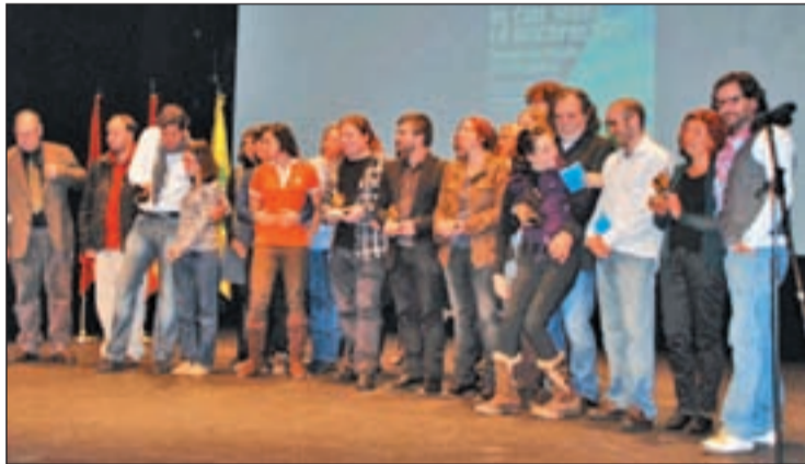
Imagen del Festival de Cine sobre Discapacidad de 2011, en Villalba

Las obras que se verán durante el Festival no superarán los 90 minutos y han sido realizadas antes del 2009. El certamen se celebrará en la Casa de la Cultura de Collado Villalba, hasta el sábado 24 de noviembre.