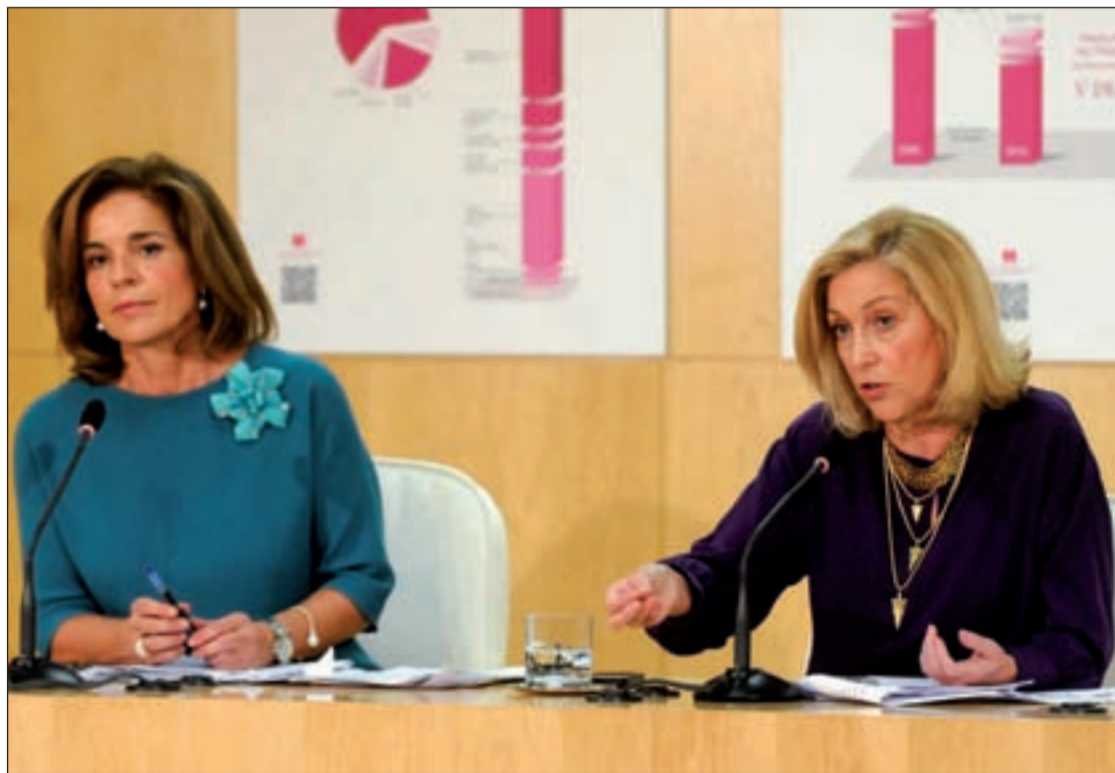
La alcaldesa, Ana Botella, junto a Concepción Dancausa, delegada de Hacienda, el pasado lunes

Una y otra, Ana Botella y Concepción Dancausa, insisten en que los presupuestos para el próximo año, enmarcados dentro del Plan de Ajuste 2012-2022 aprobado en marzo, conseguirán, "sin renunciar a la austeridad necesaria, mantener todos los servicios esenciales que ha-