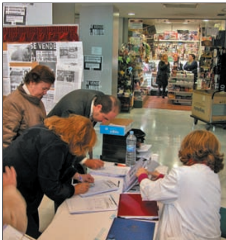
Recogida de firmas en el hospital