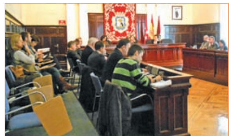
Pleno reciente en Tetuán, uno de los distritos menos recortados

menta su presupuesto (un 3,08%, con 39,1 millones), además de Tetuán y Retiro, que asumirán un recorte de apenas el 0,51% y 0,67% respectivamente. A Centro se destinarán 24,5 millones, 24,2 a Arganzuela, y 24,8 a Moncloa. Chamartín se queda con 16,67 millones, Fuencarral con 30,9, Hortaleza con 24,6 y Barajas con 11,63.