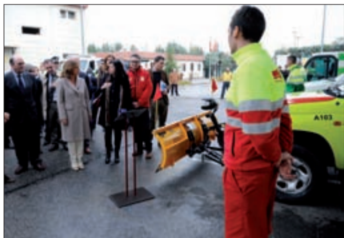
Un momento de la presentación del plan, en el Selur

EL 'PLAN NEVADA' UTILIZARÁ DE NUEVO LA SALMUERA