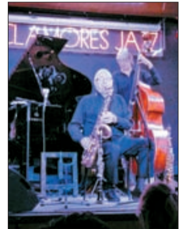
Actuación en la sala

Algunos de los temas que nos podemos encontrar en el CD son