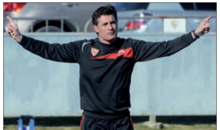
El equipo de Michel examina al de Simeone

El otro representante en la máxima categoría, el Rayo Vallecano, tiene ante sí una semana que marcará su futuro a corto plazo. Para empezar, los franjirrojos reciben el sábado al Mallorca en un horario que comienza a ser habitual en Valle-