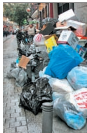
Calle de la Cruz