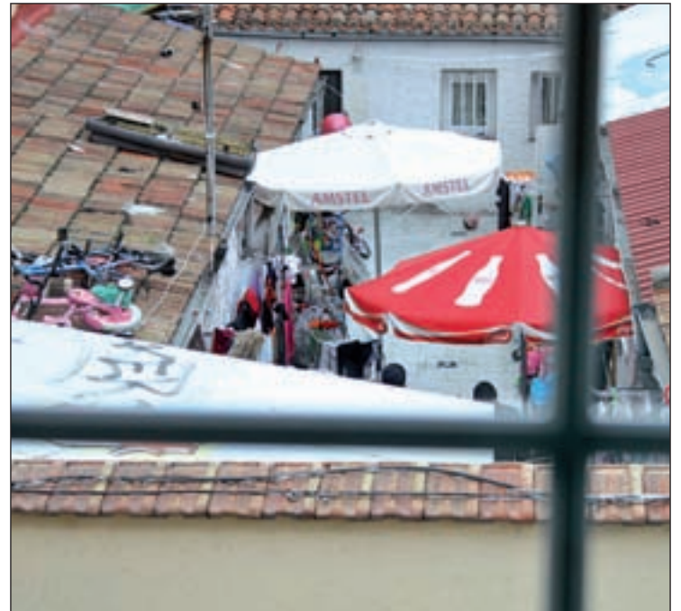
Una de las zonas afectadas

Denuncian comportamientos incívicos "que se agravan en verano, porque se ponen de tertulia en la calle hasta bien entrada