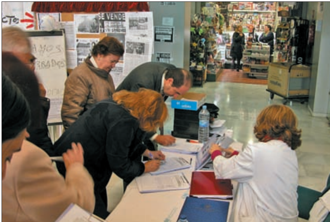
Recogida de firmas en el centro sanitario

Los trabajadores de La Princesa reciben con optimismo y precaución el anuncio de Lasquetty sobre el mantenimiento de la atención general Pág. 10