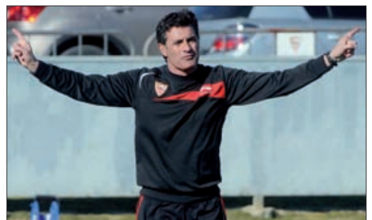
El equipo de Michel examina al de Simeone

El otro representante en la máxima categoría, el Rayo Vallecano, tiene ante sí una semana que marcará su futuro a corto plazo. Para empezar, los franjirrojos reciben el sábado al Mallorca en un horario que comienza a ser habitual en Valle-