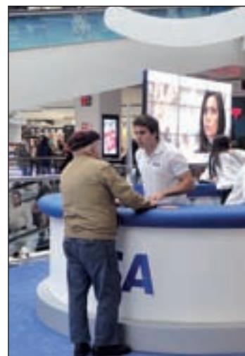
'Stand' de Visa en La Vaguada

La tecnología de pago sin contacto de VISA ya está disponible en muchos países europeos como Francia, Reino Unido, Polonia o Turquía, y en de-