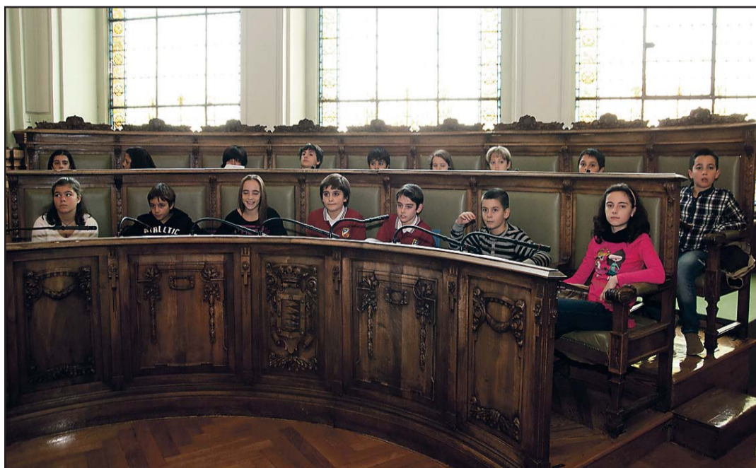
El Pleno Municipal acogió un acto con motivo del Día Internacional de los Derechos del Niño.

En la conmemoración, el vicepresidente de Unicef recordó que para conseguir el reconocimiento hay un jurado "muy riguroso" compuesto por las instituciones que impulsan el proyecto de las ciudades 'amigas de la infancia' y se ha demostrado que el Ayuntamiento de Valladolid tiene «como prioridad» que