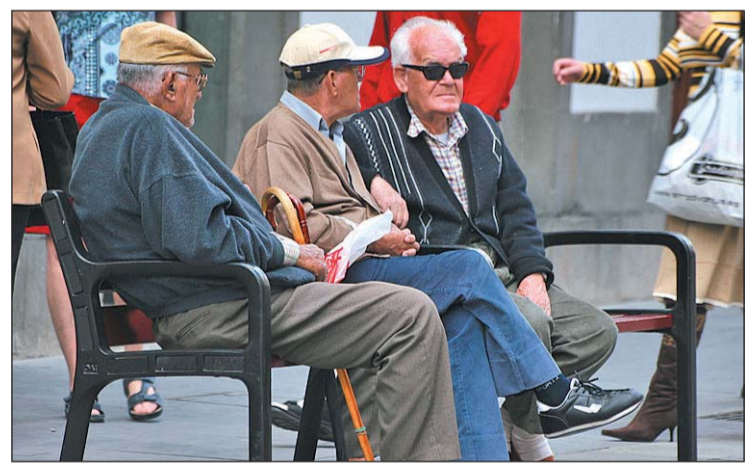
Los jubilados verán incrementada sus pensiones

Burgos recordó que desde el Ministerio de Hacienda ya se dijo "con claridad" que se puede hacer "hueco" en las cuentas para subsanar cualquier desviación de las cuentas de la Seguridad Social, a lo que añadió que el sistema ya "ha hecho hueco a las cuentas del Estado" asumiendo los pagos de complementos a mínimos durante los últimos años y que "eso también es importante que se reco-