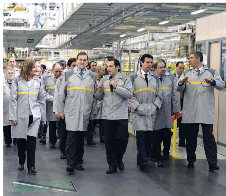
Autoridades y responsables de Renault España recorrieron las factorías.

La compañía ha valorado que la respuesta de las plantas de Renault en España, frente a las de otros países en relación a la asignación de estos planes, se ha basado en "compromisos muy concretos sobre inversiones, carga de trabajo y empleo, un acuerdo social muy exigente y muy responsable que expresa el compromiso de unos trabajadores bien formados, y el apoyo coordinado de las Administraciones".