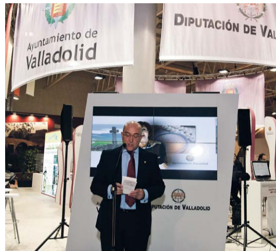
El presidente de la Diputación, Jesús J. Carnero.