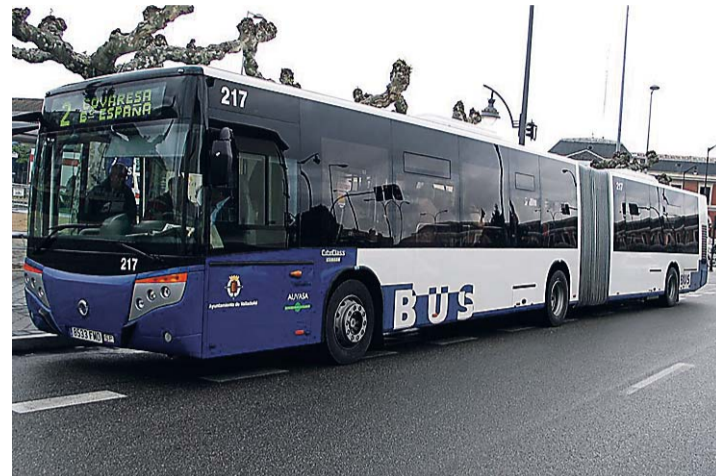
El autobús volverá a subir otra vez.

La compañía espera que el próximo ejercicio se suban al