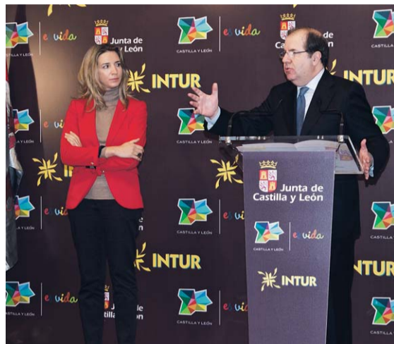
Juan Vicente Herrera, presidente de la Junta.

TURISMO CON NIÑOS. Del mismo modo, el Ayuntamiento de Valladolid ha preparado diversas acciones dirigidas a promocionar el turismo familiar. Así, según explicó su alcalde, a través de la Sociedad Mixta para la Promoción del Turismo de Valladolid han diseñado una serie de actividades para las familias. Bajo la marca «Valladolid con niños», la ciudad ofrecerá una serie de actividades periódicas como talleres temáticos de miniesculturas e ilustración, de gastronomía, de cine, de cuentos