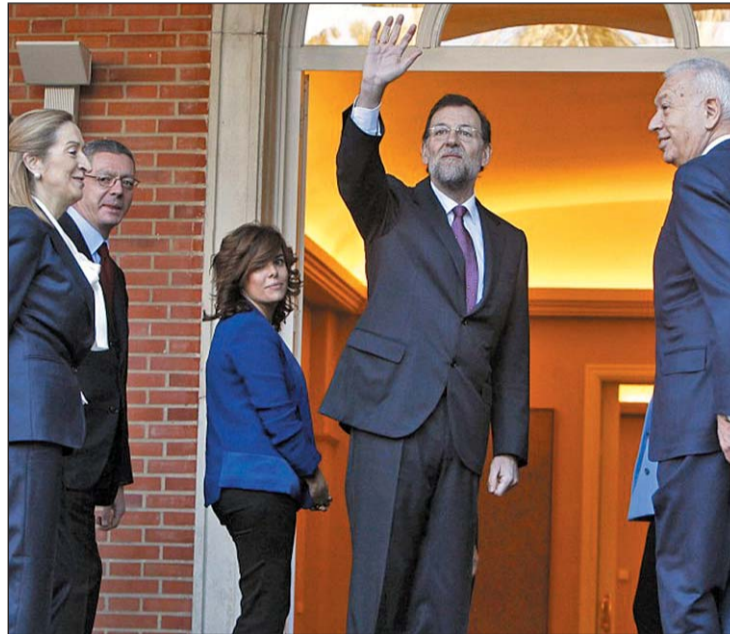
Mariano Rajoy con su equipo de gobierno hace un año

de nuevas oposiciones. En abril, a través de una nota de prensa, el Ejecutivo anunciaba un recorte de 10.000 millones (7.000 en sanidad y 3.000 en educación), medidas como el copago farmacéutico, dejar sin tarjeta sanitaria a los inmigrantes sin papeles o la salida de 471 fármacos de la lista de subvencionados. Pero los recortes no acabaron ahí. En julio, Rajoy subió el IVA, pese a que miembros del Gobierno habían dejado claro que ese impuesto no lo iban a tocar. Hace unas semanas se presentaron los Presupuestos del Estado para 2013, que contemplan más recortes. La partida sanitaria baja un 23 por ciento y la educativa, un 12 por ciento.