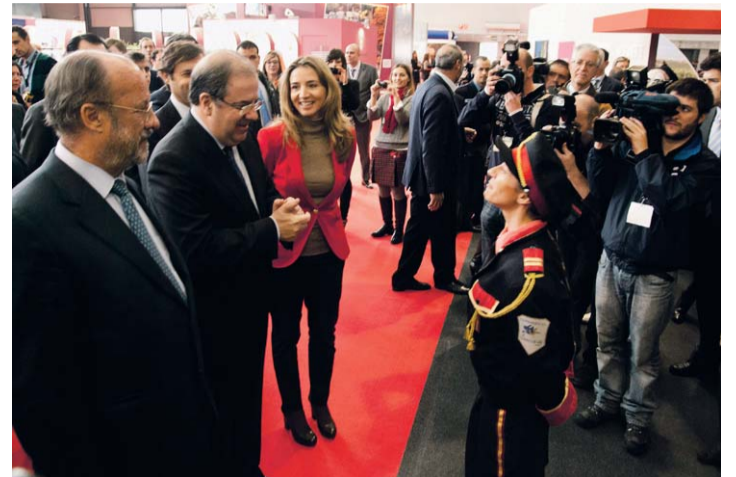
Juan Vicente Herrera durante su visita a Intur.

"Este museo no se mira, se vive", escuchaba el jefe del Ejecutivo y toda la comitiva que le acompañaba durante la proyección de varios anuncios publicitarios de Castilla y León en una pantalla del escenario principal del nuevo expositor de la Comunidad, elaborado por la empresa vallisoletana Red Producciones, que queda recogido por el gran logo de la Marca Castilla y León, cuyos colores se reparten por los 800 metros cuadrados que ocupa en el pabellón 4 de la Feria de Valladolid.