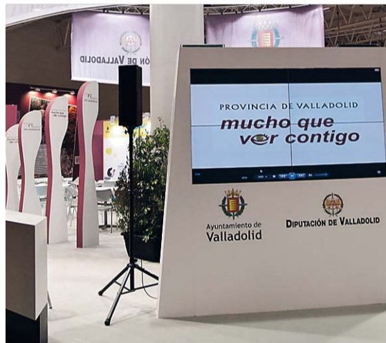
Stand del Ayuntamiento y de la Diputación.