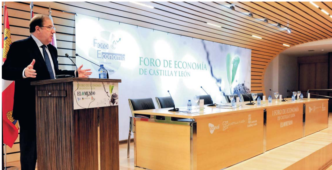
El presidente de la Junta, Juan Vicente Herrera, en un momento de su intervención en el I Foro de Economía.

Para la adquisición de las vacunas, Castilla y León se ha sumado al acuerdo suscrito entre el Ministerio de Sanidad, Servicios Sociales e Igualdad y la mayoría de las comunidades autónomas, orientado a una selección de suministradores para realizar una compra centralizada que permita obtener una contención en el gasto a través de mejores condiciones en la adquisición conjunta de estos suministros. De esta forma, "la Consejería ha obtenido un ahorro estimado entre el 13,5% y el 14,5%, porcentaje que se verá aumentado tras los correspondientes procesos de adjudicación". Sanidad prevé disponer de las dosis necesarias para la aplicación de las pautas vacunales establecidas para unos 105.000 niños de entre 0 y 14 años; atender las necesidades referidas a la vacunación internacional de adultos y las de los grupos de riesgo social y sanitario para los que está recomendada la vacunación frente a la gripe y al neumococo; y para adoptar las medidas correctoras oportunas en personas inmigrantes o mal vacunadas.