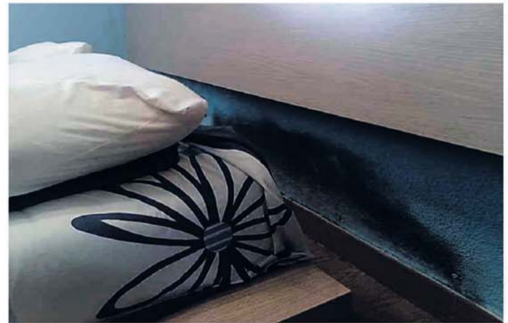
Problemas de humedades por capilaridad

Se han realizado estudios científicos sobre adolescentes que sufren afecciones respiratorias, dando como resultado un 83% de asma, bronquitis asmáticas y bronquitis crónicas y un 87% de rinitis crónicas, que alcanzan a jóvenes que viven en habitaciones demasiado húmedas. De un 20 a un 30% de nosotros sufrimos alergias respiratorias, ¡dos veces más que hace 20 años!. Edouard Drouhet, jefe de