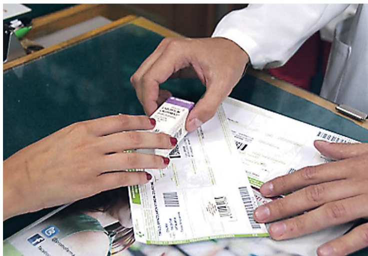
Sacyl empezará a devolver la próxima semana el dinero del copago.

Para pedirlo, la solicitud estará disponible en los centros de salud, en las gerencias de salud de área, en la Gerencia Regional de Salud y en internet. Además, la solicitud tendrá que dirigirse al gerente de salud de área de la provincia donde el paciente tenga asignado su médico de Atención Primaria, y podrá presentarse en los registros de las gerencias de salud de área, así como en los servicios de información y atención al ciudadano y la función de registro en la Administración de la