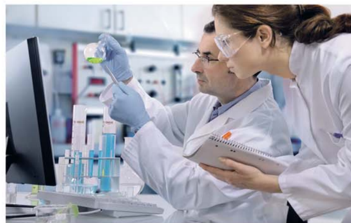
Nuestros laboratorios siempre a la vanguardia

micología en el instituto CASA HUMEDA, AMBIENTE INSANO de la Salud Pública Louis Pasteur, explica este aumento por nuestro modo de vida: "Vivimos más en el interior, en casa o en el despacho. Desde los años 60, tendemos a un exceso de aislamiento para no dejar escapar el calor y además no se airea suficientemente".