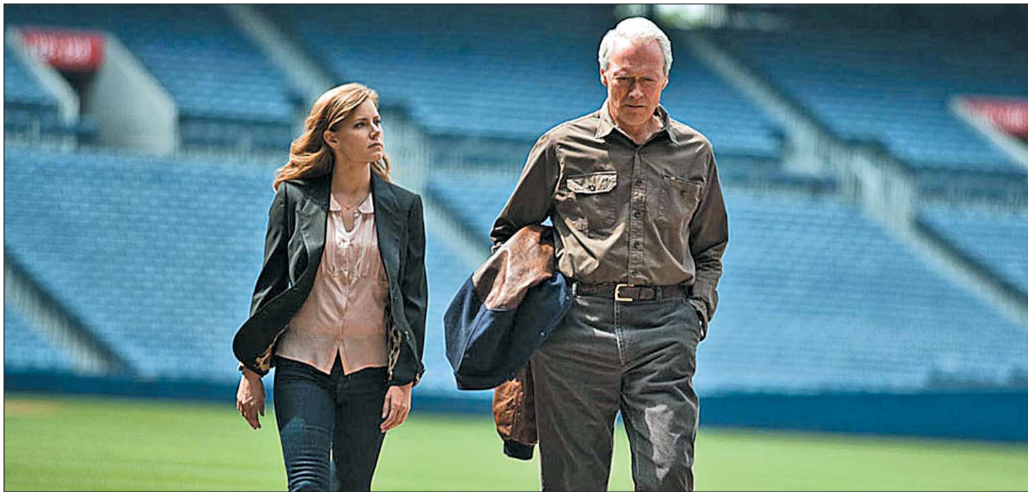
Clint Eastwood y Amy Adams, en 'Golpe de efecto'