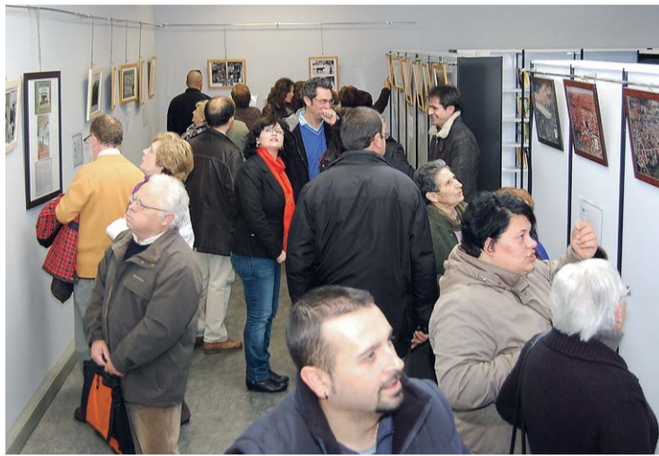
Tras la inauguración, numerosos vecinos visitaron la exposición.