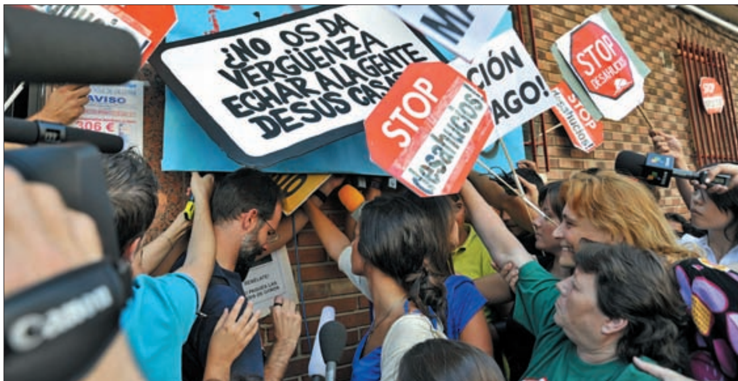
El beneficiario deberá cumplir unos requisitos económicos y sociales para acogerse a la medida