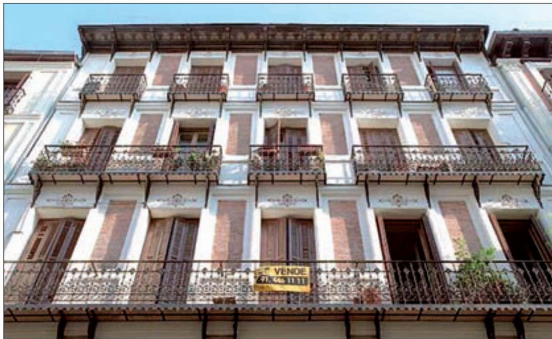
Diciembre es un mes importante para la venta de viviendas GENTE