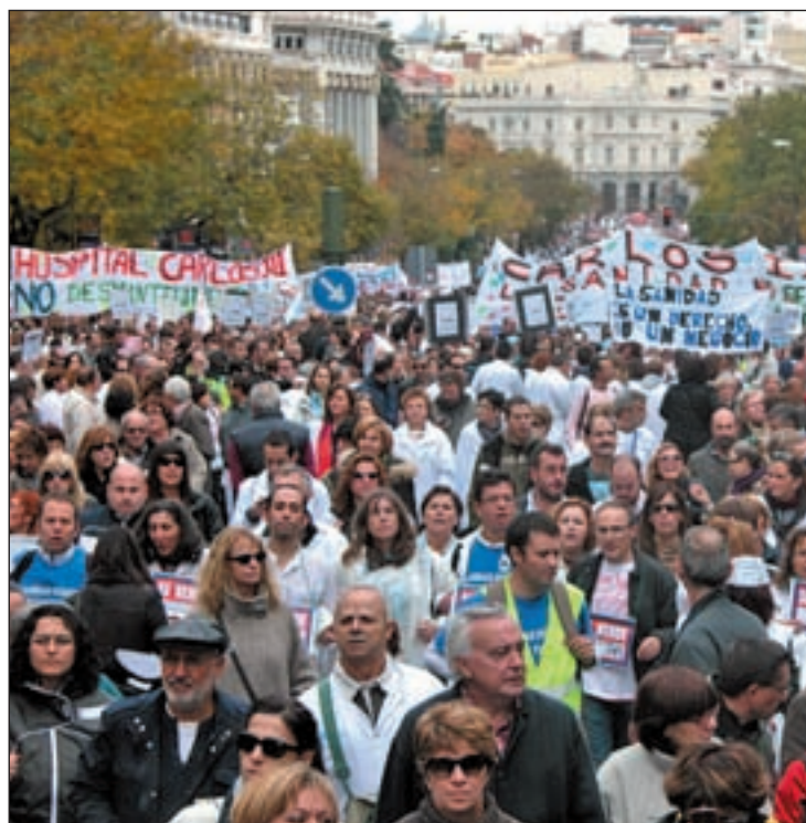
Manifestantes en la Calle Alcalá

La guerra de cifras en el seguimiento de las jornadas de esta huelga sanitaria es ya algo habitual. La Consejería de Sanidad estimó que la tercera jornada (martes 4) fue secundada por el 16,85% de los profesionales del sector. Éstos son datos que contrastan con los ofrecidos por la Asociación de Facultativos Especialistas de Madrid (Afem), desde donde estiman un 77% de seguimiento, o los de los sindicatos, que cifran el seguimiento en un 90%. Lo mismo ocurrió durante la cuarta jornada (miércoles 5), cuando Sanidad cifró el