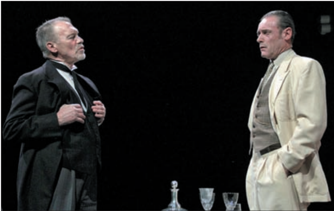
Ir al teatro es una buena forma de disfrutar este puente