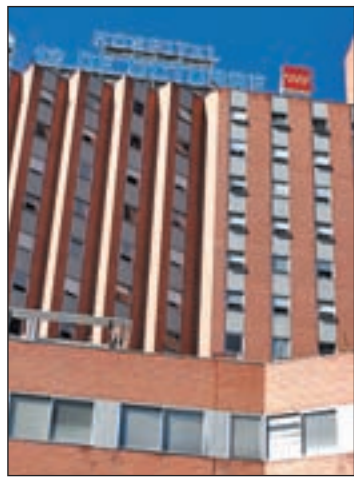
Hospital 12 de Octubre