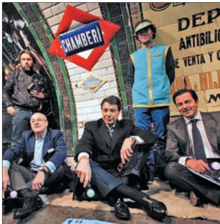
Un momento de la visita

Mientras recorren el pasillo, aparecerá una cortina de vapor de agua que dará paso al otro mundo y en una supuesta pared, aparecerán descendiendo las letras y los símbolos de PlayStation. Al cruzar al otro lado de la cortina de vapor de agua, entra-