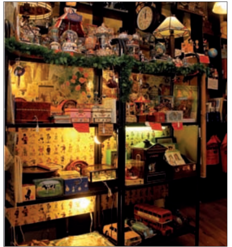
Interior de Curiosity Shop, en la calle Latoneros, 1

Mientras hablamos, varios clientes se enganchan al escaparate. "Busco un carrusel para un niño, que tenga movimiento, para que lo pueda disfrutar cuando crezca, y me gustaría también un caballo de esos que hacían de balancín", pide Isabel, que disfruta de las compras navideñas. Su primer juguete, recuerda, fue una muñeca vestida de enfermera, de cartón piedra. Le hacemos la misma pregunta a Milagros, otra interesada que abre la puerta de Curiosity Shop. "Mi primer