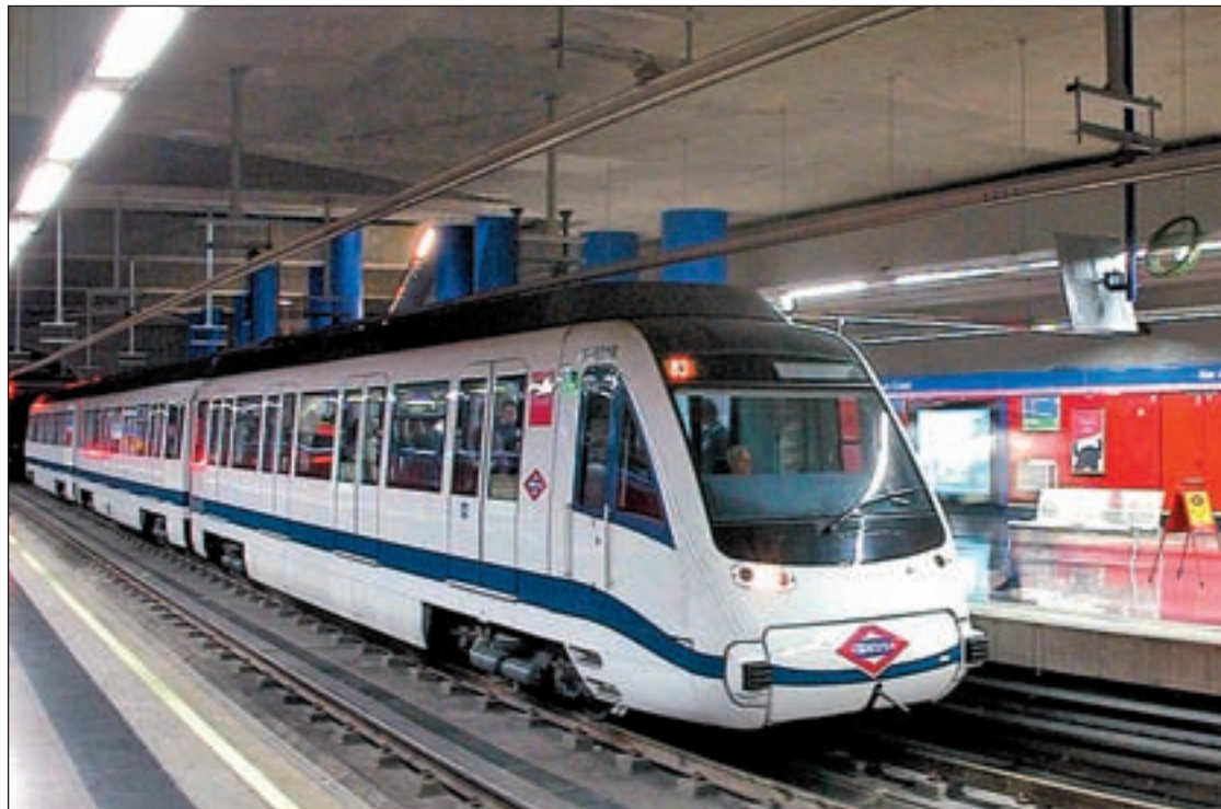
Una de las estaciones de Metro de Madrid

El horario fijado para los paros del día de Nochebuena y del día 26 será de 5.50 a 8.50 horas. Ya el día 27 de diciembre, los paros parciales se desarrollarán de 17.30 a 20.30 horas. Ese mismo día también habrá una manifestación de trabajadores a partir