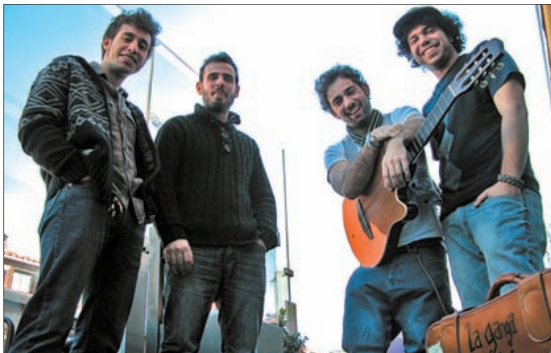
24 Frames (izquierda) y La Ganga Calé (derecha) en la terraza del Mercado de San Antón

Una galería de arte, situada en la planta superior, o incluso la propia entrada del mercado, acogen este calendario de actuaciones desde el pasado mes de agosto. Por el primer ciclo ya pasó La Ganga Calé, un grupo de rumba fusión que repetirá el próximo 19 de diciembre (19:00). “La Musiquería es el puesto que falta en muchos mercados, al lado de la carnicería o de la pescadería. Participamos en el anterior ciclo