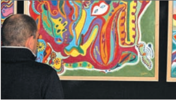
Una de las obras expuestas