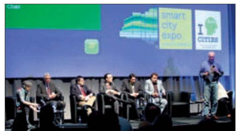
El Smart City Expo acogió a numerosos visitantes

marco de este congreso se dio a conocer la noticia de que España aparece por primera vez en el informe del Instituto Europeo de Fibra Óptica como uno de los 22 países europeos donde más del 1 % de los hogares dispone de fibra óptica. Con esta tecnología, los ciudadanos cada vez podrán tener más servicios al alcance de la mano sin salir de casa, como conocer a través de Internet las plazas de aparcamiento libres en una ciudad, o las colas que hay para acceder a monumentos.