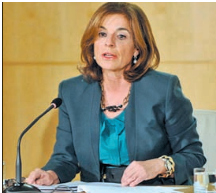
Ana Botella en la Junta de Gobierno del jueves, donde pidió disculpas

El juez Eduardo López Palop ha solicitado a la Policía Judicial que requiera a diversas compañías telefónicas que les haga entrega de todos los datos relativos a las llamadas efectuadas y sus localizaciones durante la noche