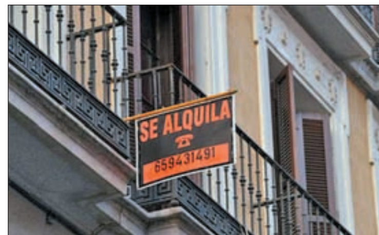
El Gobierno cuenta con 6.000 viviendas para el alquiler social

El Fondo Social de la Vivienda es de adhesión voluntaria, pero de Guindos se ha mostrado convencido de que la mayoría de las entidades de crédito lo suscribirán. Una vez que lo hagan estarán obligados a cumplir con las obligaciones que marque esta ley.