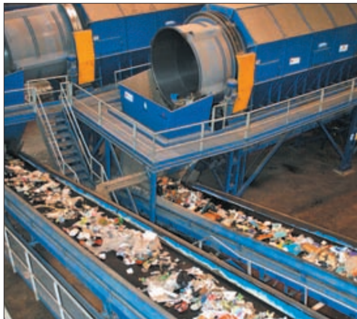
Residuos en el centro de gestión de Pinto

Actualmente cada ayuntamiento paga cerca de 12'41 euros la tonelada, una cantidad que ascendería a alrededor de 12'5 euros la tonelada una vez que la Mancomu-