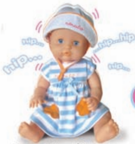
Nenuco tiene hipo REF. 562734 35'99€ 24'99€

-30% de DESCUENTO en todos estos productos