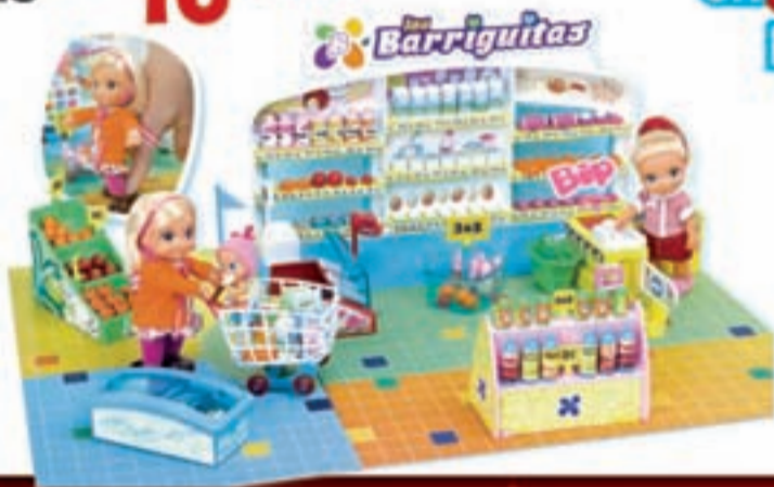
Barriguitas supermercado REF. 571326 51'99€ 34'99€