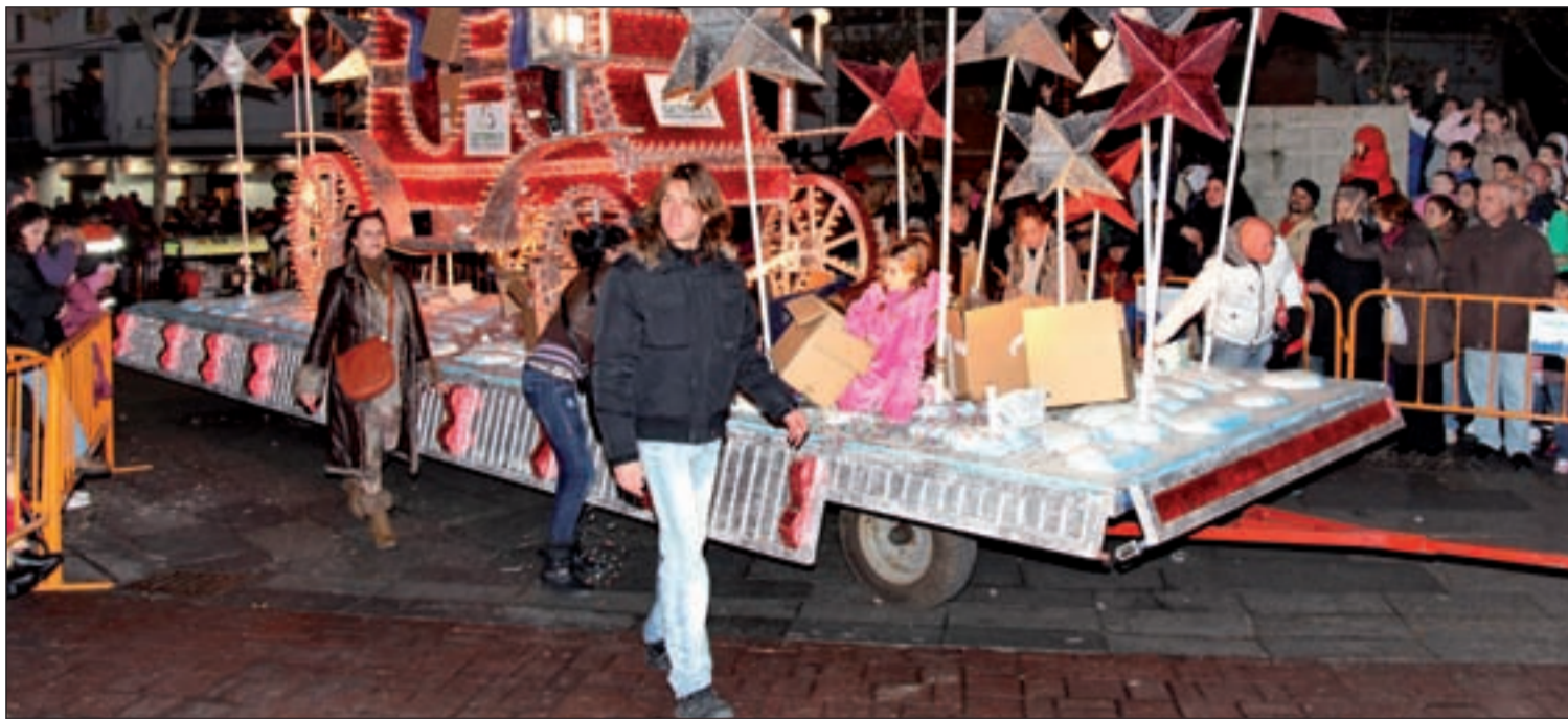
Imagen del desfile de la Cabalgata de Reyes del año pasado