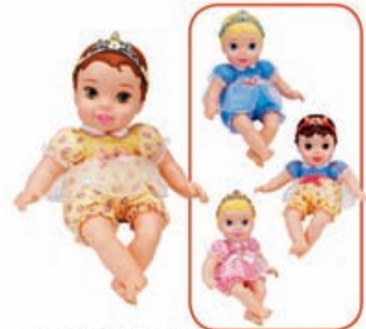
Bebé princesita REF. 549819 12'99€ 8'99€ Precio unidad

-30% de DESCUENTO en todos estos productos