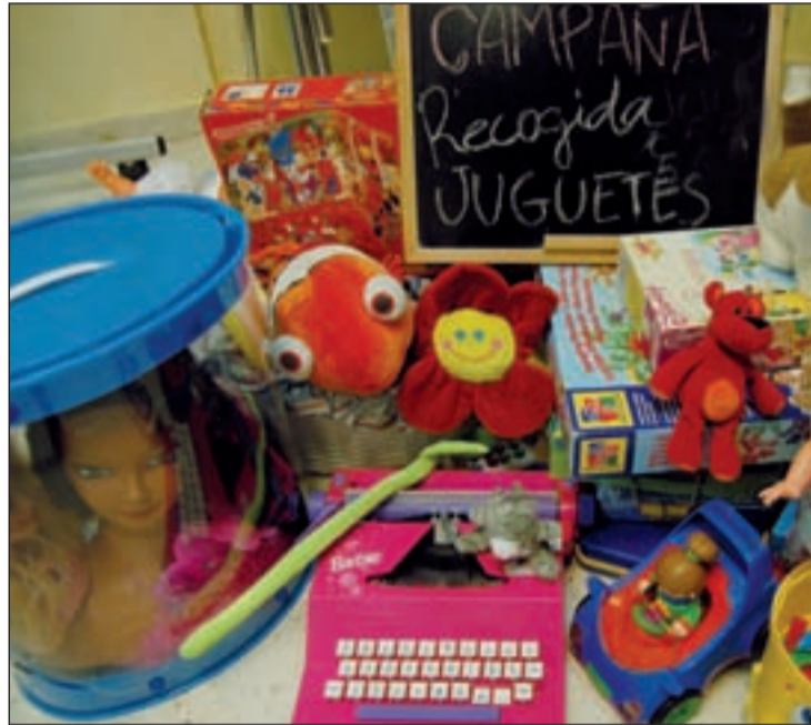
Colabora la asociación Dah-Sid Ahmed de Amigos del Pueblo Saharaui

Como ya ocurriera otros años por estas fechas, LYMA, con esta iniciativa, ha querido aportar su pequeño grano de arena en estos tiempos tan difíciles y se ha propuesto que estas navidades todos los niños del municipio puedan disfrutar con ilusión y con juguetes de estas fiestas. Y es que son precisamente los más pequeños de las casas los que hacen que se mantenga vivo el