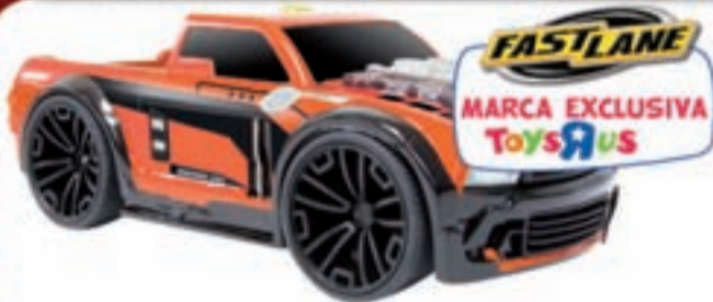
Vehículo H2O Racer