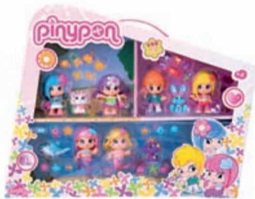
Pack 10 figuras REF. 316628 23'99€ 16'79€