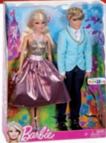
Pareja Real Barbie + Ken REF. 336386 35'99€ 24'99€