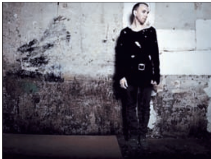
Concierto dentro del festival 'Agustico Fest'

Las entradas para poder disfrutar de Shuarma en directo ya están a la venta en las taquillas del teatro y en los puntos habituales de venta. Precio de los pases entre 10 y 15 euros.