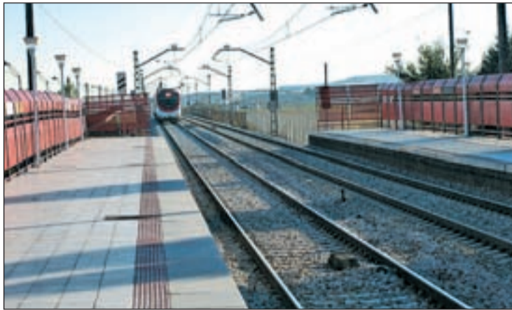
Imagen de la estación de tren del Sector III de Getafe

Los vecinos que ya han alertado al Consistorio de lo ocurrido,