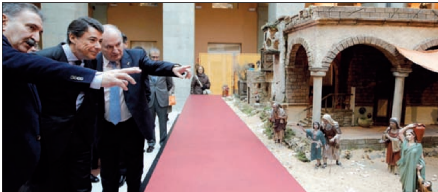
Ignacio González durante su visita al belén de la Real Casa de Correos