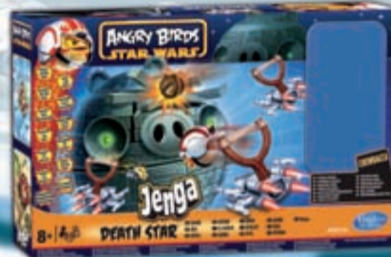
Angry Birds Star Wars Jenga Death Star