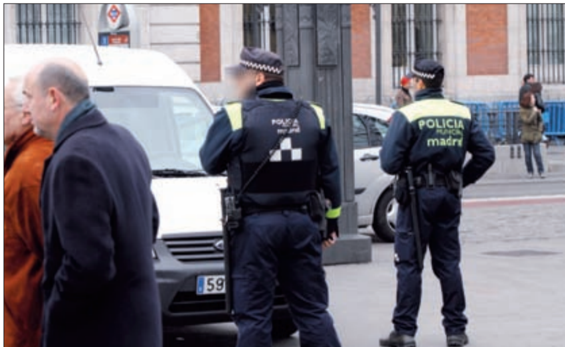
La policía patrullando en la zona comercial de Sol

Los ciudadanos ya han comenzado las compras navideñas, los ayuntamientos ya han encendido las luces y en pocos días estaremos inmersos en estas fiestas familiares. Con el objetivo de que la tranquilidad sea la tónica general de estos días, la Policía Nacional ha activado el dispositivo especial 'Comercio seguro' que se extenderá hasta el 8 de enero y que tiene como objetivo prevenir la comisión de hechos delictivos como hurtos, robos con violencia o intimidación, fraudes o robos con fuerza.