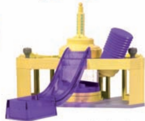
Cars - Ramone cambia de color