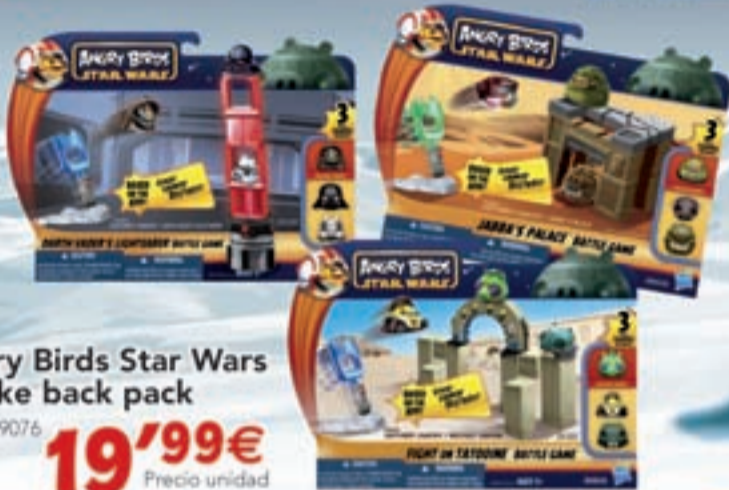
Angry Birds Star Wars Stroke back pack