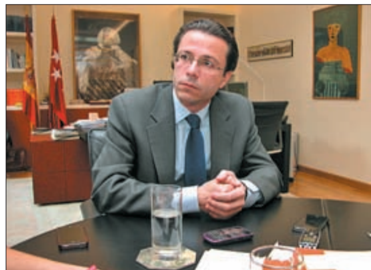
El consejero de Sanidad en otro momento de la entrevista

Claro que no. En caso de que una de las empresas que gestione un hospital quiera hacerlo no le reporta ningún beneficio porque el paciente que derive a otro hospital de la red pública de Madrid le cobramos enteramente el