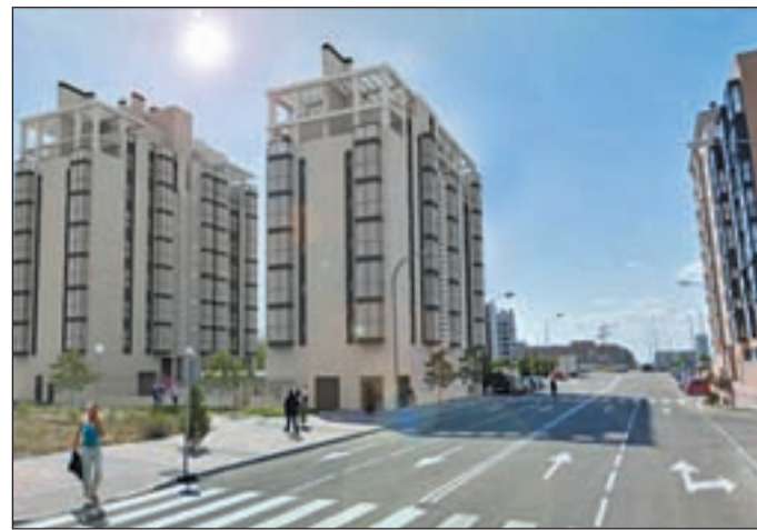
El Ensanche de Vallecas, emplazamiento de varias viviendas

El Euribor está descontando una posible bajada de los tipos de interés por parte del Banco Central Europeo (BCE) en la reunión que se celebrará el próximo jueves y en la que podrían bajar del 0,75 por ciento al 0,5 por ciento, fundamental en la revisión a la baja de sus previsiones de crecimiento de la zona euro correspondientes a este año y el siguiente. Aunque, si no fuese así, se podría experimentar un leve repunte del índice, al haber descontado algo que finalmente no se va a producir. Si no se confirma la bajada de los tipos, entonces terminaría 2012 en el 0,65 por ciento. A medio plazo el Euribor va a seguir en niveles muy bajos y no va a haber repunte. Se espera que esté estabilizado en los próximos trimestres.