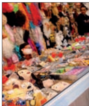
Calle Concepción, 6

El mercadillo se establecerá en el centro vecinal y el horario de apertura es de 10 a 13 horas y de 17 a 19 horas. Además de hacer entrega de lo que uno no quiere o le sobra, los asistentes podrán ayudar también comprando objetos desde 0,10 céntimos a 1 euro. Lo recaudado irá a parar a los más necesitados.