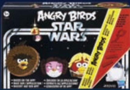
Angry Birds Star Wars Early bird pack