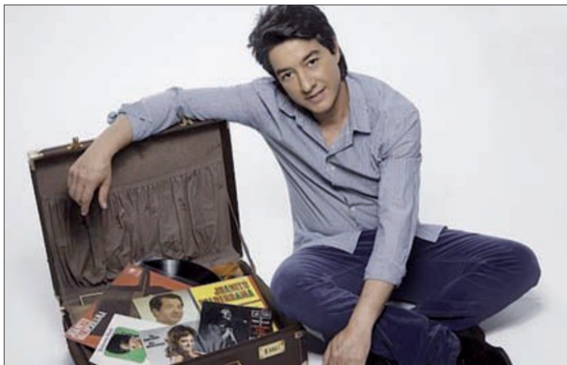
Única función a las 20 horas