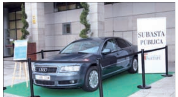
Audi A8 expuesto en la plaza del Ayuntamiento en la primera subasta