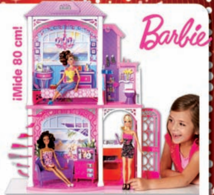
Barbie casa vacaciones REF. 389854 50'99€ 34'99€