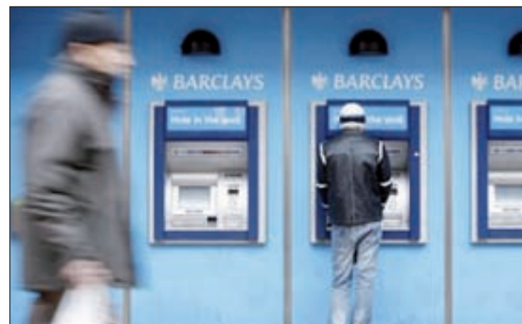
Barclays es una de las entidades que invertirá en el Sareb

brían asegurado al gabinete dirigido por Luis de Guindos su inversión en la Sociedad de Gestión de Activos procedentes de la Reestructuración Bancaria (Sareb). Además, las autoridades españolas han logrado el compromiso de Mapfre, Mutua Madrileña, Catalana Occidente y Axa. La aseguradora francesa fue la primera compañía foránea en avanzar su participación en la sociedad.