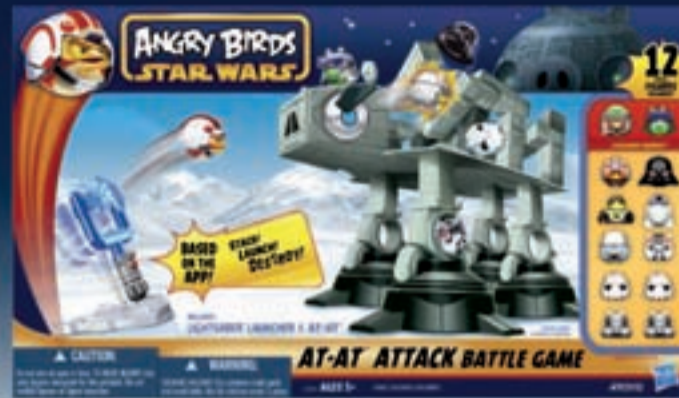
Angry Birds Star Wars AT-AT Attacks