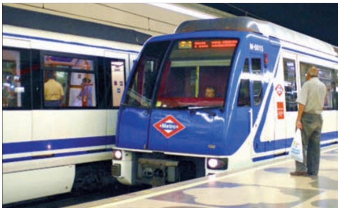
Trenes de Metro de Madrid