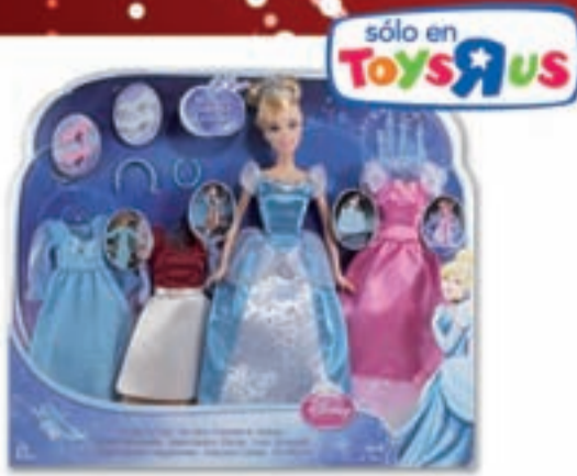
sólo en ToysRUs Pack Cenicienta + modas REF. 339938 37'99€ 26'49€