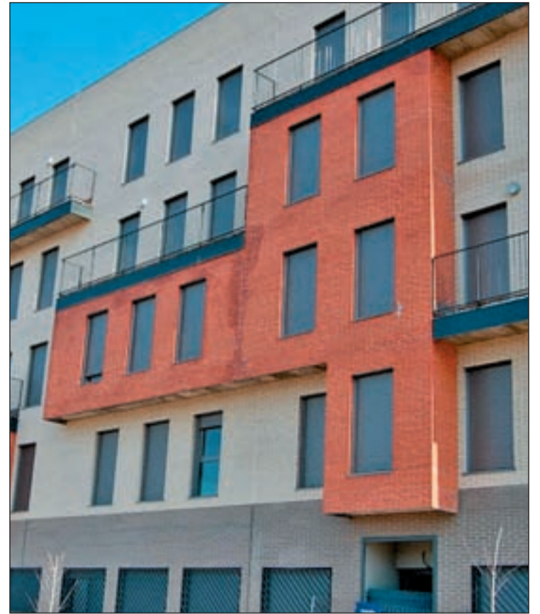
Los adjudicatarios ya tienen las llaves de sus casas