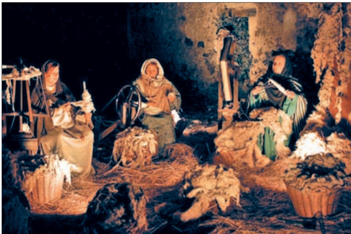
El Belén Viviente de Colmenar que se celebra este sábado

Colmenar y Tres Cantos celebran estas fiestas con diversos actos • Destacan el Belén Viviente colmenareño y las cabalgatas del día cinco de enero Pág. 17