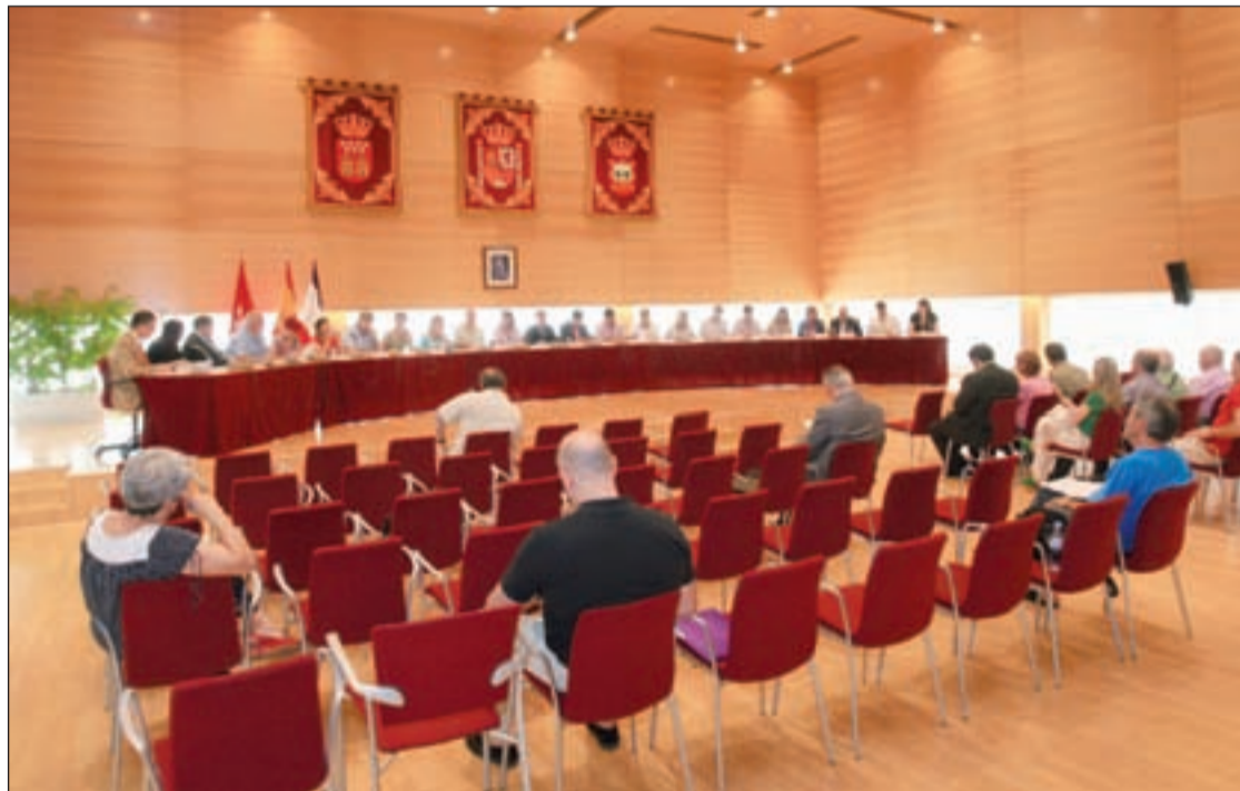
El pleno del Ayuntamiento de Tres Cantos