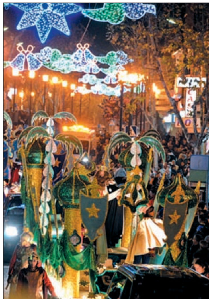
La cabalgata de reyes de Colmenar Viejo

En Tres Cantos, la hora de partida de la salida será la misma. Desde las seis de la tarde Melchor, Gaspar y Baltasar discurrirán por Tres Cantos desde la Avenida de Colmenar Viejo hasta llegar a la carpa central que estará instalada en la Plaza del Ayuntamiento. Allí además, Sus Majestades de Oriente recibirán a todos los niños que quieran hablar con ellos y hacerles entrega de sus cartas para que ellos puedan o por lo menos intenten