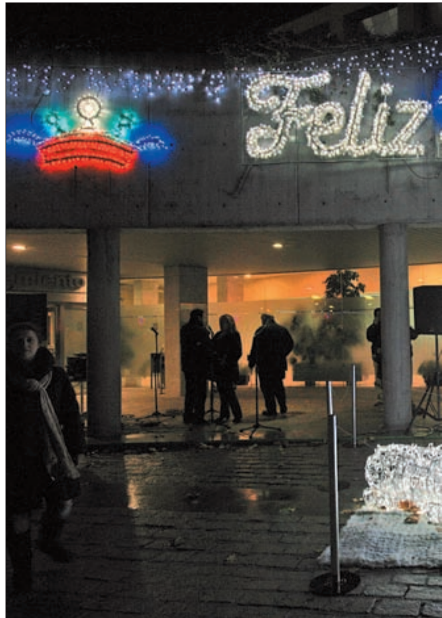
Tres Cantos desea a todos desde la Plaza del Ayuntamiento una Feliz Navidad

El año pasado este Belén Viviente de Colmenar Viejo fue visitado por más de 5.000 personas y este año tanto sus organizadores como los participantes esperan repetir el éxito.