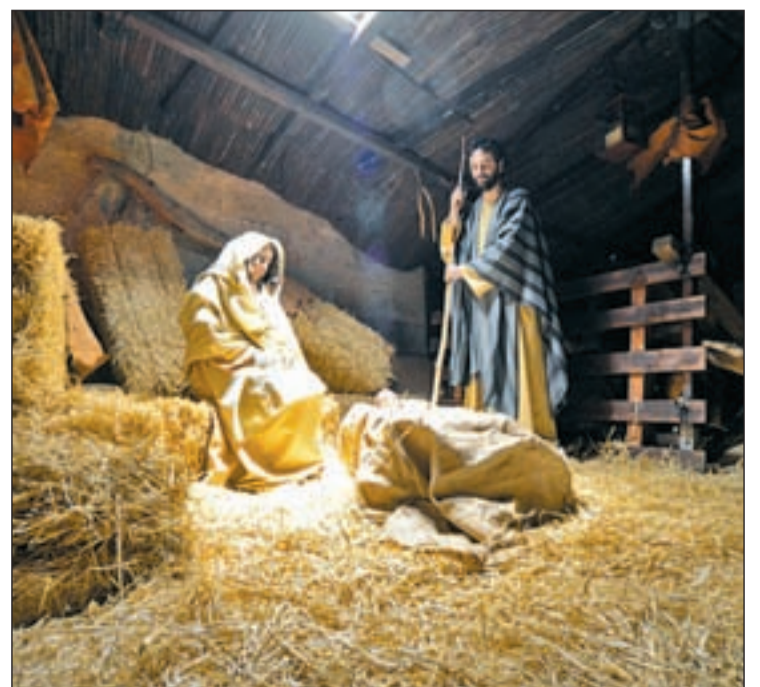
Uno de los cuadros de este Belén Viviente

En la Plaza del Ayuntamiento, y hasta el día 5 de enero, se podrá disfrutar de un tió vivo y de una pista de patinaje. También hasta ese lugar se acercará el cartero real de los Reyes Magos para que niños y niñas depositen sus cartas. Además, estará en funcionamiento hasta ese día 6