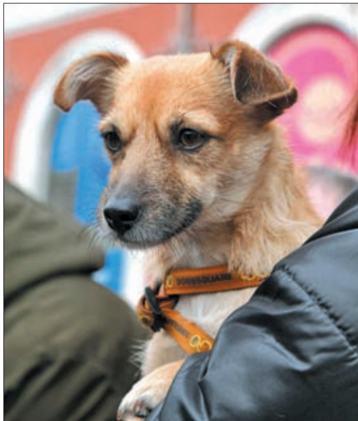
Uno de los perros asistentes a la quedada de Príncipe Pío