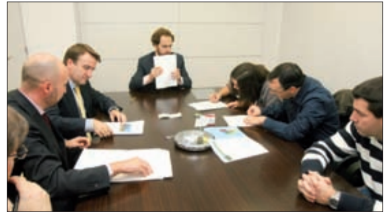
Una pareja adjudicataria firmando estas escrituras

También la biblioteca Lope de Vega de Tres Cantos abrirá sus puertas en horario continuado durante este periodo de exámenes. La sala de la biblioteca cuenta también con 200 puestos de estudios y siempre, se llenan de estudiantes.