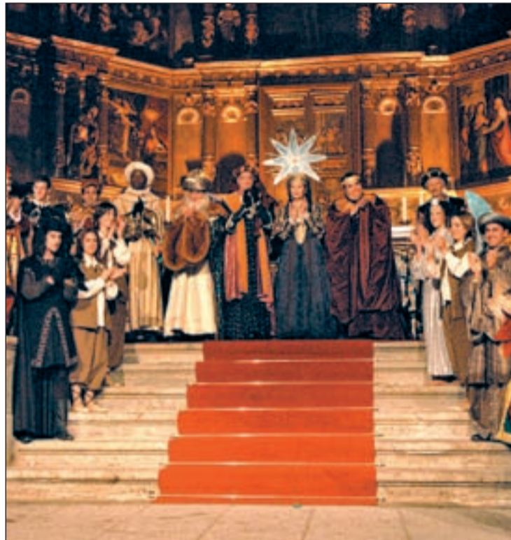
El 'Auto de los Reyes Magos' se volverá a ver en Colmenar Viejo

Aunque los que ya lo hayan visto noten estos cambios, el 'Auto de los Reyes Magos' de Colmenar seguirá “manteniendo su esen-