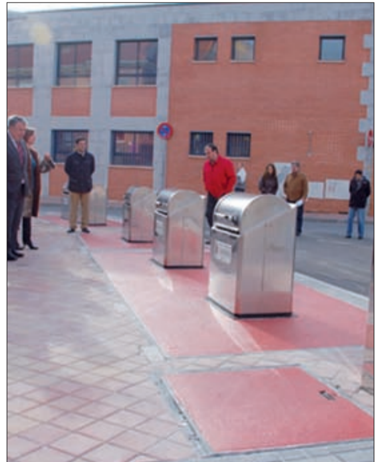
El alcalde con el concejal visitando los contenedores

Otra de las actuaciones destacables en cuanto a obras que se