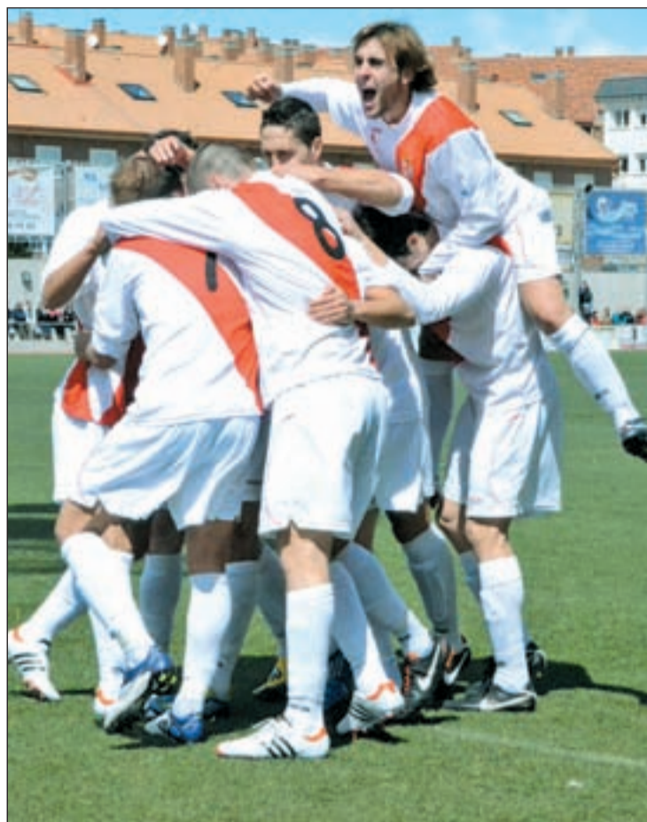
Los franjirrojos cierran el 2012 jugando ante su afición

nuevo a disposición de Javier García tras cumplir sus respectivas sanciones, abriendo la puerta a posibles novedades en el once inicial. Bien diferente es la lista de bajas del Alcobendas Sport, ya que el comité de competición confirmaba esta semana que Popler, Álvaro e Iván García no serán de la partida este domingo; el primero, por la expulsión sufrida en la pasada jornada, mientras que sus dos compañeros han sido sancionados por acumulación de amonestacio-