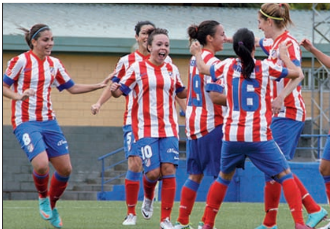
Las atléticas celebrando un gol durante un partido de esta temporada en el Cerro del Espino

Respecto a su relación con los directivos del Atlético, Lola Ro-