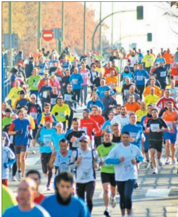
Uno de los momentos de la edición de diciembre de 2011

También el deporte, en este caso el fútbol, puede tener fines solidarios. Los próximos días 22 y 23 de diciembre del 2012 en el Estadio Nuestra Señora de la Torre se celebrará la segunda edición del Torneo de Navidad 'Vallecas solidario', organizado por el Vallecas Club de Fútbol. Según sus responsables, el objetivo es que cada persona que acuda al campo deje en la taquilla un litro o un kilo de comida no perecedera que se repartirá entre los más necesitados. Por otro lado, la Junta de San Blas-Canillejas organiza los días 22, 23, 27, 28, 29 y 30 de diciembre en el campo de fútbol Guadalajara, un