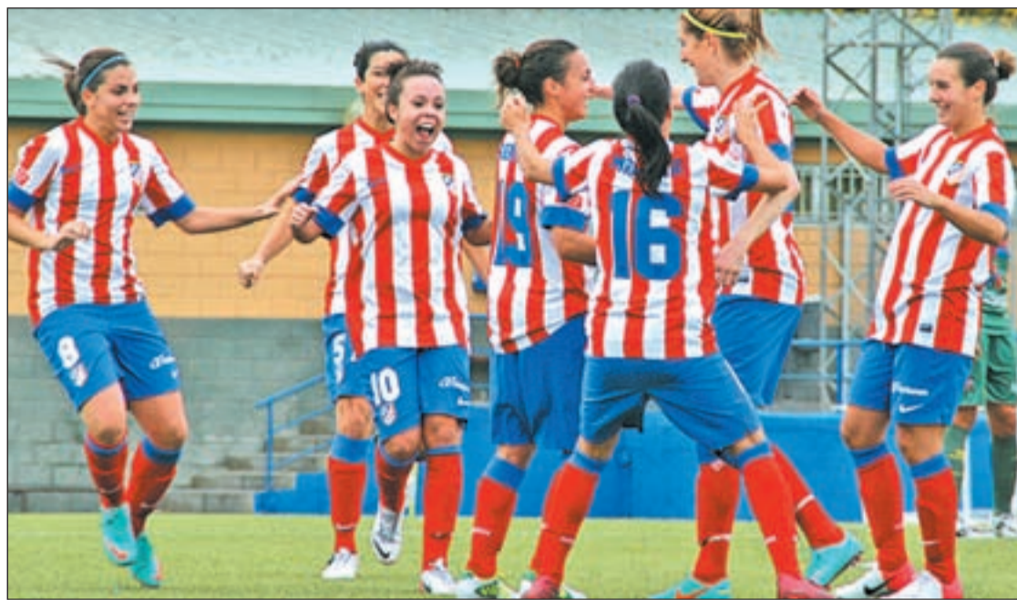
Las atléticas celebrando un gol durante un partido de esta temporada en el Cerro del Espino

Una vez asentado el proyecto, uno de los retos que desde el Atlético Femenino ven más urgente es hacer llegar a más hogares la competición femenina, un re-