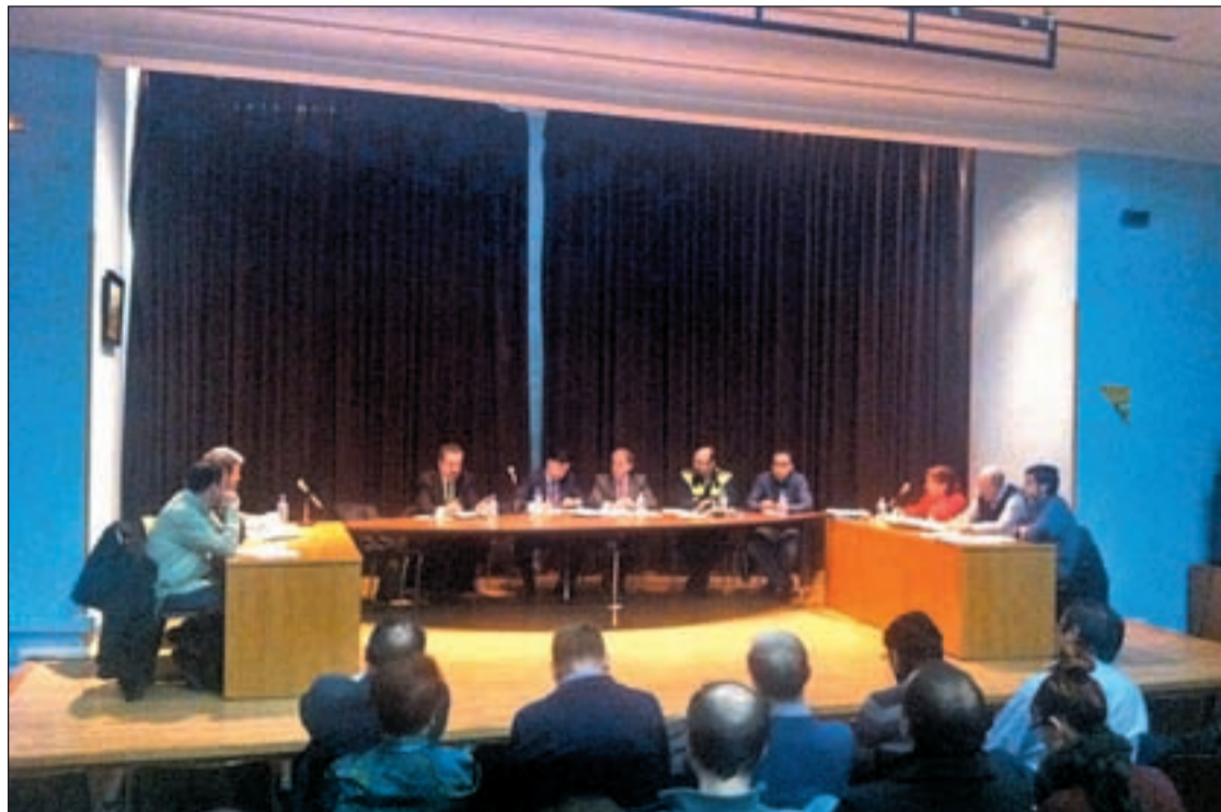
La sesión se celebró en el Centro Cultural Buero Vallejo del distrito

Además, Policía Municipal de Madrid hizo un resumen de su actuación en el distrito. Al respecto, sus representantes aseguraron que se registraron un 37 por ciento menos de delitos contra las personas, y los relacionados contra el patrimonio fueron la mitad que el año anterior. También se registraron un 19 por