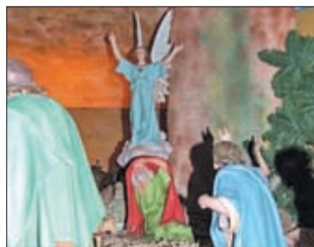
El belén de la parroquia vallecana

Hasta el 7 de enero y en horario de 10 a 22 horas, los morataleños podrán visitar en la Iglesia de Jesucristo de los Santos de los Últimos Días, una exposición de belenes. Uno de ellos está confeccionado con figuras de la tradicional fábrica valenciana Belenes Chirivella y el segundo procede de Estados Unidos. Y hasta el día 6, los vallecanos podrán ver el nacimiento instalado en la iglesia de San Pedro Ad-vincula, en el horario de apertura del templo, antes y después de las liturgias.