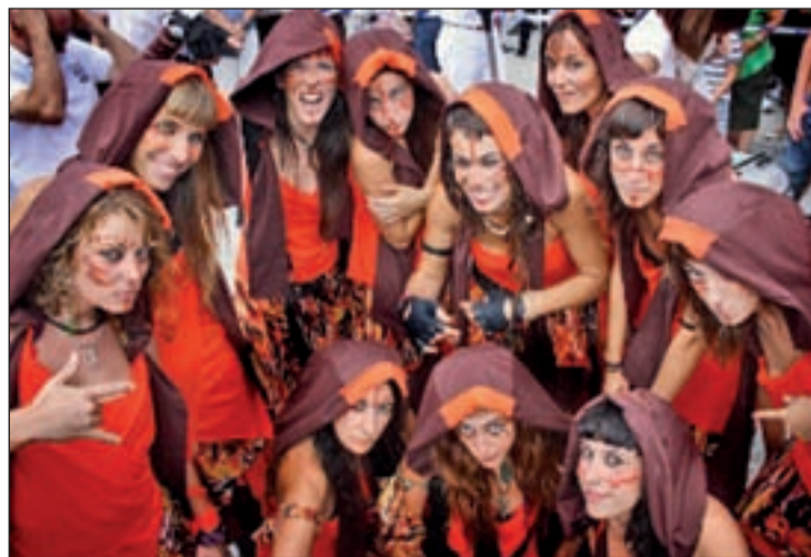
El grupo de percusión brasileño Shambaiala Batucada

Y el 2 de enero, en el mismo escenario, la compañía Larumbe pondrán en escena el espectáculo de danza contemporánea 'Reflejos', dirigido a un público infantil y familiar. Según sus responsables, el objetivo es, a través de simples anécdotas cotidianas llevadas al lúdico absurdo, explorar más allá de las relaciones convencionales del ser humano