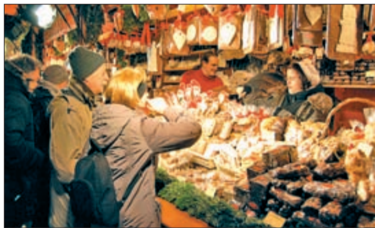
MERCADILLO PUENTE DE VALLECAS Los vecinos pueden adquirir diferentes productos de la artesanía tradicional navideña en el mercadillo instalado hasta el 7 de enero en la confluencia de la avenida de Albufera y de la calle de Monte Igueldo. Los 60 puestos abren de 12:00 a 14:00 y de 17:00 a 21:00.

Sus Majestades los Reyes Magos de Oriente recorrerán cuatro de los seis distritos del Este. El viernes 4 de enero, saludarán a los niños de Puente de Vallecas, San Blas-Canillejas, Vicálvaro y Moratalaz. En el primero de ellos, la comitiva arrancará a las seis de la tarde de la calle de Los Extre-