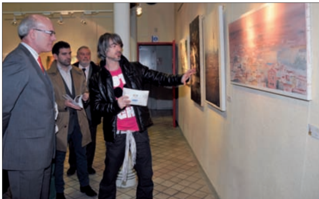
Un momento de la inauguración oficial de los trabajos del certamen