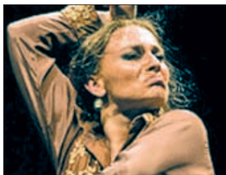
Una de las actuaciones de flamenco

Hasta el próximo 26 de diciembre, toda la familia podrá acudir a los centros socioculturales del distrito para ver una selección de títulos destinados a los más pequeños de la casa. En El Madroño, las próximas citas son los días 22, 23 y 26 de diciembre, a partir de las 12 de la mañana, con las proyecciones de 'Lorax, en busca de la trífula perdida', 'Bravo' y 'Cuando Papá Noel cayó del cielo'. En el espacio cultural de Valdebernardo, se proyectarán los días 23 y 26, en el mismo horario, 'Cuando Papá Noel cayó del cielo' y 'Ice Age 4'. La entrada es gratuita hasta completar el aforo de los diferentes salones de actos municipales.