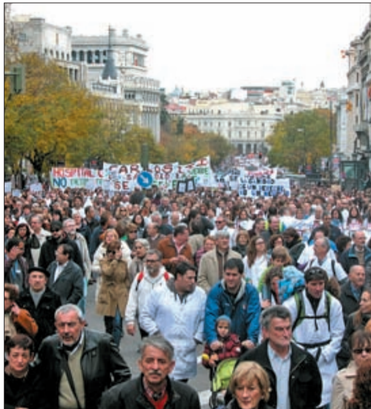
Miles de personas se manifestaron el domingo en la capital

Pero son más las propuestas que le "sorprenden y decepcionan", como el punto en el que el Comité cifra al dinero que se ahorraría la Consejería si no se externalizan seis hospitales. "Eso es un imposible lógico, porque si quedan igual que como están, con el mismo coste en estos momentos, lo que no hay en ahorro", ha apostillado Lasquetty.