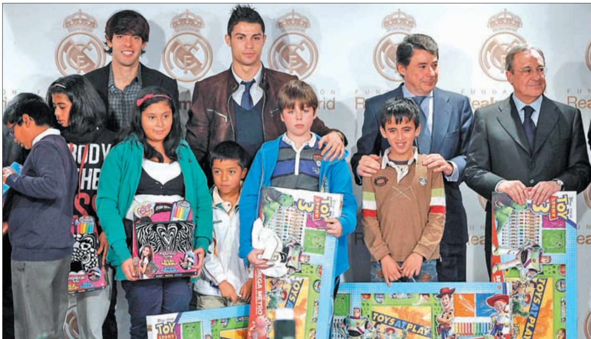
Ignacio González junto a los jugadores del Real Madrid Cristiano Ronaldo y Kaká entregando juguetes a niños necesitados