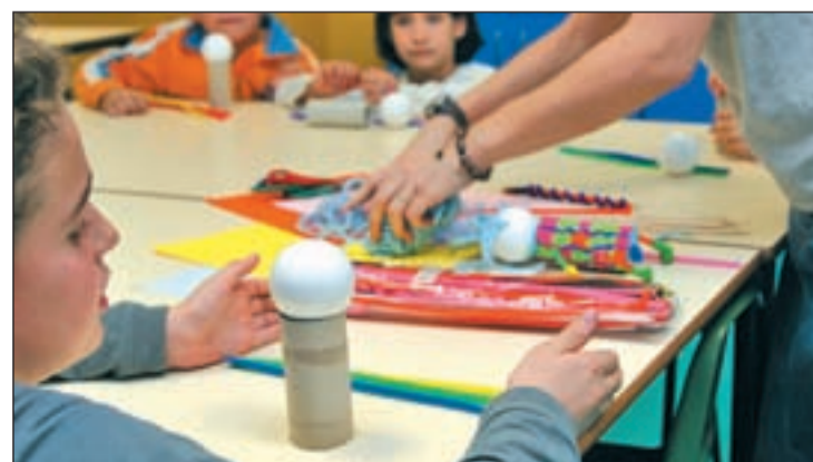
Los más pequeños serán los protagonistas de esta iniciativa

Los interesados en participar en esta propuesta gratuita subvencionada con fondos municipales, pueden formalizar su inscripción vía mail, remitiendo un correo a administracion@pauvallecas.org . O de manera presencial en el local de la asociación, situado en la calle de Baños de Valdearado, 15. En la solicitud hay que consignar el nombre y edad del niño, nombre y teléfono de contacto del papá o mamá, y el taller o talleres en los que se quiere ingresar.