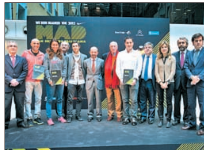
Un momento de la presentación de la carrera de 2012

LA CARRERA FUE PRESENTADA EN SOCIEDAD EL DÍA 17