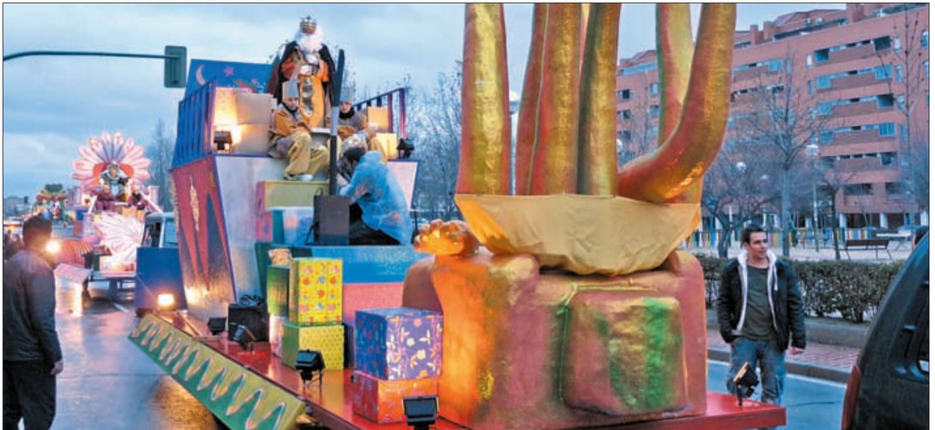
La cabalgata de Reyes de Vicálvaro adelanta un día su celebración y recorrerá las calles del distrito el viernes 4 de enero