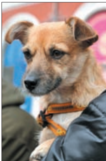
Uno de los perros de la quedada