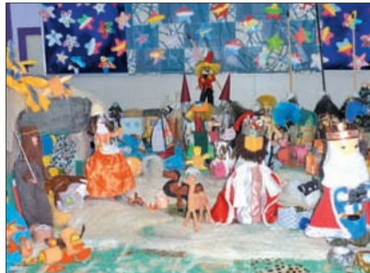
El nacimiento del belén del colegio Mater Amabilis

El polideportivo Cerro Almodóvar, situado en el barrio de Santa Eugenia del distrito de Villa de Vallecas, será el escenario de la tercera edición del Campus de Navidad organizada por el Club de Baloncesto Ensanche de Vallecas. Esta iniciativa, que tendrá una duración de seis jornadas, los días 26, 27 y 28 de diciembre, y 2, 3 y 4 de enero, está dirigida a las categorías benjamín, alevín e infantil, para nacidos entre los años 1999 y 2004. Los interesados en formalizar su participación en esta iniciativa puede hacerlo en el mail campus@cben-sanche.com .