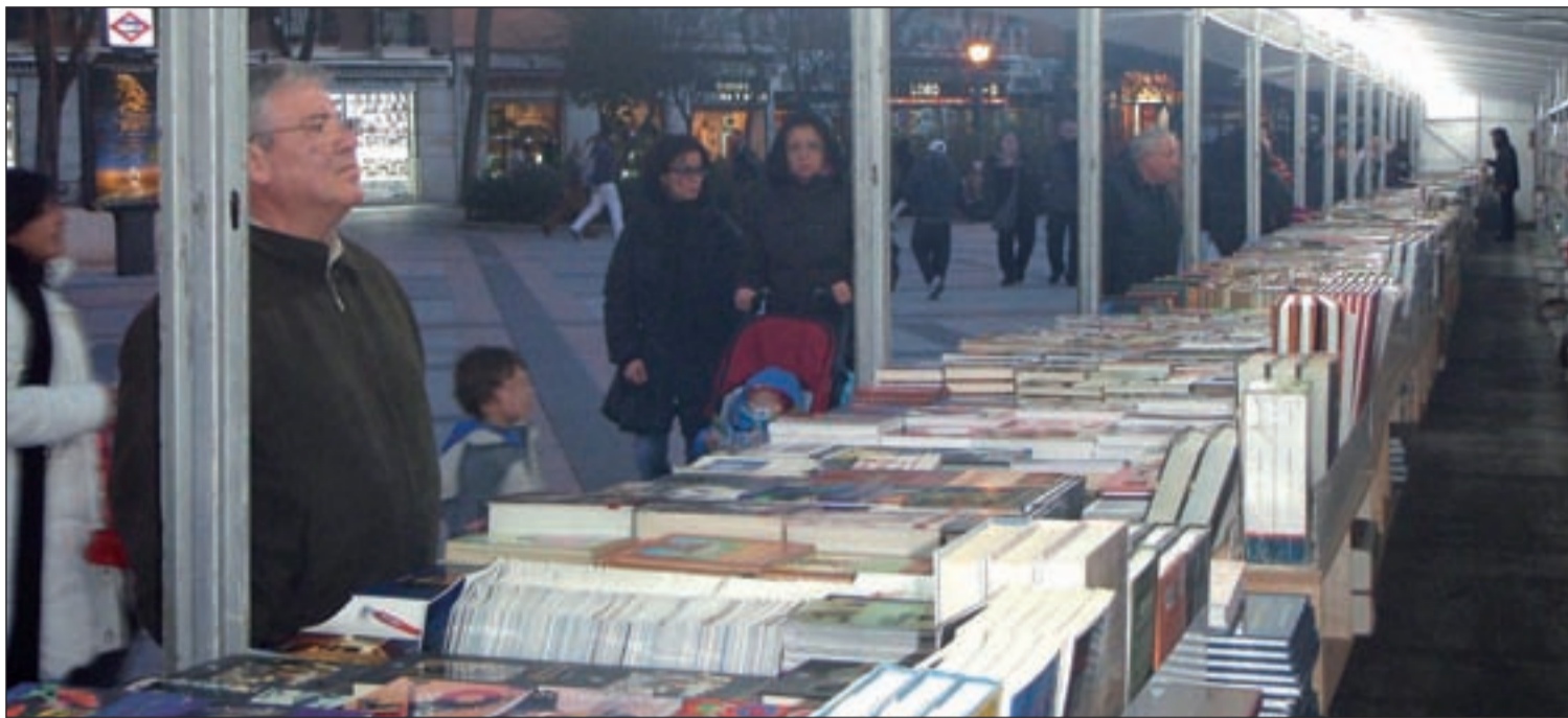
Un vecino contempla los ejemplares expuestos en los puestos instalados en el paseo de Federico García Lorca