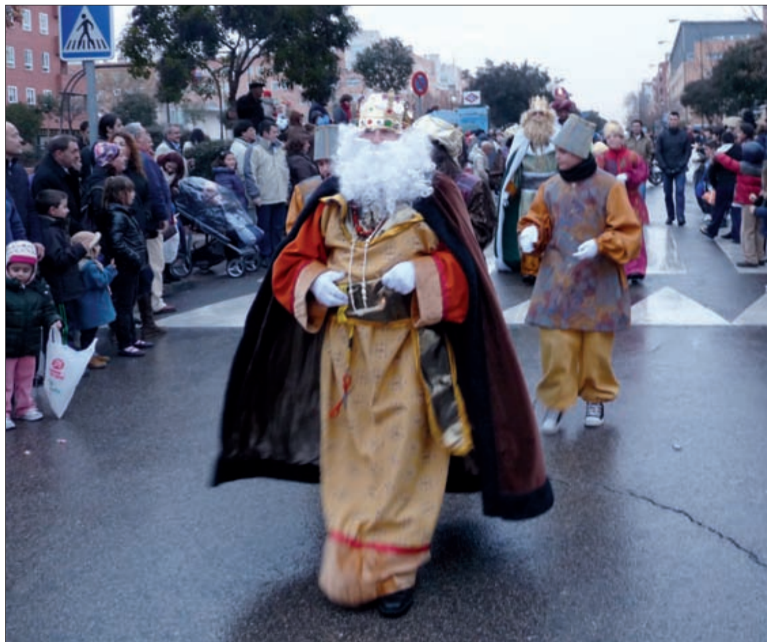
Los niños de Vicálvaro tendrán la posibilidad de volver a ver a los Reyes Magos por las calles de sus barrios

Los vecinos tienen a su alcance un amplio programa de propuestas para celebrar las fiestas · Sus Majestades los Reyes Magos de Oriente recorrerán las calles en la tarde del 4 de enero Págs. 12 y 13