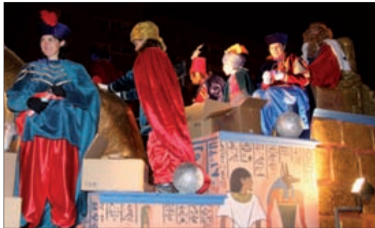
Este año 35 carrozas recorrerán el municipio repartiendo caramelos