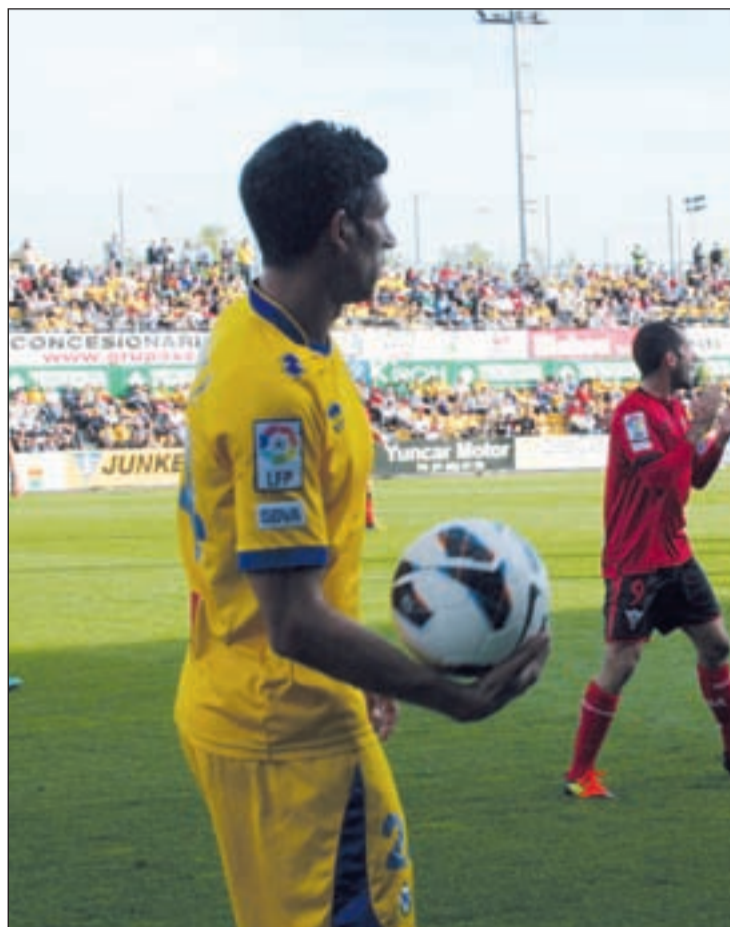
Nagore, habitual en el once de Bordalás

Tras el intento fallido de la pasada temporada, el Almería parte de nuevo como claro candidato al ascenso. El argentino Ulloa ha pasado el testigo goleador a Charles, aunque los roji-