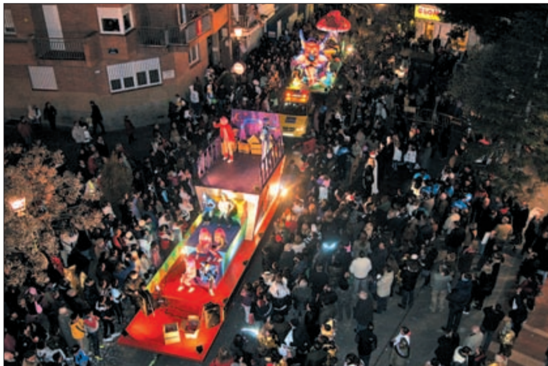
La Cabalgata de los Reyes Magos recorrerá las principales calles del municipio

Los vecinos disfrutarán de un periodo festivo lleno de ocio para todos los públicos y sin incidentes gracias a un dispositivo de la policía Págs. 10 y 17-19