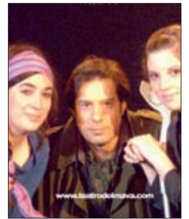
Los actores cantarán villancicos