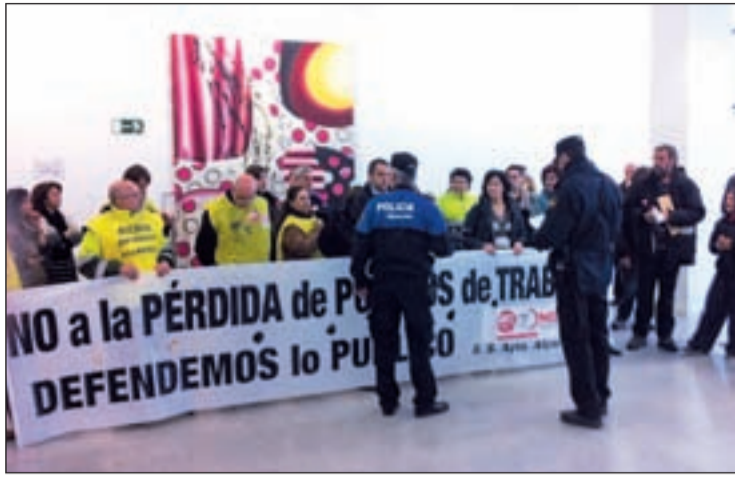
Los manifestantes extendieron pancartas dentro del Ayuntamiento

PRESUPUESTOS 2013 RECORTES EN EL COSTE DE PERSONAL