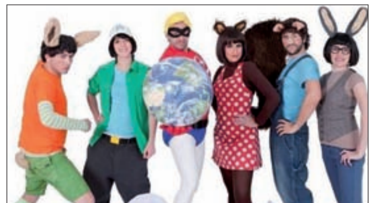
Dirigido a un público infantil donde los adultos también cobran importancia