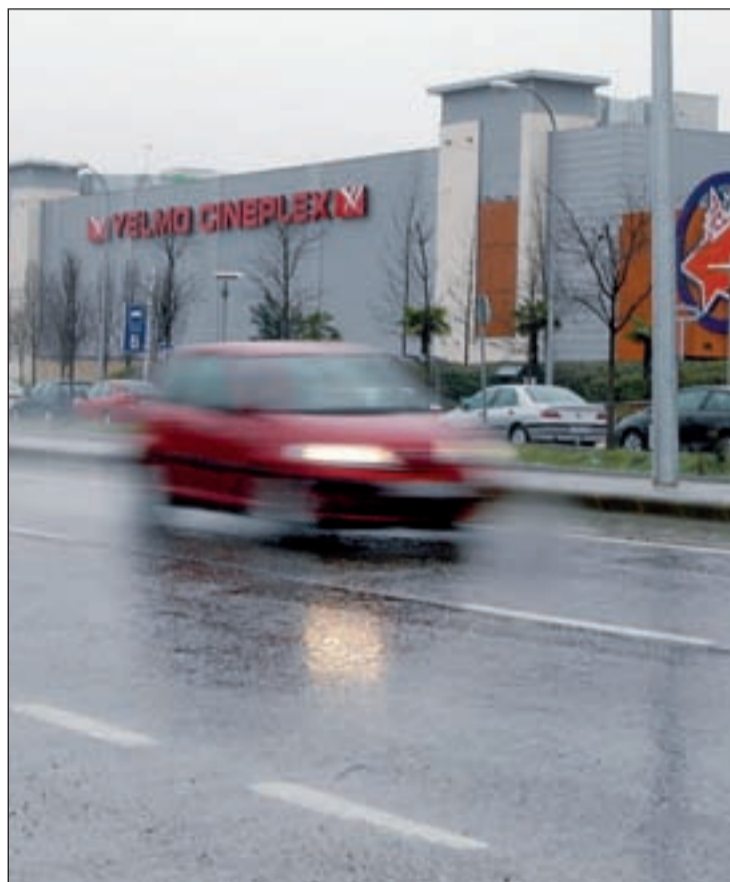
Muchos vecinos eligen el Tres Aguas para hacer sus compras