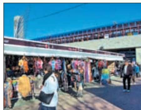
Las casetas de la plaza de Aluche

Niños y no tan niños de Usera tienen una cita con el teatro en el barrio de Orcasitas. El viernes 4 de enero, a las 17:30, en el Centro Cultural Meseta, en la plaza de la Asociación, sin número, se representará, dentro del pro-