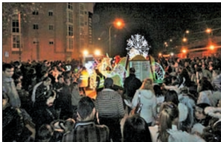
CABALGATA DE BUTARQUE Los recortes presupuestarios dejaron sin cabalgata municipal al distrito de Villaverde en 2012. Los vecinos de Butarque, como medida de protesta, organizaron la suya propia por las calles de su barrio.

La Navidad ha llegado a la zona Sur de la capital. Y sus vecinos no tienen necesidad de desplazarse al centro para vivirla en primera persona. Las calles, plazas y espacios públicos de los distritos albergarán un variado menú de propuestas promovidas por el Ayuntamiento de Madrid y, en algunos casos, por los propios vecinos. Actividades tan tradicionales como las cabalgatas, los concursos de belenes y los conciertos de música sacra, compartirán protagonismo con otras más actuales como son los talleres para los niños donde se podrán elaborar artículos navi-