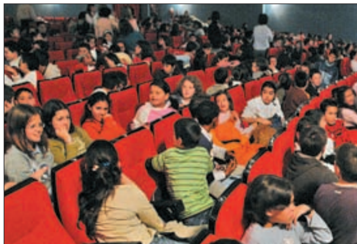
Las actuaciones están dirigidas a los más pequeños de la familia

Y un día antes, el 2 de enero, en el mismo escenario, la Factoría Estival del Arte, compañía residente en el centro cultural Orcasur, pondrá en escena la obra 'Las Fábulas del señor Samaniego' de Ainhoa Amestoy, dirigida