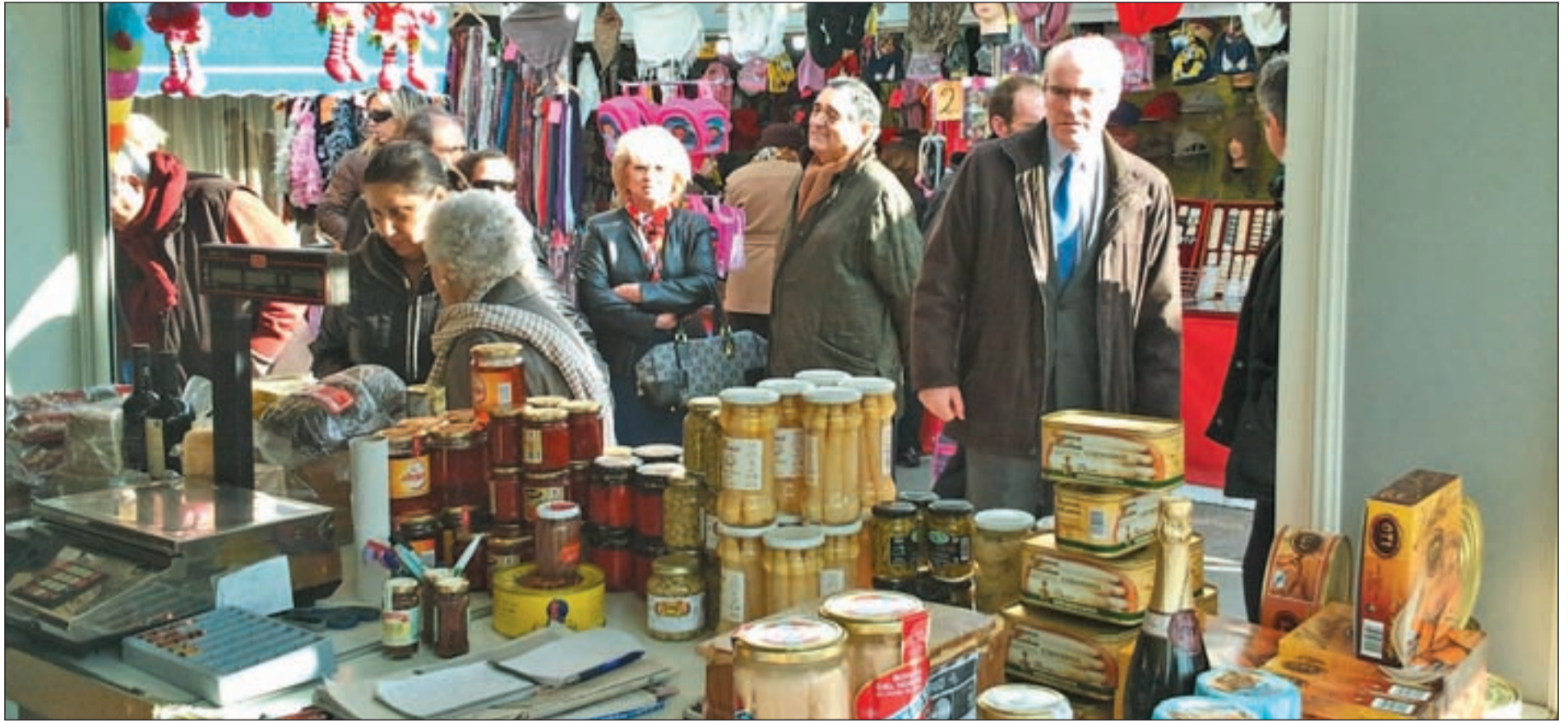
El mercadillo de Carabanchel, situado en la glorieta de Valle de Oro, ofrecerá sus productos hasta el próximo 7 de enero