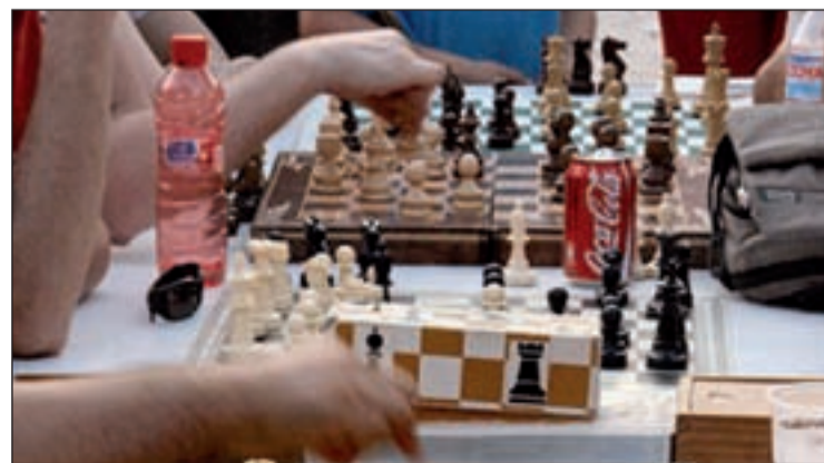
Uno de los torneos organizados en Carabanchel Alto

EL PUNTO DE PARTIDA SERÁ LA REUNIÓN DEL 27 DE DICIEMBRE