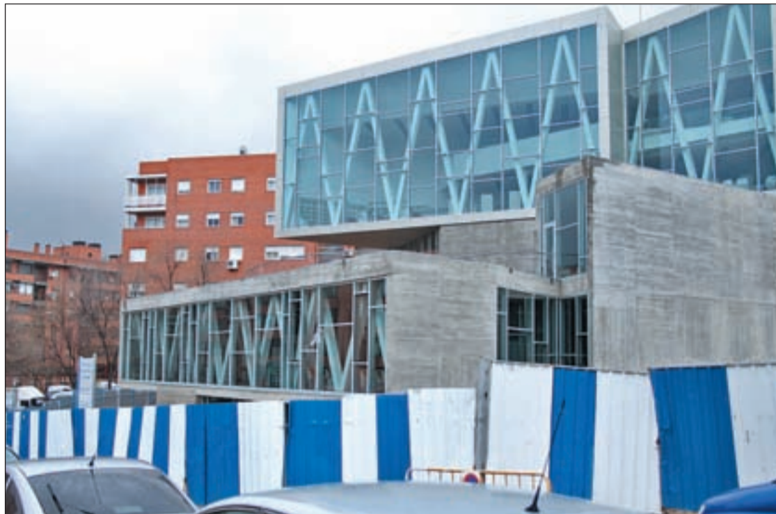
El equipamiento cultural situado en la calle de Antonio Vico

Las asociaciones representadas en el Consejo Territorial preguntaron en la sesión del pasado 17 de diciembre sobre la situación del recurso cultural. Al margen de darles a conocer el citado nombre, los responsables de la Junta Municipal les informaron que ya tiene dotación de mobiliario, fondos bibliográficos de 53.141 volúmenes, material informático, servicios de mantenimiento y limpieza y personal asignado, a falta de las obras de acondicionamiento exterior que se acometerán a primero de enero de 2013.