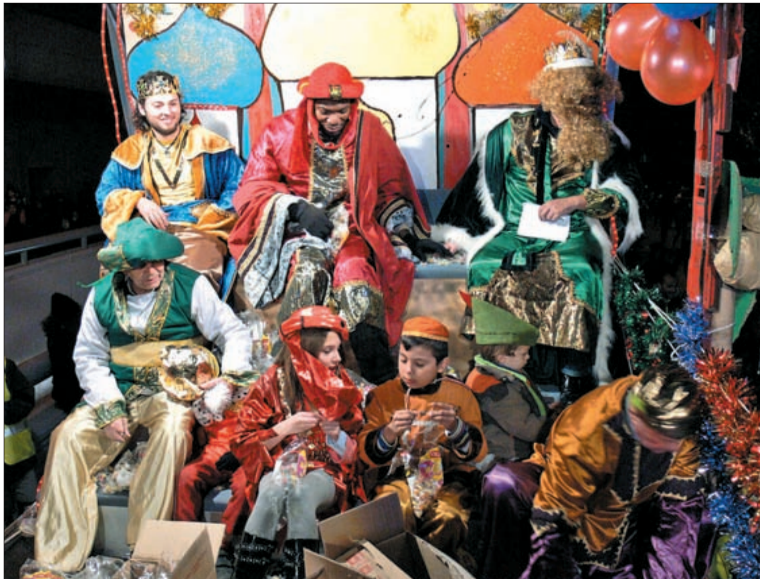
Los más pequeños tendrán la posibilidad de ver pasar a los Magos de Oriente por las calles de su barrio

Los vecinos de los distritos tienen a su disposición un variado menú de propuestas para celebrar la llegada de las fiestas de este año Págs. 12 y 13