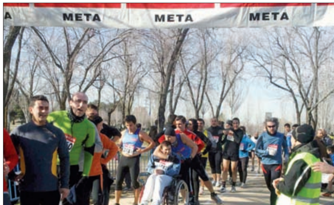
Uno de los momentos de la carrera celebrada en el parque de Plata y Castañar en 2011 CLUB LA INCOLORA