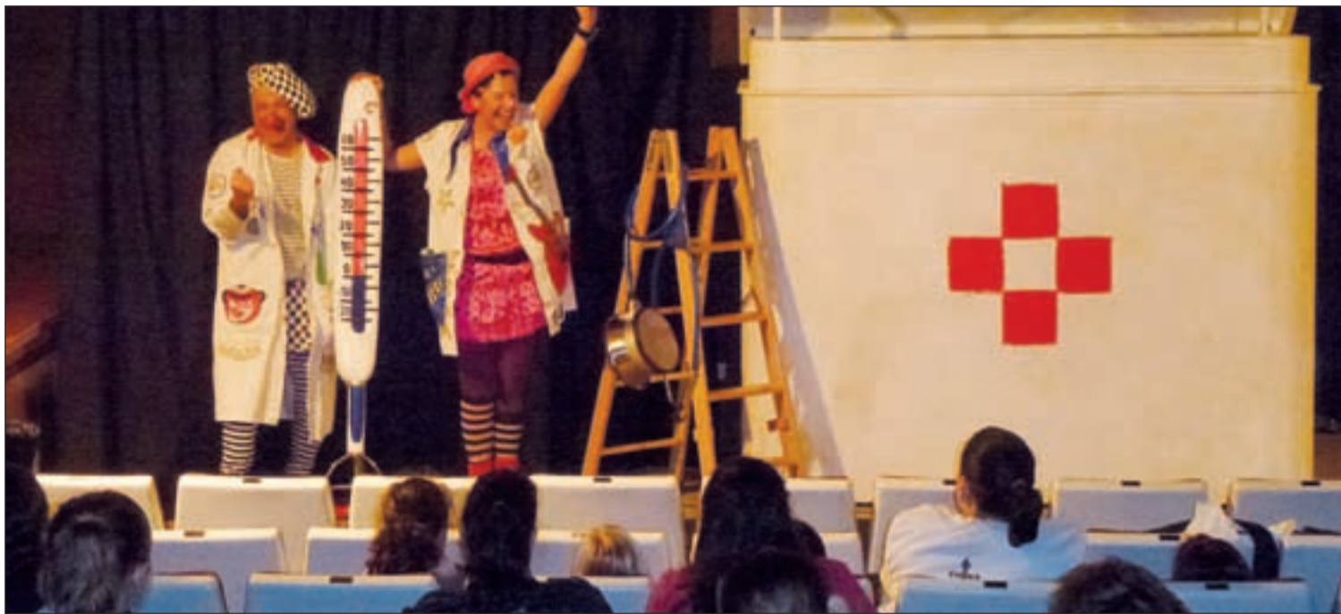
Un momento de la actuación que tuvo lugar en el salón de actos del complejo hospitalario del distrito de Usera