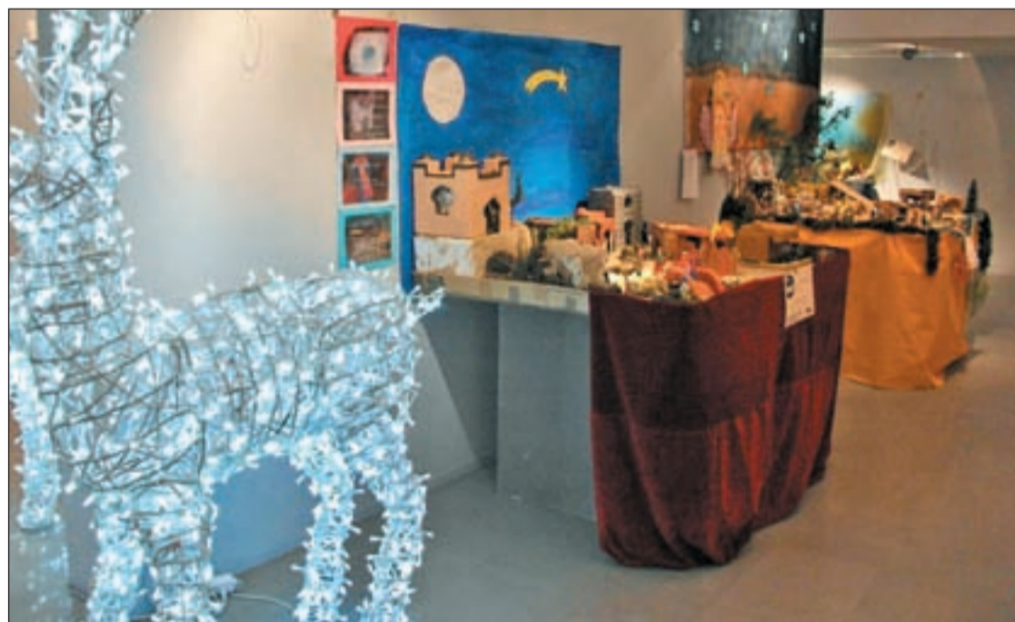
Los belenes participantes están expuestos en la Sala Latinarte del distrito

El jurado, tras su proceso de deliberación, concedió el primer premio al Colegio Concertado Nuestra Señora de las Escuelas Pías. El segundo, al Colegio Público Francisco Arranz y el tercero al Colegio Público Nuestra Señora del Lucero. La mención especial se la llevó el Colegio Concertado San Buenaventura.