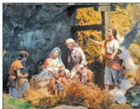
Uno de los nacimientos visitados

La Junta Municipal de Latina promueve el sábado 22 de diciembre un encuentro, con motivo de la Navidad, entre las escuelas deportivas municipales de baloncesto de los polideportivos de Aluche y Gallur. La competición se desarrollará en el pabellón polideportivo del segundo de los centros por la mañana, en horario de nueve de la mañana a dos de la tarde.