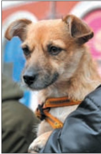
Uno de los perros de la quedada