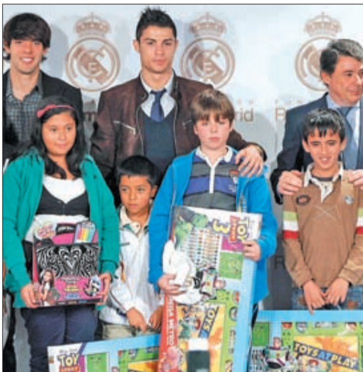
Ignacio González, Cristiano Ronaldo y Kaká entregando juguetes

Además, el gobierno regional ha colaborado con Metro de Madrid y la Fundación Atlético para