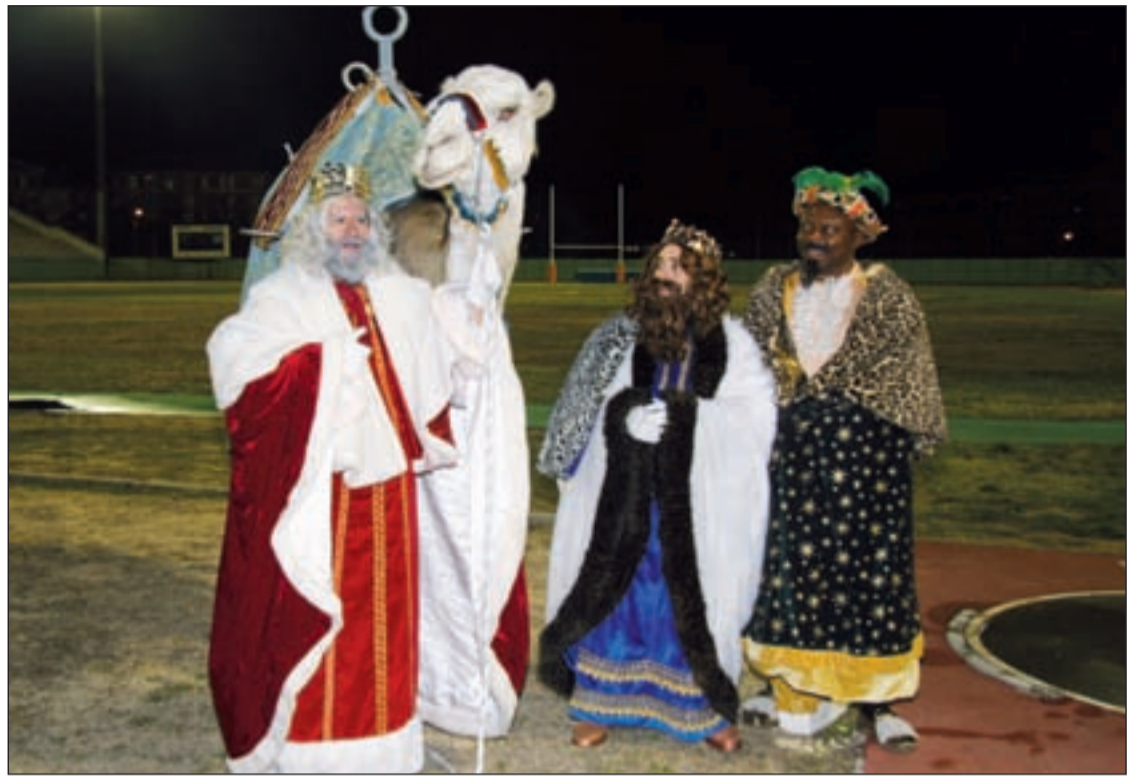
Melchor, Gaspar y Baltasar a su llegada al polideportivo Juan de la Cierva

Este año el ayuntamiento de Getafe propone numerosas actividades para el disfrute de los más pequeños durante las vacaciones navideñas. En la zona del entorno del teatro Federico García Lorca y la estación de Getafe Central se ha instalado una pista de hielo y un carrusel de época para amenizar el mercado de Navidad instalado en el mismo lugar. Además dentro del mismo espacio se encuentra una carpa infantil con numerosos talleres de pintura de cara o reciclaje. En el otro extremo, en la plaza España hay una feria navideña con atracciones para los niños.