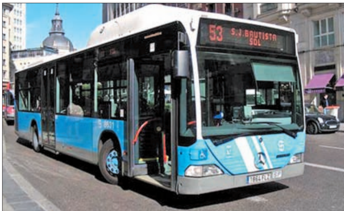
Autobús de la EMT circulando por la capital

La otra cara de la moneda para el SUMMA 112 son los recortes: el dispositivo se queda sin un helicóptero de emergencia según contemplan los presupuestos del Gobierno popular de Ignacio González. Por su parte, el secretario general del PSM y portavoz del grupo socialista, Tomás Gómez, ha denunciado que esta supresión es "un nuevo desastre en materia sanitaria" que hará "poner en riesgo la vida de mucha gente".