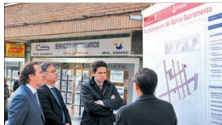
Una de las calles acondicionadas por el plan PRISMA