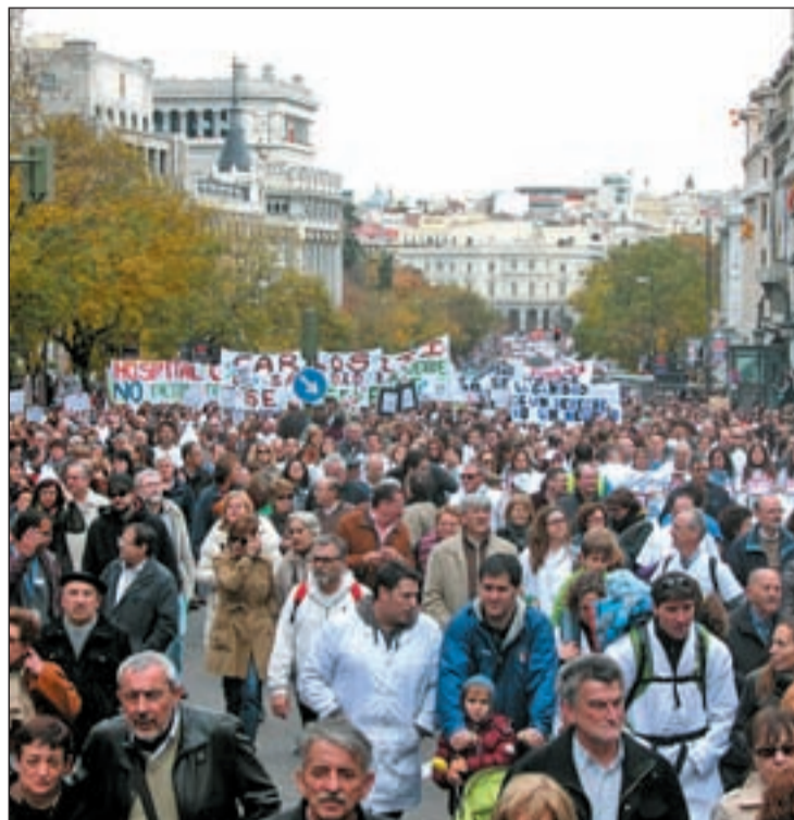
Miles de personas se manifestaron el domingo en la capital