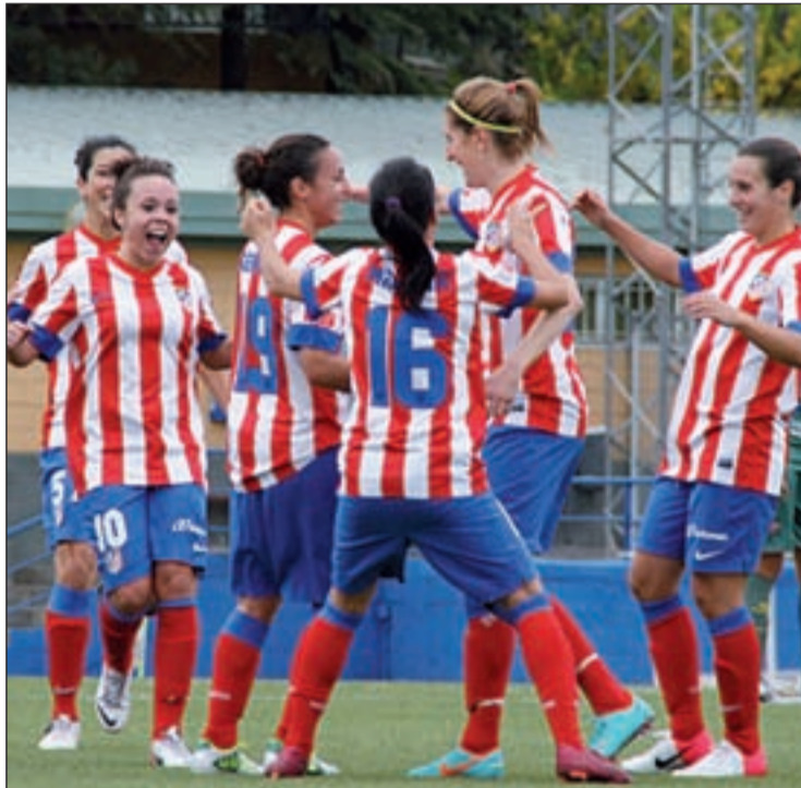
Las atléticas celebrando un gol durante un partido de esta temporada