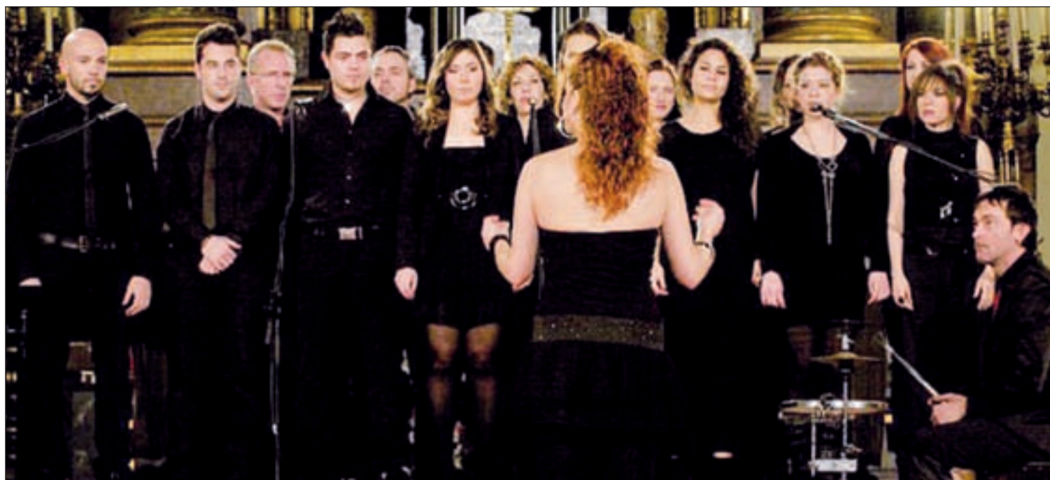
Durante una de sus actuaciones