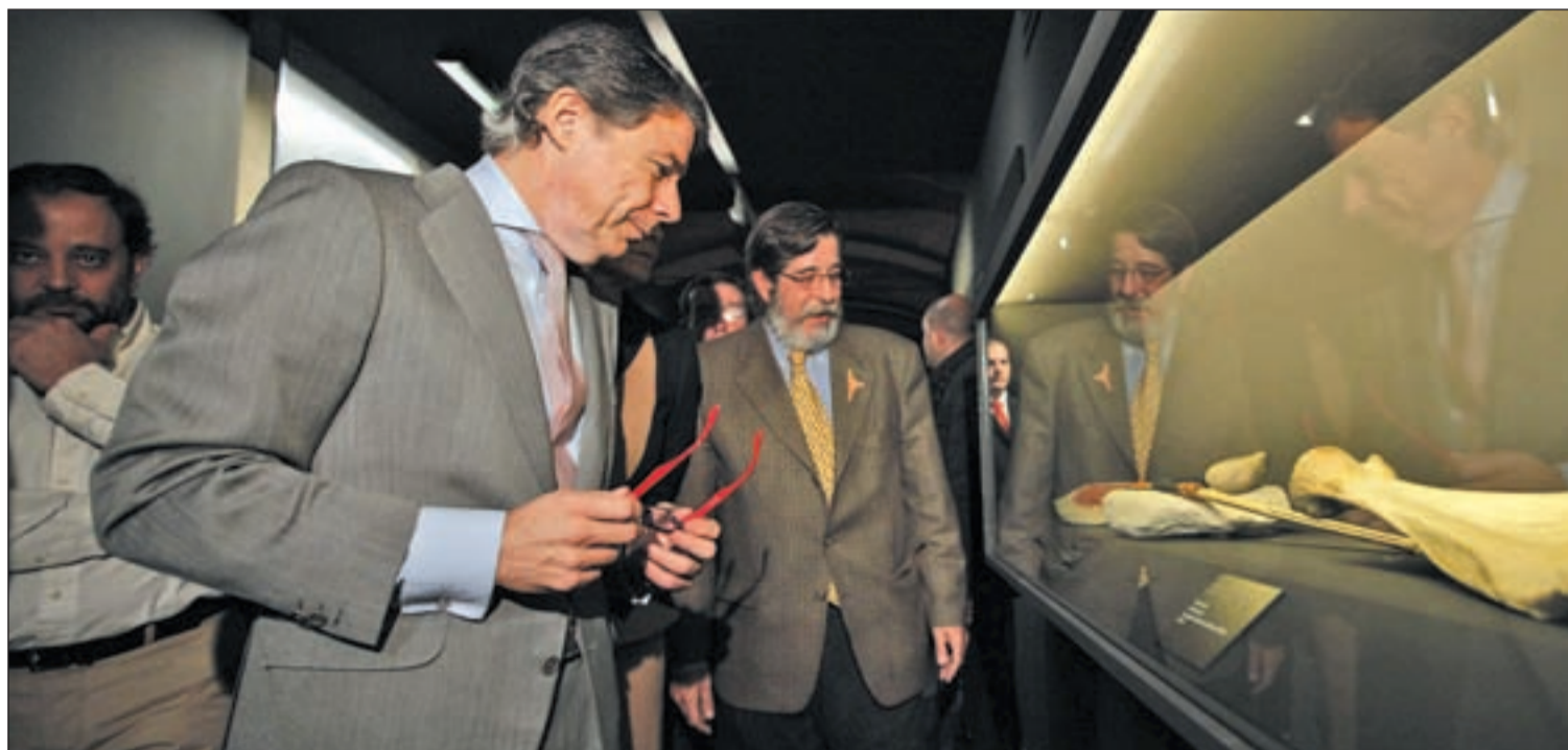
El presidente de la Comunidad de Madrid, Ignacio González, durante la inauguración de la exposición