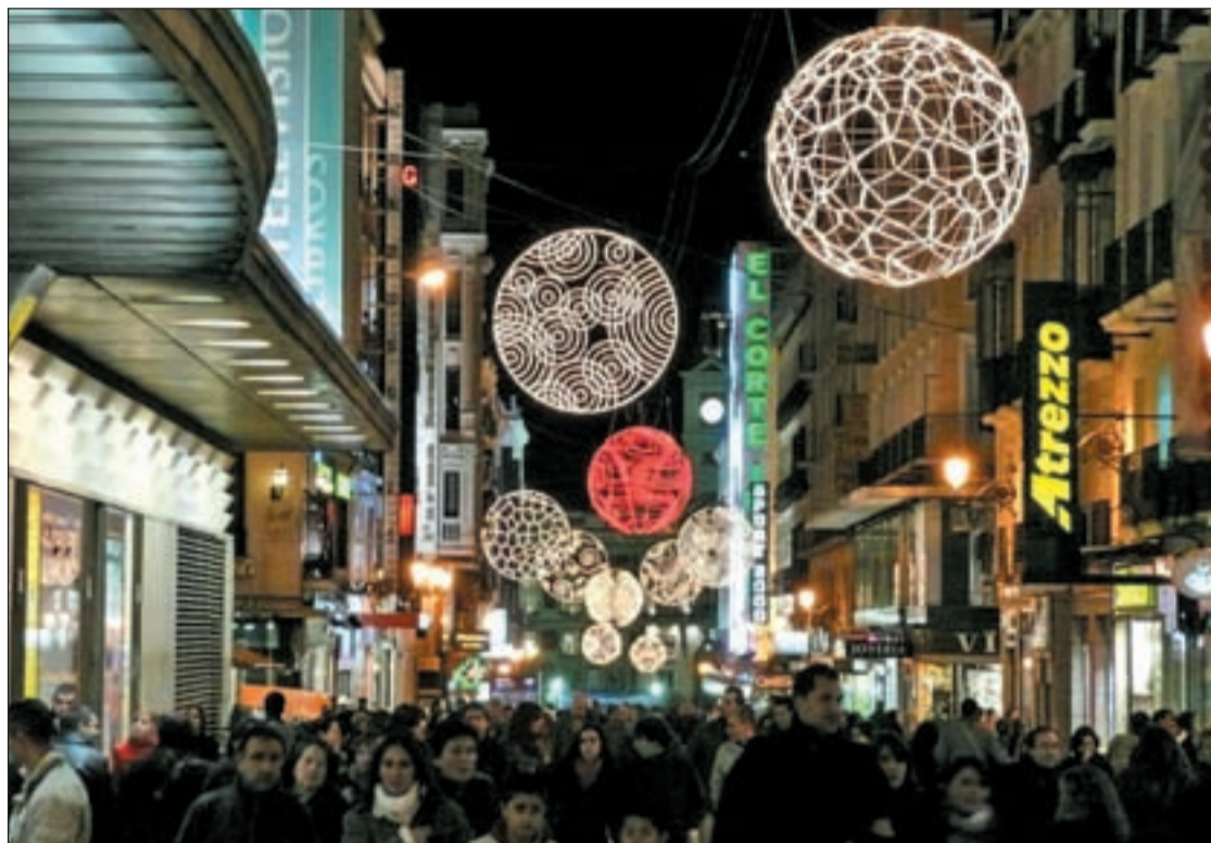
La calle Preciados durante las Navidades pasadas

El estudio de FUCI también aporta datos relevantes en cuanto al gasto durante las Navidades. Éste indica que los madrileños gastarán 190 euros en regalos y juguetes (20 euros menos