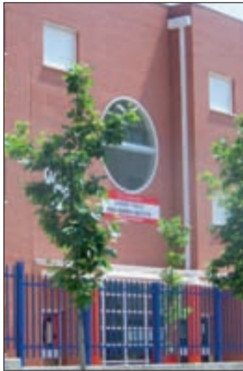
Colegio Ana María Matute

El objetivo de esta iniciativa es ofrecer una alternativa a los niños durante las vacaciones de Navidad, y a sus padres, sobre todo a aquellos que tienen que trabajar durante estos días. Y es que este programa responde a