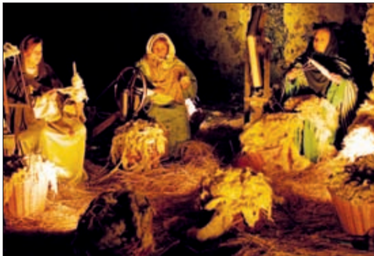
Imagen de la representación de un belén viviente