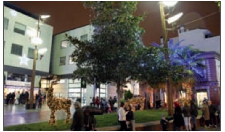
Iluminación en la plaza del Ayuntamiento

El precio de la 'Escuela de Navidad' es 12,50 euros cada semana. A lo que hay que sumar 9 euros por semana si los niños se quedan a desayunar y 14,50 euros, también cada semana, si los padres desean que sus hijos también coman en el colegio.