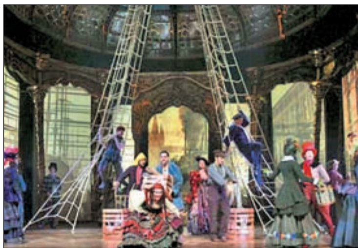
Musical 'El último jinete' Esta obra es sin duda uno de los grandes estrenos de Los Teatros del Canal y cuenta la historia de Tared, un joven beduino que quiere conseguir su sueño de llegar a la gloria gracias a la batalla. Para conseguirlo necesita encontrar un caballo que sea perfecto para él.

mance' interpretado por el Grupo Alfonso X El sabio (Centro-Centro).