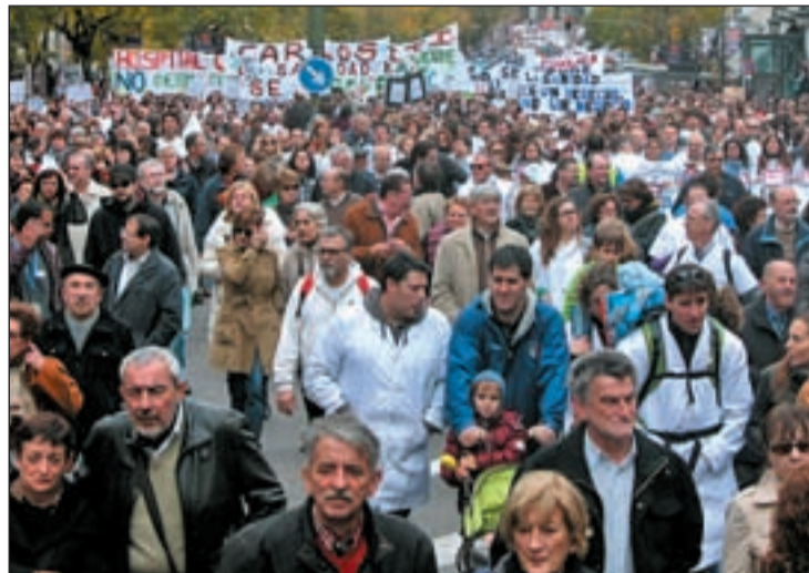
Miles de personas se manifestaron el domingo en la capital