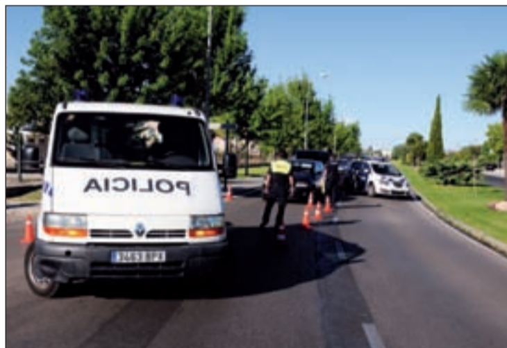
Control de alcoholemia Los agentes de la Policía Local de Majadahonda durante uno de los controles de alcoholemia que los agentes realizan en la campaña de Navidad de este año. Se intensificarán en los alrededores de las zonas comerciales y en Nochebuena, Nochevieja y en la noche de Reyes.

recta entre los comercios y la Policía Local, a través del correo electrónico: 'comercioseguro@aytoadilla.com'. Los establecimientos podrán denunciar cualquier situación de incidencia en esta dirección y los agentes se pondrán en contacto con ellos de manera inmediata. Si la situación fuera urgente, los comerciantes deben seguir usando el teléfono único de emergencias 112 o el 91 634 93 15.