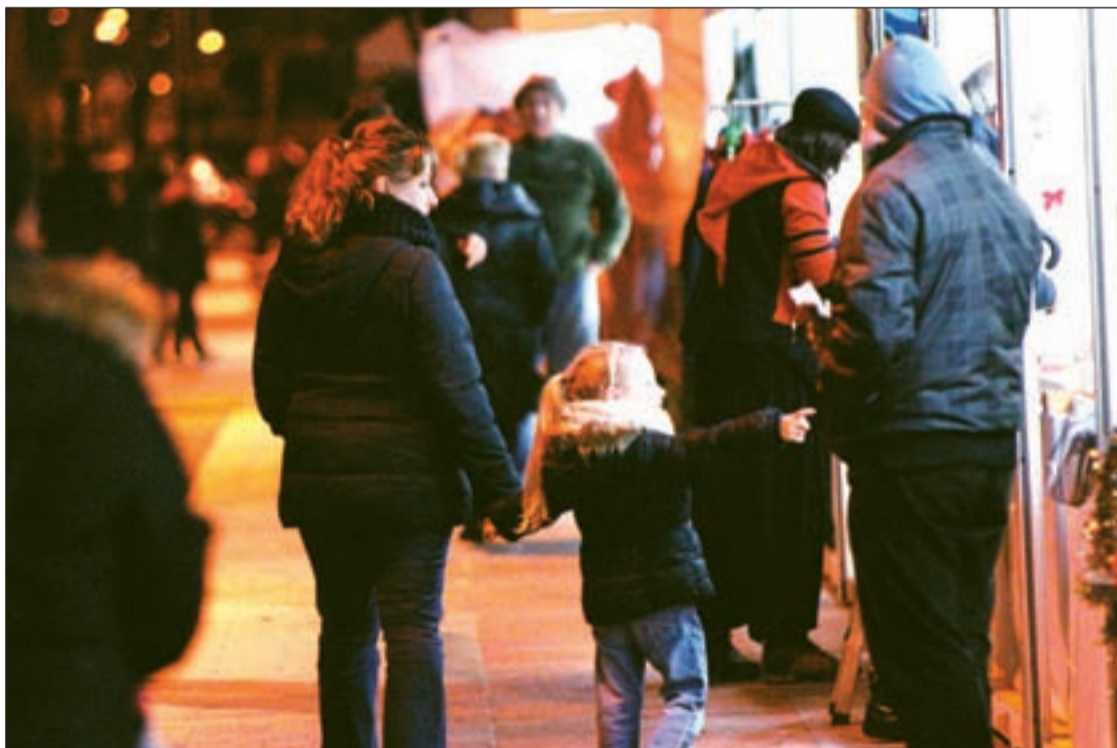
La localidad de Collado Villalba recibe la Navidad con una agenda cargada de actividades

La Policía Local y la Guardia Civil vigilarán las zonas comerciales y las carreteras para garantizar la tranquilidad de los vecinos en las fiestas Pág. 10