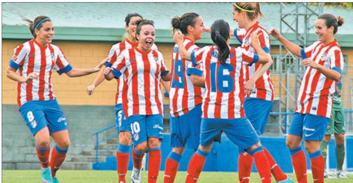
Las atléticas celebrando un gol durante un partido de esta temporada en el Cerro del Espino

EL ATLÉTICO FÉMINAS ES EL ÚNICO EQUIPO DE LA PRIMERA DIVISIÓN QUE AÚN NO HA PERDIDO