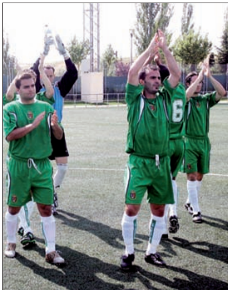
El Pozuelo sigue cuarto en la clasificación GENTE