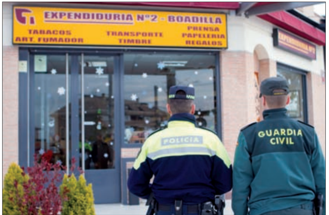
Un equipo de la Policía Local y la Guardia Civil durante una de las visitas a centros comerciales de Boadilla

De esta forma, el Ayuntamiento ha puesto en marcha una línea de comunicación di-