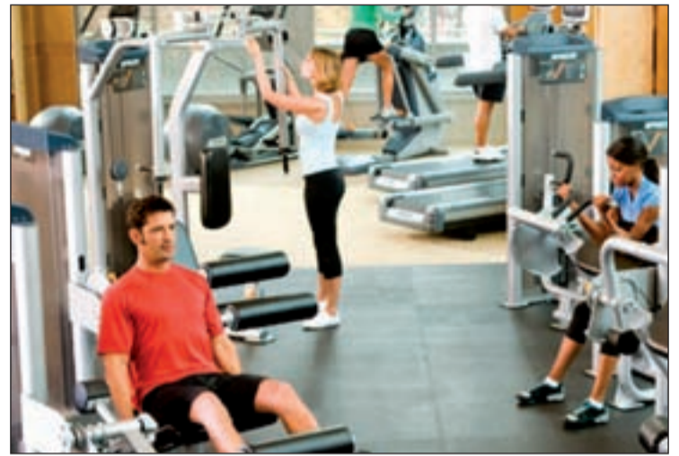
Polideportivo Valle de la Oliva, en Majadahonda