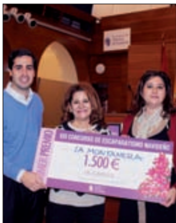
Ganadora del concurso de Pozuelo