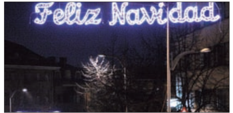
La Navidad llega a la localidad de Collado Villalba

Toda la información del programa se puede ver en la web del Ayuntamiento de Villalba.