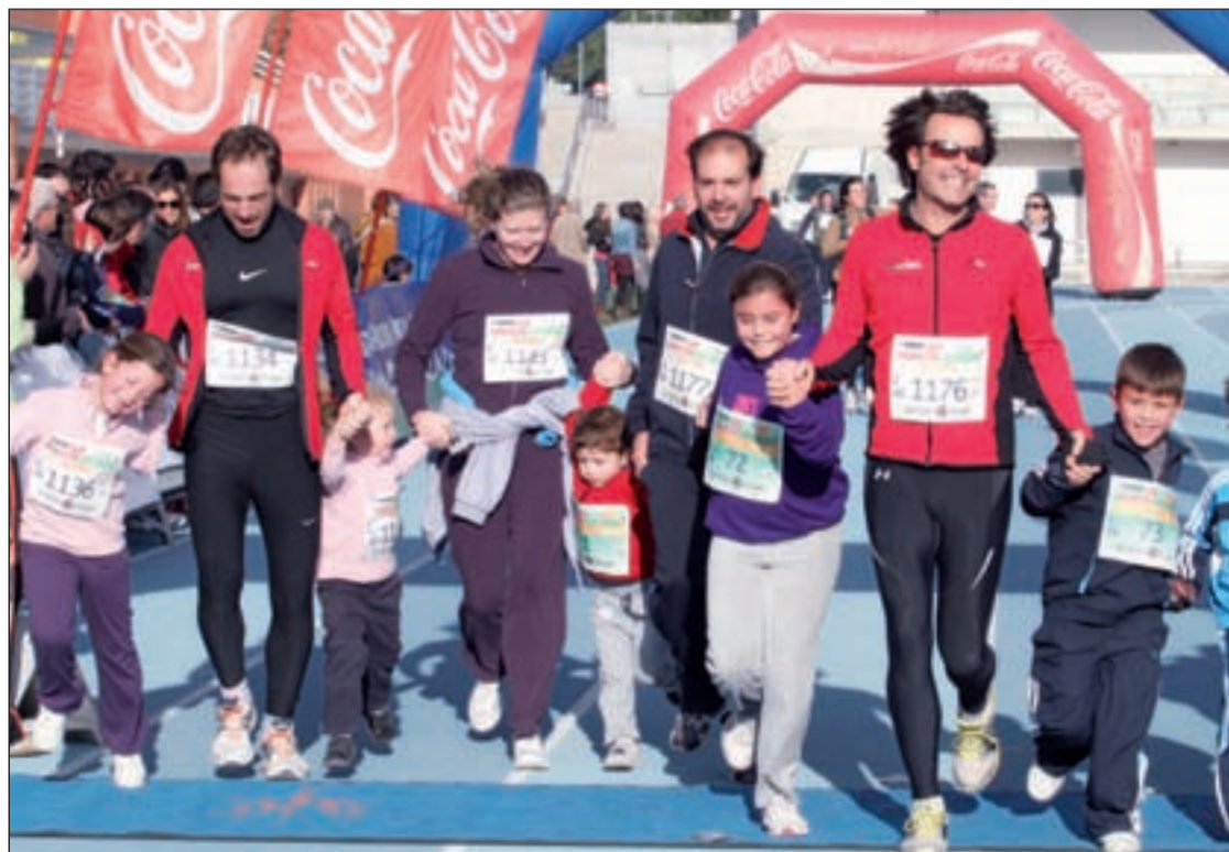
Imagen de la Marcha Familiar de la edición anterior en la San Silvestre de Las Rozas

Este año, la prueba cambia el itinerario y será un recorrido mixto, 70% urbano y 30% a través del Pinar de la Dehesa. La competición será cronometrada mediante chips. Una vez finalizada irán desarrollándose el resto de