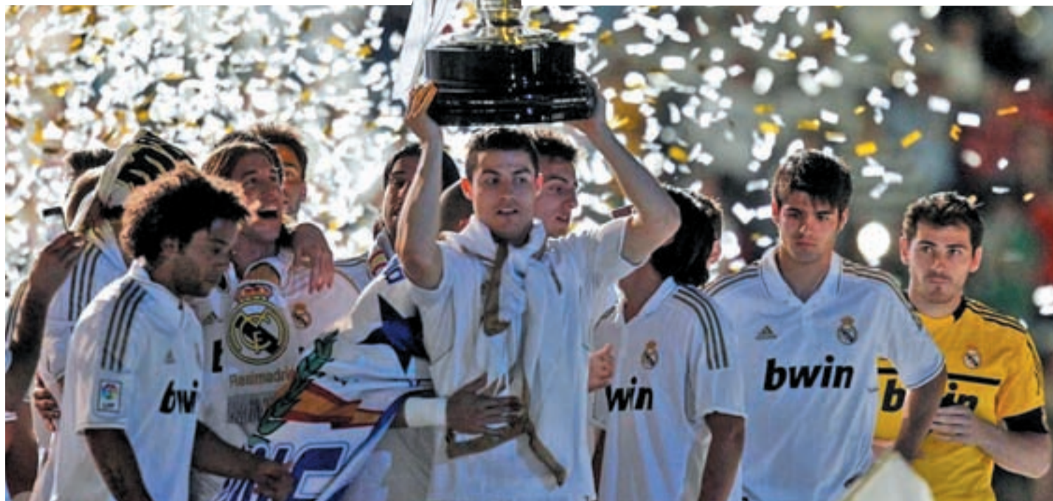
El Real Madrid conquistó la Liga con unos números de récord: 100 puntos y 121 goles a favor

EL 2012 DEJÓ VARIOS MOMENTOS PARA LA POSTERIDAD PARA LOS CLUBES MADRILEÑOS