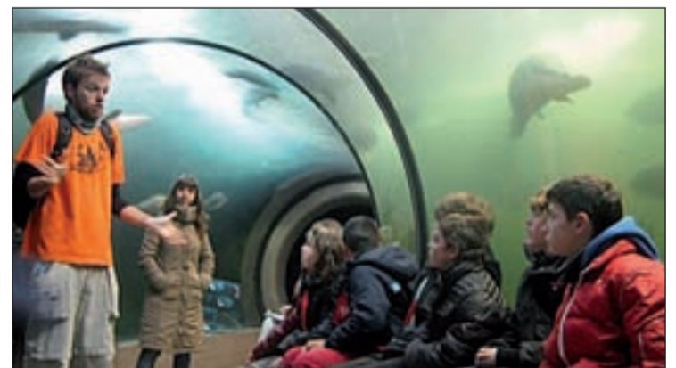
Niños disfrutando de los campamentos de Faunia

Las actividades están programadas del 31 de diciembre al 7 de enero en horario de 9 a 16 horas. Aunque aquellos padres que quieran podrán ampliarlo con el servicio de guardería disponible desde las 7.30 hasta las 17 horas. El precio es de 38 euros e incluye la entrada a Faunia, actividades, tentempié a media mañana y comida. También el parque pone rutas de autobús con salida en diferentes puntos de Madrid. Más información en campamentos@faunia.es .