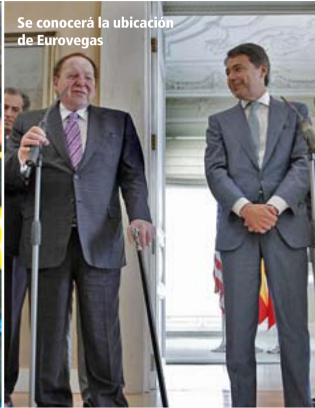
Se conocerá la ubicación de Eurovegas