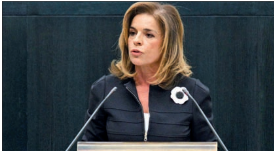
Ana Botella, alcaldesa de Madrid, tiene el salario más alto de los alcaldes de la Comunidad de Madrid

El Gobierno prepara una reforma que limitará los sueldos de los alcaldes