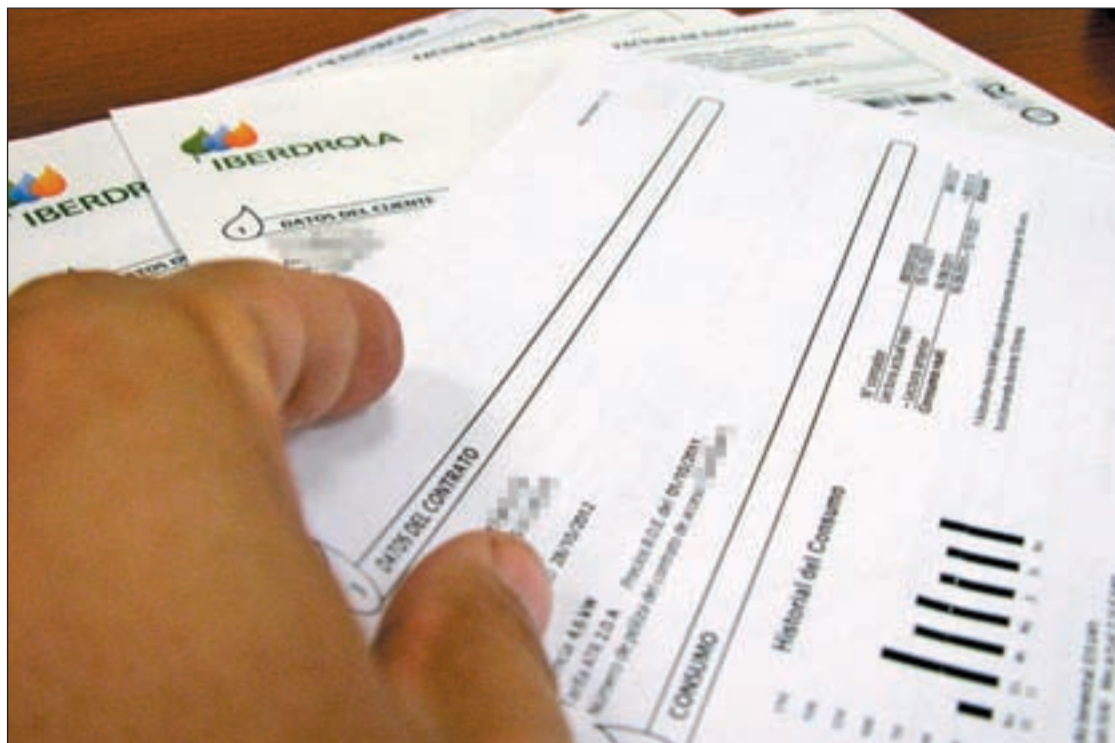
Las facturas de la luz, el IBI, el gas y la gasolina subirán en 2013

Para el próximo año se estima que la economía siga en recesión, lo que afectará a la recaudación fiscal. Los madrileños deberán prepararse para una subida generalizada de la mayoría de las tarifas. El Impuesto de Bienes Inmuebles (IBI) sufrirá el mayor aumento de los últimos tres años. Así, el recibo de una familia media (vivienda de 90