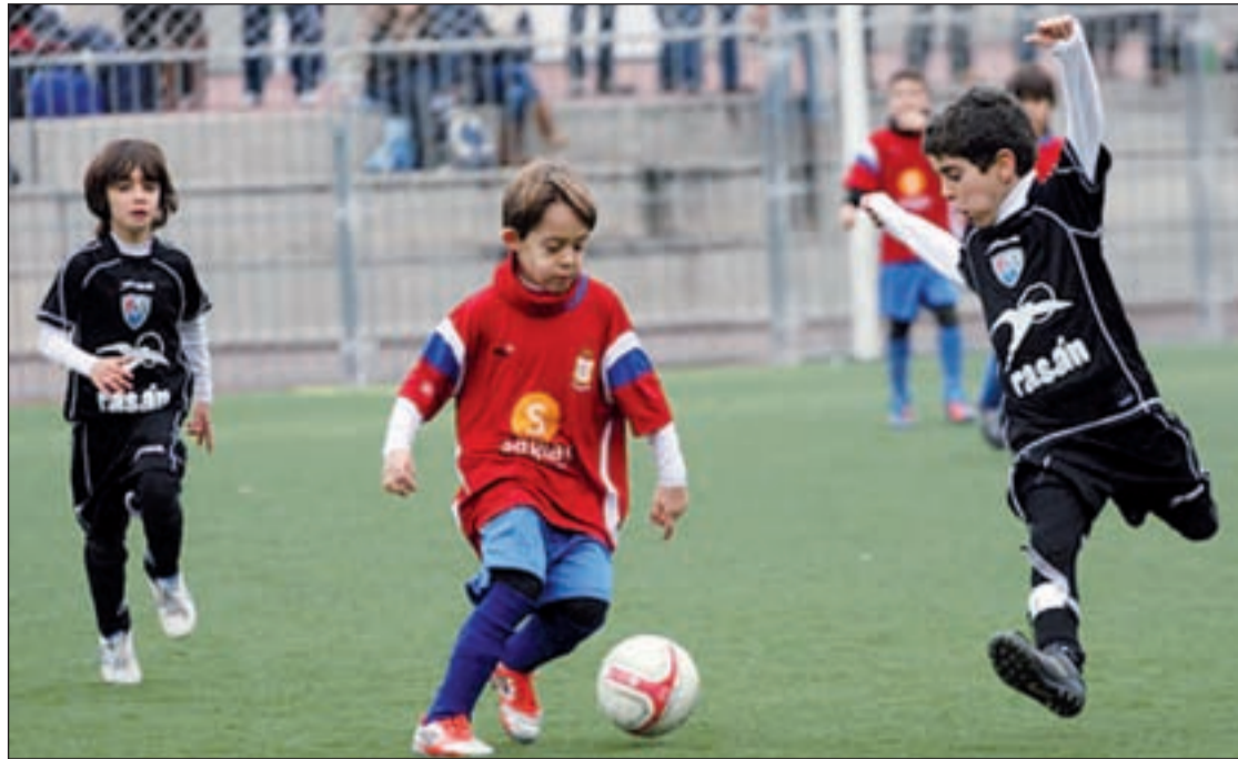
Un momento de uno de los partidos de categoría prebenjamín WWW.EDMSANBLAS.ES

El colegio Torrevilano fue el ganador del IV Certamen de Belenes de Villa de Vallecas, en el que han participado los colegios públicos y concertados del distrito de educación infantil, primaria y secundaria, Sagrado Corazón, Nueva Castilla, Mater Amabilis, Ciudad de Valencia, Torrevilano, Stella Maris La Gavia y Agustín Rodríguez Sahagún. El jurado ha valorado aspectos como la creatividad, la estética, el montaje escenográfico y la innovación, así como la utilización de materiales reciclados. En las bases se especificaba que el belén debería tener un mínimo de 25 figuras de cualquier material, tamaño y color.