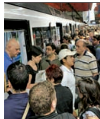
Paros en el Metro de Madrid

Los empleados de Metro protestan contra los recortes y la subida de tarifas aplicada hasta el momento, que creen que se incrementará en enero. De hecho, el mismo consejero de Transportes, Pablo Cavero, no descarta un encarecimiento.