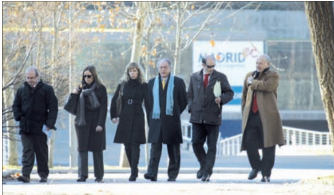
Segunda inspección del Madrid Arena, el pasado 26 de diciembre