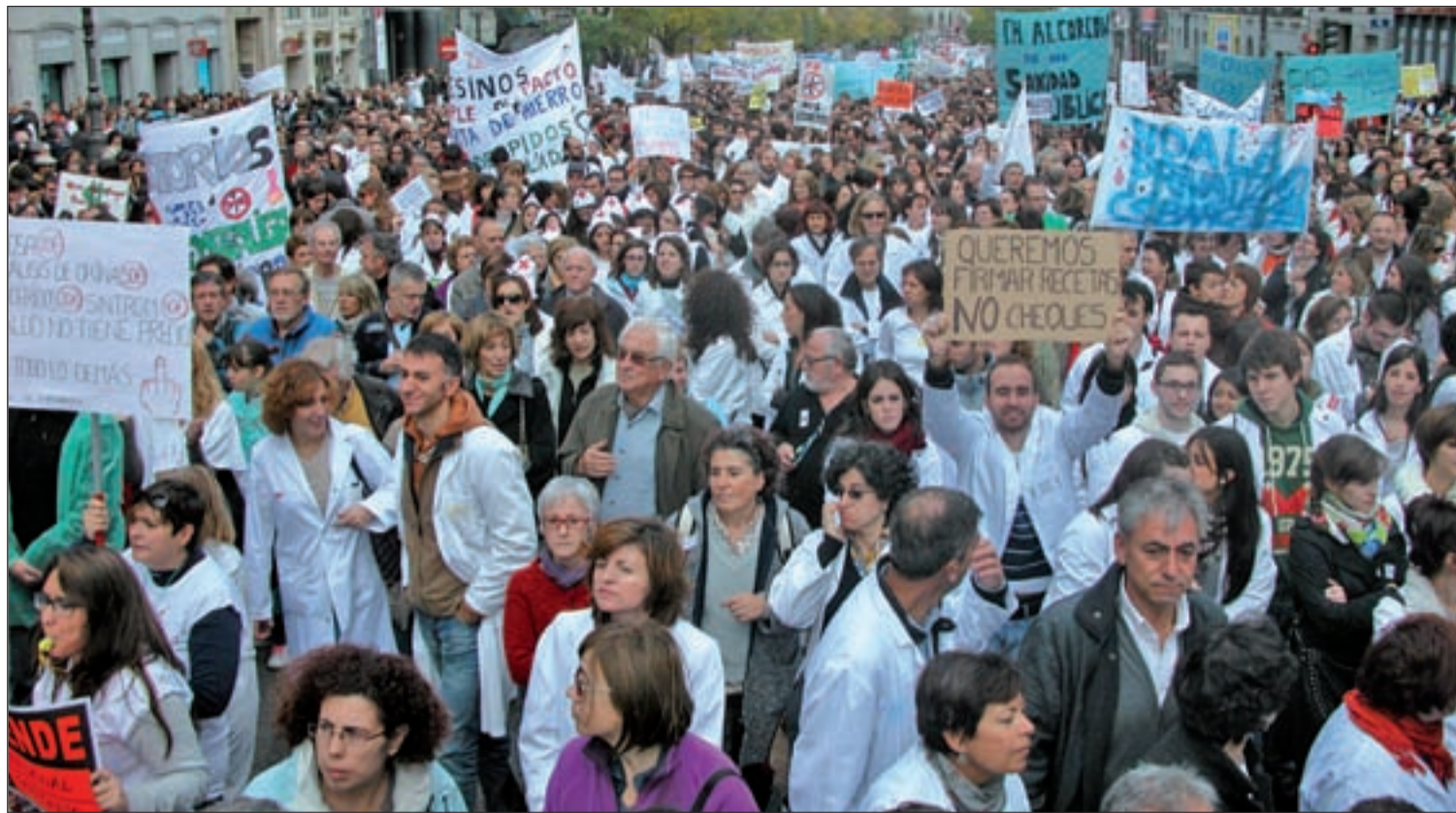
Movilizaciones de los profesionales sanitarios madrileños en contra de la externalización