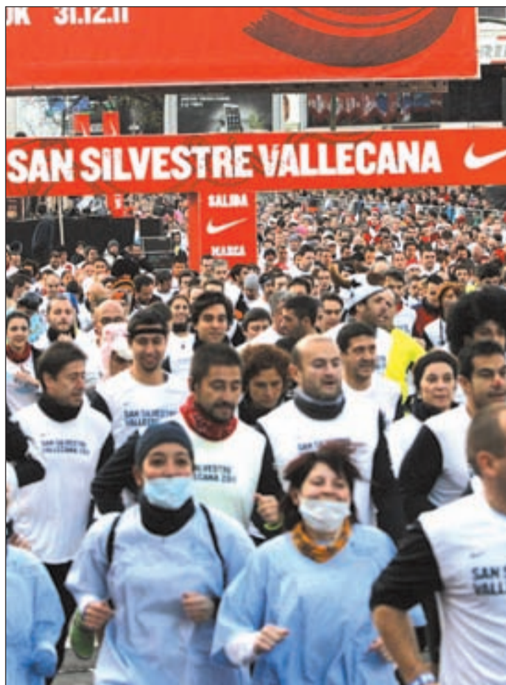
Fiesta y deporte se dan la mano en esta competición

Uno de los factores que mayor atractivo guarda para los atletas es la organización. En función de los tiempos acreditados en ediciones anteriores, los participantes son ubicados en alguno de los nueve cajones dispuestos. Esta decisión responde a la amenaza de posibles aglomeraciones en la salida y favorece a que los atletas puedan realizar el recorrido sin posibles interrupciones. La hora fijada para la salida del primer grupo es las