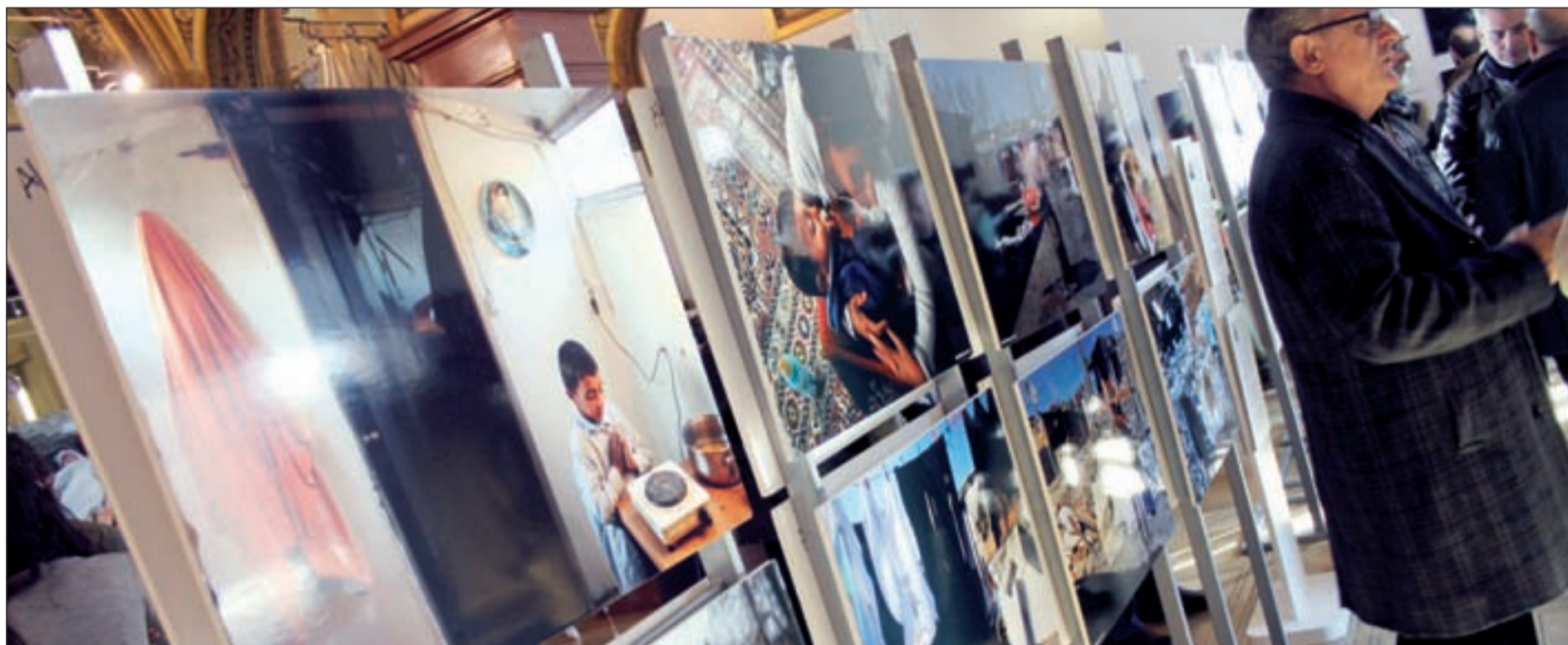
Varios asistentes contemplan las instantáneas que recogen el día a día del núcleo chabolista situado junto a la Cañada Real de Galiana, en el distrito de Villa de Vallecas