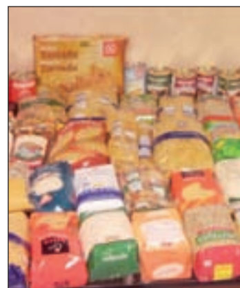
Alimentos recogidos en Vallecas

tadas de Villa de Vallecas. Por su parte, Juventudes Socialistas de San Blas-Canillejas centraron sus esfuerzos en los más pequeños. Su intención, que los niños más desfavorecidos del distrito puedan disfrutar de unas fiestas navideñas como cualquier otro niño, jugando y divirtiéndose. Los juguetes recaudados serán