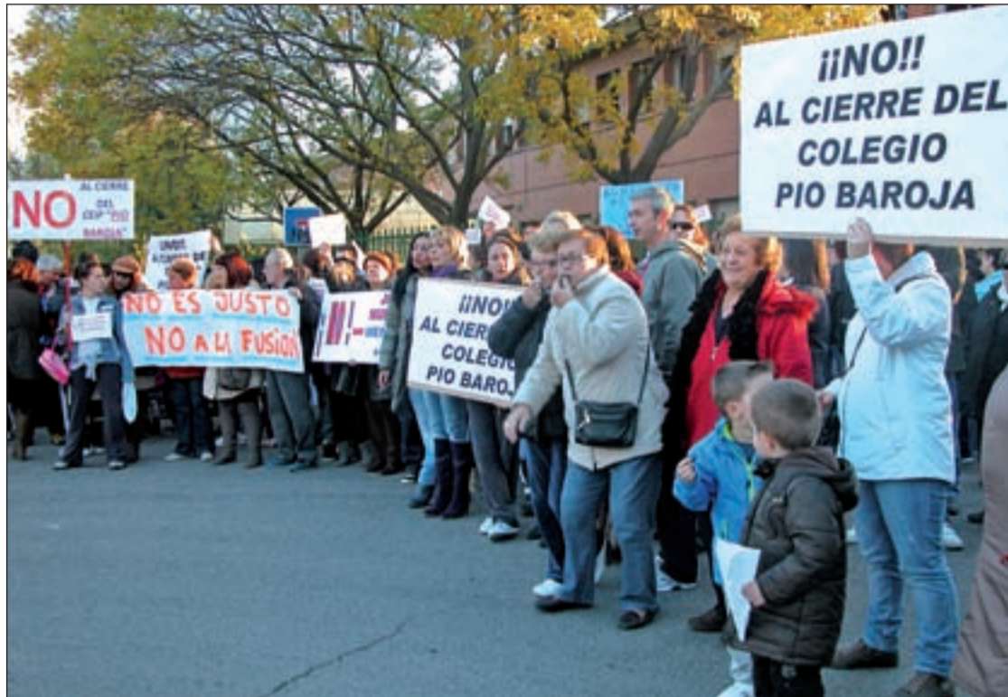
Padres, madres y alumnos del Pío Baroja, en Coslada, durante una de sus concentraciones