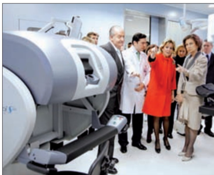
Inauguración del Hospital Rey Juan Carlos de Móstoles