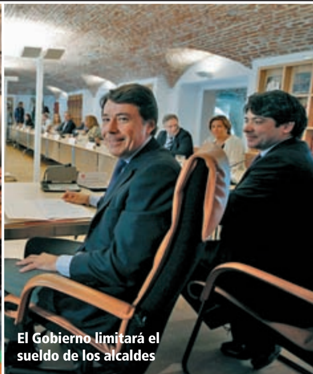
El Gobierno limitará el sueldo de los alcaldes