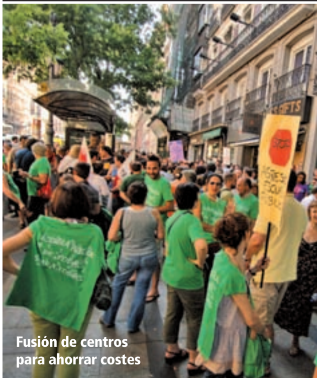
Fusión de centros para ahorrar costes

Las movilizaciones sociales en las calles y los recortes del Gobierno marcaron un 2012 para el olvido