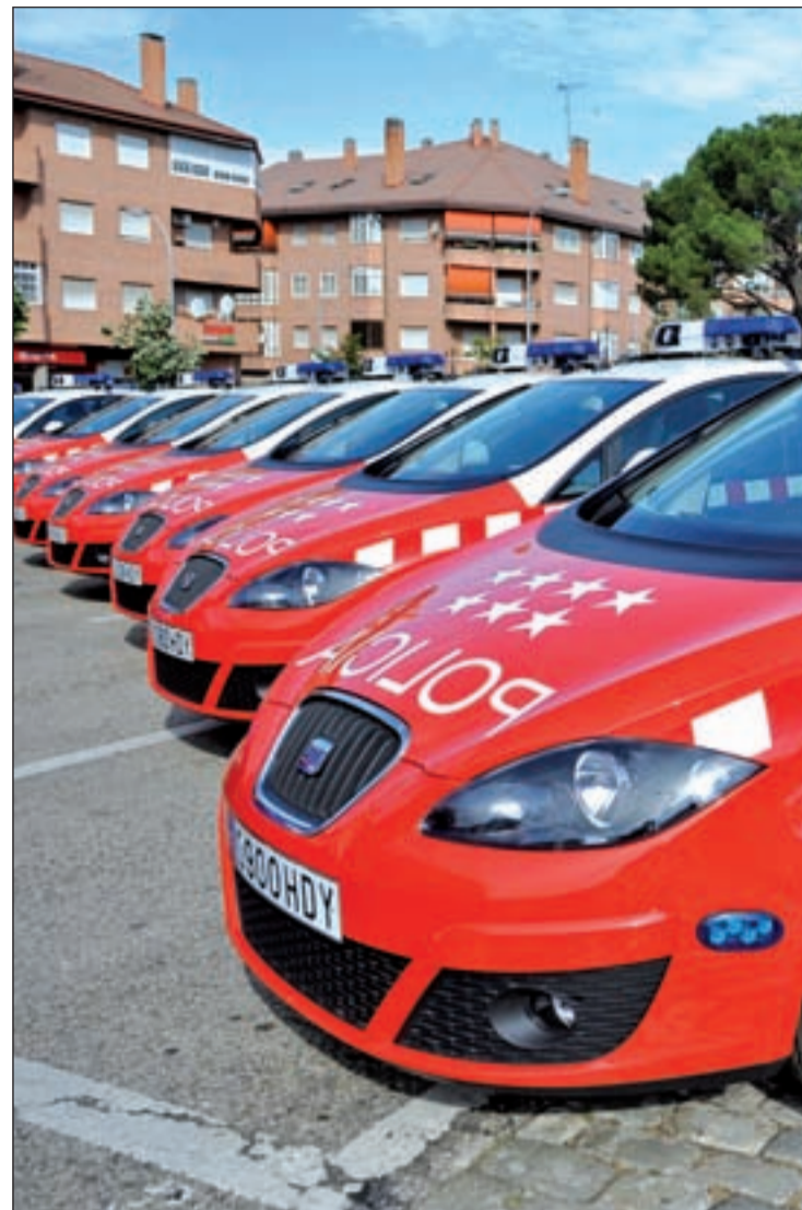
Las BESCAM fueron una importante apuesta de la Comunidad