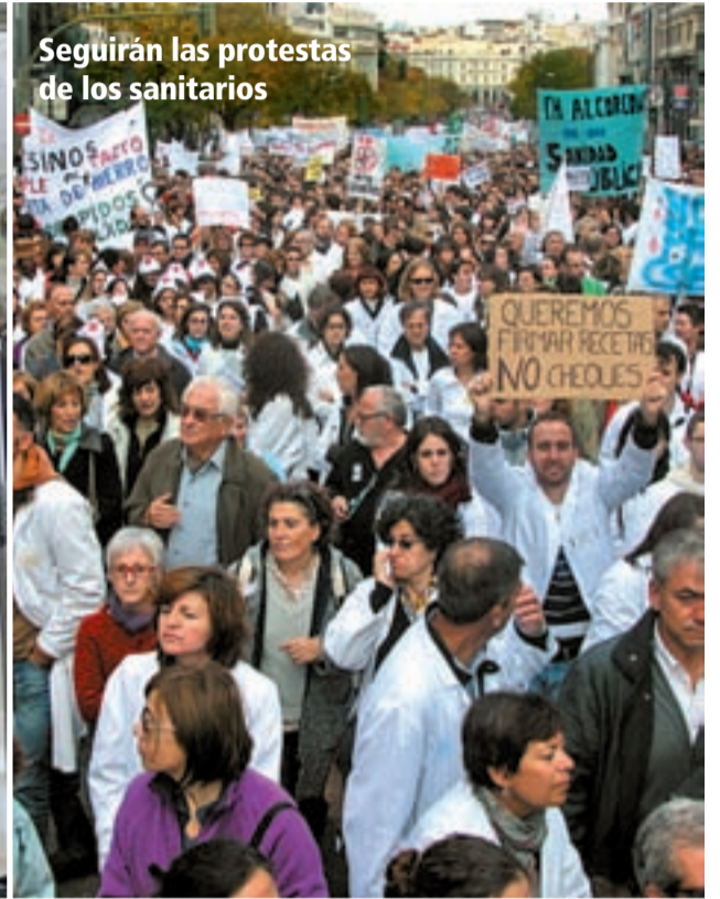
Seguirán las protestas de los sanitarios