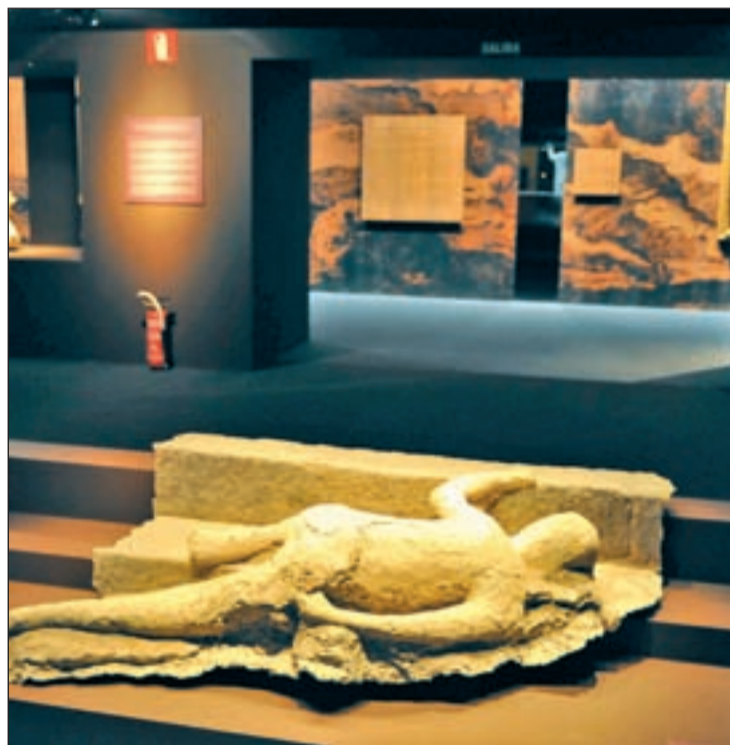
Una de las piezas de la muestra, 'Pompeya, catástrofe bajo el Vesubio'

La historia de la tragedia de Pompeya ha llevado a miles de personas a la ciudad napolitana para comprobar de cerca si es cierto que la urbe permanece 'dormida' y sus habitantes petrificados en las mismas posturas que tenían cuando el Vesubio les sorprendió. Las calles ofrecen un cuadro de la vida