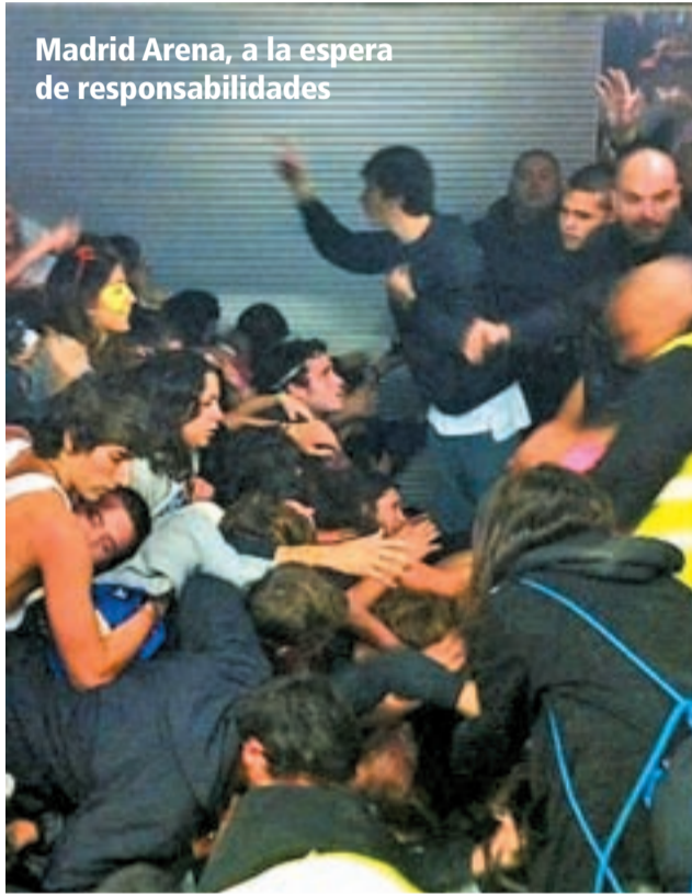
Madrid Arena, a la espera de responsabilidades

Buenos Aires, última parada para Madrid 2020 El próximo 7 de septiembre Madrid conocerá si el sueño olímpico se hace realidad. Antes, la candidatura deberá pasar otros exigentes exámenes Pág. 26