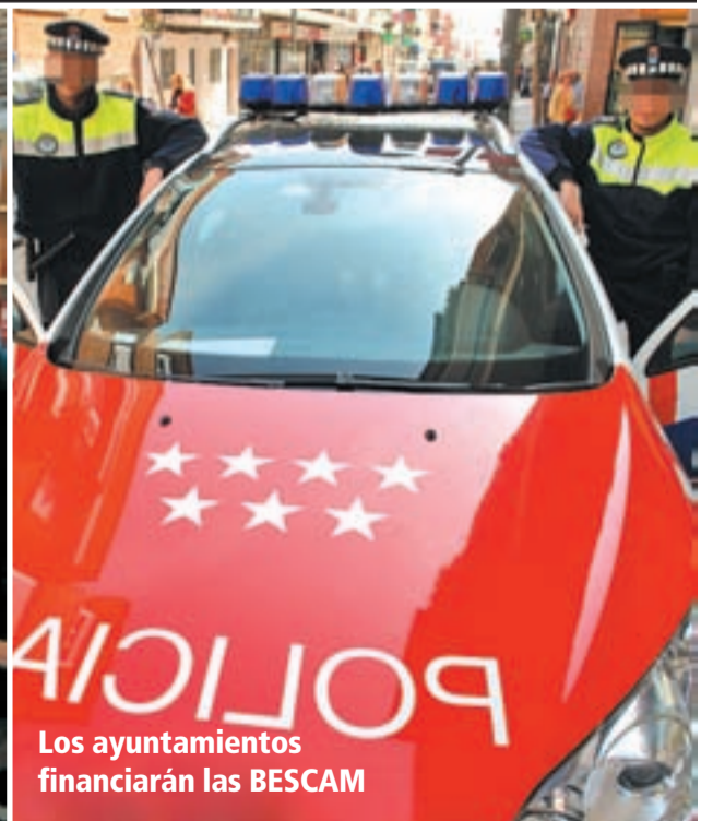
Los ayuntamientos financiarán las BESCAM