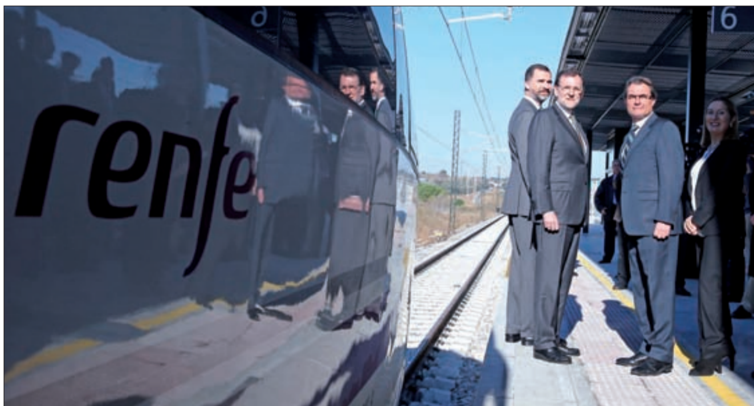
El presidente del Gobierno, Mariano Rajoy, el presidente de la Generalitat, Artur Mas y el príncipe Felipe, durante la inauguración