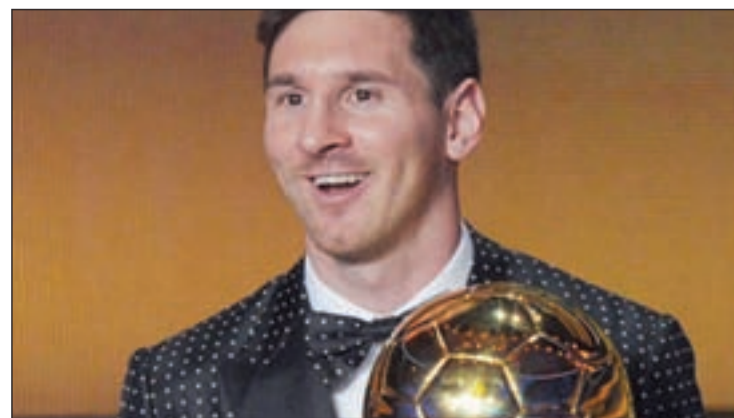
El argentino posa con el trofeo

vierte en el primer futbolista que consigue tal honor, superando a Cruyff, Van Vasten y Platini. "La verdad es que es increíble poder recibir este premio, el cuarto y encima que sean seguidos es impresionante. Quiero agradecer este premio a mis compañeros, sin ellos habría sido imposible", indicó el argentino.