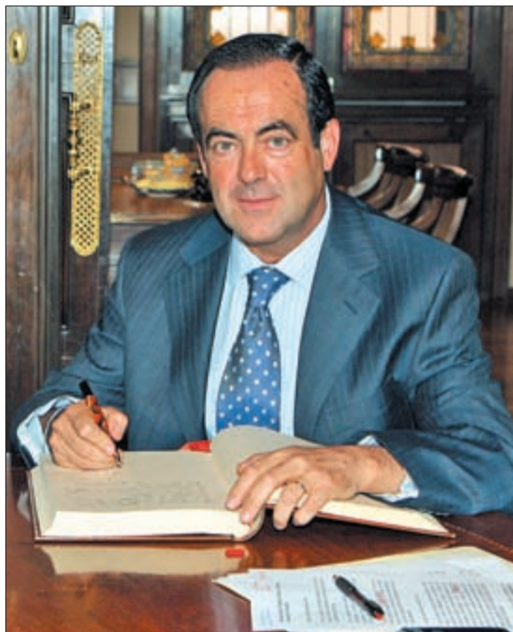
El expresidente de Castilla-La Mancha, José Bono

En Castilla-La Mancha, el PP lo ha intentado un año tras otro, pero sin éxito. Todos los años han pedido la modificación del artículo 25 de los Presupuestos que regula la partida que nutre los privilegios previstos para los expresidentes. Los votos del PSOE han frenado sistemáticamente tal reforma. Desde el Par-