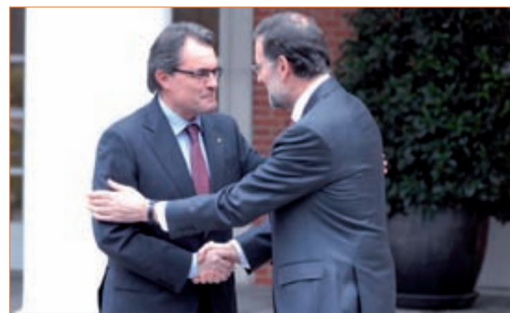
El presidente del Gobierno, Mariano Rajoy, y el presidente Artur Mas

sí que hizo referencias a este pulso entre Cataluña y España, durante su discurso. "El AVE permite anular distancias y unir territorios. Las vías férreas han sido como costuras capaces de acercar los más diversos territorios en aras de una voluntad común", dijo Mariano Rajoy tras finalizar el viaje inaugural de la nueva línea.