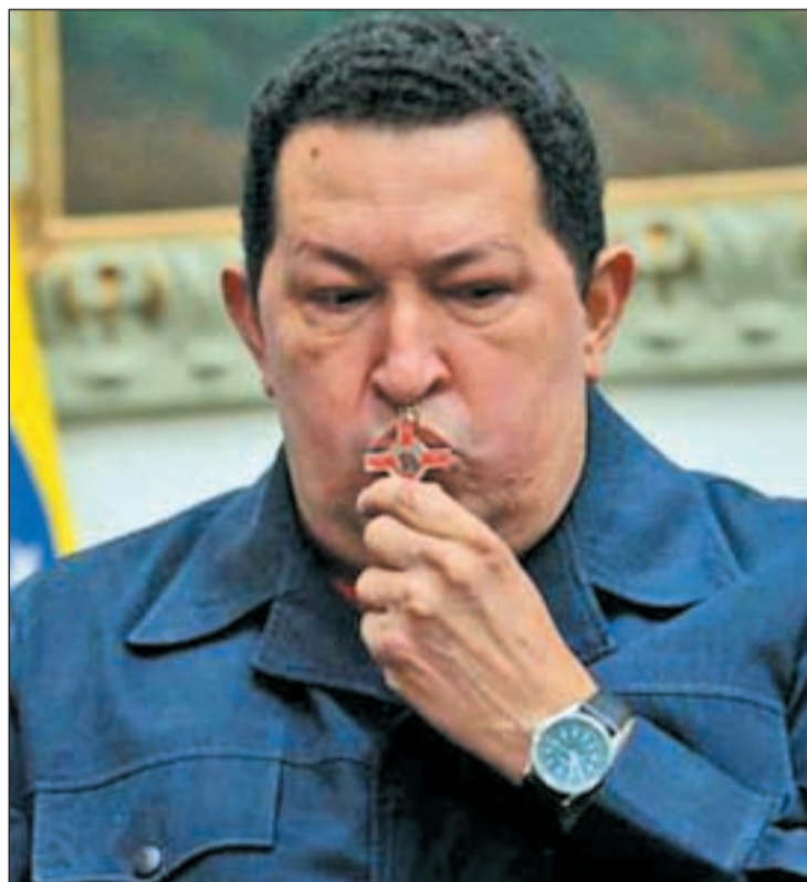
El presidente de Venezuela, Hugo Chávez

Por su parte, la oposición ha hablado en la persona del excandidato presidencial opositor y gobernador del Estado Miranda, Henrique Capriles, que tras semanas de incertidumbre rompía su silencio. En una rueda de