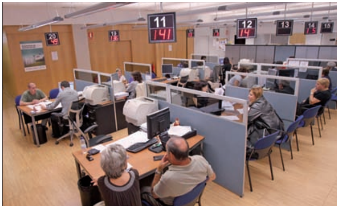
El 1,75% de los funcionarios no acudió al trabajo frente al 1,76% del sector privado