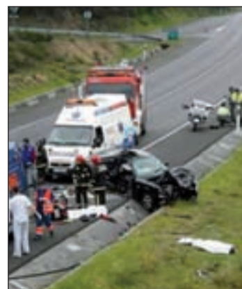
Pierden la vida 58 personas

nomas, se han contabilizado diez víctimas. El sábado se cerró con cuatro muertos y un herido grave en siniestros registrados en Cuenca, Córdoba, Sevilla y Granada, mientras que el viernes falleció una persona en un accidente en Navarra y el domingo perdieron la vida tres personas en tres accidentes regis-