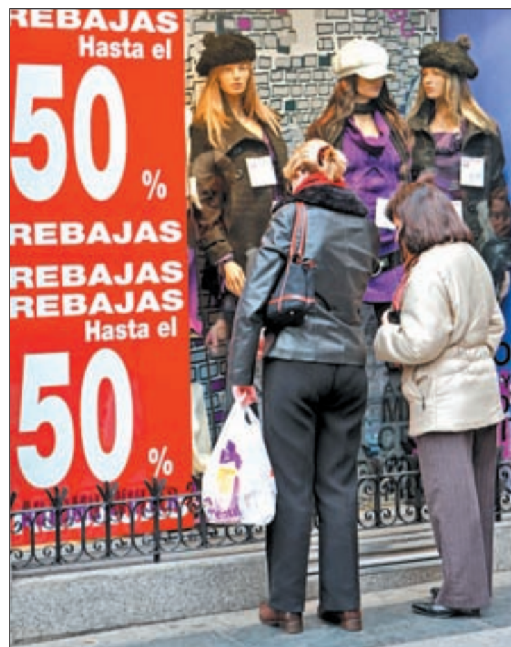
Cada español se gastará 80 euros de media en las rebajas

Estas malas cifras obligan a las tiendas a 'agasajar' a los compradores con rebajas atractivas para que se animen a comprar, y mucho. Este año cada español se gastará de media unos 80 euros en la que será la primera temporada de 'rebajas libres', lo que supone una reducción del 11 por ciento respecto al ejercicio anterior y un 33 por ciento menos que en 2007, cuando el gasto se situó en 120 euros. "El hecho de que este año el gasto previsto sea el menor de los últimos años, más de 40 euros menos que en 2007, es fiel reflejo de la difícil situación en la que viven las fami-