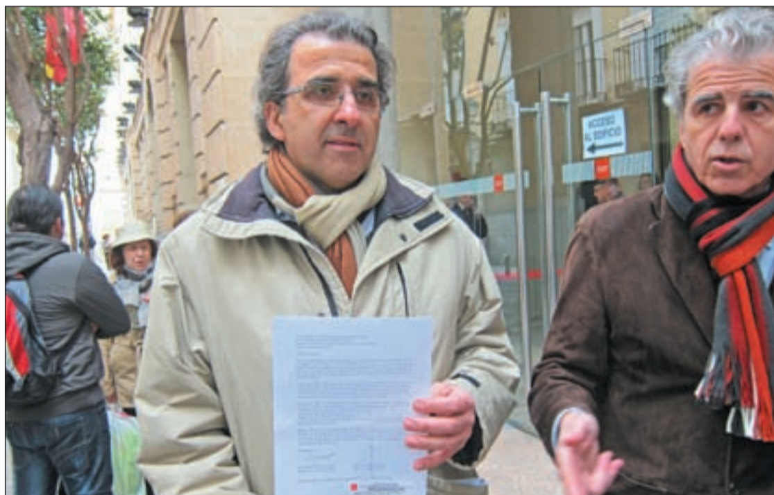
Los representantes de los directivos de CAP entregando el documento en la Consejería de Sanidad

Pero ahí no acaban el ritmo de protestas. Esta vez los sanitarios madrileños han mostrado su descontento sin necesidad de salir a la calle. Tal como anunciaron a finales de diciembre pasado, 322 cargos de 137 ambulatorios han presentado en el registro de la Consejería de Sanidad los escritos de dimisión. Las renuncias se harán efectivas a partir del momento de la publicación de los pliegos que posibiliten la privatización de seis hospitales y 27 centros de Salud de la Comunidad. El portavoz de la