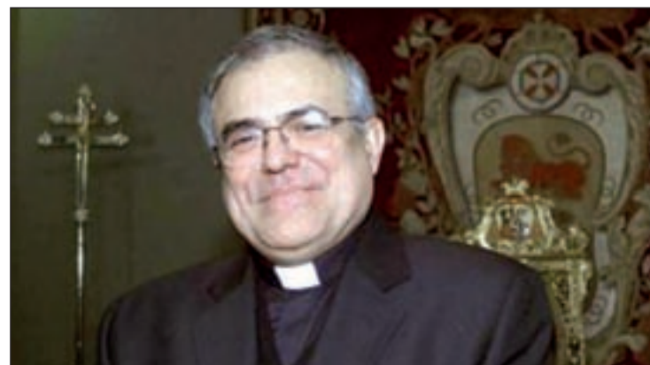
El obispo de Córdoba, Demetrio Fernández

fornicación. Pues bien, esta última carta arrestando contra el feminismo ha generado fuertes críticas. Entre ellas, del Área de Libertad de Expresión Afectivo-Sexual de IU, que va a poner en marcha una campaña en las redes sociales para pedir la dimisión del obispo. Con esta campaña, que promoverán en las redes sociales, pretenden visibilizar “la intolerancia religiosa” hacia todo aquello que signifique libertad, derechos, felicidad y emancipación social.