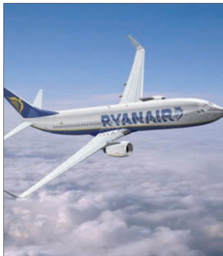
Las dudas sobre la seguridad de Ryanair surgen de nuevo

Según relatan los testigos de lo ocurrido, el primer fallo eléctrico se produjo con el avión colocado ya en pista para despegar. Así, antes de comenzar a acelerar, se fue la luz del aparato. En ese momento, se comunica a los pasajeros que ha ocurrido el fallo y el avión regresa al stand, donde se trataría de reparar la avería. En ese momento se acercan dos camiones y se informa de que el avión ya está en condiciones de despegar. Sin embargo, cuando el aparato se coloca en pista ocurre un nuevo apagón. El piloto informa entonces