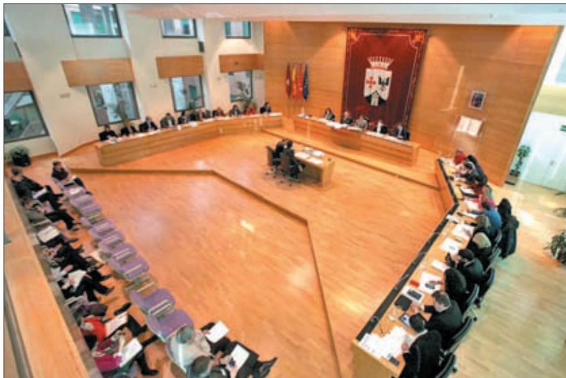
El Pleno de Alcobendas reunido

No obstante, el texto también señala que "el Ayuntamiento, por su parte, tendría que ceder suelo público del que dispone la ciudad en derecho de superficie por un