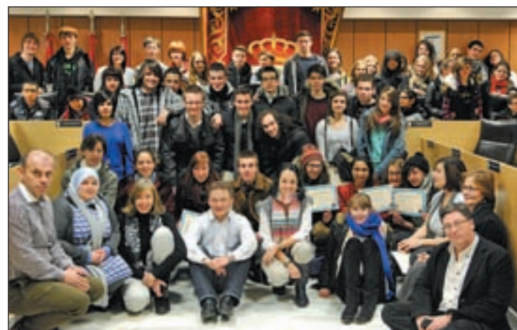
Acto por la Paz de 2012 donde participaron las AMPAS FAPA

Por ello, el PSOE exigirá al Ayuntamiento el rescate "inmediato" de la concesión administrativa de La Viña si no se procede a la apertura del polideportivo. "Son dos años de retraso y un incumplimiento del contrato de adjudicación que establece un plazo de finalización de la obra que ha sido absolutamente pulverizado", ha dicho el partido.