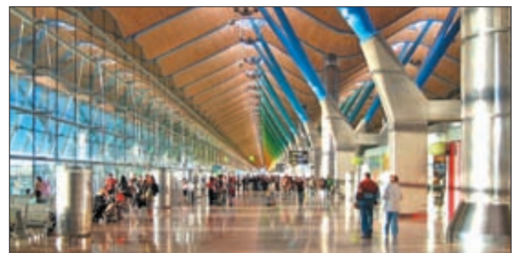
Las obras finalizarán en marzo de 2014

rán los flujos de pasajeros e introducirán novedades como el 'MAD Fashion Hub', un espacio para marcas de moda y complementos. Cuando las obras finalicen en marzo de 2014, Barajas pasará de tener unos 32.200 metros cuadrados de espacio comercial a unos 42.000 metros cuadrados.