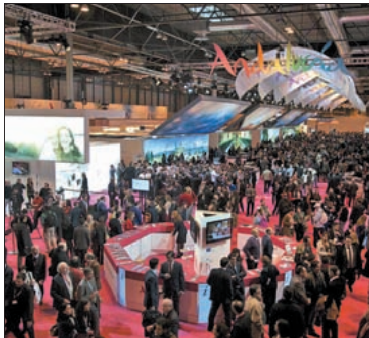
Uno de los pabellones de la edición Fitur 2013

El stand tiene una superficie de 1.595 metros cuadrados y cuenta con un gran mostrador informativo y un amplio escenario en el que se realizarán actuaciones, como la representación de una parte del musical 'Sonrisas y Lágrimas' y actos institucionales. En él, hay un espacio dedicado a la candidatura de la capital a los