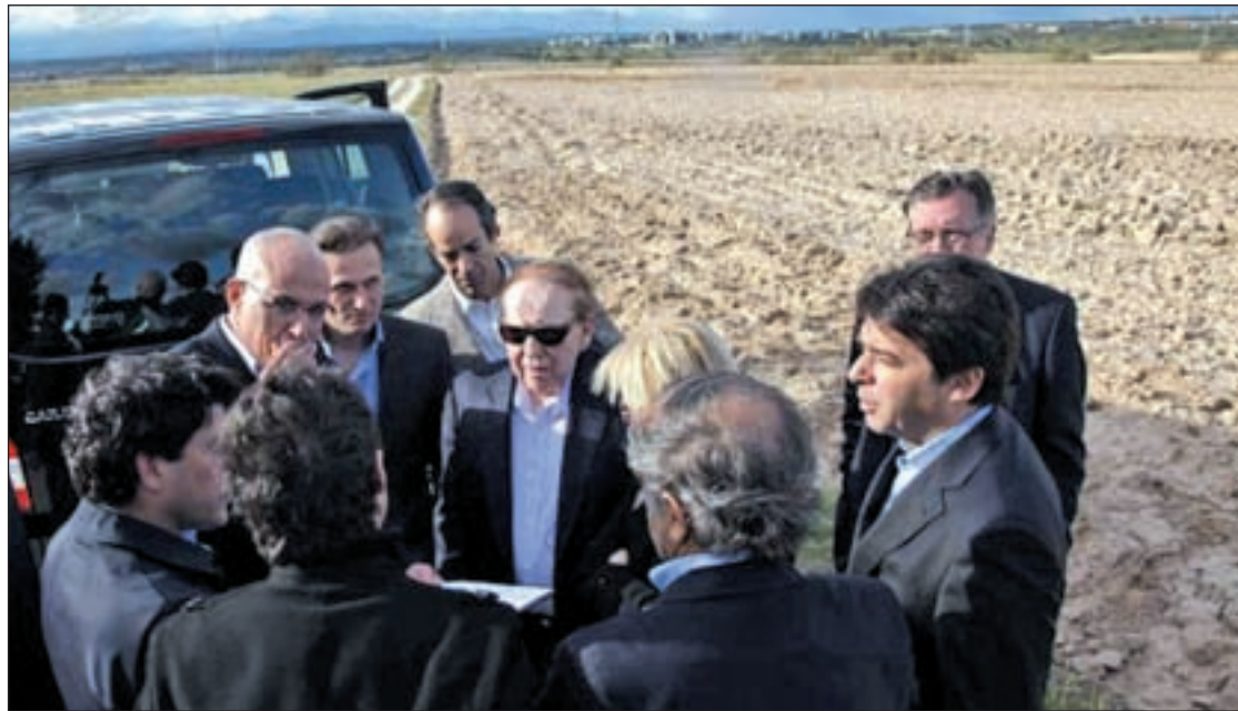
Sheldon Adelson durante una de sus visitas a la región

El número de beneficiarios de prestaciones de dependencia ascendió a un total de 81.158 personas en 2012, un 5% más que el año anterior, cuando se registraron 76.674, según el avance de la evaluación anual de 2012 del Sistema de Dependencia del Ministerio de Sanidad.