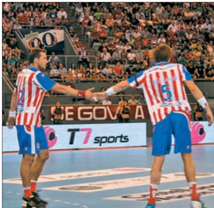
Los rojiblancos vuelven de manera oficial a la competición GENTE

La resaca mundialista ha provocado que la plantilla rojiblanca no haya entrenado al completo hasta el pasado miércoles, un contratiempo que sumado al cansancio acumulado por los internacionales que disputaron el Mundial po-