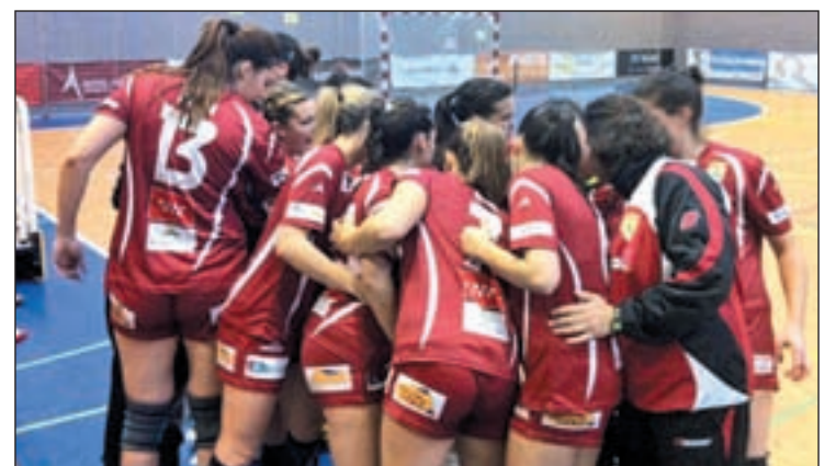
Las alcobendenses siguen cuartas en la clasificación

Los seguidores del balonmano están de enhorabuena, ya que con la misma entrada podrán acceder al partido de la División de Honor Plata que a partir de las 20 horas enfrentará al Balonmano Alcobendas masculino con uno de los candidatos al ascenso a la Liga Asobal, el Ángel Jiménez-Puente Genil. Los onubenses tie-