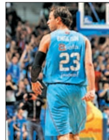
English, líder de los colegiales

Los blancos siguen como líderes tras superar al Blancos de Rueda Valladolid, aunque sólo cuentan con dos triunfos de ventaja respecto al Caja Laboral. Su próximo rival será el Uxue Bilbao Basket (domingo, 12:40 horas), un equipo que la pasada jornada estuvo muy cerca de sumar un nuevo triunfo en la pista del Barcelo-