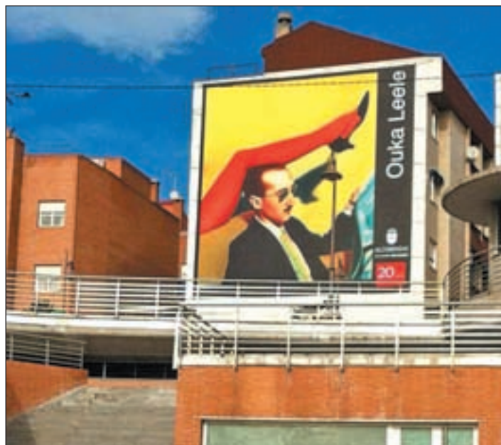
Imagen de Ouka Leele en Salvador Allende

Las muestras se multiplican a lo largo y ancho de la ciudad, donde destacan los retratos callejeros de Miguel Trillo en el Paseo de Valdelasfuentes, la exposición de 'Bango y Trainproyect' de José Ramón Blas en el Centro de Arte, la muestra con fotografías inéditas