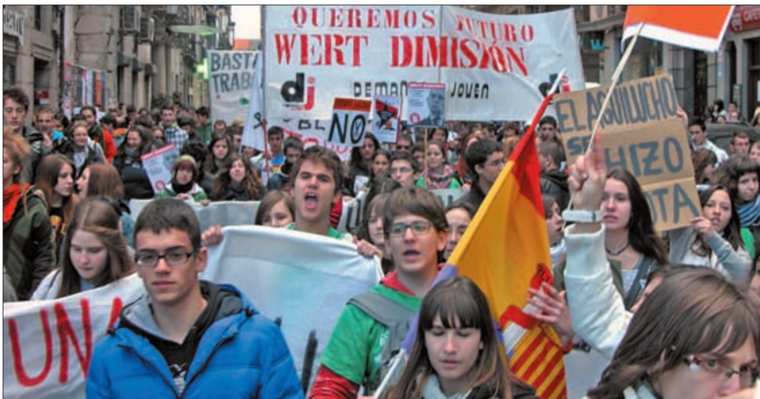
Los recortes y la ley 'Wert', el foco de la huelga y las protestas