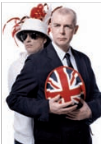
Pet Shop Boys