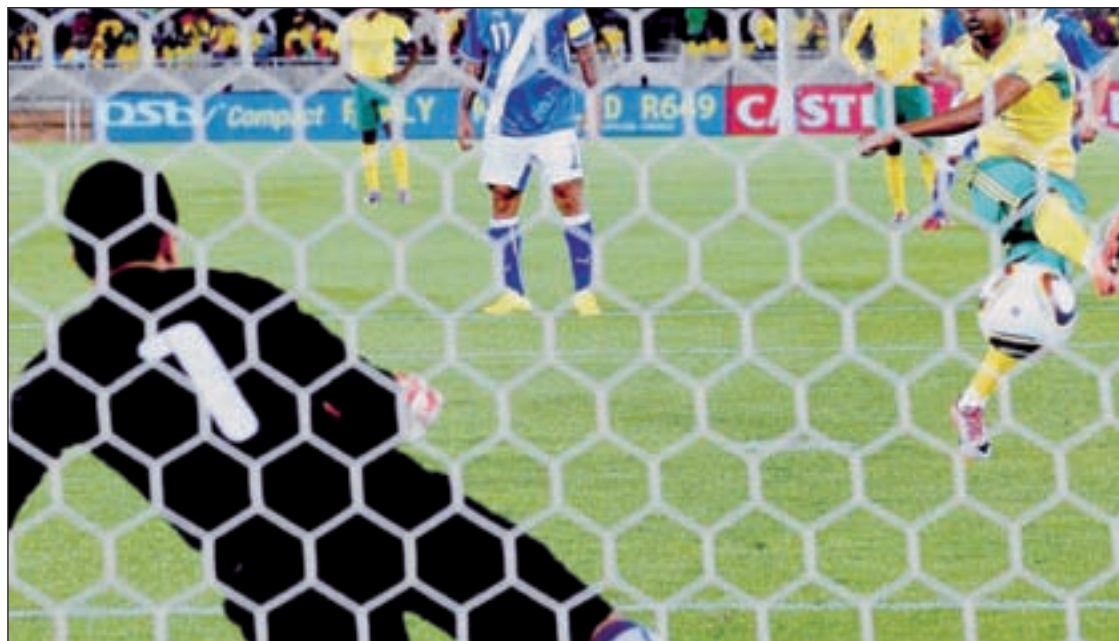
El amistoso entre Sudáfrica y Guatemala del año 2010, bajo sospecha