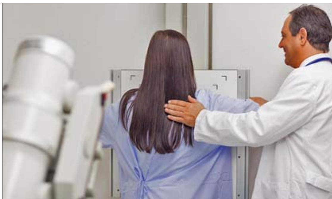
Cada año se diagnostican en España 200.000 nuevos casos de cáncer

Los niños son los que más están padeciendo esta enfermedad. De hecho, se observa un aumento significativo de las tasas de incidencia de gripe en los menores de 15 años, y también en el grupo de 15-64 años y estable en los mayores de 64. Desde el inicio de la temporada se ha registrado una defunción por virus de la gripe B; se trata de un hombre mayor de 64 años con factores de riesgo de complicaciones por gripe del que se desconoce si había recibido vacuna antigripal y no se ha informado en qué comunidad autónoma residía. Además, se han notificado 42 casos graves hospitalizados.