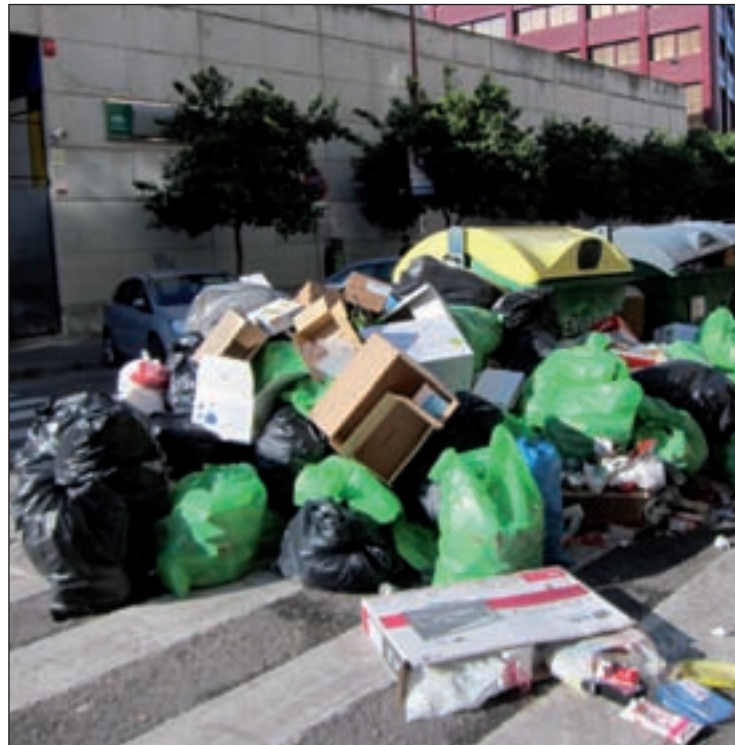
Una de las calles de Sevilla, plagada de basura

Mientras los ciudadanos aprenden a convivir con las montañas