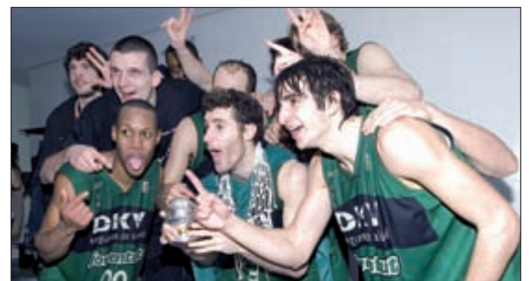
Rudy Fernández y Ricky Rubio llevaron al Joventut al título en 2008

que con posterioridad han ido siguiendo jugadores como Rudy Fernández o Ricky Rubio. El buen rendimiento de estos en la NBA ha hecho que la Copa del Rey sea una cita habitual en la agenda de los ojeadores que los equipos de la liga norteamericana tienen en el viejo continente. Vitoria puede ser el trampolín de otra estrella.