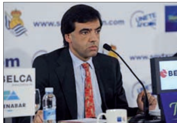
Duras acusaciones del expresidente donostiarra