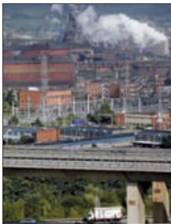
Acerlor, en Asturias

La Coordinadora Ecoloxista de Asturiass presentó una denuncia ante la Fiscalía de Medio Ambiente del Tribunal Superior de Justicia de Asturias con motivo de la "nube tóxica" acaecida el pasado