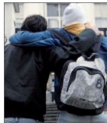
Desciende el abandono escolar

portante para los expertos es que estos jóvenes obtengan un título y una formación adecuada con la que luego acceder al mercado laboral. La UE se ha marcado como objetivo reducir el abandono temprano al 10% en 2020. Para España (donde la meta es el 15%), los economistas han señalado este camino como crucial para dejar