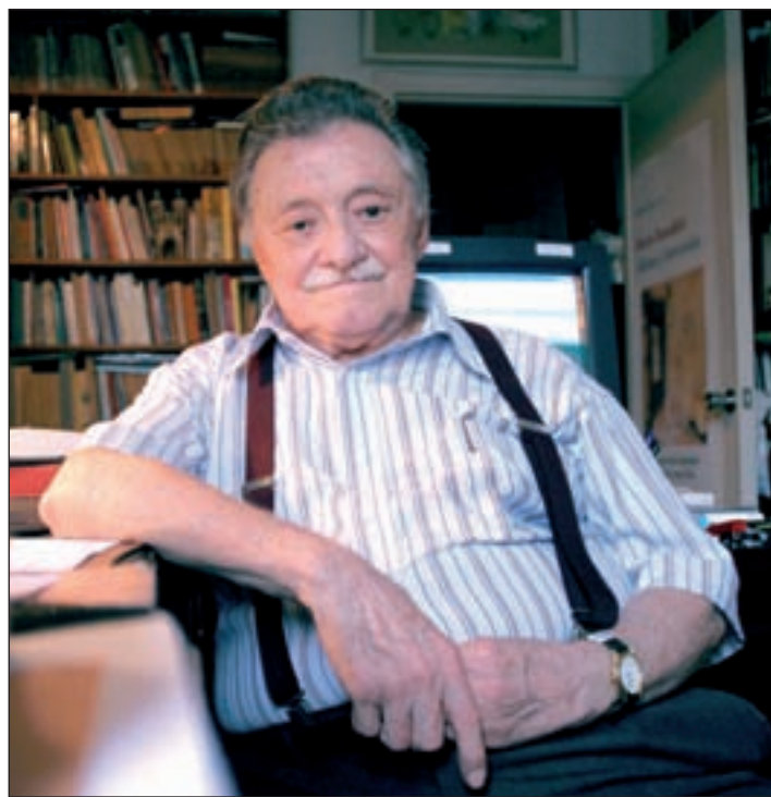
El escritor, Mario Benedetti

Dos profesores de la Universidad alicantina realizaron un minucioso trabajo de investigación y documentación. Primero comprobaron que la letra manuscrita correspondía a la del escritor uru-