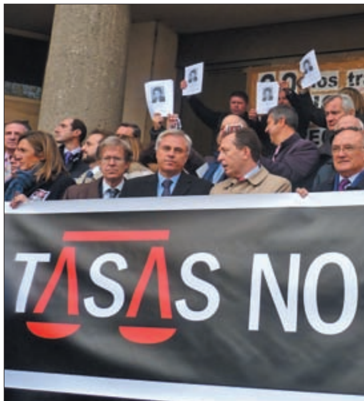
Es la tercera huelga del sector de la democracia

Ya el pasado mes de diciembre, los jueces protagonizaron un paro parcial de una hora. Esta es la tercera huelga de la Justicia en democracia. La primera se había producido el 18 de febrero de 2009, cuando cientos de jueces pararon un día entero para reclamar más medios materiales y personales al entonces ministro, el