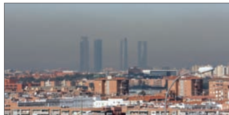
La contaminación es un paisaje más en las ciudades

nos pueden sufrir problemas de salud como aterosclerosis, diabetes o partos prematuros. En Londres, por ejemplo, un informe revela que más de 4.000 personas fallecen cada año antes de tiempo debido a la polución. La mayoría de las ciudades buscan soluciones para acabar con este problema.