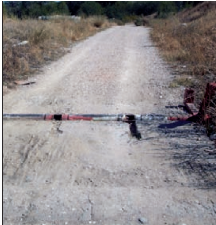
Una imagen de archivo del acceso desde Vicente Carballal AVIB

Avib explica que en la carta se anuncian unos estudios y una actuación de los que no tienen constancia. En los primeros, la Di-