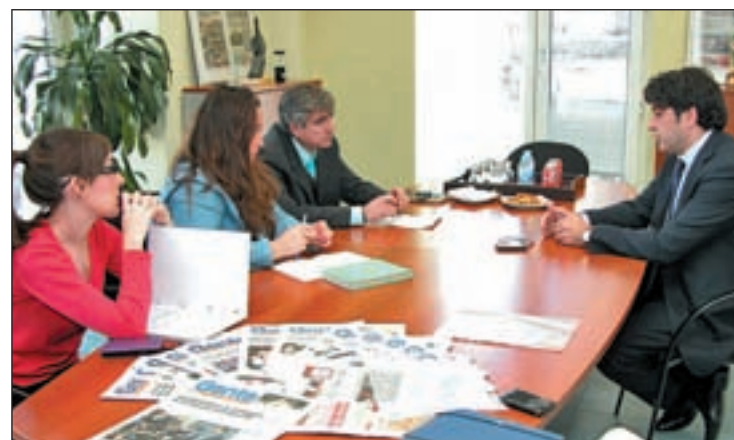
El alcalde de Alcorcón en la redacción de GENTE

Es mejor. Al principio se interpretó al revés. Cuando yo llegué había un desarrollo, un esquema, es decir, había un desarrollo que era un disparate, pero yo no quería