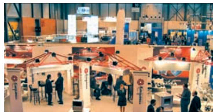
'Genera' y 'Climatización' del 26 de febrero al 1 de marzo

primera mano novedosos productos, equipos y sistemas con un alto componente tecnológico e innovador. Además, el que se acerque a la feria también podrá participar en diferentes actividades, como jornadas técnicas, talleres y encuentros para tratar temas sobre este sector.