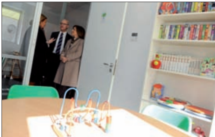
La alcaldesa recorrió los espacios del nuevo recurso

El otro de los motivos que más consultas requirió durante el 2012, con un 10,68 por ciento del total, fue el de los conflictos de los progenitores con los hijos. Las intervenciones pueden ser individuales, de pareja, familiares o grupales, y el total de profesionales que las llevan a cabo es de 69 personas, 40 psicólogos, siete trabajadores sociales, siete abogados y 14 administrativos.