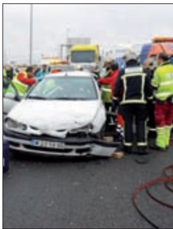
112 en acción

La colaboración con la DGT permite atender de forma más rápida y eficaz las emergencias de tráfico.