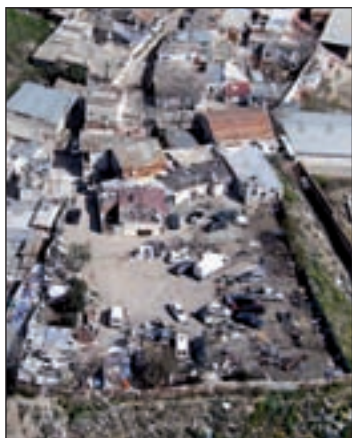
El poblado chabolista