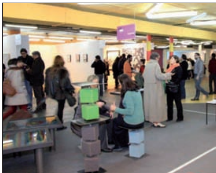
Edición anterior de la 'Feria JustMadrid'