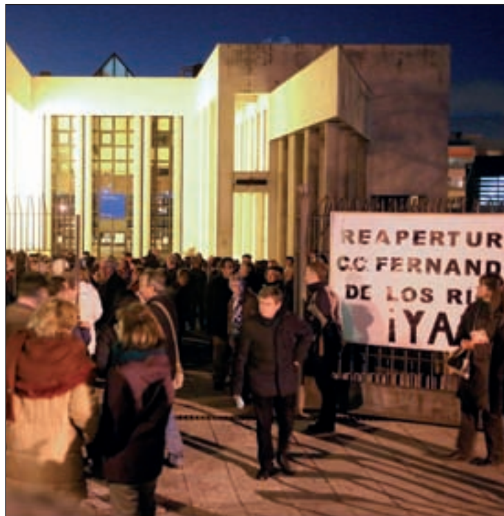
Cientos de vecinos se concentraron a las puertas del centro AVA

Además, aprovecharon la ocasión para continuar con la campaña de recogida de firmas, cuyo