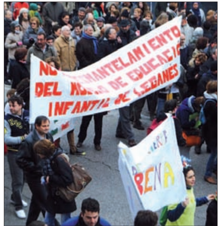
Movilización de los vecinos de Leganés contra las absorciones

Además de las fusiones, el Gobierno regional tiene previsto realizar tres absorciones de centros educativos donde reciben formación niños de 3 a 6 años. Los grupos de los colegios absorbidos se incorporarán en centros que im-