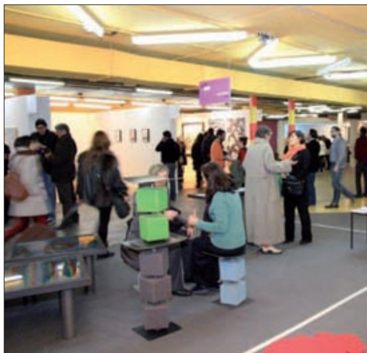
Edición anterior de la 'Feria JustMadrid'

Una de las ferias de arte contemporáneo que tendrán lugar durante este fin de semana es 'Art Madrid', que desde su sede en la