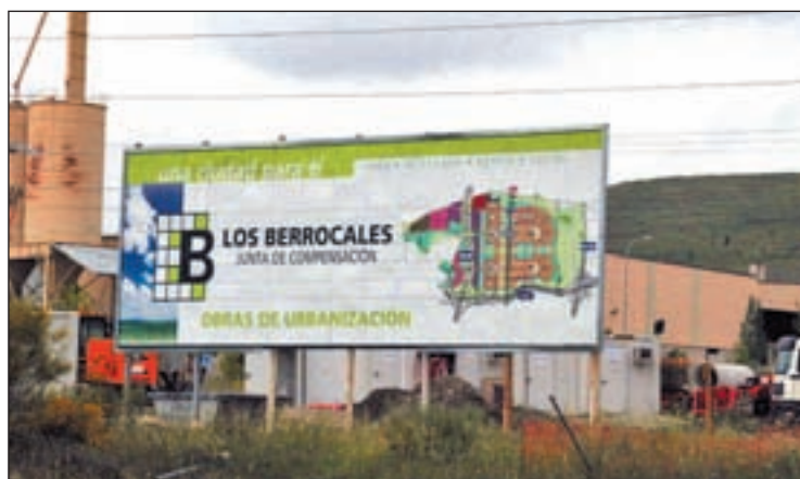
El cartel que anuncia las obras en el barrio de Los Berrocales

El informe final en formato de monografía, según sus responsables, recopila y organiza los conocimientos existentes para ayudar a comprender el presente y abordar conjuntamente el futuro a través de un diagnóstico común.