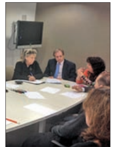
Un momento de la reunión

Los industriales, por su parte, dieron a conocer a la administración sus últimas propuestas como la reciente instalación de monitores de publicidad cruzada entre los comercios del distrito o el de-