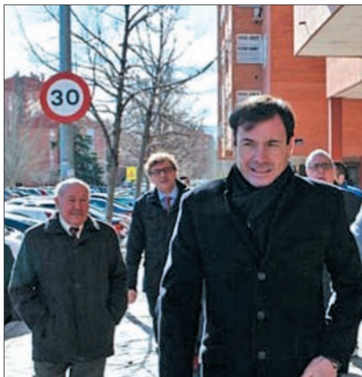
El secretario del PSM dio un paseo por las calles del distrito