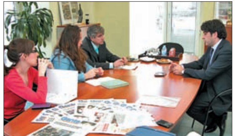
El alcalde de Alcorcón en la redacción de GENTE

Es mejor. Al principio se interpretó al revés. Cuando yo llegué había un desarrollo, un esquema, es decir, había un desarrollo que era un disparate, pero yo no quería