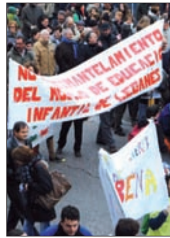
Movilización contra las medidas

Concretamente, en la zona este de la Comunidad, las nuevas medidas afectarán a Alcalá y Coslada. En el primer caso, el colegio Henares y el colegio ZULEMA se fusionarán. En el segundo, el colegio Agapito Marazuela se unirá con el colegio Hermanos Machado y, por otra parte, el colegio Pío