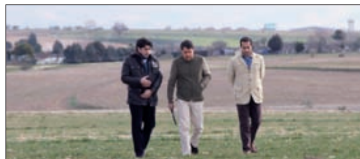
Ignacio González visitó los terrenos de Alcorcón

quierda Unida ha apuntado que Eurovegas supone "legislar a la carta para el señor Adelson, especular con el suelo del municipio". Aunque con opiniones en contra, Eurovegas es ya una realidad.