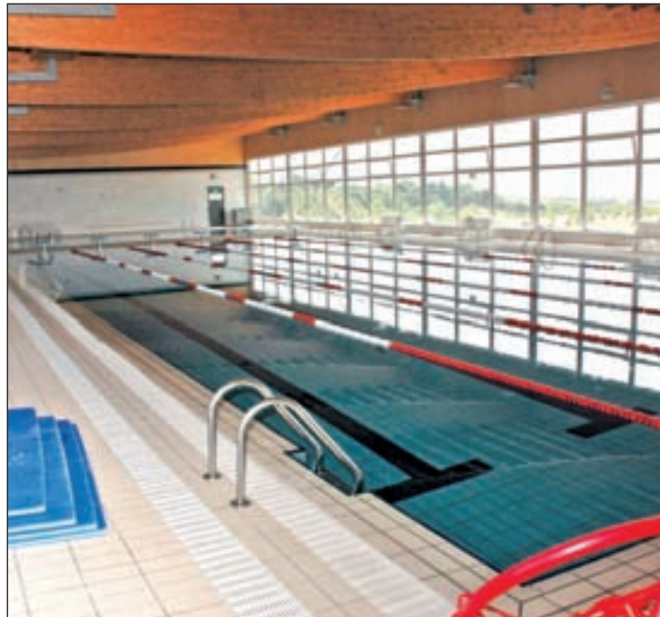
La piscina climatizada, antes de su cierre por deficiencias