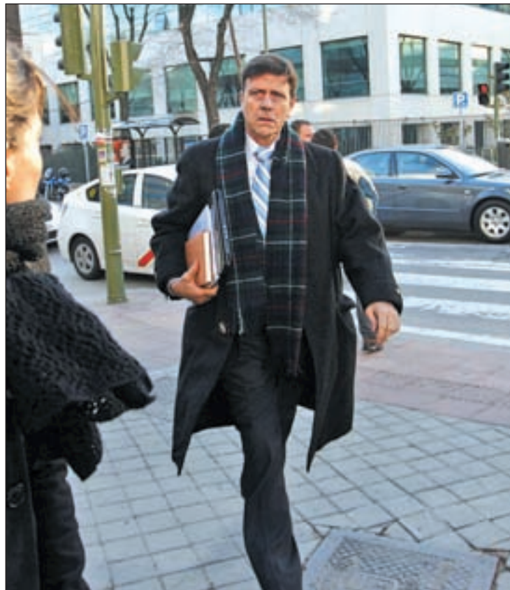
El médico canario a su llegada a los juzgados