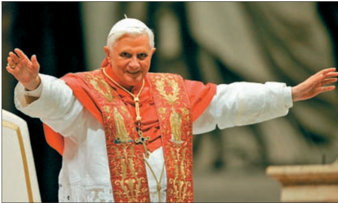
Benedicto XVI fue elegido Papa en abril de 2005