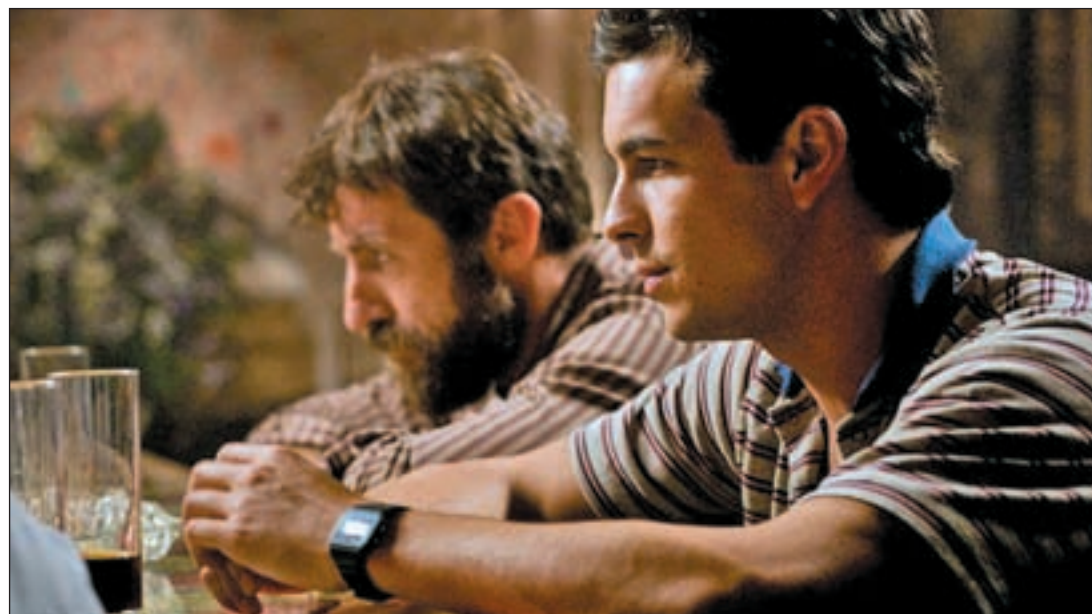
La película 'Grupo 7', la segunda más nominada en los Goya