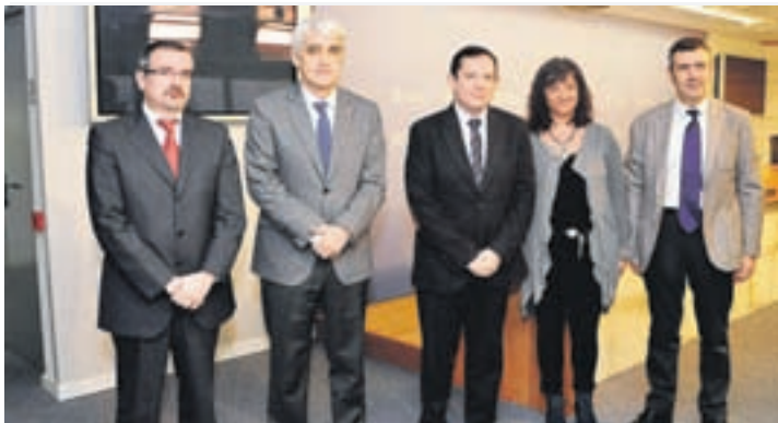
Presentación del convenio de colaboración.

Las acciones, que se caracterizan por un enfoque eminente-