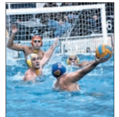
La Liga se toma un respiro

Las semifinales quedan reservadas para la mañana del sábado (11:30 y a las 13 horas), mientras que el partido decisivo está programado para las 14:30 del domingo.