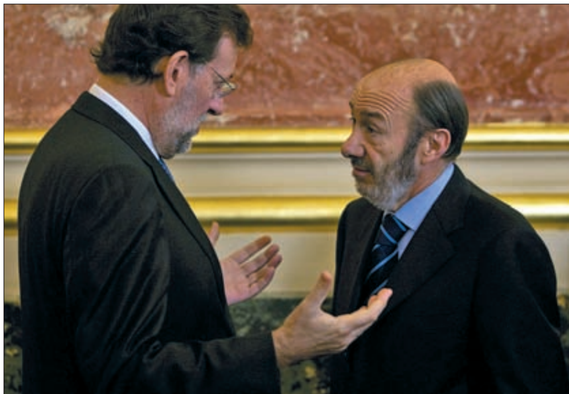
El presidente del Gobierno, Mariano Rajoy, y el secretario general del PSOE, Alfredo Pérez Rubalcaba

El líder del Ejecutivo anima ahora a todos los partidos políticos a presentar sus cuentas y mostrarlas a los ciudadanos en un ejercicio de verdadera transparencia. Y va más allá y ha tenido que volver a rectificar. Rajoy ha anunciado que los partidos políticos se someterán a la Ley de Transparencia, pese a que el proyecto elaborado por el Gabinete de la vicepresidencia los excluía. "Promoveré que los criterios de la ley se aplique a los partidos", dijo el presidente el miércoles durante la sesión de control en el Congreso. De hecho, propondrá nuevas medidas para luchar contra la corrupción. "Si algún Gobierno ha tomado medidas, es este", afirmó Rajoy en el Congreso, después de alabar su iniciativa de hacer públicas sus declaraciones de renta y patrimonio, al igual que el resumen de las cuentas del PP. "No son Administraciones públi-