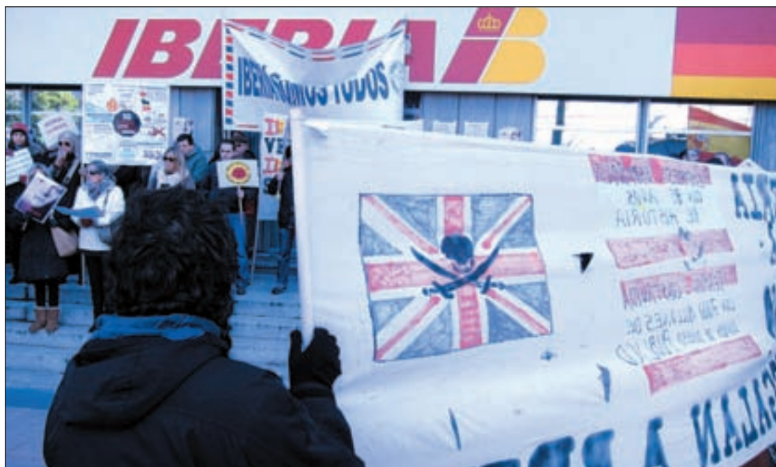
El ERE de Iberia afectará al 19% de la plantilla