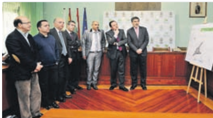
Presentación de la tercera fase de remodelación.

La tercera fase de remodelación del Paseo de la Constitución