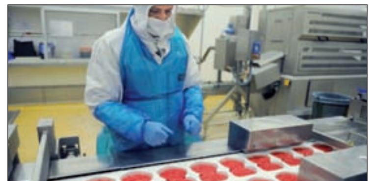
El problema con la carne de caballo llega a Bruselas

ciones inmediatas si la presencia de carne de caballo en productos precocinados anunciados como vacuno plantea un riesgo para la salud de los consumidores. De todos modos, insisten en la Unión Europea que, por el momento, se trata de un problema de fraude en el etiquetado del producto.