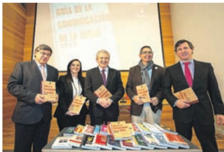
Presentación de la guía en rueda de prensa.