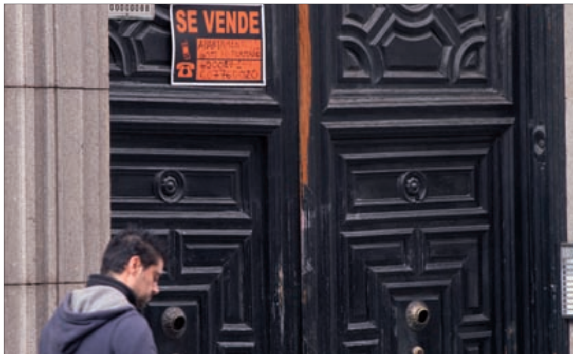
En 2012 se vendieron 295.700 viviendas

Bankia vendió 14.600 inmuebles por un total de 1.600 millones. Una cantidad que supera a los 13.777 viviendas vendidas por Sabadell, que incluye las viviendas de la CAM, pero que superan el importe de Bankia Habitat al totalizar 2.234 millones de euros. En cambio, el BBVA vendió 12.000 pisos en 2012. Por el momento, no ha trascendido la cifra que supone el volumen de inmuebles pero tomando como referencia la cifra media de 120.000 euros, aunque hay que tener en cuenta que