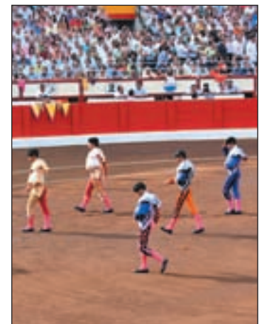
Los toros, otra vez a debate

El Congreso de los Diputados dio luz verde esta semana a la tramitación parlamentaria para declarar la fiesta de los toros Bien de Interés Cultural. Si la iniciativa sigue adelante se anularía la prohibición que pesa sobre las corridas de toros en Cataluña desde enero de 2012. La Iniciativa Legislativa Popular (ILP) fue promovida por la Federación de Entidades Taurinas de Cataluña, con el objetivo de revocar la prohibición en esta Comunidad. Cuenta con casi 600.000 firmas (se necesitan medio millón) pero precisa el apoyo de los grupos parlamentarios para continuar adelante.