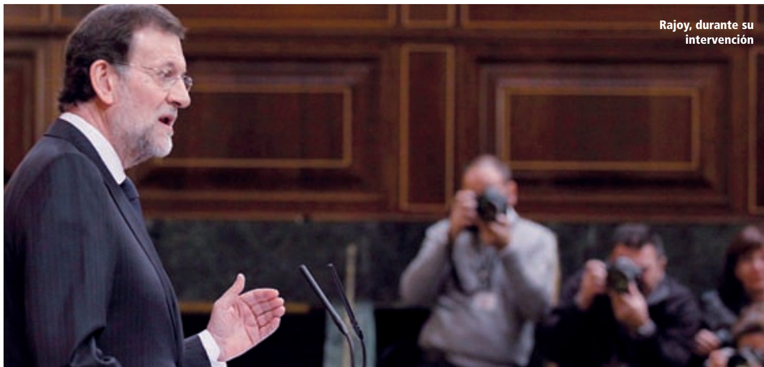
Rajoy, durante su intervención