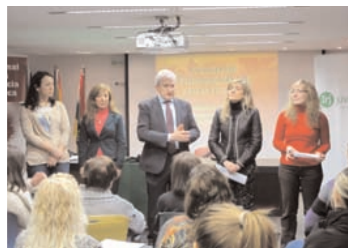
Emilio del Río, consejero de Presidencia y Justicia y portavoz, visitó una de las jornadas del curso.

El curso se desarrollará hasta el lunes 15 de abril y suma un total de 20 horas. En él están participando 15 personas, (14 mujeres y 1 hombre), con edades comprendidas entre los 18 y los 65 años. En él, los voluntarios recibirán formación teórica sobre