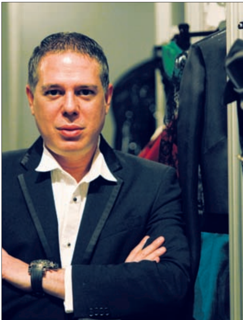
RAFA HERRERO /GENTE

Yo creo que habría que diferenciar cuando hablamos de situación de la moda entre industria y creatividad, porque son cosas muy diferentes. A los creadores en estos momentos se nos pide mucho más. Se nos pide mucha más creatividad, se nos pide mucho más esfuerzo, se nos pide mucho más trabajo porque nuestras colecciones se tienen que adecuar al momento y a la circunstancia. En este caso, se ha hecho una colección básicamente para exportar porque fuera de nuestras fronteras no existe la crisis tan dura que nosotros estamos