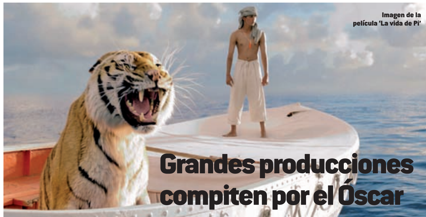
Imagen de la película 'La vida de Pi'