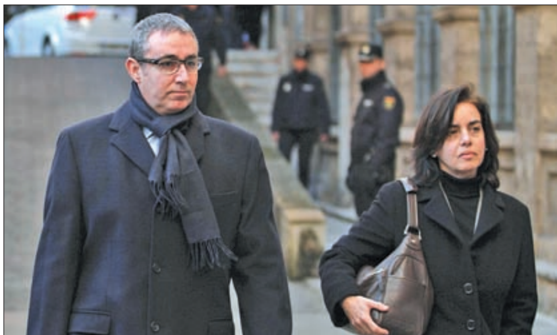
Diego Torres señala directamente al Rey en sus correos electrónicos

Otra víctima de la crisis es en este caso una inmobiliaria. Los bancos acreedores han dejado caer a Reyal Urbis, que fue en su día uno de los grandes imperios del ladrillo, tras dos acuerdos de refinanciación que no han servido de mucho y años de negociaciones para digerir una deuda que asciende a 4.400 millones de euros. La empresa ha anunciado que presentará un concurso de acreedores, el segundo mayor registrado en España tras el protagonizado en 2008 por otro vigente del sector venido a menos, Martinsa-Fadesa. La mayor parte de la deuda corresponde al banco malo que ha asumido la deuda que las entidades nacionalizadas mantenían con la inmobiliaria.