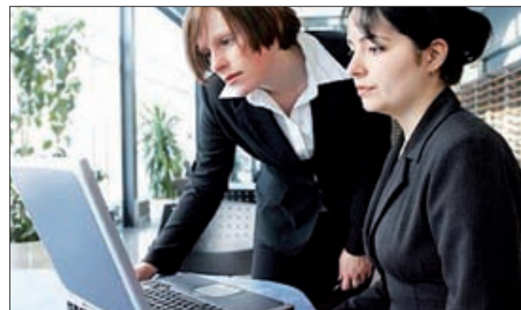
Las mujeres ganan 5.744 euros menos que los hombres

El documento presentado por el sindicato pone también de relieve que las políticas de recortes están acentuando la desigualdad