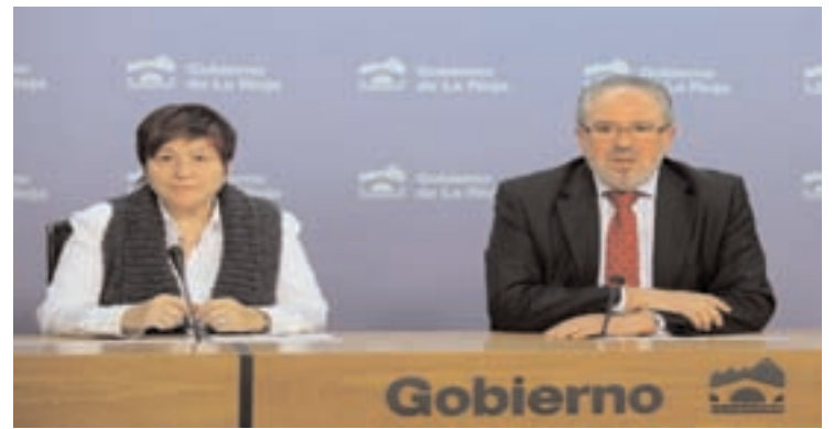
Presentación de la memoria en rueda de prensa.