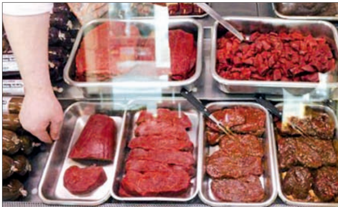
El escándalo de la carne de caballo se extiende por la cadena alimentaria de Europa

Desde el grupo suizo echan balones fuera y señalan a Alemania como el culpable de su situa-