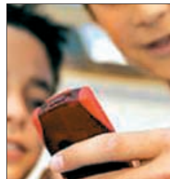
El cyberbullying llega a la red

La querrela no persigue sancionar al autor de la publicación, que es otro menor, sino exigir judicialmente a la empresa la identidad del responsable de los co-