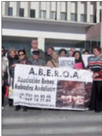
Asociaciones 'Bebés robados'