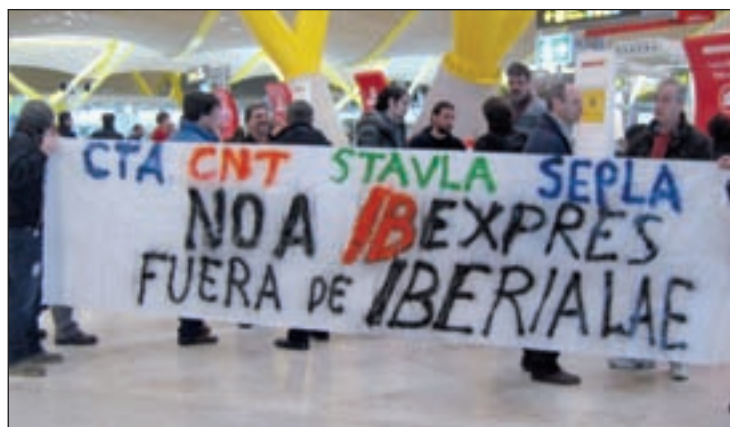
Los trabajadores de Iberia protestan en el aeropuerto de Barajas

Durante la jornada del martes no se vivió ningún tipo de incidente y el día transcurrió con tranquilidad, aunque no pudo ser considerada normal. Iberia canceló 76 vuelos, además de los 80 anulados por Air Nostrum, 79 de Vueling y 20 de Iberia Express. Duran-