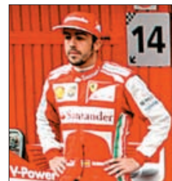
El asturiano, de pretemporada

dor Pedro Martínez de la Rosa para encontrar la mejor aerodinámica para el 'cavallino rampante' y el mejor rendimiento para los neumáticos Pirelli. Además, los pocos cambios en el reglamento técnico del Mundial permitirá a las escuderías evolucionar los coches del pasado campeonato sin tener que hacer ninguna revolución, y sacar mayor provecho a las gomas desarrolladas por el catalán Jaime Alguersuari, que finalmente se ha quedado sin volante.