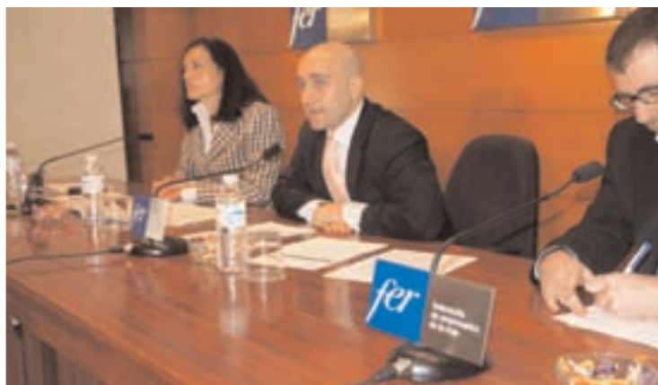
Presentación del nuevo Plan de la Fer.

-> Educación ambiental: Medio Natural apoyará un amplio abanico de iniciativas de educación ambiental promovidas por entidades sin ánimo de lucro.