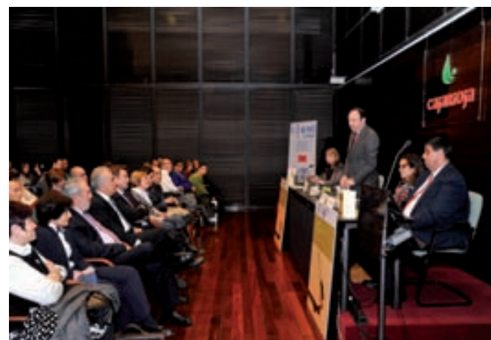
Acto de presentación del libro publicado por el CERMI.