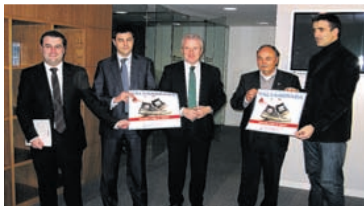
Presentación de la marcha que se celebrará el 27 de abril.