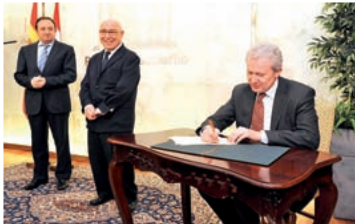
Firma del convenio de colaboración.

Este año el Gobierno de La Rioja ha decidido incrementar su aportación al Banco de Alimentos hasta llegar a los 27.500 euros (2.500 euros más que el año anterior) con el fin de apoyar la labor altruista que realiza en favor de los más necesitados a través de la recogida y reparto de alimentos ante la creciente deman-