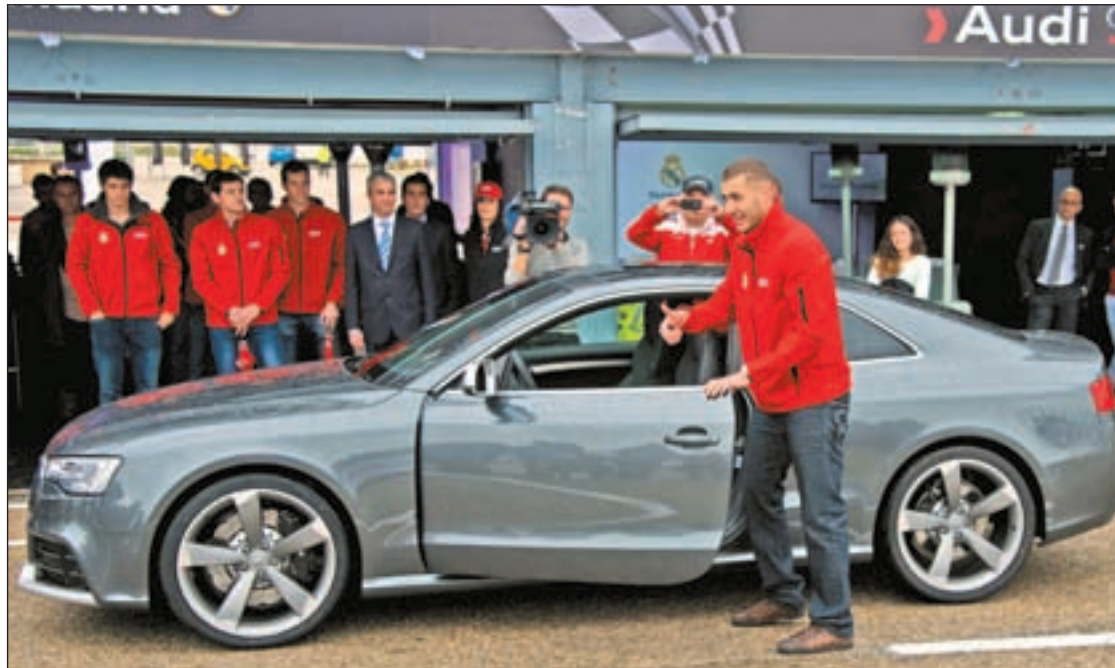
El francés Karim Benzema fue multado por exceso de velocidad en una vía madrileña

Estos expertos consideran que los padres y los profesores juegan un papel muy importante a la hora de enfrentarse al fracaso escolar. Su trabajo es detectarlo cuanto antes porque aseguran que, si no se hace, el fracaso no sólo puede provocar el abandono de los estudios o la dificultad para encontrar un trabajo en el futuro, sino que también puede influir en que esos jóvenes puedan llevar una vida normal. Los expertos aconsejan a educadores y padres buscar refuerzos o vías alternativas para evitar este abandono escolar.