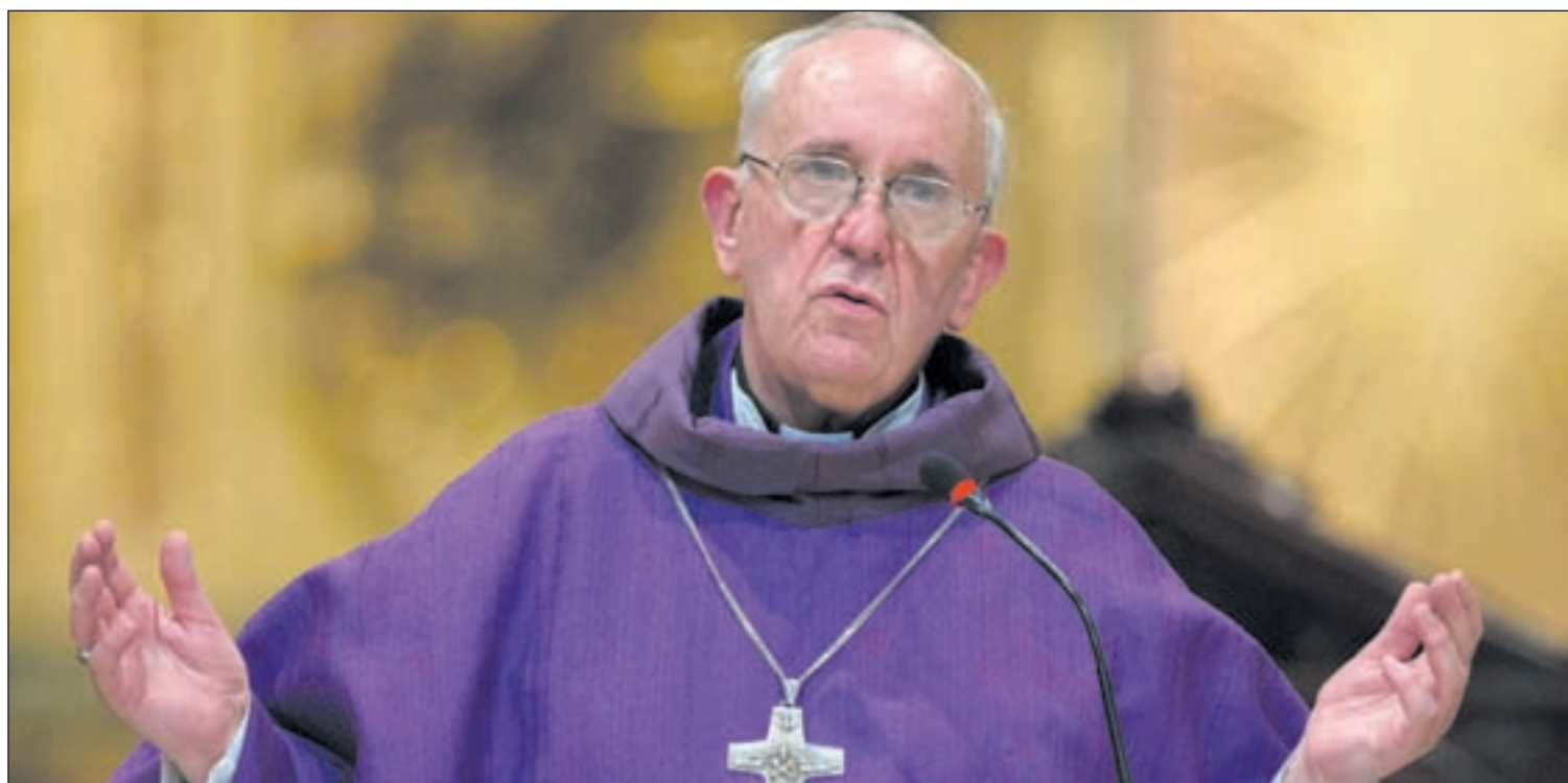
Jorge Mario Bergoglio, el Papa Francisco I