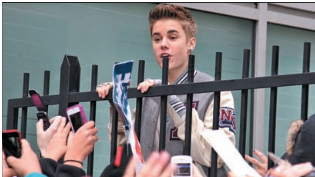
El cantante Justin Bieber durante un concierto

El jueves la cita fue en Madrid y el sábado será el turno de la ciudad condal. Para evitar cualquier tipo de incidente que se pueda producir, los menores de 14 años deberán ir acompañados de una persona mayor en el concierto de Barcelona.