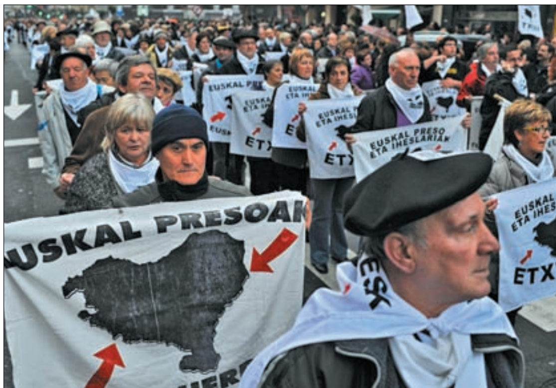
El Tribunal de Estrasburgo decidirá sobre el futuro de la Doctrina Parot

La Audiencia Nacional ha aplicado la 'doctrina Parot' a 87 presos de ETA entre 2006 y 2011,