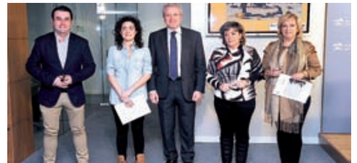
Presentación del proyecto en rueda de prensa.

'Formación y Vida' pretende llegar con esta iniciativa a 17 poblaciones ubicadas en El Sahel, comunidad situada al sur-este de Mauritania y que cuenta con una población total de más de 18.000 habitantes. La formación realizada por esta ONGD irá destinada a un colectivo de 1.500 mujeres