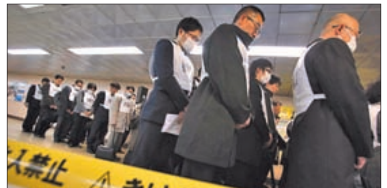
El desastre de Fukushima sigue dejando consecuencias

del mundo. Según la Agencia Internacional de la Energía Atómica, el accidente en la planta de Fukushima ralentizará o retrasará el crecimiento nuclear, pero no lo invertirá. A finales del año pasado, en todo el mundo había 437 reactores operativos, dos más que en 2011.