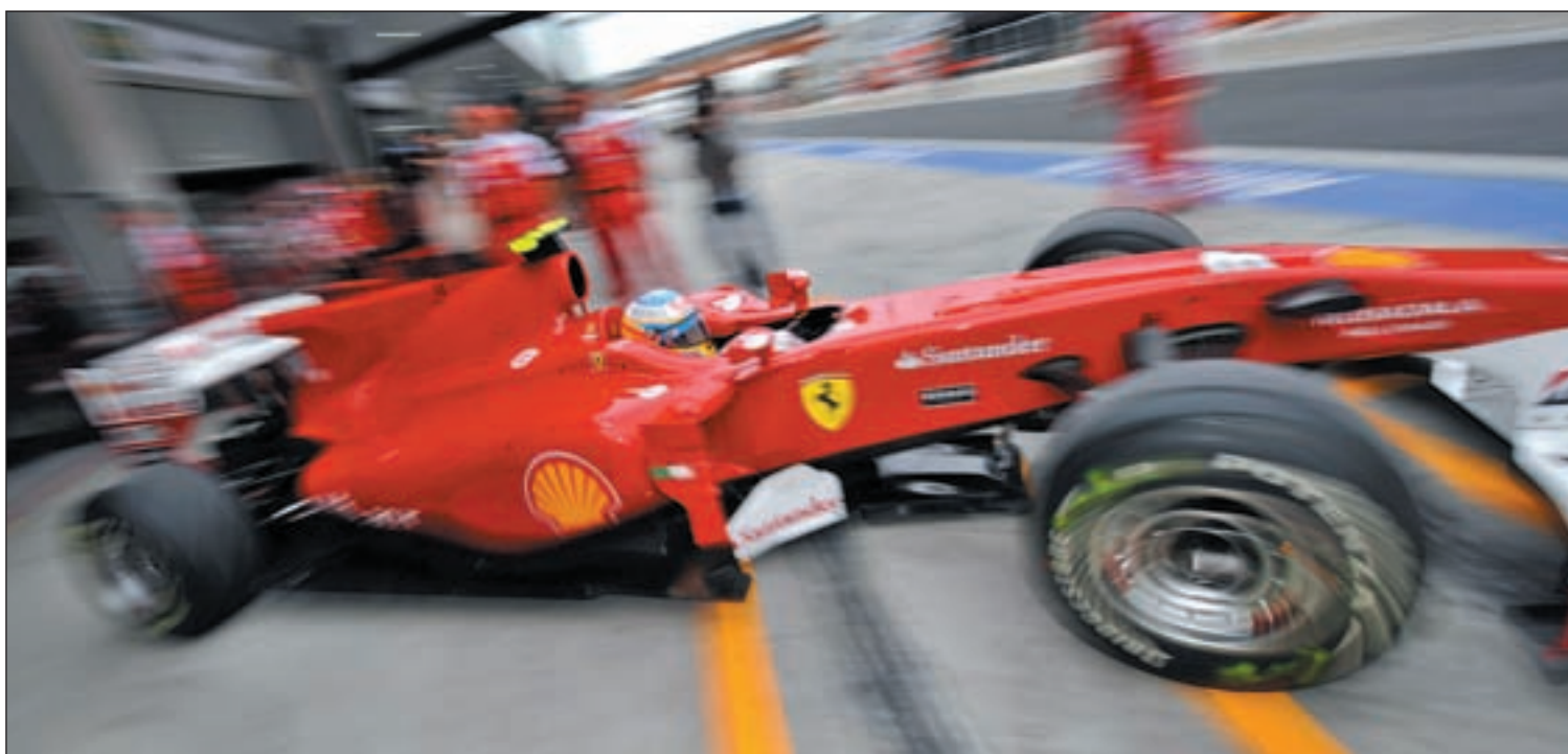
El piloto asturiano se ha mostrado muy satisfecho con las evoluciones introducidas en su monoplaza