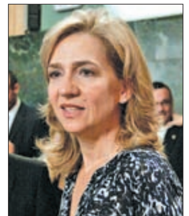
La Infanta Cristina