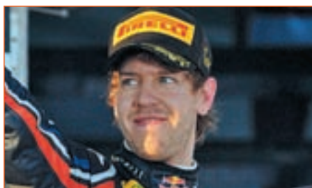
SEBASTIAN VETTEL • RED BULL

Después de haber ganado los tres últimos campeonatos, el piloto alemán afronta una nueva prueba de fuego. El paso adelante que parecen haber dado escuderías como Ferrari o Mercedes examinarán el hambre de triunfos de un piloto que ya ha hecho historia a sus 25 años.