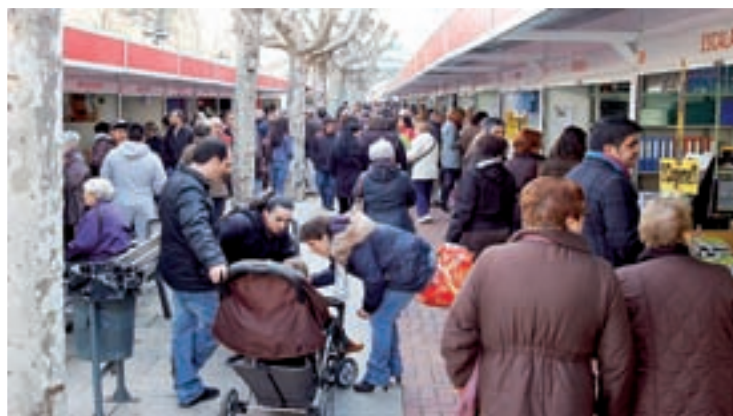
La feria de estocaje tuvo más de 238.000 visitantes.