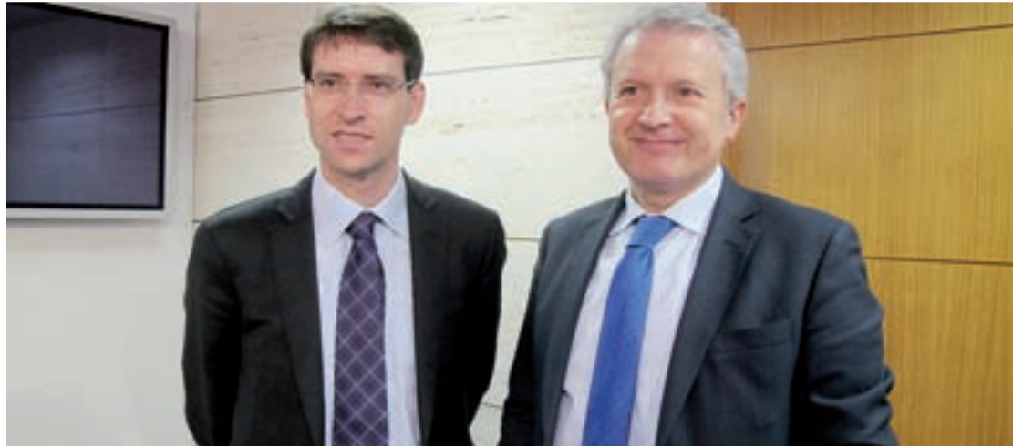
Gonzalo Capellán, consejero de Educación, Cultura y Turismo, y Emilio del Río, consejero de Presidencia y Justicia y portavoz.

De las 80 plazas vacantes en educación, el 7% serán plazas reservadas para discapacitados, distribuidas de la siguiente manera: 2 plazas para Inglés, 1 plaza para Educación Infantil, 1 plaza para Pedagogía Terapéutica, 1 plaza para Educación Física y 1 plaza para Música.