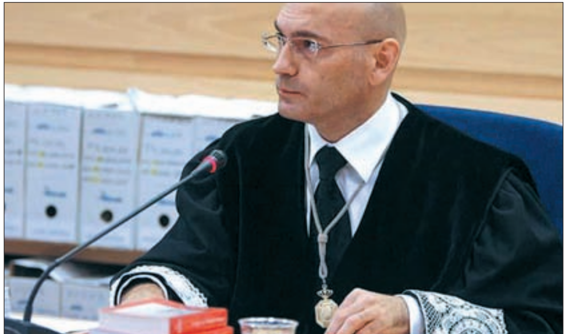
El juez de la Audiencia Nacional, Javier Gómez Bermúdez

Organizaciones Empresariales (CEOE) porque todos sus miembros le han "ratificado" su apoyo. Arturo Fernández no ha aclarado si tiene pensado presentarse a la reelección del cargo en CEIM (la asamblea se celebrará en verano) y ha indicado que este acto "está todavía lejos".