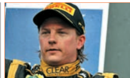
KIMI RAIKKONEN • LOTUS

Acostumbrado a estar a la sombra de Hamilton, Button asumirá un punto más de responsabilidad en esta temporada. El campeón del mundo en el año 2009 ya ha dado muestras de su regularidad, aunque en este curso se espera que esté más cerca de Vettel y Fernando Alonso.