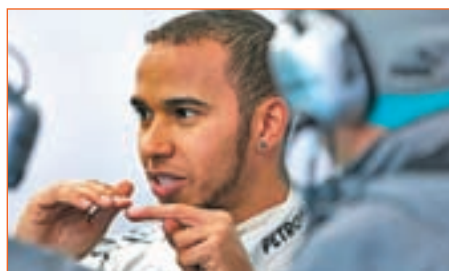
LEWIS HAMILTON • MERCEDES

Después de haber ganado los tres últimos campeonatos, el piloto alemán afronta una nueva prueba de fuego. El paso adelante que parecen haber dado escuderías como Ferrari o Mercedes examinarán el hambre de triunfos de un piloto que ya ha hecho historia a sus 25 años.