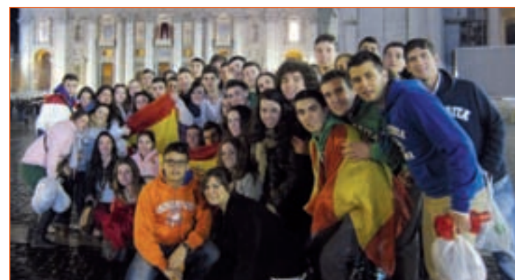
Un grupo de españoles en la plaza de San Pedro

Son muchas las personas que han estado estos días en la Plaza de San Pedro con la vista puesta en la chimenea a la espera de la 'fumata'. Muchos de ellos, jóvenes españoles que han querido ser partícipes de la fiesta católica vivida en la Ciudad del Vaticano.