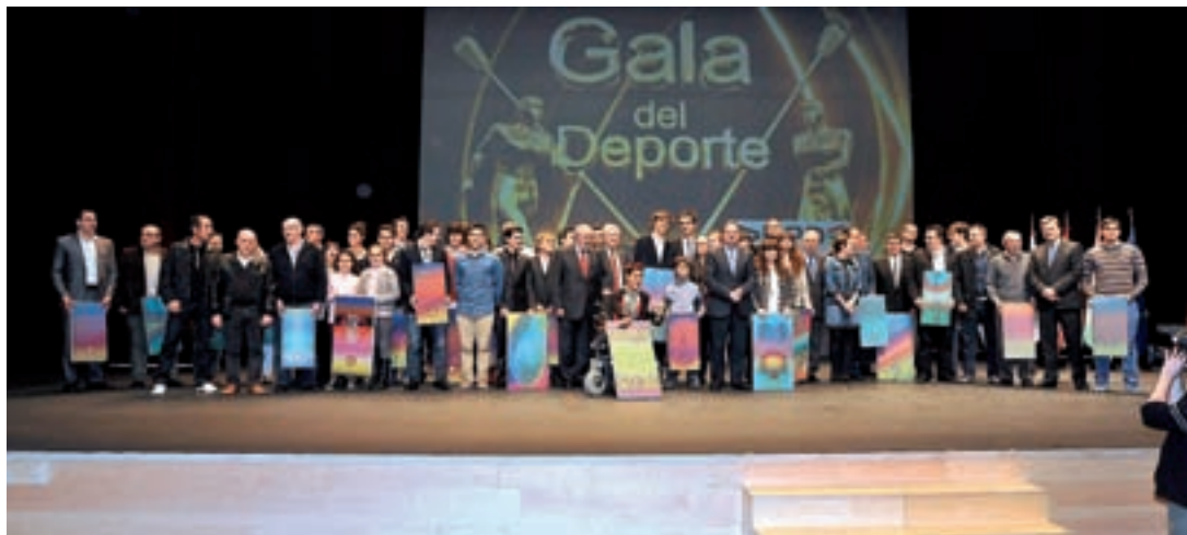
Foto de familia de la Gala del Deporte Riojano 2012.