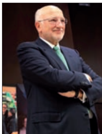
El presidente, Juan Roig

GENTE Mercadona cerró el ejercicio 2012 con un incremento del 7 por ciento en sus ventas, hasta llegar a los 19.077 millones de euros, y unos beneficios de 508 millones. Durante el año pasado, la empresa valenciana creó 4.000 nuevos puestos de trabajo directos, todos ellos fijos, lo que eleva el total de su plantilla a 74.000 personas. Ha invertido 650 millones en toda España, un 20 por ciento más que el año anterior, y ha abierto 60 supermercados. Cierra 2012 con 1.411 tiendas.