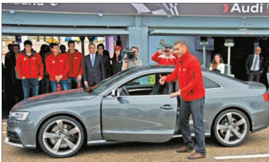
El francés Karim Benzema fue multado por exceso de velocidad en una vía madrileña

Estos expertos consideran que los padres y los profesores juegan un papel muy importante a la hora de enfrentarse al fracaso escolar. Su trabajo es detectarlo cuanto antes porque aseguran que, si no se hace, el fracaso no sólo puede provocar el abandono de los estudios o la dificultad para encontrar un trabajo en el futuro, sino que también puede influir en que esos jóvenes puedan llevar una vida normal. Los expertos aconsejan a educadores y padres buscar refuerzos o vías alternativas para evitar este abandono escolar.