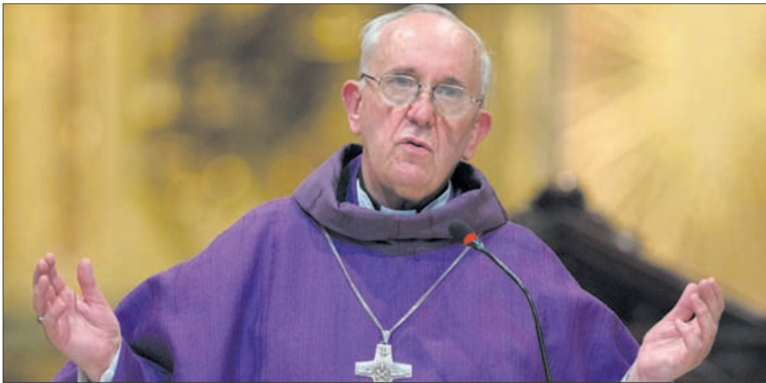
Jorge Mario Bergoglio, el Papa Francisco I