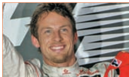
JENSON BUTTON • MCLAREN

Llegó al 'gran circo' en el año 2007 y desde entonces su trayectoria ha estado ligada a McLaren. Con su fichaje por Mercedes, abre una etapa en la que espera devolver al primer plano a una escudería que, bajo el mando de Ross Brawn, puede poner más picante al Mundial.