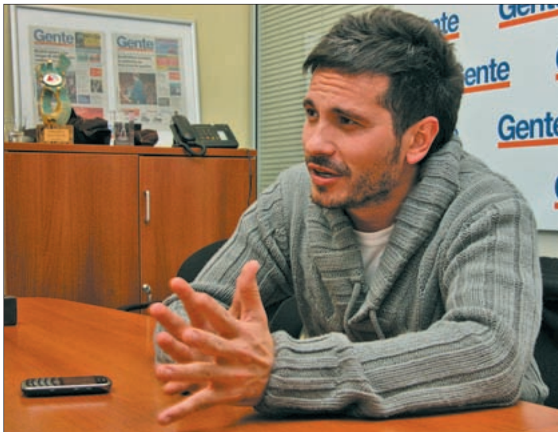
CHEMA MARTINEZ / GENTE

Es fruto de años de creer en una fórmula o en unos principios y en unos valores dentro de mi estilo musical. Nunca me he vendido, he cambiado mucho de compañías de disco, o de músicos, o de productores, pero mi estilo yo nunca lo he vendido, siempre he sido un popero andaluz con raíces a flamencillas y que está abierto a las influencias de todos los estilos musicales, pero nunca me ha dado por hacer lo que se