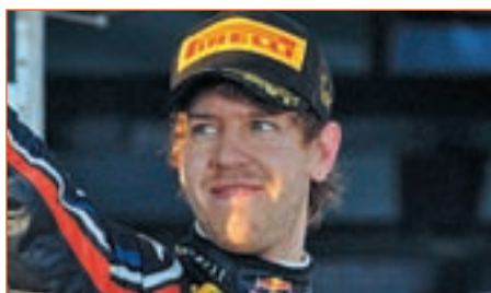
SEBASTIAN VETTEL • RED BULL

Después de haber ganado los tres últimos campeonatos, el piloto alemán afronta una nueva prueba de fuego. El paso adelante que parecen haber dado escuderías como Ferrari o Mercedes examinarán el hambre de triunfos de un piloto que ya ha hecho historia a sus 25 años.