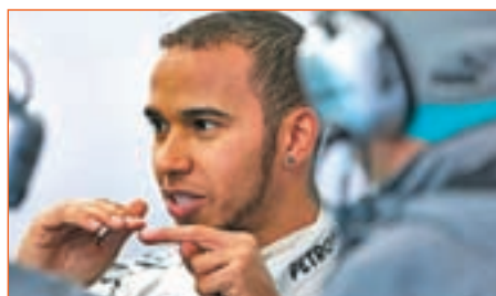
LEWIS HAMILTON • MERCEDES

Después de haber ganado los tres últimos campeonatos, el piloto alemán afronta una nueva prueba de fuego. El paso adelante que parecen haber dado escuderías como Ferrari o Mercedes examinarán el hambre de triunfos de un piloto que ya ha hecho historia a sus 25 años.