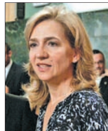
La Infanta Cristina