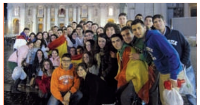
Un grupo de españoles en la plaza de San Pedro

Son muchas las personas que han estado estos días en la Plaza de San Pedro con la vista puesta en la chimenea a la espera de la 'fumata'. Muchos de ellos, jóvenes españoles que han querido ser partícipes de la fiesta católica vivida en la Ciudad del Vaticano.