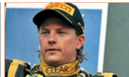
KIMI RAIKKONEN • LOTUS

Acostumbrado a estar a la sombra de Hamilton, Button asumirá un punto más de responsabilidad en esta temporada. El campeón del mundo en el año 2009 ya ha dado muestras de su regularidad, aunque en este curso se espera que esté más cerca de Vettel y Fernando Alonso.