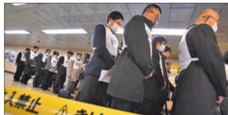
El desastre de Fukushima sigue dejando consecuencias

del mundo. Según la Agencia Internacional de la Energía Atómica, el accidente en la planta de Fukushima ralentizará o retrasará el crecimiento nuclear, pero no lo invertirá. A finales del año pasado, en todo el mundo había 437 reactores operativos, dos más que en 2011.