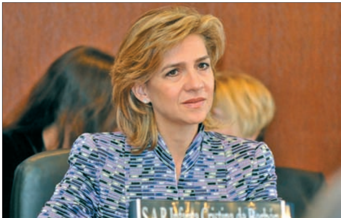
El juez Castro imputa a la Infanta Cristina en el caso Nóos

Esta decisión se produce después de la séptima remesa de co-