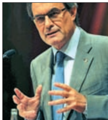
El presidente, Artur Mas

atolladero en el que se encuentra: el déficit fiscal, un problema que se arrastra desde hace tiempo; el lastre económico del anterior Gobierno tripartito; el repartimiento arbitrario del déficit por parte del Ejecutivo central; y el impago de partidas que el Estado debe a Cataluña.