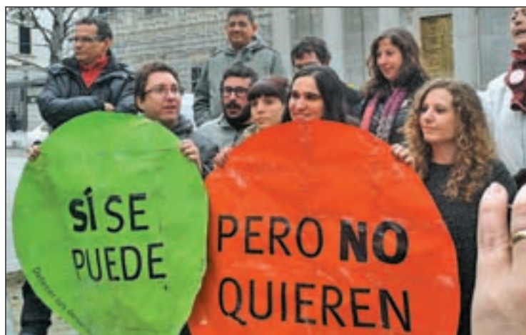
Los escraches persiguen a los políticos

PAH ASEGURÁN QUE CONTINUARÁN CON LAS CAMPAÑAS