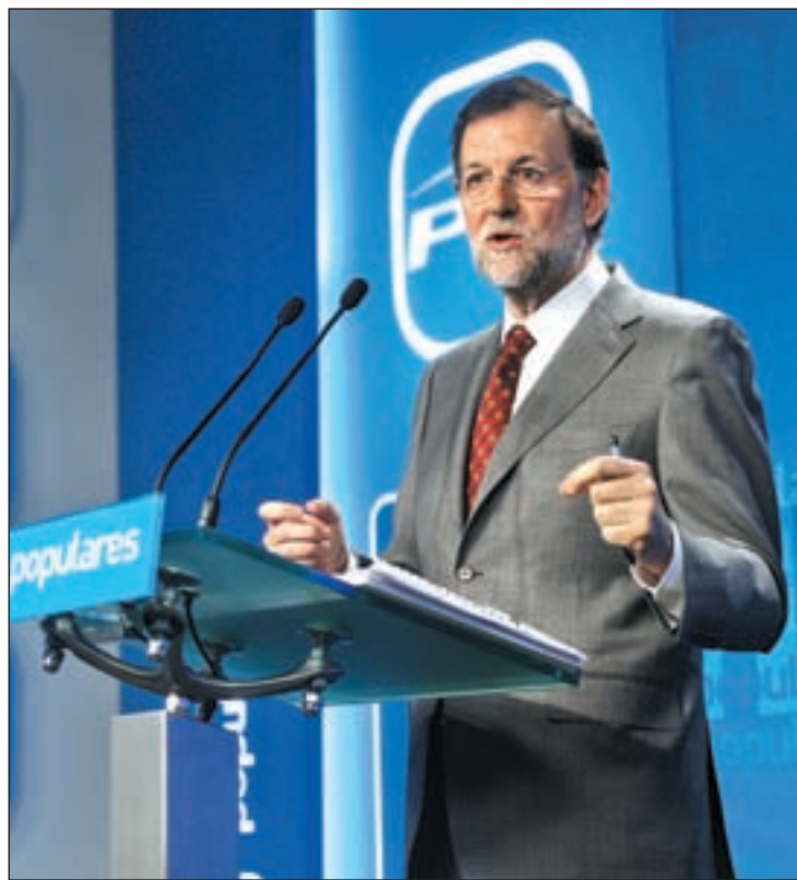
El presidente del Gobierno, Mariano Rajoy

Días atrás el ministro de Hacienda y Administraciones Públicas, Cristóbal Montoro, hacía unas declaraciones parecidas al líder de su partido. “El año 2013 será el último de la recesión, y en 2014 volverá a crecer el consumo, de forma que la aportación al crecimiento de la demanda externa y la interna conseguirán equipararse”, decía Montoro. Y los miembros del Gobierno atribuyen esta mejora a las reformas que han he-