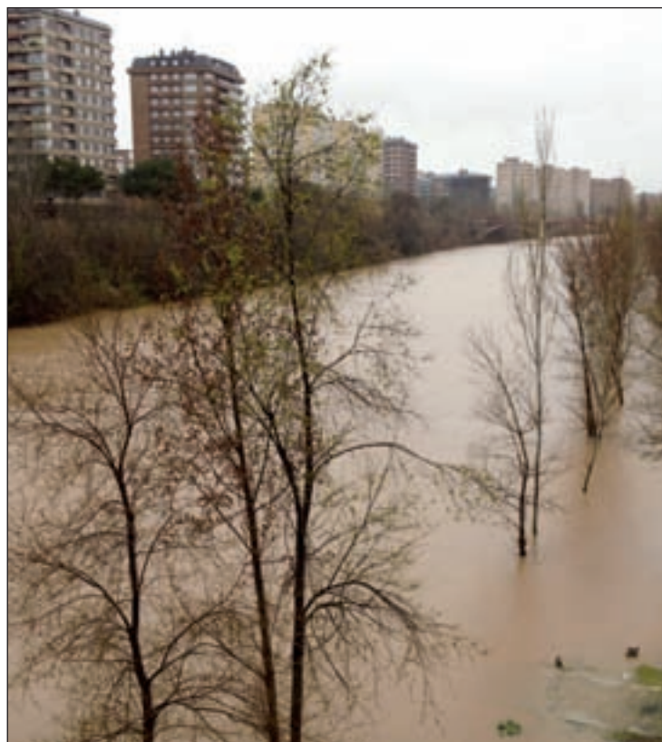
El río Pisuerga, desbordado a su paso por Valladolid

Lamentablemente, una de las consecuencias más graves de este goteo constante ha sido la muerte de dos personas en Ciudad Real. Los dos fallecidos eran los ocupantes de un turismo y un camión que perdieron la vida en un acci-