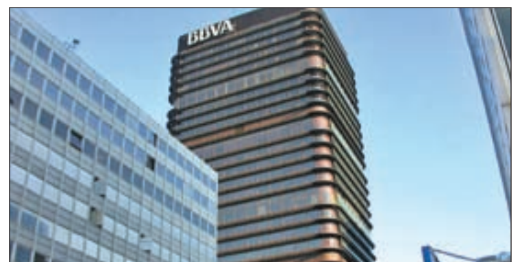
El BBVA dará dinero a aquellas personas que se han quedado sin casa

Si un miembro de la familia acogida al programa encuentra un empleo temporal, la ayuda económica se paralizará, para reactivarse en el momento en que el contrato finalice.