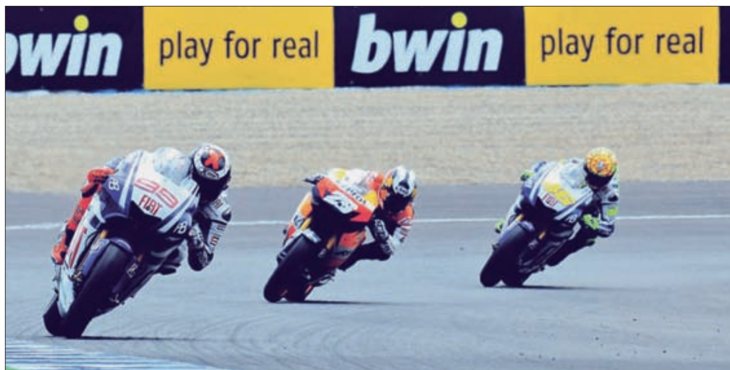
Lorenzo, Pedrosa y Rossi, tres de los pilotos que están llamados a pelear por el título