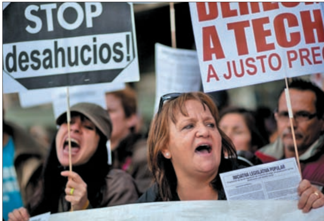
El Fondo Social de Vivienda adjudica desde esta semana alquileres a desahuciados

Las personas que se pueden acoger a estos términos deben haber sido desalojadas de su residencia habitual después del 1 de enero de 2008, tener ingresos familiares inferiores a tres veces el Iprem (1.597,53 euros) y cumplir alguno de los supuestos de vulnerabilidad. Se considera dentro de este colectivo a familias numerosas,