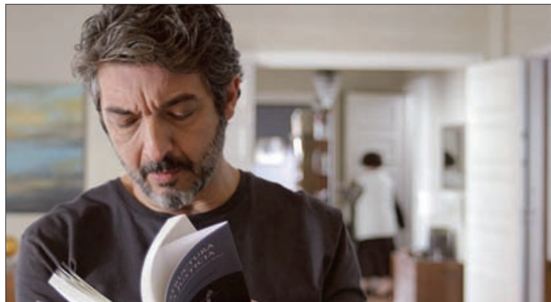
El actor Ricardo Darín protagoniza 'La tesis de un homicidio'