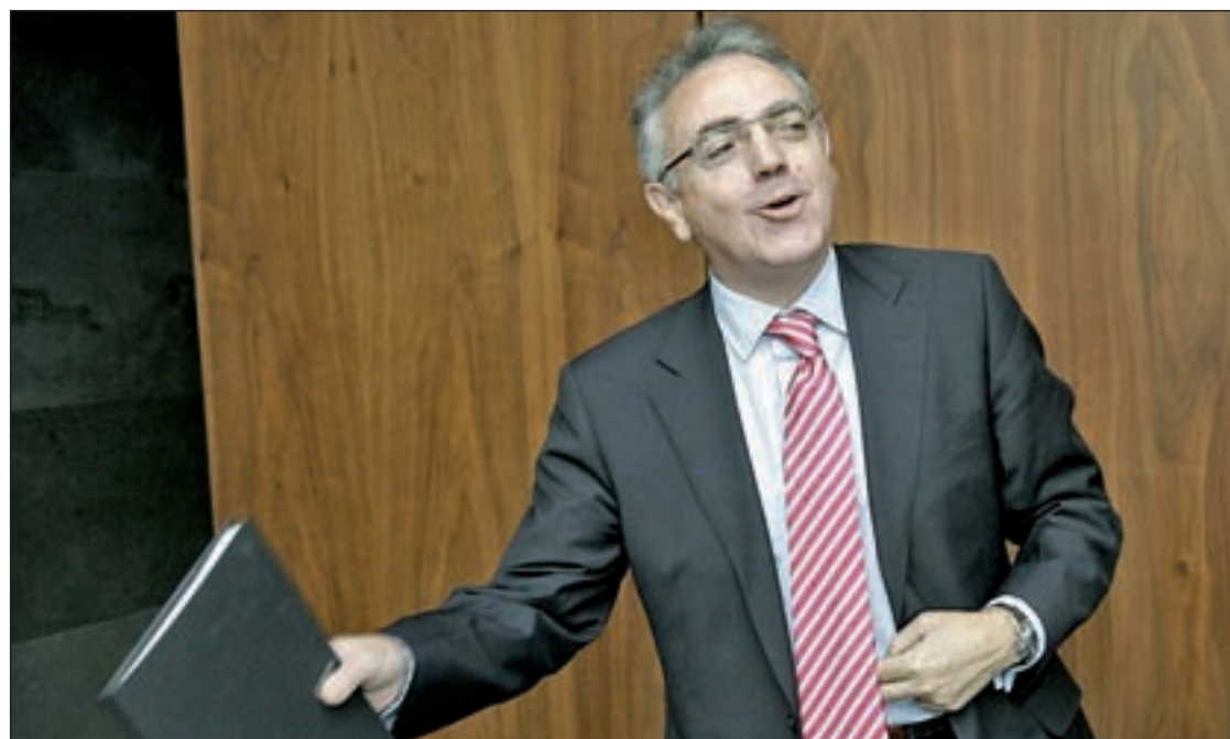
El expresidente de Navarra, Miguel Sanz