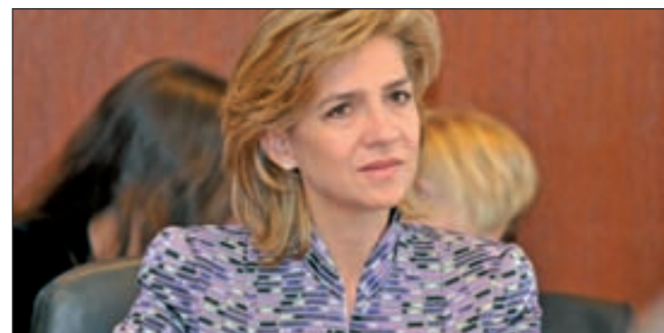
La Infanta Cristina recurre su imputación por falta de indicios

juez José Castro, que fueron que la imputación vulnera el principio de igualdad, así como la inexistencia de infracción penal, de indicios incriminatorios previos y de datos sobre su participación en los delitos contra la hacienda pública y la vulneración del principio acusatorio.