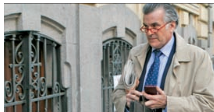
Nuevas informaciones sobre los 'papeles' de Bárceñas

presidente de la institución, Ramón Álvarez de Miranda, para que explique en el Parlamento esas donaciones. Además, consideran que el ministro de Justicia, Alberto Ruiz Gallardón, es el autor de la estrategia de defensa del PP frente a los 'papeles' de Bárceñas.