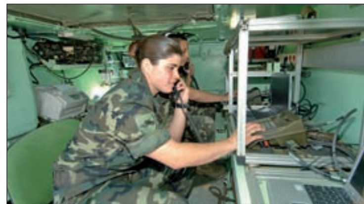
La ATME plantea el futuro de los militares

dimos al ministerio que haga lo posible para que esas personas salgan dignamente de las FAS y se incorporen a la vida civil en las mejores condiciones. Con 18 años de servicio y 45 años de edad, el estado les va a dejar una pensión de unos 7.200 euros a año, lo que creemos que es insuficiente”, señala el presidente de ATME.