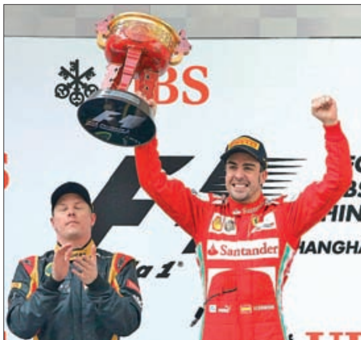
El asturiano se subió a lo más alto del podio nueve meses después

De cara a esta prueba se esperan unas temperaturas altas, por lo que la degradación de los neumáticos volverá a ser el principal quebradero de cabeza de los di-