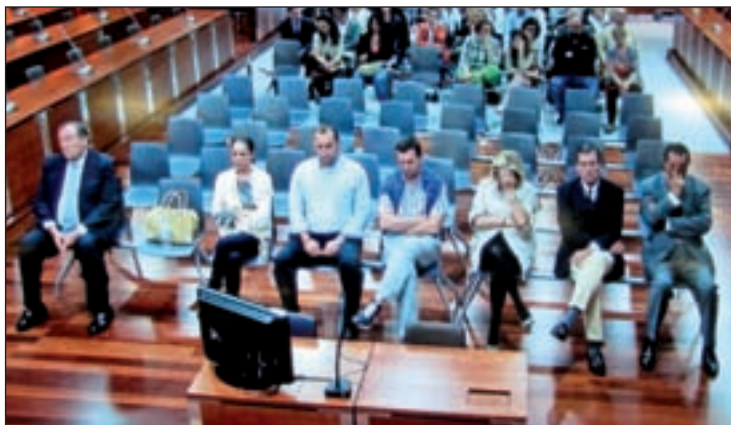
Los tres acusados escuchando la sentencia del juez

La cantante, según reza la sentencia, ha hecho frente durante el proceso judicial a la responsabi-