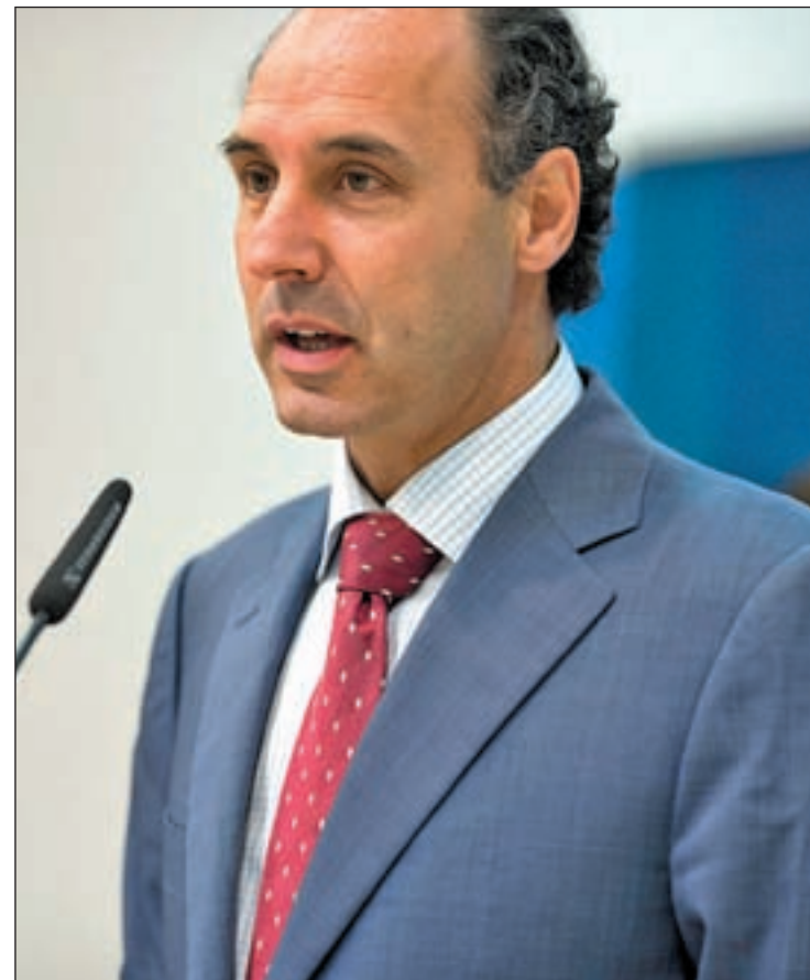
Cantabria y Castilla-La Mancha, entre las cumplidoras del déficit

Cataluña ha sido la administración con más déficit, 677 millones de euros. La Generalitat lidera el grupo de administraciones con más desequilibrios presupuestarios. Madrid va a la zaga,