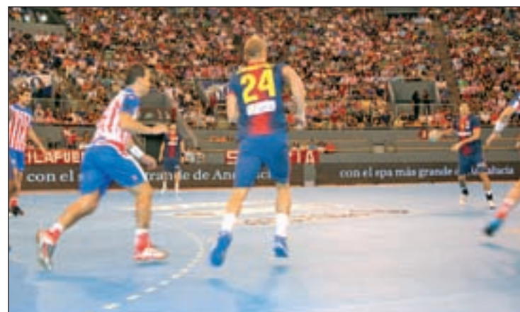
Los azulgranas ya ganaron en Vistalegre esta temporada GENTE

dor nacional, tras cuatro años que se han visto culminados con el Mundial de 2013. Me voy agradecido y orgulloso de haber entrenado a la selección, con el sentimiento de que lo vivido en el Sant Jordi, que puede resumir todo el Mundial, es lo más importante y bonito que me ha pasado".