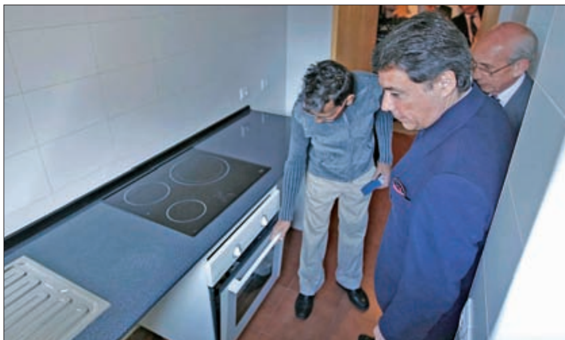
El Ivima entrega la primera vivienda pública a un desahuciado