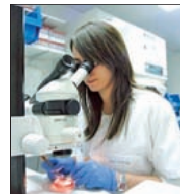
Detectan ADN de caballo

Las prácticas fraudulentas detectadas en varios países de la Unión Europea llevaron a la Comisión a publicar una recomendación para llevar a cabo un plan coordinado de control y determinar el alcance de estas prácticas en la comercialización de determinados alimentos.