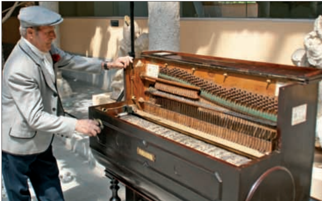
Organillero en la presentación del programa, el pasado lunes en el Museo de San Isidro

'La reina del cuplé', homenaje a Sara Montiel; y el concierto de Kiko Veneno, actos centrales en este escenario de las fiestas patronales PÁG. 10