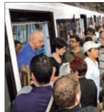
Metro de Madrid