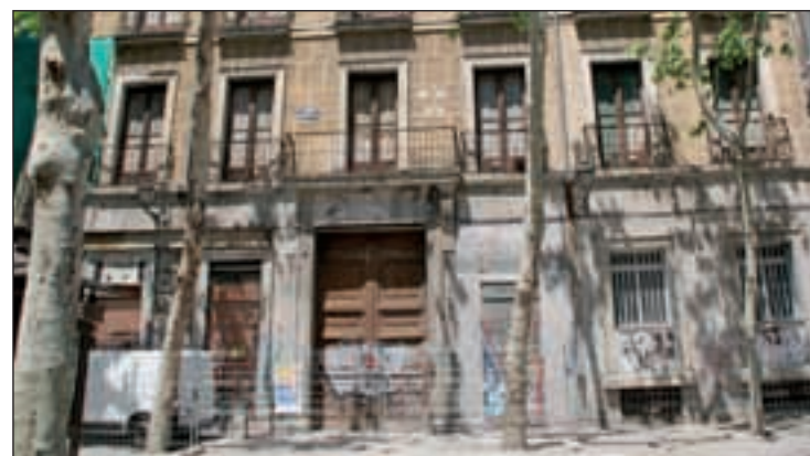
La fachada permanece rodeada de vallas

Respecto a las licencias de obra y de actividad, la alcaldesa recordó que el Ayuntamiento cuenta con una fórmula de gestión mixta entre un organismo municipal y entidades especializadas del sector privado.