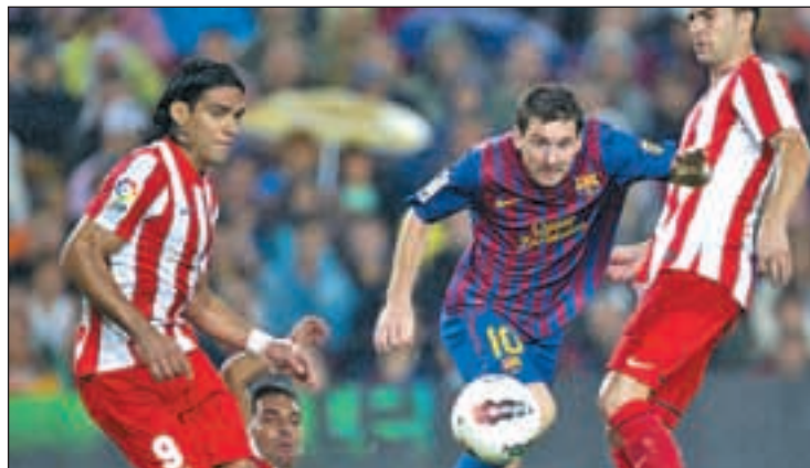
Messi y Falcao, dos de los atractivos de este partido

Con el objetivo principal conseguido, el Atlético espera rematar la jornada festiva que se vivirá este domingo (19 horas) en el Vicente Calderón con un triunfo sobre el FC Barcelona. Sin embargo, los azulgranas no se lo pondrán nada fácil a los hombres de Si-