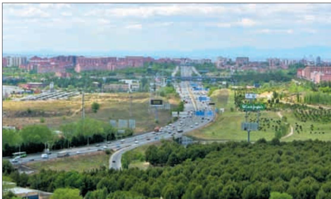
La carretera de Valencia, a su paso por el distrito de Villa de Vallecas

Los festejos anuales también contarán con la participación de los colegios de Moratalaz. En una reunión entre representantes municipales y directores de los centros educativos se llegó al acuerdo de incluir actividades de reciclaje, sensibilización y educación ambiental en el programa. Esta medida servirá para cumplir el acuerdo adoptado por unanimidad en el Pleno Infantil del distrito del 3 de octubre de 2012.