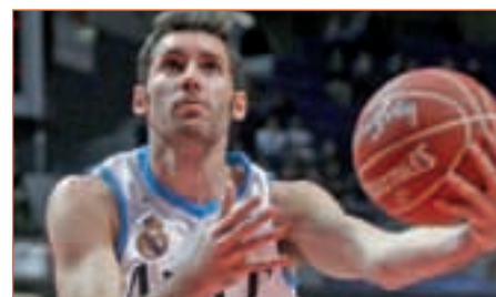
RUDY FERNÁNDEZ • REAL MADRID

Tanto él como su equipo ya saben lo que es llegar como tapados a Final Four y marcharse con el título bajo el brazo. El vigente campeón se encomienda a un jugador que promedia más de 14 puntos y 5 asistencias en esta edición.