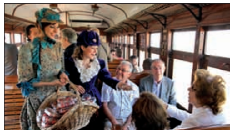
Pasajeros en el Tren de la Fresa

Por motivos logísticos, este año la locomotora tradicional de vapor ha sido sustituida por una diesel. Además, un furgón, un vagón de los años 60 y cuatro coches de madera acompañan a este tren tan peculiar.