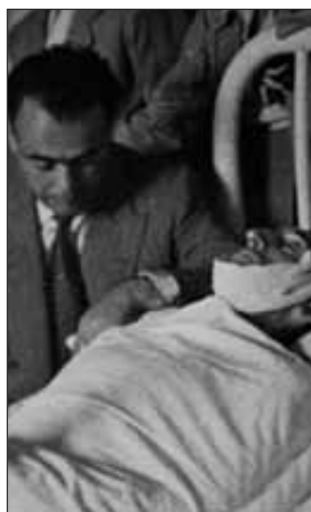
Muerte de Manolete