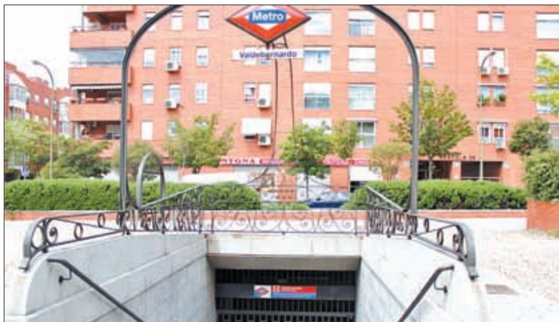
El acceso Sur de la estación de Metro del barrio permanece cerrado desde el verano

“Hay un gran malestar en todos los sentidos. No es muy normal que haya vecinos que tengan que recorrer todo el barrio para llegar a la boca de Metro”, denuncian desde Afuveva. “Además, continúan- tiene menos explicación cuando cerca del acceso ce-