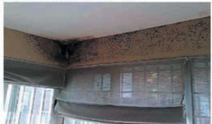
Problemas de humedades por condensación

micología en el instituto de la Salud Pública Louis Pasteur, explica este aumento por nuestro modo de vida: "Vivimos más en el interior, en casa o en el despacho. Desde los años 60, tendemos a un exceso de aislamiento para no dejar escapar el calor y además no se airea suficientemente".