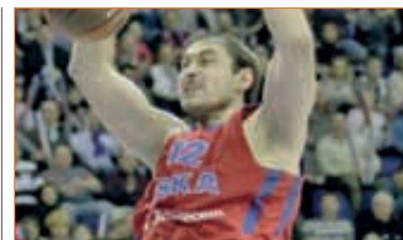
NENAD KRSTIĆ • CSKA MOSCÚ

El Real Madrid hizo un esfuerzo mayúsculo para fichar a este jugador con el objetivo de que dejara su sello en partidos como los que se disputarán este fin de semana en Londres. De momento ya ha sido elegido en el quinteto ideal.