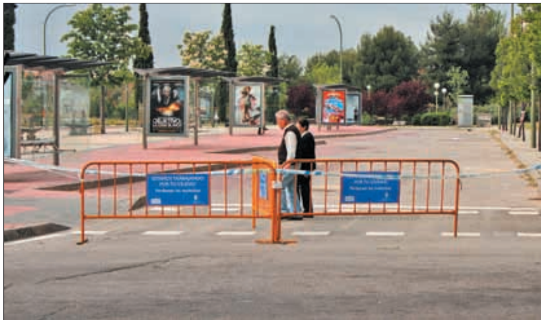
Estado actual del área intermodal situada en el distrito de Moratalaz

Desde el año 2008, se han realizado ocho reparaciones en el pavimento para mantener en servicio el intercambiador. Los da-