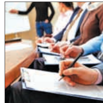
El paro juvenil supera el 50%

años. También buscan favorecer la adquisición por parte de los jóvenes de aquellas competencias requeridas por las empresas. Y por último, facilitar a los jóvenes la adquisición de una experiencia en el mercado laboral.