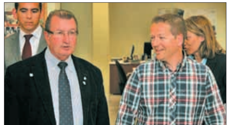
Un momento de la visita a la redacción de GENTE

En cuanto a la revisión del PGOUM, no duda en asegurar que es un buen momento para mejorar los accesos al distrito y en esa línea han ido las alegaciones de la Junta Municipal.