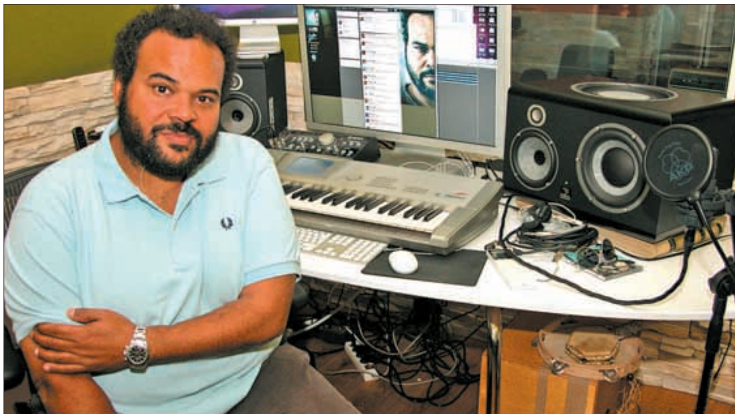
CHEMA MARTÍNEZ / IGENTE