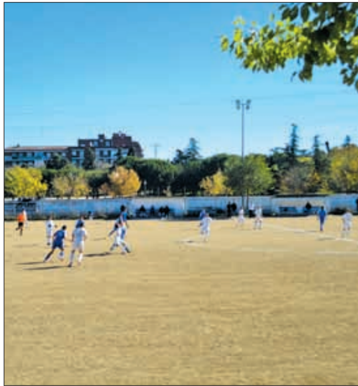
Uno de los partidos disputados en el Pedro Vives CD AVIACIÓN

El Ayuntamiento quiere que el equipo gestione el campo de forma interina hasta que se convoque el concurso público para luego aplicar un canon. Mientras, la otra parte, alude a la existencia de un poder de impronta militar para poder utilizar sin coste alguno