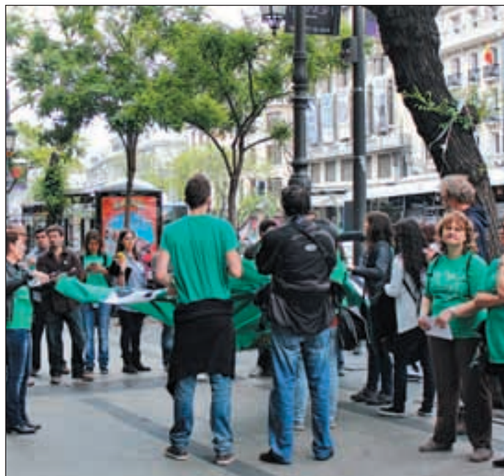
Manifestación de los interinos frente a Educación

Según ha indicado la Comunidad, la nueva norma servirá para dotar a su educación pública con los mejores maestros y profesores al modificar los criterios de baremación de interinos para que primen los conocimientos de los docentes sobre su antigüedad en las