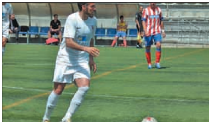
El Nuevo Canódromo acogerá una final

De este modo, el Puerta Bonita llega a la última jornada con la tranquilidad que otorga depender de sí mismo para certificar un liderato que sería histórico. Al margen del honor de ser coronado como el mejor equipo de la fase regular, el Puerta tendría el premio de jugarse el ascenso a Segunda División B en una única