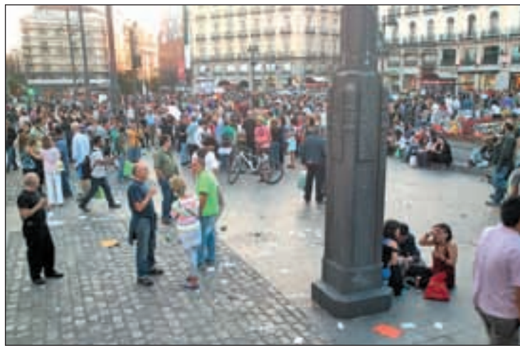
El movimiento 15M ya ha cumplido dos años

Asimismo, Cifuentes ha afirmado que el movimiento 15-M ha avanzado hacia "posiciones más radicales" tras dos años de vida, pero ha reconocido que algunas de sus propuestas ya están en las agendas de los partidos políticos, que deben ser, según Cifuentes, más "receptivos" a las reivindicaciones de los movimientos socia-