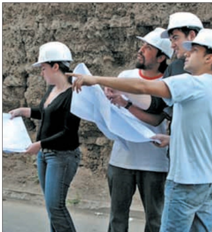
La mayoría de las ofertas de empleo son de ingenierías

En el otro lado de la balanza están aquellas carreras cuya salida profesional es prácticamente nula. Desde hace años en lo más alto están los estudios que engloban Humanidades. Todas las filologías están dentro del área con menor demanda tanto laboral como de alumnos. Por detrás están Historia, Historia del Arte, Geografía y Ordenación del Territorio. Tampoco Periodismo ocupa un lugar privilegiado. La gran oferta de periodistas y la escasa demanda por parte de los medios de comunicación, ha convertido a esta profesión en una de las que peor futuro laboral tiene. Pese a que es una de las carreras más demandadas, también es una cuya salida profesional está bajo mínimos. Un estudio realizado por una empresa de empleo temporal, señala que Derecho fue en 2010 una de las carreras cuyo porcentaje de titulados es muy superior a su demanda en el mercado laboral. ¿Pero cómo se puede saber si se