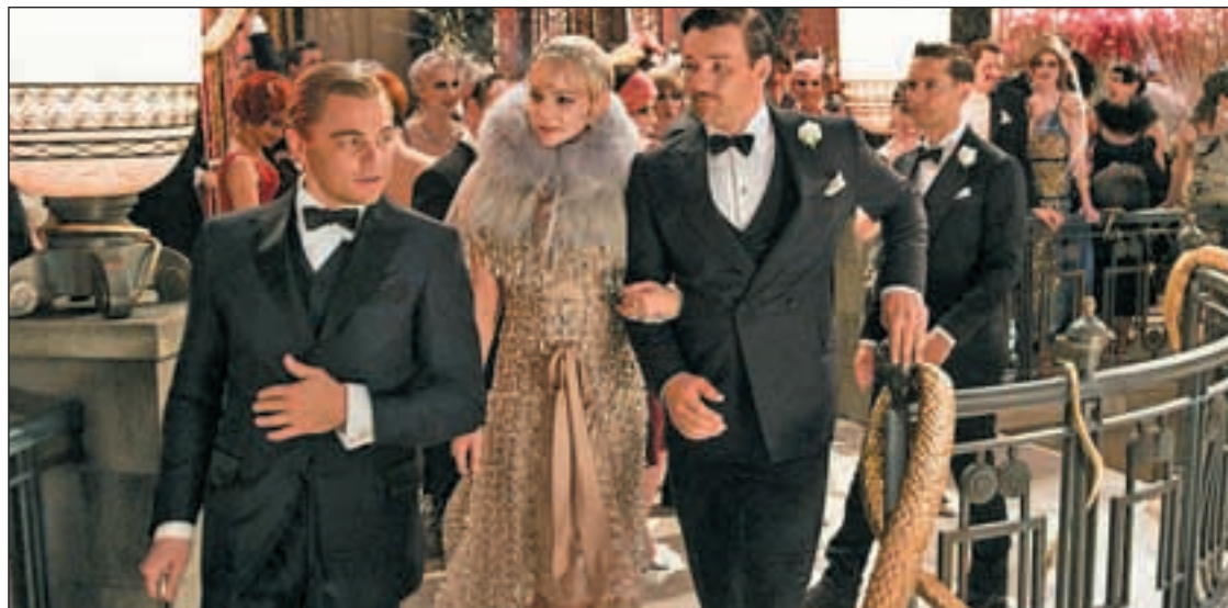
El actor Leonardo diCaprio , en un momento de la película