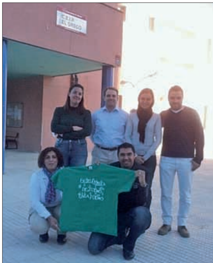
Representantes del AMPA en el patio del colegio AMPA EL GRECO

Según el responsable, Cuarto de Primaria pasaría de tener cinco a cuatro aulas, con clases de 30 alumnos. Y Quinto tendrían dos aulas, en lugar de las tres actuales, con clases de más de 31 alum-