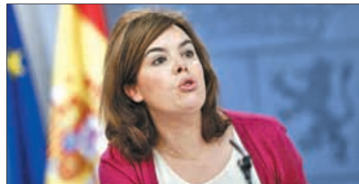
Soraya Sáenz de Santamaría en rueda de prensa

Por su parte, el viceconsejero de Transportes, Borja Carabante, ha asegurado que la Comunidad está dispuesta a potenciar el proyecto de aeródromo de El Álamo - Navalcarnero.