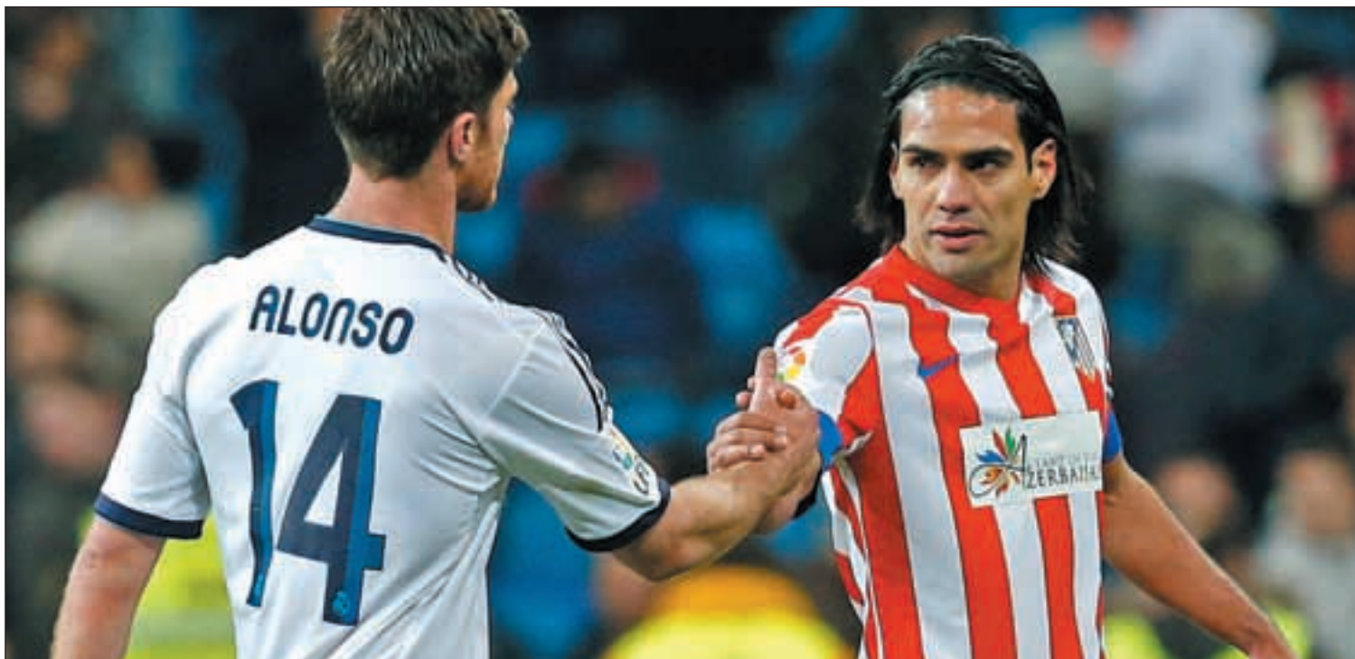
La dirección magistral de Xabi Alonso y los goles Falcao, dos razones para que los aficionados hagan el esfuerzo de pasar por taquilla