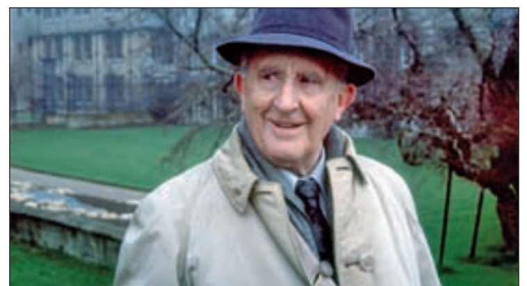
El escritor británico, J.R.R. Tolkien

Con una oferta hotelera de más de 10.000 plazas, Burgos se presenta en esta campaña promocional como una ciudad moderna que este año podría incrementar entre un 3 y un 5 por ciento la cifra de visitantes.