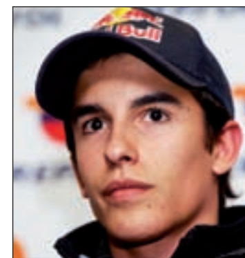
Márquez, en la parrilla de salida

de más alto nivel, en sentido negativo, que han confirmado que la lesión a nivel de la parte más alta del húmero es mínima, donde tiene una pequeña fisura. Como estas molestias podían comprometer los tendones del hombro, le hemos hecho una ecografía, que también ha descartado rotura del tendón". Por tanto, Márquez estará totalmente disponible para el próximo GP de Catalunya que se celebrará en el circuito de Montmeló el próximo día 16.