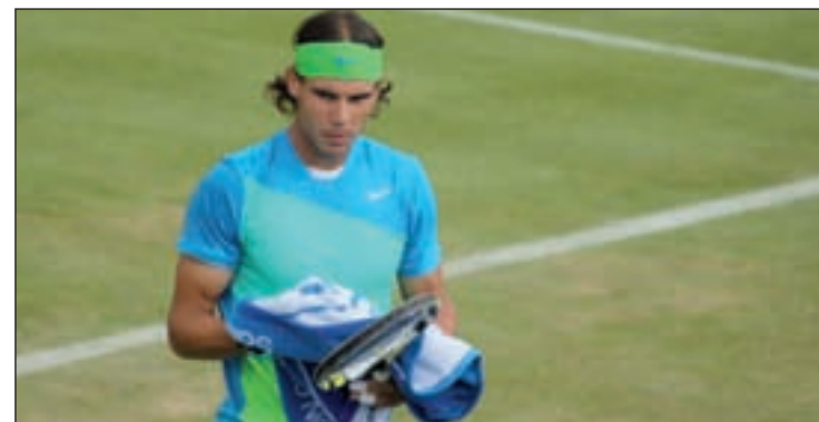
Nadal ha cambiado este año Queen's por Halle

24 arranque el torneo londinense, la actividad se traslada a Halle y Queen's. El primero de ellos se disputa en tierras germanas y puede presumir en esta edición de contar con un cartel de verdadero lujo. La presencia de Roger Federer se ha convertido en una constante en los últimos años, aunque ahora el suizo puede ver comprometido su reinado por la presencia de jugadores como el propio Rafa Nadal o el francés Richard Gasquet.