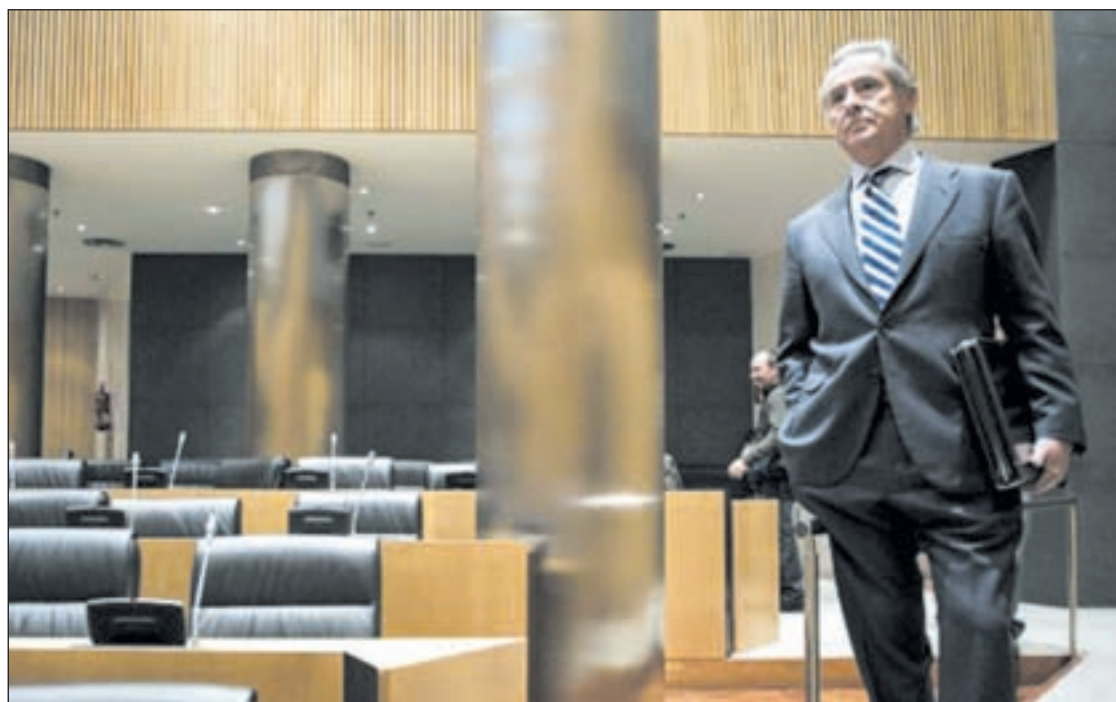
El expresidente de Caja Madrid, Miguel Blesa

Las bebidas alcohólicas no tendrán subvención en la cafetería y restaurante del Congreso, por lo que quien las pida tendrá que pagar el precio que estime oportuno la empresa de restauración que gane el concurso. De esta manera ha zanjado la polémica el presidente del Congreso, Jesús Posada, tras conocerse la semana pasada la lista de precios que la Cámara ofrece en su pliego de condiciones. La decisión ha contado con el apoyo de todos los miembros de la Mesa.