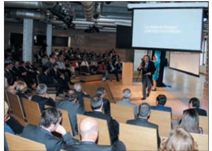
Presentación de 'Marca Burgos'

Esta obra se ha estrenado en Estados Unidos el pasado 21 de mayo, alcanzando los primeros puestos en las listas de ventas. En nuestro país, es la editorial Mino-tauro (Planeta) quien publica el libro.