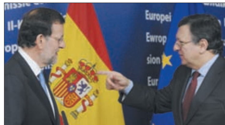
El presidente Mariano Rajoy, junto a José Manuel Durao Barroso

dente ha dejado claro que no los subirá en lo que queda de legislatura. "No quiero subir impuestos, no tengo ningún interés, pero el compromiso con el déficit es ineludible", ha señalado el jefe del Ejecutivo. No obstante, no ha descartado la posibilidad de hacer "algunos cambios" que impliquen tocar algunos impuestos.