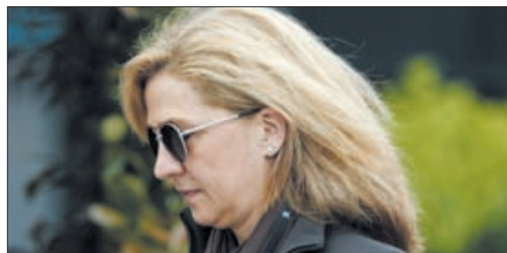
Hacienda emite un informe defendiendo la inocencia de la Infanta

yo. Casi 24 horas después salía de ella tras depositar una fianza de 2,5 millones de euros. El magistrado atribuyó al banquero un delito societario de administración desleal, o bien uno de apropiación indebida en concurso con otro de falsedad de documento público. La acusación argumenta su nueva solicitud de prisión y en este caso sin fianza en la "capacidad de maniobra" que demostró el expresidente de la caja tras abonar tan rápidamente aquel dinero. La decisión del magistrado también estuvo relacionada con la compra por parte de Caja Madrid, en 2008, del City National Bank de Florida, un banco entre los 10 más grandes de Estados Unidos. La compra del banco fue por 754 millones de euros, aunque Caja Madrid primero adquirió el 83 por ciento.