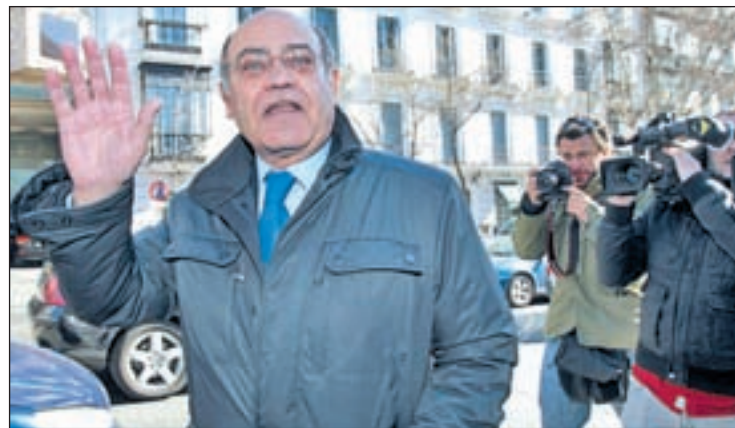
El expresidente de la CEOE, Gerardo Díaz Ferrán

La Audiencia Nacional ha rebajado de diez a cinco millones de euros la fianza que el juez Eloy Velasco impuso al expresidente de la CEOE, Gerardo Díaz Ferrán, al que investiga por llevar a cabo el supuesto vaciamiento patrimonial del Grupo Marsans con la intención de eludir el pago a sus acreedores. En un auto, la Sección Segunda de la Sala de lo Penal justifica la rebaja de la fianza argumentando que han pasado cuatro meses desde que el tribunal decidió reducirla de 30 a diez