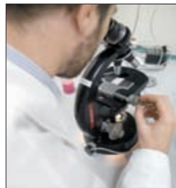
Día Nacional del Superviviente

Bajo el lema «Todos somos supervivientes», los pacientes quisieron así rendir un homenaje a los familiares y seres queridos que les han acompañado durante y des-