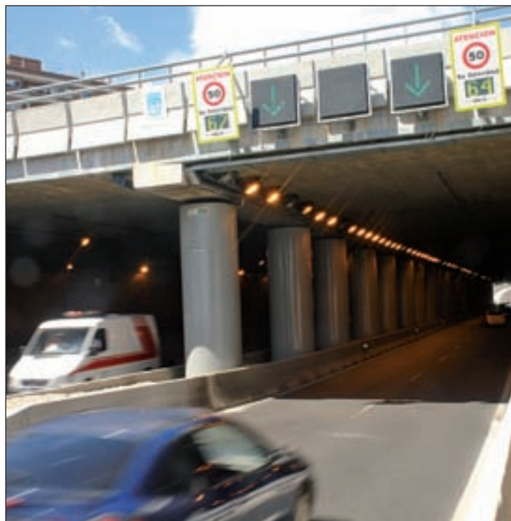
En ciudad los límites cambiarán a 30 kilómetros por hora

Los límites de velocidad serán modificados al alza y a la baja. El más polémico es el incremento a 130 kilómetros por hora en algunos tramos de autopistas y autovías. Se aumentará la velocidad, mediante paneles variables, de forma temporal y en tramos en los que existan índices contrastados de seguridad. En las vías convencionales, se reducirá de 100 a 90 kilómetros por hora el límite máximo, y en las carreteras más estrechas, la velocidad máxima será de 70 kilómetros. En ciudad, cuyo límite máximo es de 50 por hora, se reducirá a 30 en las calles con un carril por sentido de circulación o un solo carril, y a 20, en las vías con plataforma única de calzada, para proteger a pe-