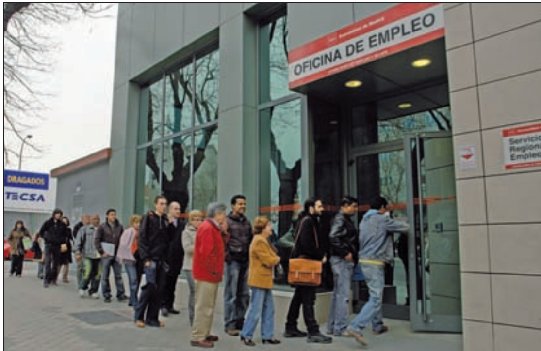
El desempleo se sitúa en los 4.890.928

Pese a la subida de mayo y a las buenas expectativas veraniegas, estos incrementos no se han traducido en un aumento de los contratos indefinidos. De hecho, este tipo de contratación se reduce no sólo con respecto a mayo de 2012, tal y como venía ocurrien-