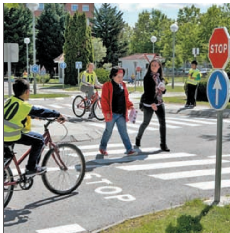
Una de las niñas cruza un paso de cebra en el parque

Respecto a los padres, Vaquero explica que se sienten “aliviados”