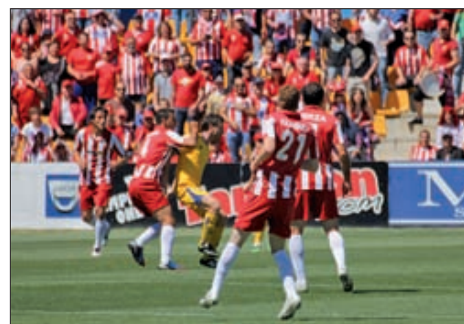
El equipo andaluz es tercero en la tabla

los descartes obligatorios de Vicente Del Bosque, aunque esas ausencias vienen dadas por distintos motivos. Mientras Beñat y Javi García se perderán la Confederaciones por el alto número de centrocampistas convocados, Xabi Alonso se ha quedado fuera de la lista definitiva a causa de los mismos problemas físicos que le han impedido jugar con normalidad en los últimos meses. Al margen de estas ausencias, uno de los nombres propios en estos primeros días de concentración es el de Jesús Navas, tras confirmarse oficialmente su traspaso al Manchester City, equipo en el que coincidirá con Silva y Javi García.