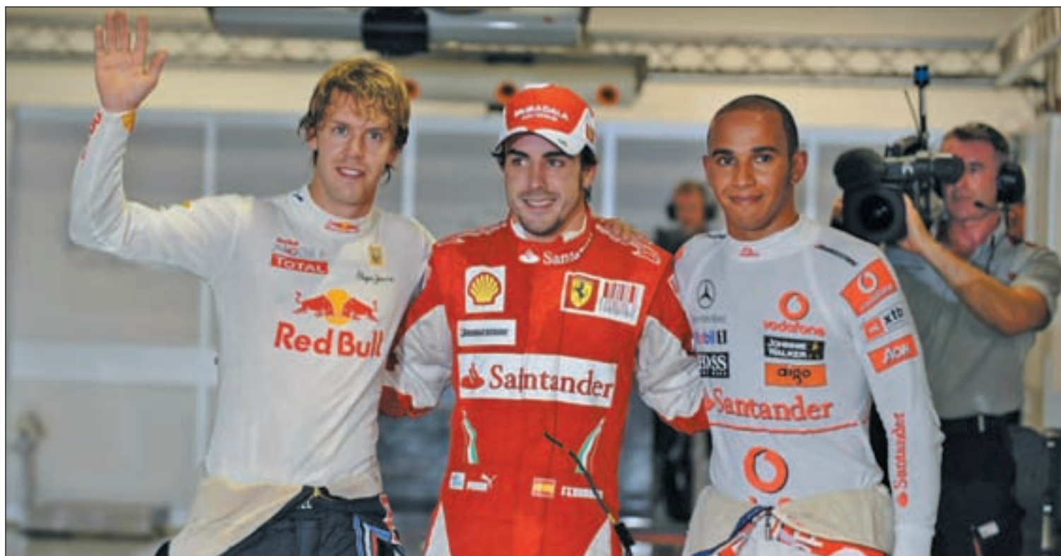
Sebastian Vettel, Fernando Alonso y Lewis Hamilton, candidatos a todo en este Mundial