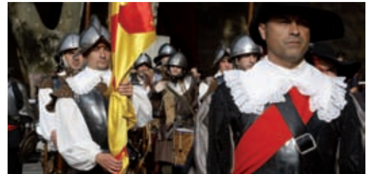
Imagen de archivo de las fiestas de San Bernabé.

grama específico on-line y gratuito que incluirá la ubicación del 'Tragantúa' y el 'Dragón'; documentación sobre los gigantes, con una explicación de cada una de las doce figuras; e información de los horarios del Circo y del Recinto Ferial, así como un mapa de situación de todos los actos.