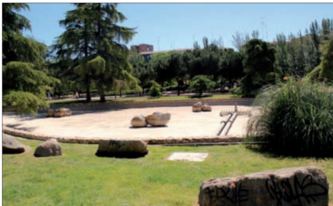
Estado actual del estanque artificial en la zona verde del barrio de Aluche

Por último, adelantan que el agua no volverá a correr en el conjunto del parque, dentro del plan de ahorro energético puesto