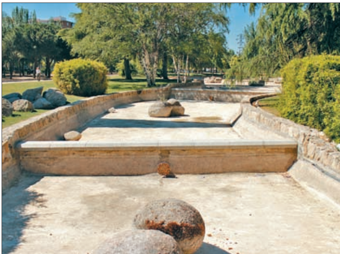
Uno de los canales del parque