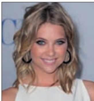
La actriz americana