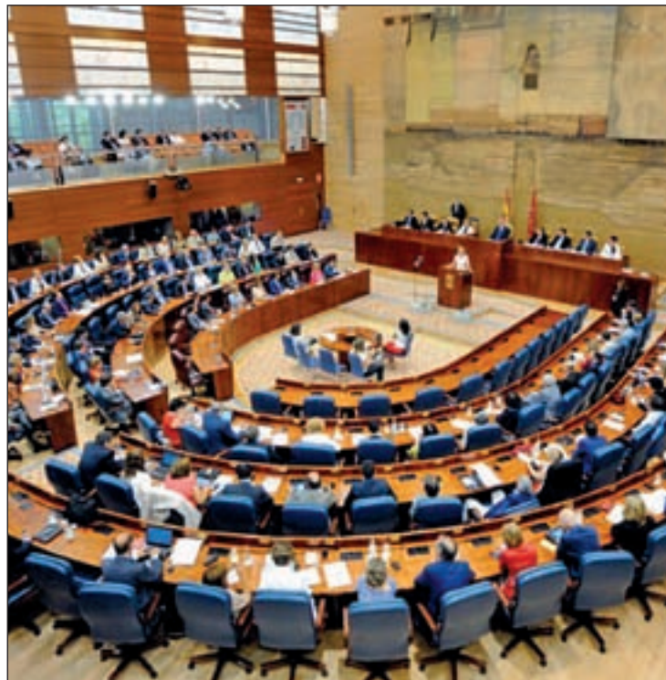
Asamblea de Madrid

Por su parte, el presidente regional, Ignacio González, acusó a ambos partidos (PSOE e IU) de "ir en contra de mejorar la represen-