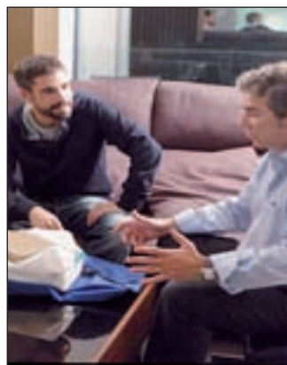
Fotograma de la película

mejor momento. Uno cerró el quiosco de prensa de su propiedad y el otro pasa las horas muertas en su constructora sin poder acabar una urbanización de lujo. Con cincuenta años, sin trabajo y sin dinero la situación se vuelve insostenible. Pero un día el milagro llega en forma de 'pesca': en-