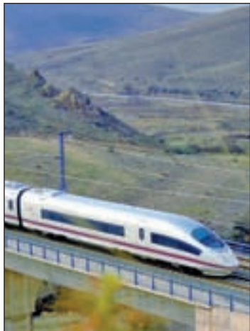
El AVE Madrid- Alicante