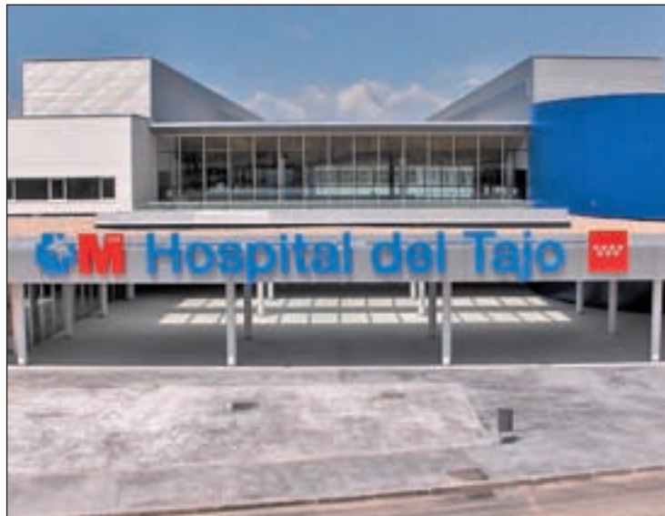
El hospital de Aranjuez

Por otro lado, Sanitas y el consorcio formado por Ribera Salud se han dirigido a otros lotes. La primera sólo opta a la gestión del Hospital del Henares mientras la