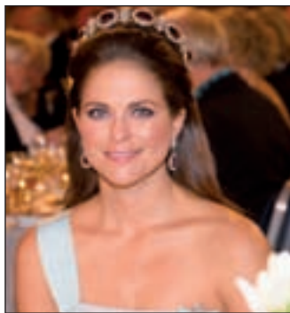
La princesa de Suecia