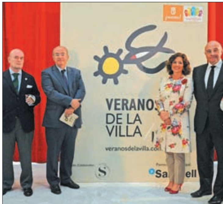
Ana Botella en la presentación de los Veranos de la Villa

"Esta edición cuenta con todos los géneros para que los madrileños y los que nos quieran visitar disfruten de toda la programación", ha destacado Botella que, además, ha explicado que estos conciertos son demandados por miles de turistas.