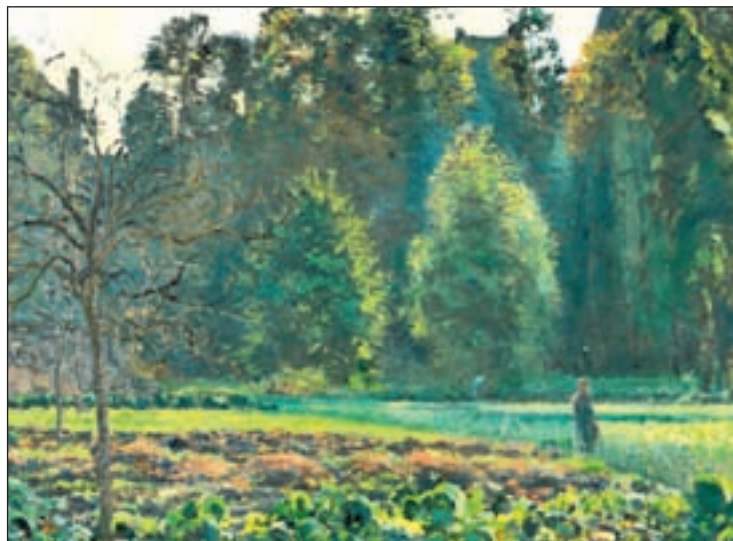
El impresionismo de Camille Pissarro

En el caso de Camille Pissarro, su obra estará expuesta hasta el 15 de septiembre de 2013 en el Museo Thyssen - Bornemisza. En concreto, será la exposición 'Au-