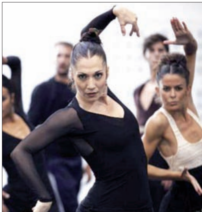
El Ballet Nacional de España estará en el Matadero