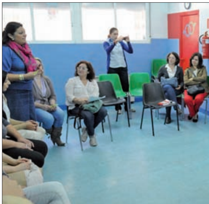
Una mediadora conversa con varias mujeres en la asociación Barró

Esta iniciativa, con 1.203 personas en 2012, contó con el doble de participación que el año anterior en las materias de salud, empleo, educación, convivencia vecinal e igualdad. Gracias a Aracné 229 mujeres asistieron a revisiones sanitarias y ginecológicas, 300 personas recibieron asesoramiento y formación para el empleo y 305 familias participaron en programas de éxito y prevención de absentismo escolar. Además, 300 familias recurrieron a acciones de resolución de conflictos y mejora de la convivencia vecinal, y alrededor de 400 personas participaron en los talleres para la defensa de la igualdad.