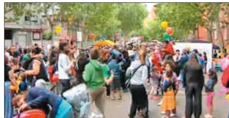
Un momento de los actos celebrados este año