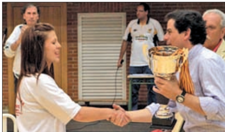
Las jugadoras del equipo senior celebraron su ascenso

Desde la Junta Directiva del club se espera que esta jornada sirva para premiar la labor de una entidad "que ha servido para que muchísimos chicos y chicas del barrio hayan podido disfrutar de un deporte tan completo como lo es el baloncesto". Pero el CB Mo-