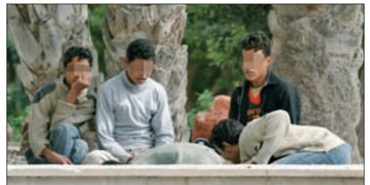
Jóvenes inmigrantes en Madrid

Para evitar el señalado aumento de irregularidades, Ferine ha solicitado al Gobierno que paralice los desahucios y que se aplique la renovación de los permisos de residencia y trabajo, independientemente del tiempo cotizado.