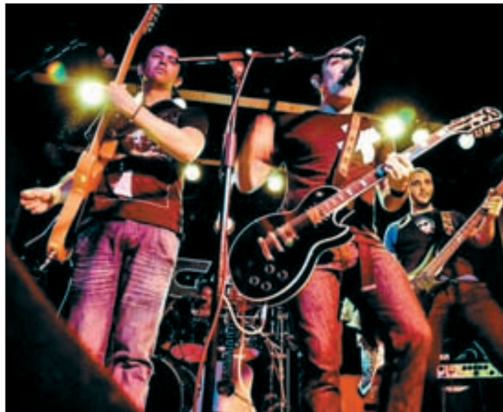
La Ley de Mantua repetirá en el escenario morataleño

Al igual que en años anteriores, el teatro, el deporte, los talleres culturales y la pintura serán protagonistas en estos días festivos. En esta última disciplina, el Certamen de Pintura Rápida celebra su XV edición. Las inscripciones se podrán realizar en el Centro Socio-cultural Eduardo Chillida este sábado 15 de junio en las categorías