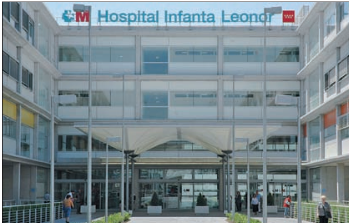
La entrada principal del complejo sanitario vallecano

Mientras tanto confiesa que el día a día se hace cada vez más di-