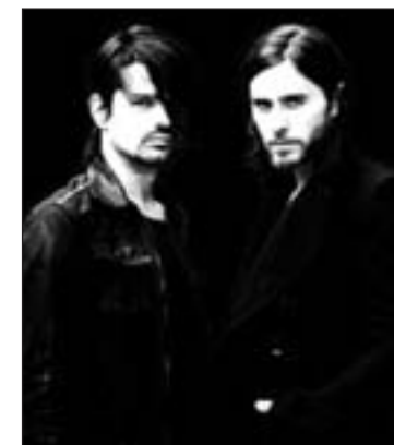
30 seconds to Mars

La banda alcanzó la fama en 2005 con 'A beautiful lie' con temas como 'Attack', 'The Kill' o 'From yesterday'.