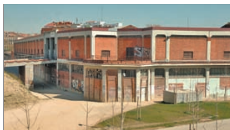
Las obras están paralizadas desde 2010

Por otro lado, la primera edil confía en que la experiencia sea positiva y obtenga los mismos resultados que en otros municipios como Valladolid, donde ya se ha desarrollado este proceso, “con el 90% de usuarios optando a la compra”, indicó. En cuanto al precio medio de cada plaza, éste “dependerá del tiempo que falte para finalizar la concesión, que será como máximo de 75 años”. El Consistorio pretende así aportar una fórmula adicional que permita a las arcas públicas y a los usuarios aprovechar este recurso.