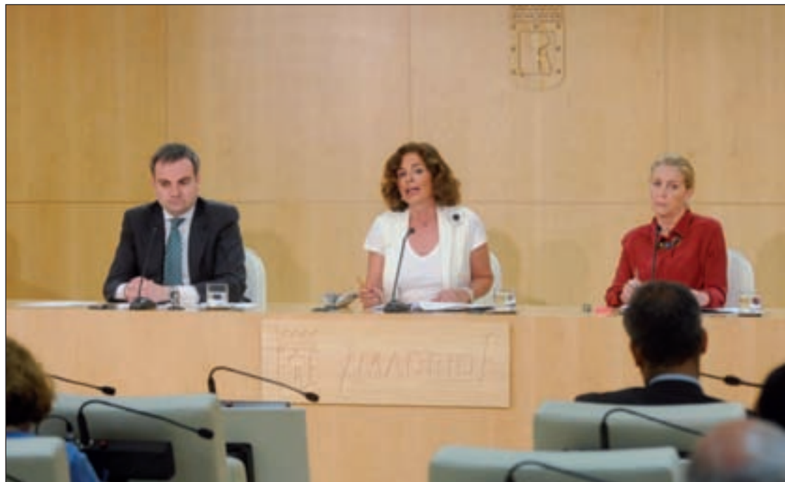
Enrique Núñez, Ana Botella y Concepción Dancausa en la rueda posterior a la Junta de Gobierno

El plan contempla la integración de la gestión y explotación de los diferentes espacios de propiedad municipal sin diferenciar el fin último. Así, a lo largo de este año se completará la fusión de MACSA y Madrid Visitors & Convention Bureau, y en dicha empresa se in-