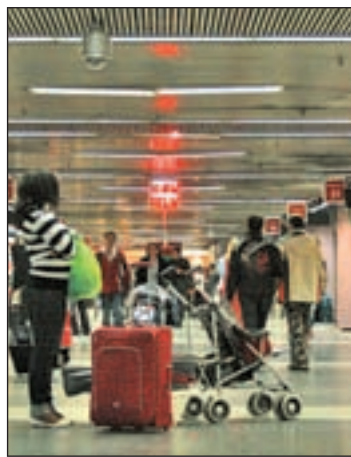
Avenida de América GENTE

A. B. El Consorcio Regional de Transportes de Madrid ha decidido unificar los horarios de apertura y cierre de todos los intercambiadores, que desde el 1 de julio mantienen sus instalaciones abiertas de 6 de la mañana a 12 de la noche. El Consorcio comunicó esta decisión después de finalizar las obras de la planta -1 de la infraestructura de Avenida de América, en la que se ha separado la zona de espera de los viajeros del área de autobuses y se ha climatizado. También se ha reformado la zona comercial y se han cambiado las escaleras interiores por unas más anchas, rápidas y de menor pendiente, lo que mejora los tiempos de trasbordo y la accesibilidad general de unas instalaciones que registran diariamente más de 156.000 viajeros. Tras