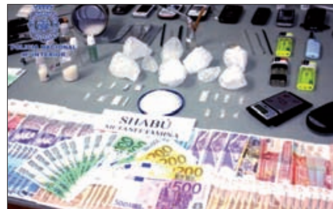
Parte del material incautado