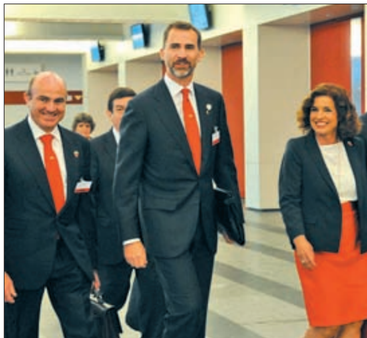
De Guindos, junto al Príncipe Felipe y la alcaldesa Ana Botella

Tras las intervenciones de Tokio y Estambul, Madrid cerraba el turno de las presentaciones. Por delante había 45 minutos en los que la idea principal a trasladar era muy clara: despejar las dudas