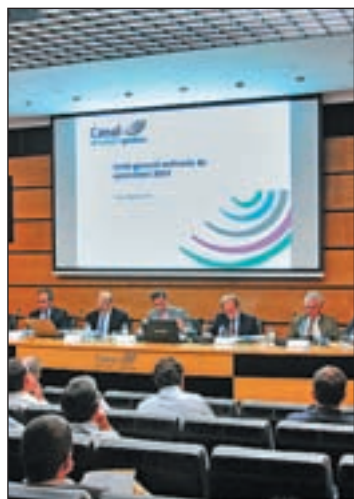
La primera Junta del Canal

De esta cifra, 69,5 millones fueron distribuidos como dividendo a cuenta a finales de 2012, mientras que los 48,8 restantes se aprobaron en la Junta como dividendo complementario, que será percibido por la Comunidad de Madrid y por los 111 ayuntamientos que ostentan el 17,6% del capital social del ente.