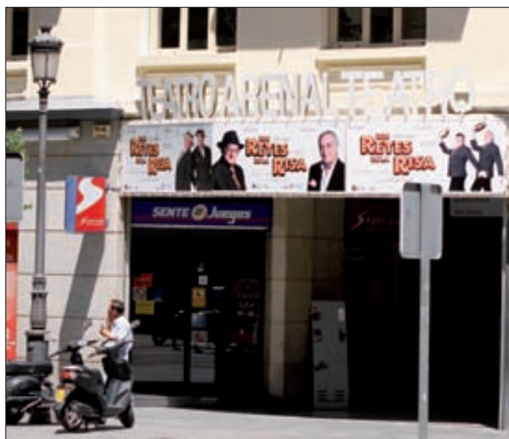
Teatro Arenal, en la Calle Mayor

Otra despedida de la temporada empezaba como sigue: "A partir del 1 de julio, el Teatro Arlequín dejará de ser gestionado por el equipo que entró hace tres años y que con tanto cariño e ilusión comenzaron (...) Besos. Srta. Ozores". Este es parte del mensaje que la actriz Emma Ozores, hija de Antonio Ozores, colgó en la página web de su teatro. Otra muestra de humor absurdo e irreverente