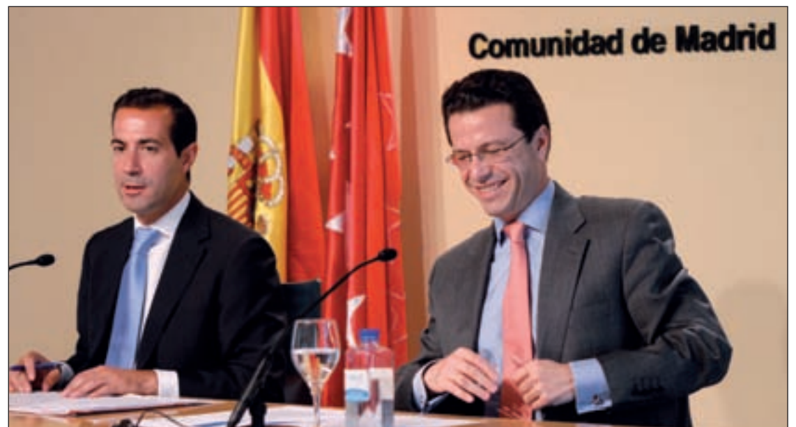
Los consejeros de Presidencia y Sanidad, tras el Consejo de Gobierno

Los tres aspirantes se han ajustado a los criterios planteados por la Consejería de Sanidad, reservando, por ejemplo, un 30% de las acciones de las sociedades que gestionarán los hospitales a la participación de los profesionales de los centros. Estos, asimismo, podrán seguir trabajando en los hospitales si así lo desean ya que es otro compromiso de las empresas.