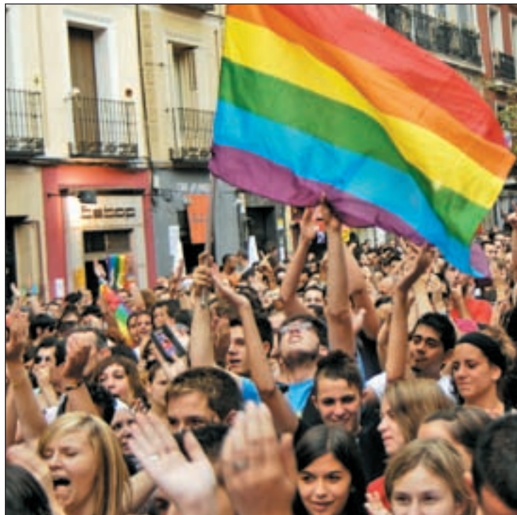
La marcha concluirá este año en la Puerta de Alcalá

Precisamente, para reflexionar sobre este tipo de cuestiones, sobre la Diversidad Afectivo-Sexual y de Género en la Juventud, la Manifestación Estatal de este sábado 6