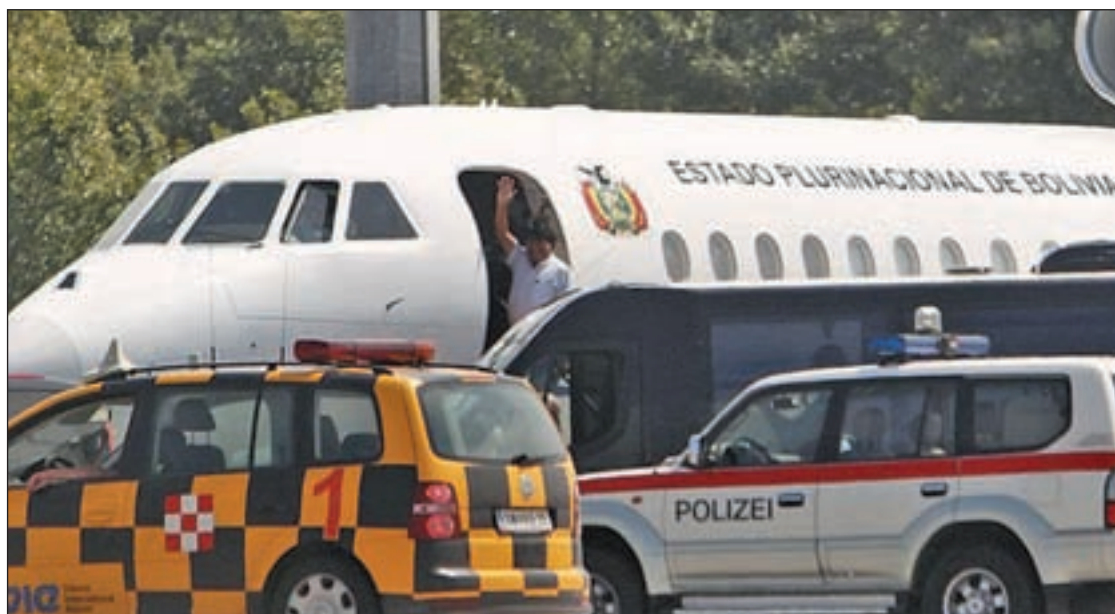
El presidente de Bolivia, Evo Morales, en el aeropuerto de Viena

Esto suponía levantar el blindaje que Iberia tiene como aerolínea titular en la T4 de Barajas, así como las precauciones frente a la posible segregación de operaciones de la compañía. El Sepla se negó.