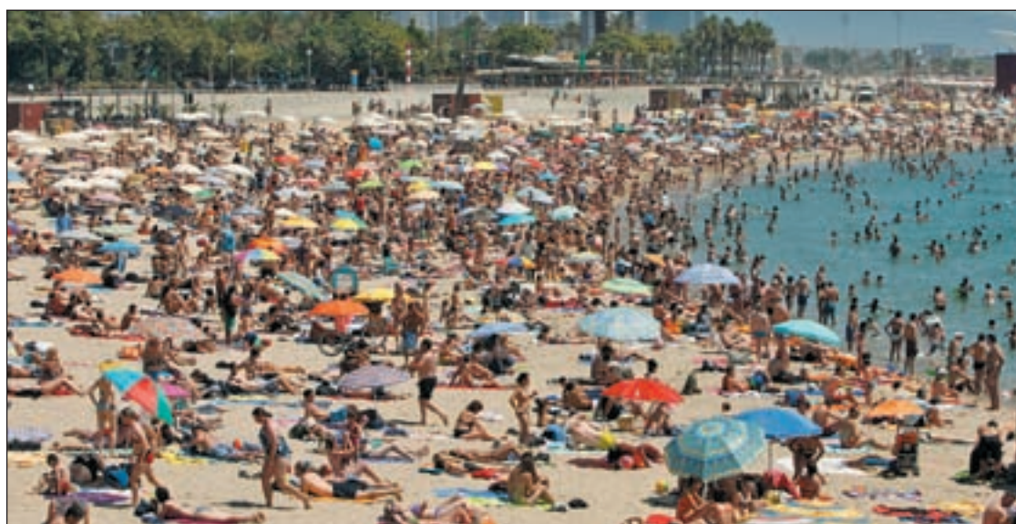
Las playas son uno de los principales atractivos de España

Las previsiones para el verano son muy buenas. Las cifras actuales de reservas vacacionales para el periodo comprendido entre junio y octubre de este año registran un alza del 7,8 por ciento con respecto al mismo periodo de 2012.