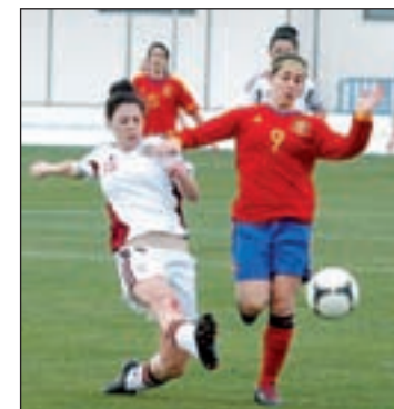
Boquete, la estrella española

La primera cita para las chicas de Quereda tendrá lugar el viernes día 12 ante Inglaterra, la última subcampeona de Europa. Tres días después se medirán con Francia, para cerrar su participación en la fase de grupos el día 18 ante el combinado de Rusia.