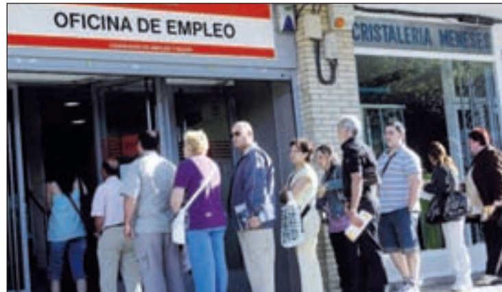
El número de desempleados se sitúa en los 4.763.680

La parte negativa de esta noticia son los datos del número de contratos que siguen en caída libre.