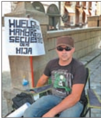
El hombre, en huelga