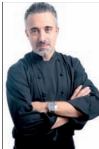
El cocinero Sergi Arola