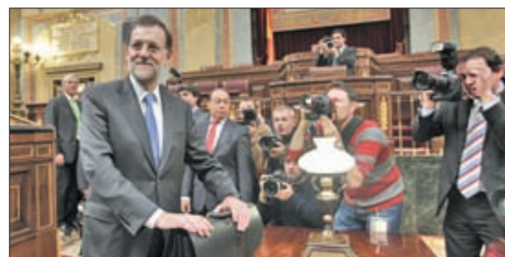
El presidente del Gobierno, Mariano Rajoy

Angela Merkel, Rajoy pidió a los países que tienen margen de maniobra, como Alemania, que aumenten su demanda interna para reactivar el crecimiento en la eurozona, porque sólo así se creará empleo. “No se ha cerrado esta posibilidad, está abierta”, dijo el presidente.