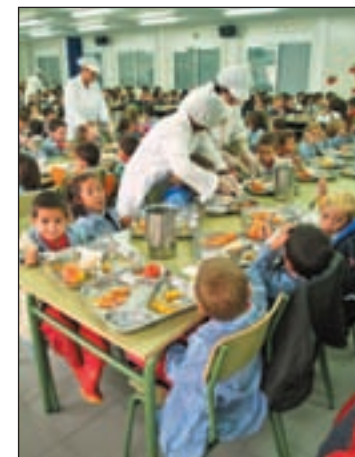
Unos 450 niños afectados

El ejecutivo extremeño baraja datos que indican que en la región serían unos 450 los niños que podrían estar padeciendo una situación compleja que podría afectar