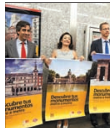
Algunos de los carteles

Dirigidos principalmente al turismo joven, en Madrid actualmente hay unas 1.800 camas con este tipo de alojamiento con una ocupación media del 85%. Esto significa que a través de los hostels visitan la capital española unas 250.000 personas al año. Una cifra que la Comunidad prevé que se aumente hasta los 750.000 turistas, aumentado en 500.000 los cerca de diez millones de turistas que vienen a la región anualmente. Sin embargo, las familias también pueden elegir esta opción a la hora de emprender un viaje, ya que la gran diferencia de los hostels con los albergues juveniles, es que en los hostels no hay límites de edad. Están abiertos al público general. Pero para que esta nueva forma de viajar se implante definitivamente, se adecuará la normativa, debido al vacío legal existente en la actualidad, según Ignacio González.