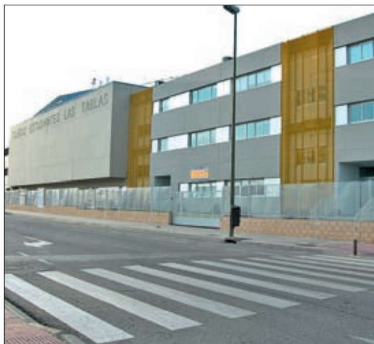
El centro no contempla los exámenes ni los deberes

Pero la promesa sólo ha durado un año. “La responsable administrativa fue despedida dos días antes de terminar el curso, y el director el primer día de vacaciones. Los padres nos sentimos engañados”, explican en un comunicado las familias, profesorado y personal de administra-