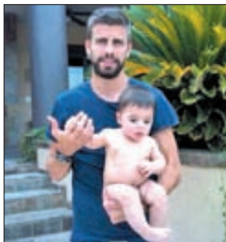
El futbolista Piqué y su hijo