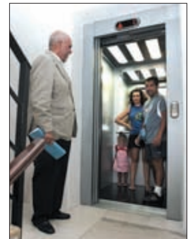
El ascensor, en cuarta posición

El portal y las puertas de garaje son los dos elementos de una comunidad de vecinos que registran más incidencias, con un 24 por ciento. Es la conclusión de la red social todosvecinos.com tras analizar 75.300 incidentes en viviendas. Del estudio, realizado entre diciembre de 2011 y abril de 2013, en casi 4.600 comunidades, se desprende que hay una reclamación cada dos días y medio. Tras la relacionadas con las puertas, el mayor número de incidencias se produce en las instalaciones eléctricas (16 por ciento), los ascensores (11 por ciento) y la fontanería. Los problemas relacionados con la gestión de la comunidad son la quinta reclamación más habitual. Supone el 8 por ciento del total de las demandas. Los pisos vacíos, la mala praxis y el impago de las cuotas y derramas engrosan la lista de las reclamaciones vecinales.