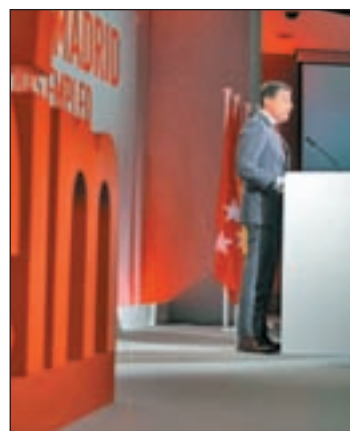
Ignacio González en CEIM