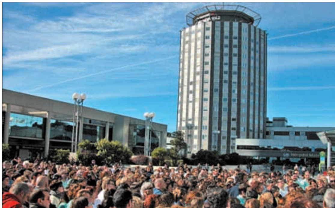
Marcha por la Sanidad Pública en el Hospital La Paz, en el distrito de Fuencarral.