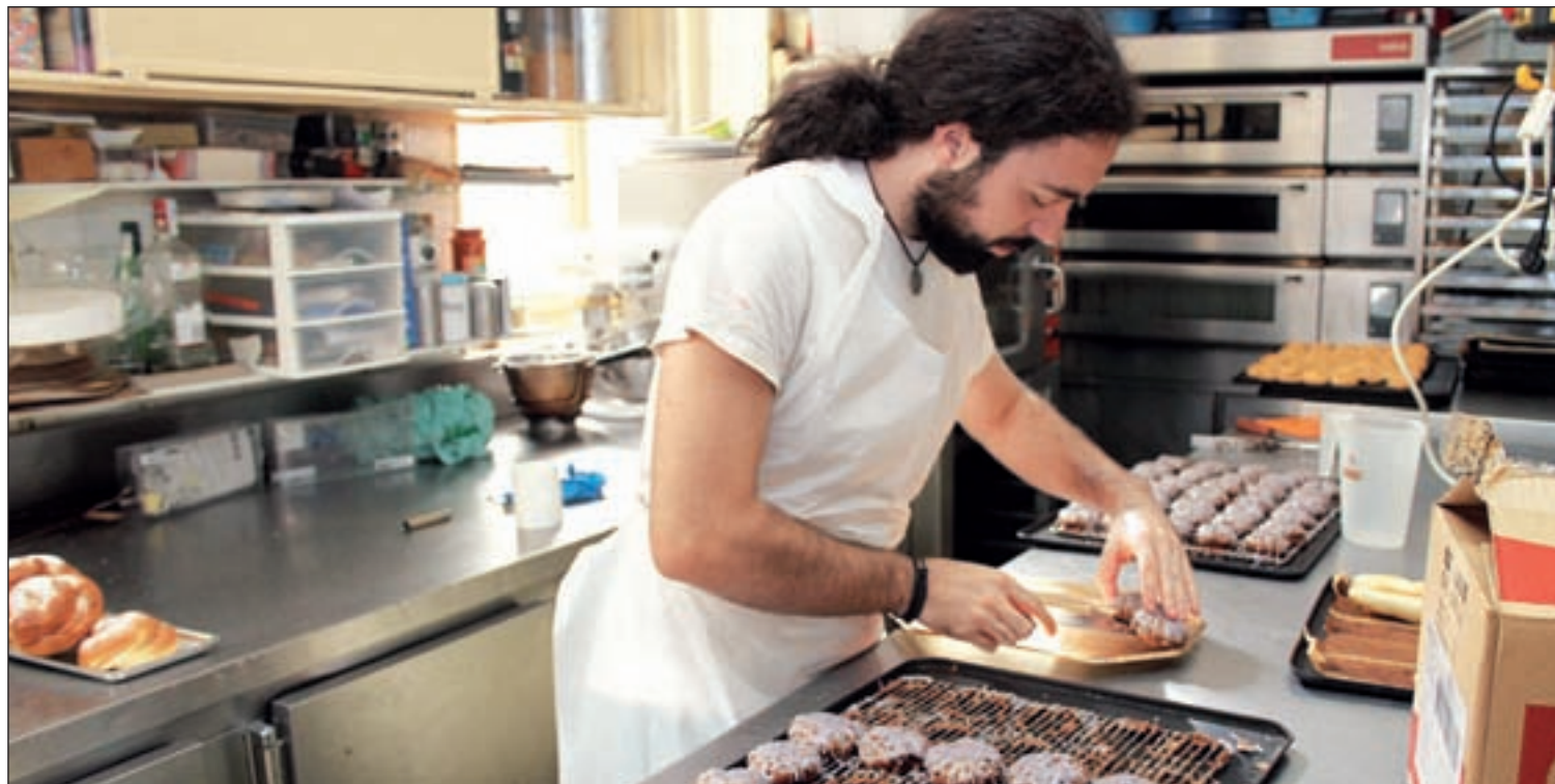
Rosquillas en honor a la Patrona, elaboradas en la pastelería Valle Olid